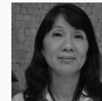
PAISAGISMO Beth Miyazaki