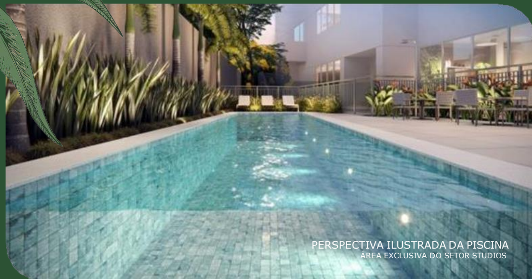
PERSPECTIVA ILUSTRADA DA PISCINA ÁREA EXCLUSIVA DO SETOR STUDIOS