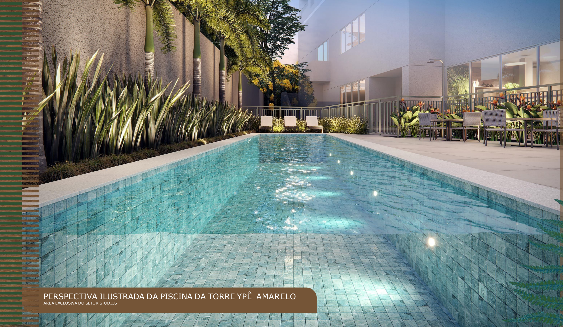
PERSPECTIVA ILUSTRADA DA PISCINA DA TORRE YPÊ AMARELO ÁREA EXCLUSIVA DO SETOR STUDIOS