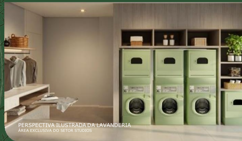
PERSPECTIVA ILUSTRADA DA LAVANDERIA ÁREA EXCLUSIVA DO SETOR STUDIOS