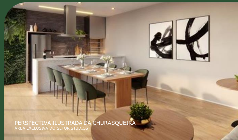
PERSPECTIVA ILUSTRADA DA CHURASQUEIRA ÁREA EXCLUSIVA DO SETOR STUDIOS