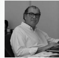
ARQUITETURA Jonas Birger