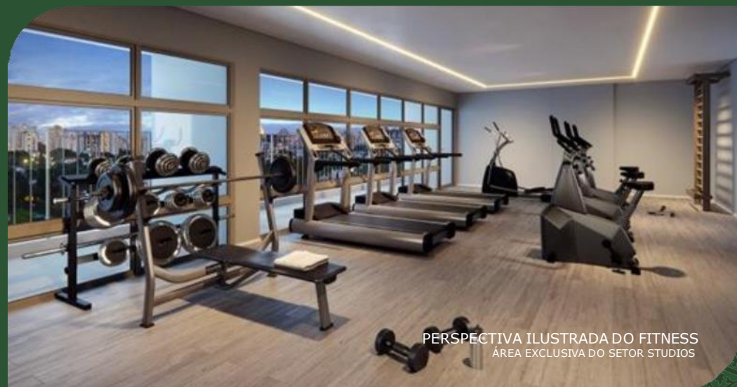
PERSPECTIVA ILUSTRADA DO FITNESS ÁREA EXCLUSIVA DO SETOR STUDIOS