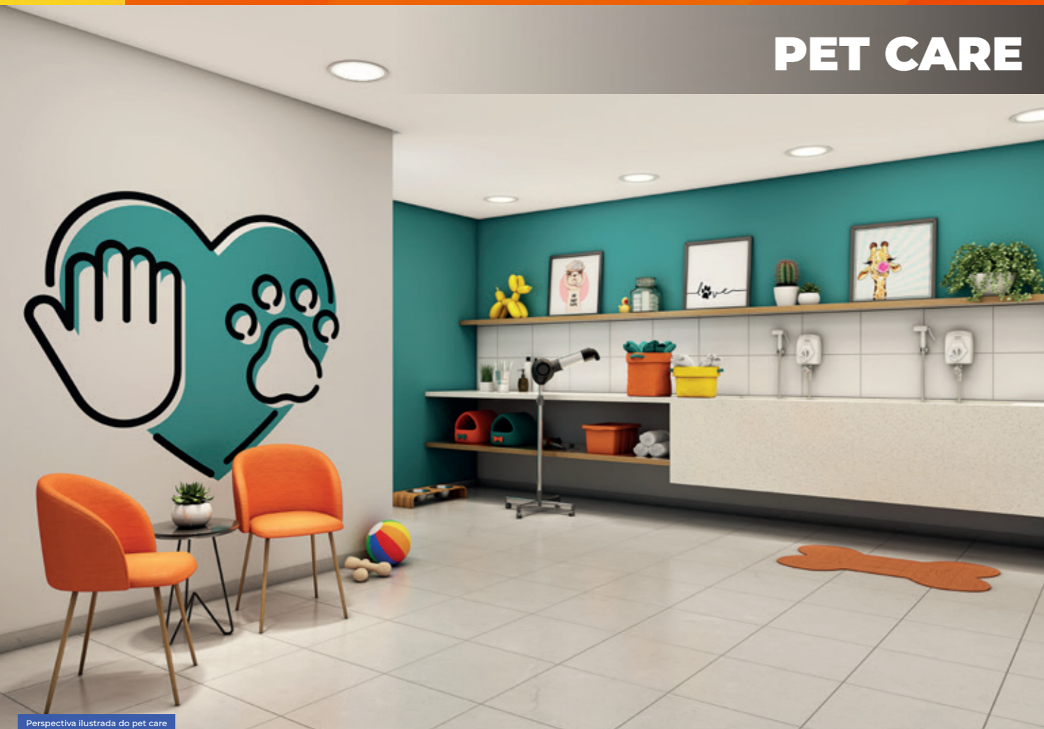
Perspectiva ilustrada do pet care