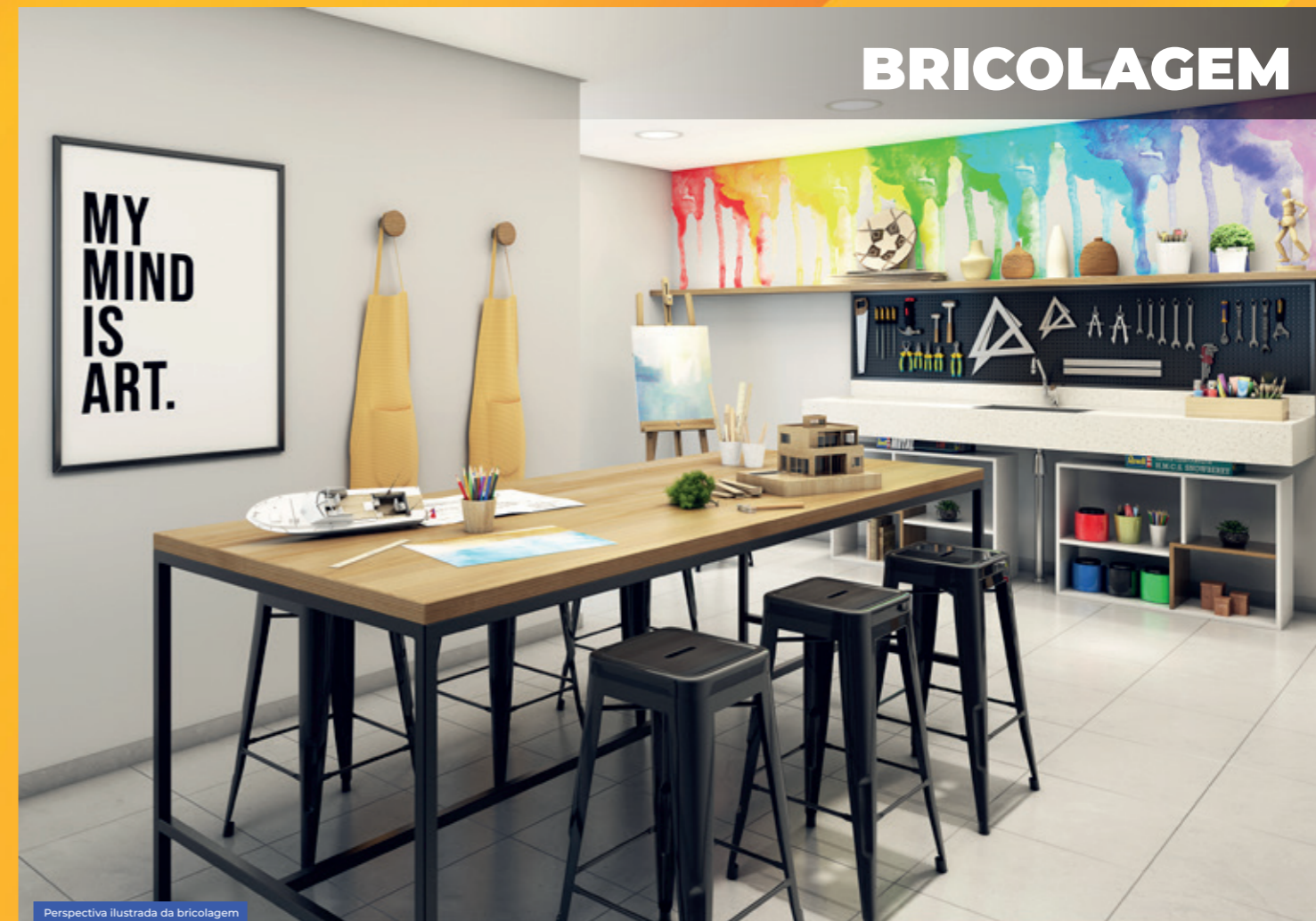
Perspectiva ilustrada da bricolagem