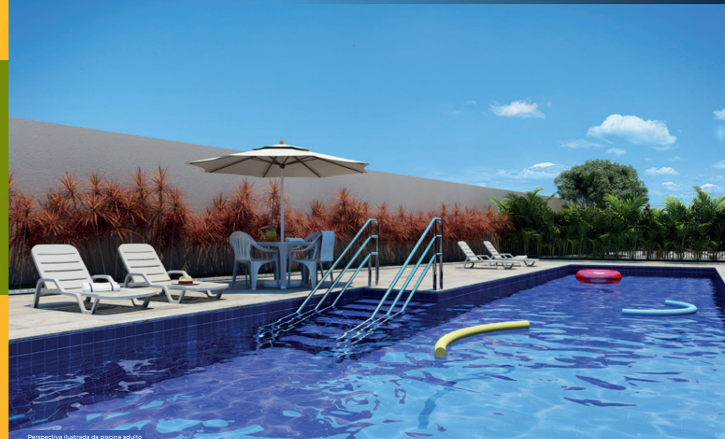
Perspectiva ilustrada da piscina adulto