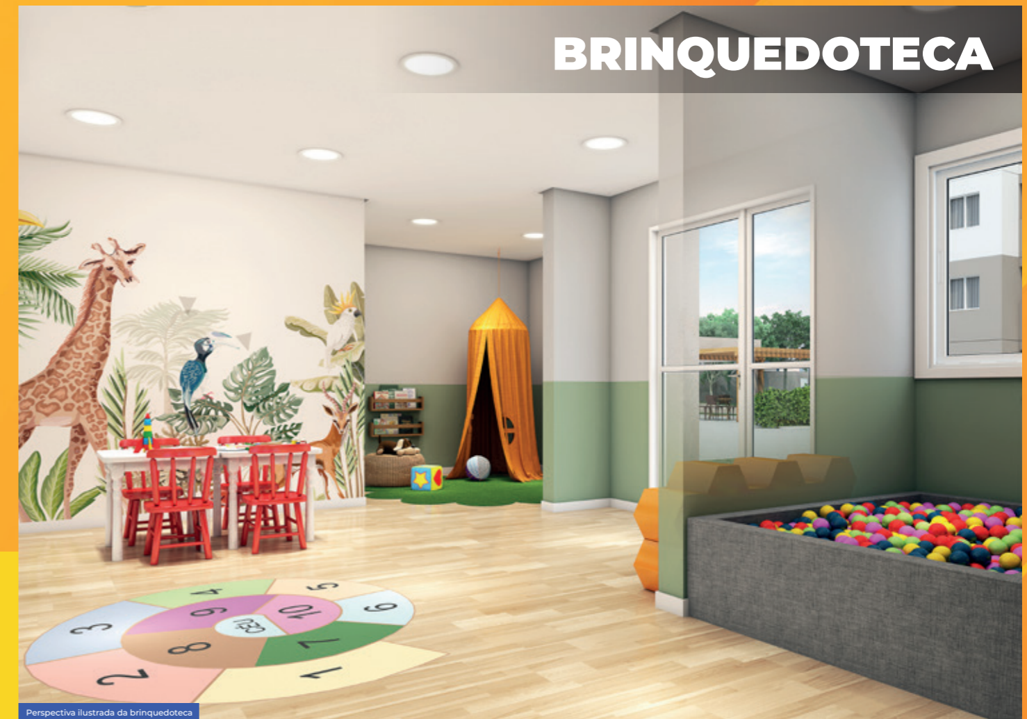
Perspectiva ilustrada da brinquedoteca