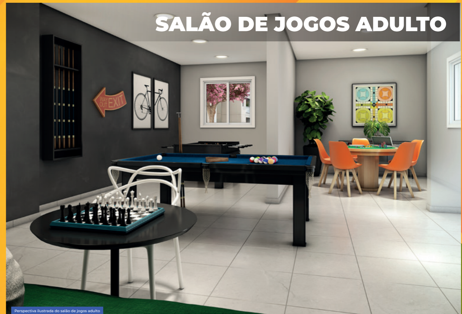
Perspectiva ilustrada do salão de jogos adulto