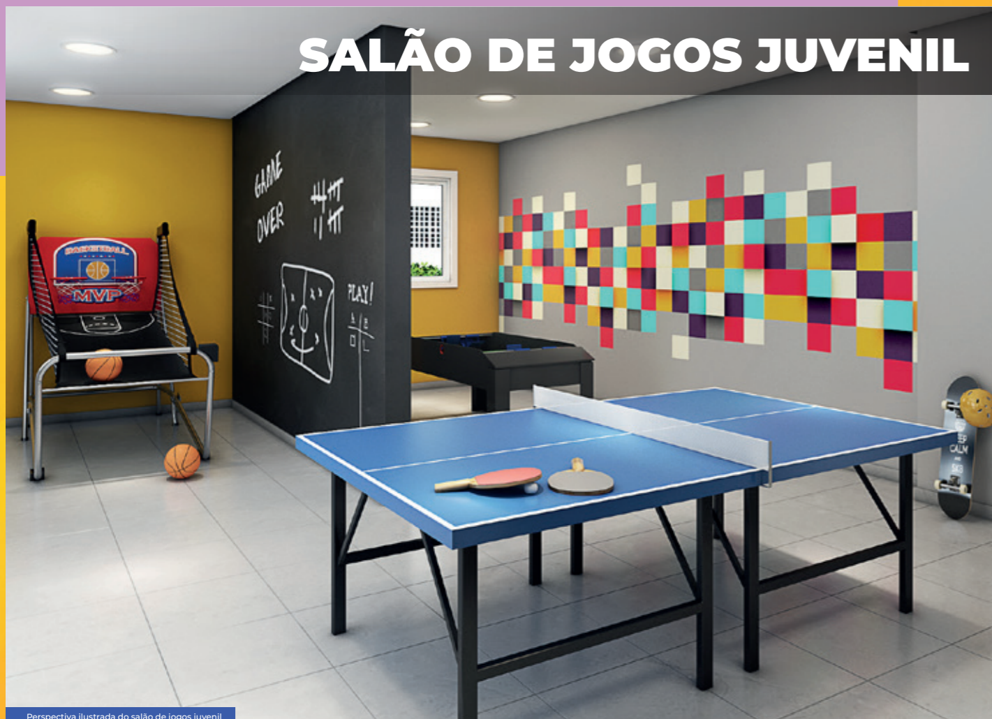
Perspectiva ilustrada do salão de jogos juvenil