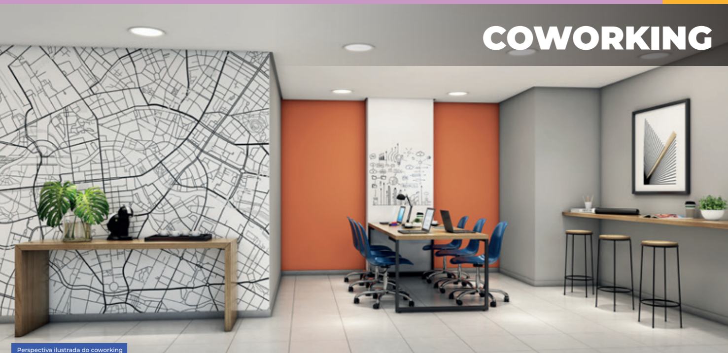
Perspectiva ilustrada do coworking