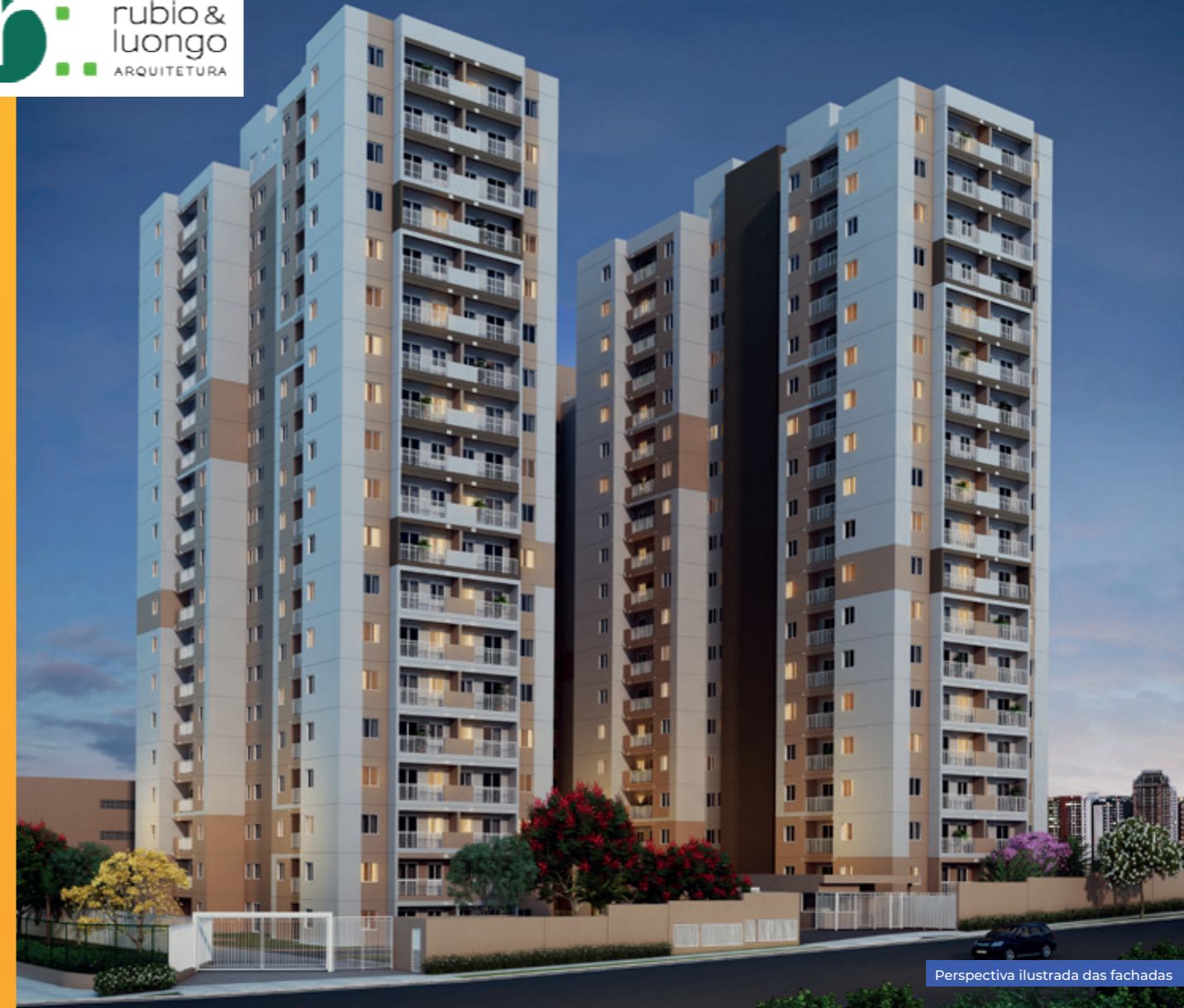
Perspectiva ilustrada das fachadas