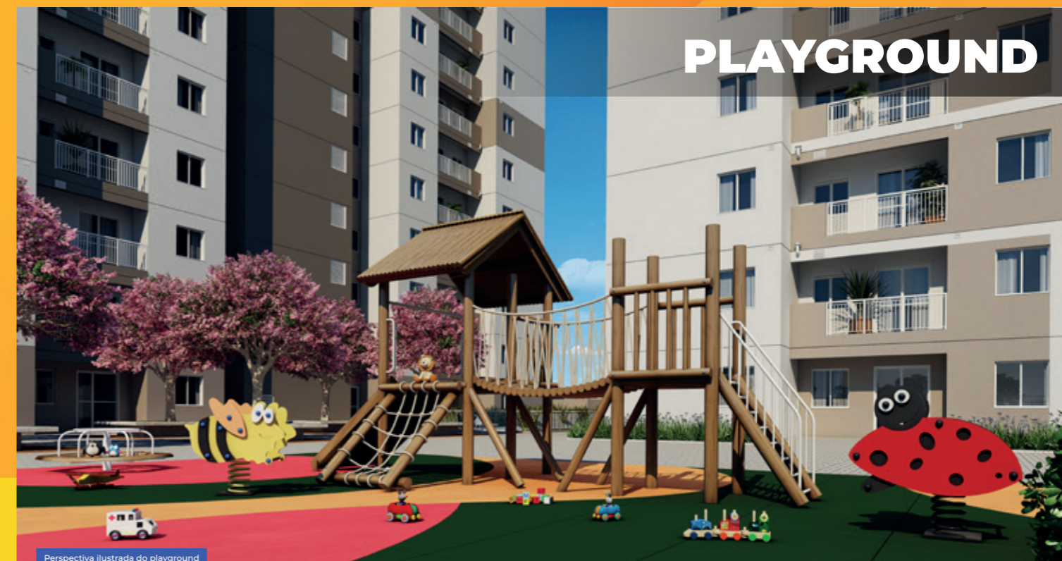
Perspectiva ilustrada do playground