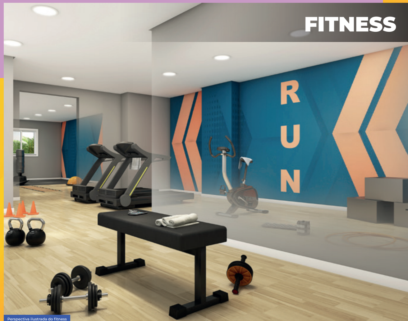
Perspectiva ilustrada do fitness