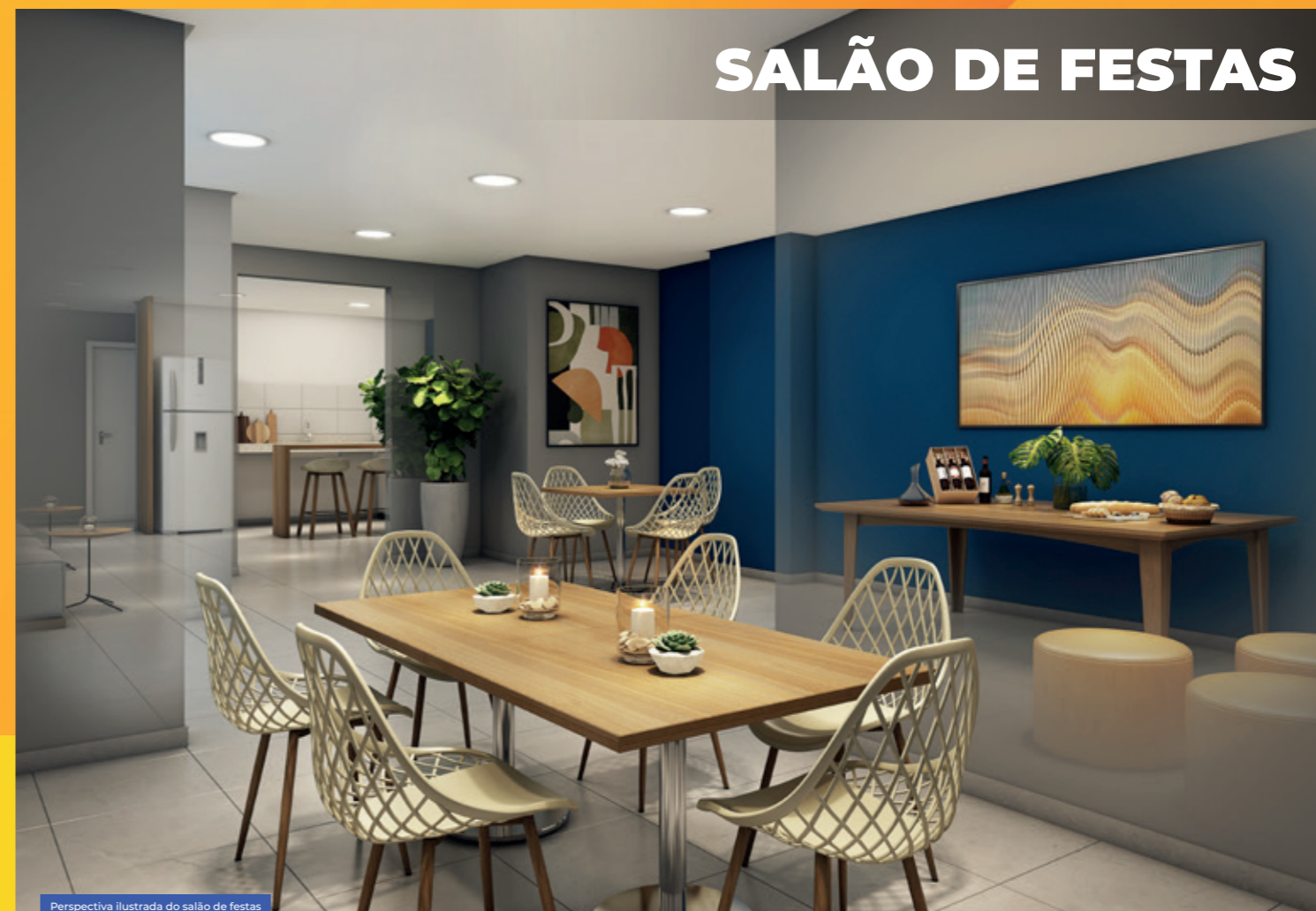
Perspectiva ilustrada do salão de festas