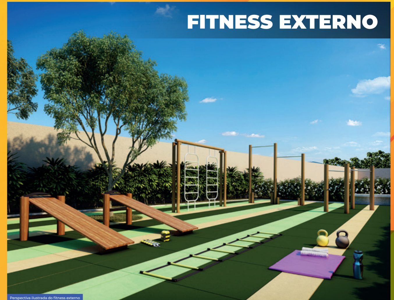
Perspectiva ilustrada do fitness externo