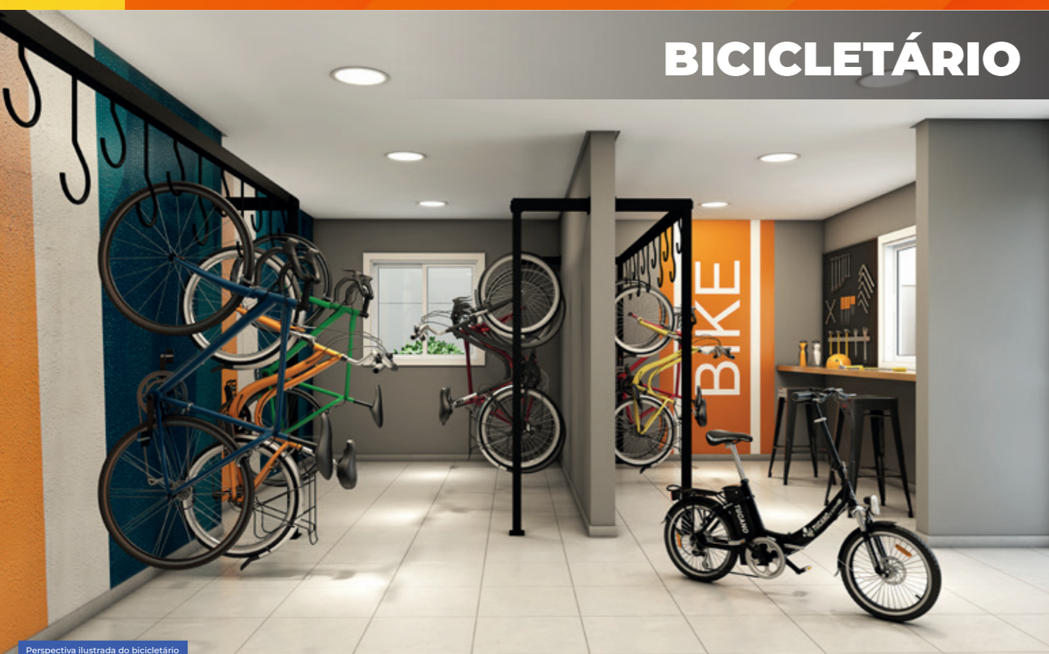
Perspectiva ilustrada do bicicletário