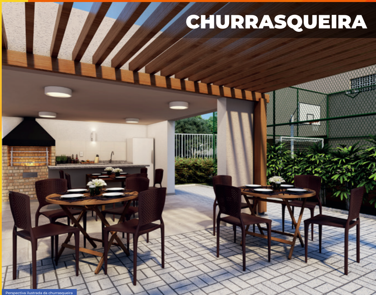
Perspectiva ilustrada da churrasqueira