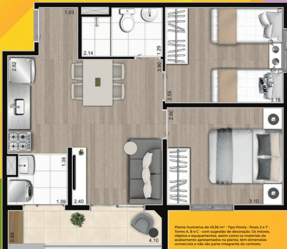
Planta Ilustrativa de 45,56 m 2 - Tipo Ponta - finais 2 e 7 - Torres A, B e C - com sugestão de decoração. Os móveis, objetos e equipamentos, assim como os materiais de acabamento apresentados na planta, têm dimensões comerciais e não são parte integrante do contrato.