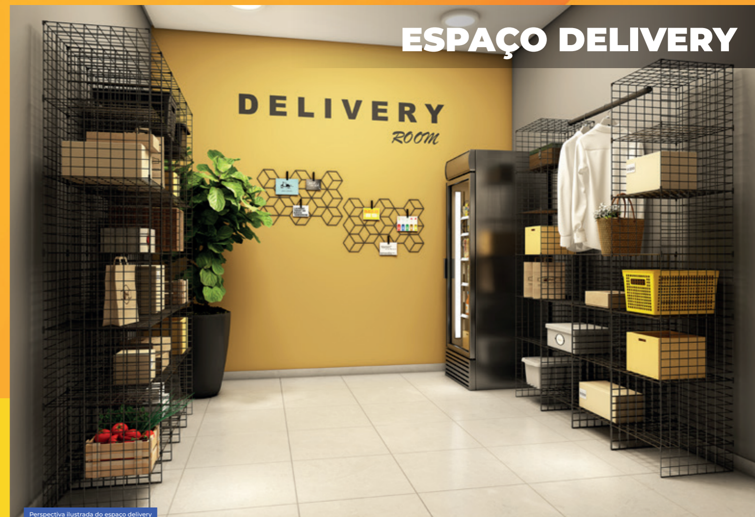
Perspectiva ilustrada do espaço delivery