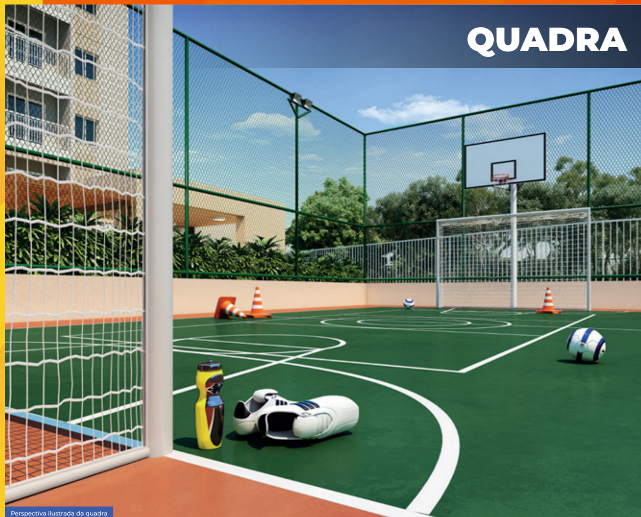
Perspectiva ilustrada da quadra