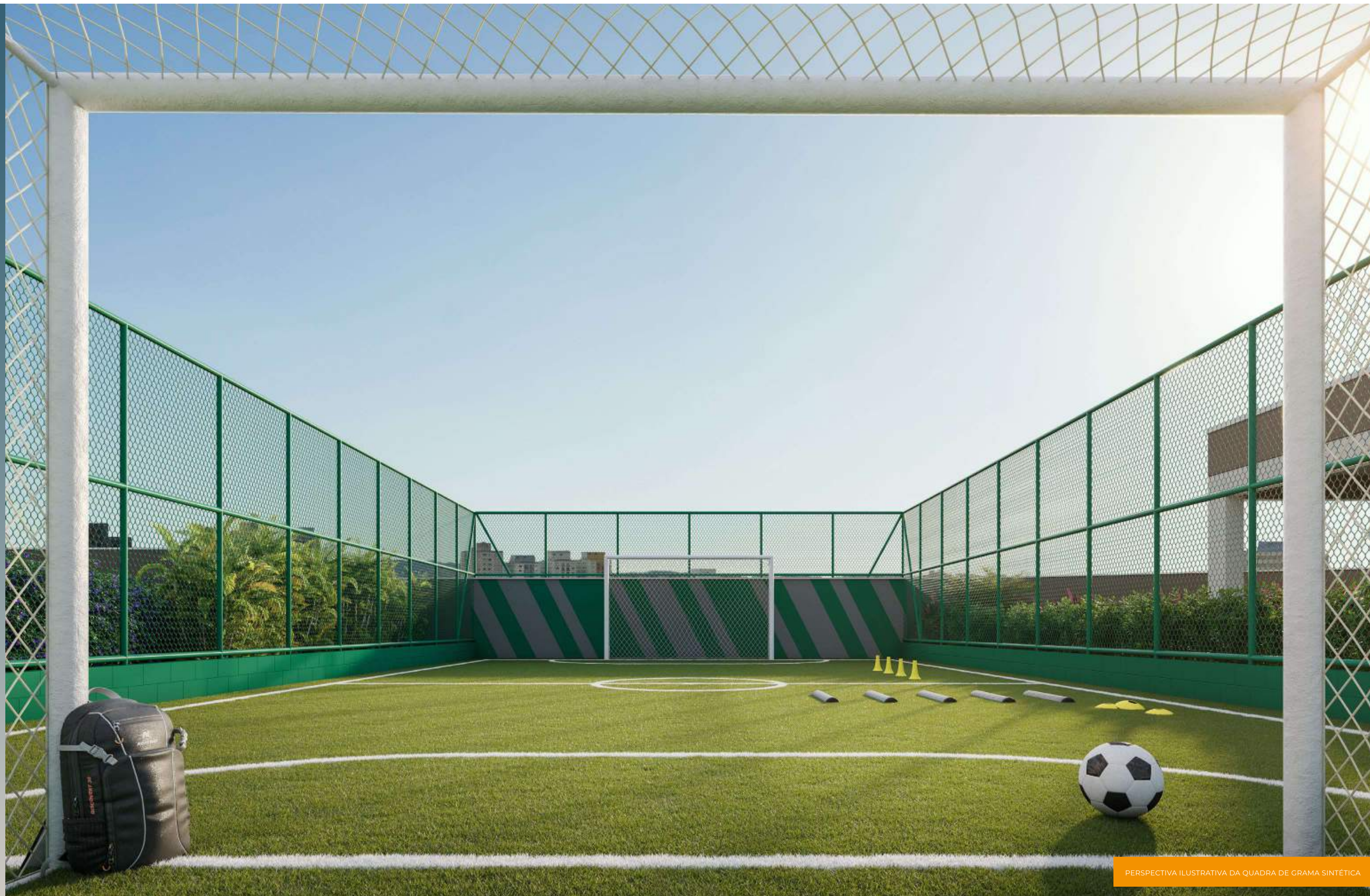
PERSPECTIVA ILUSTRATIVA DA QUADRA DE GRAMA SINTÉTICA