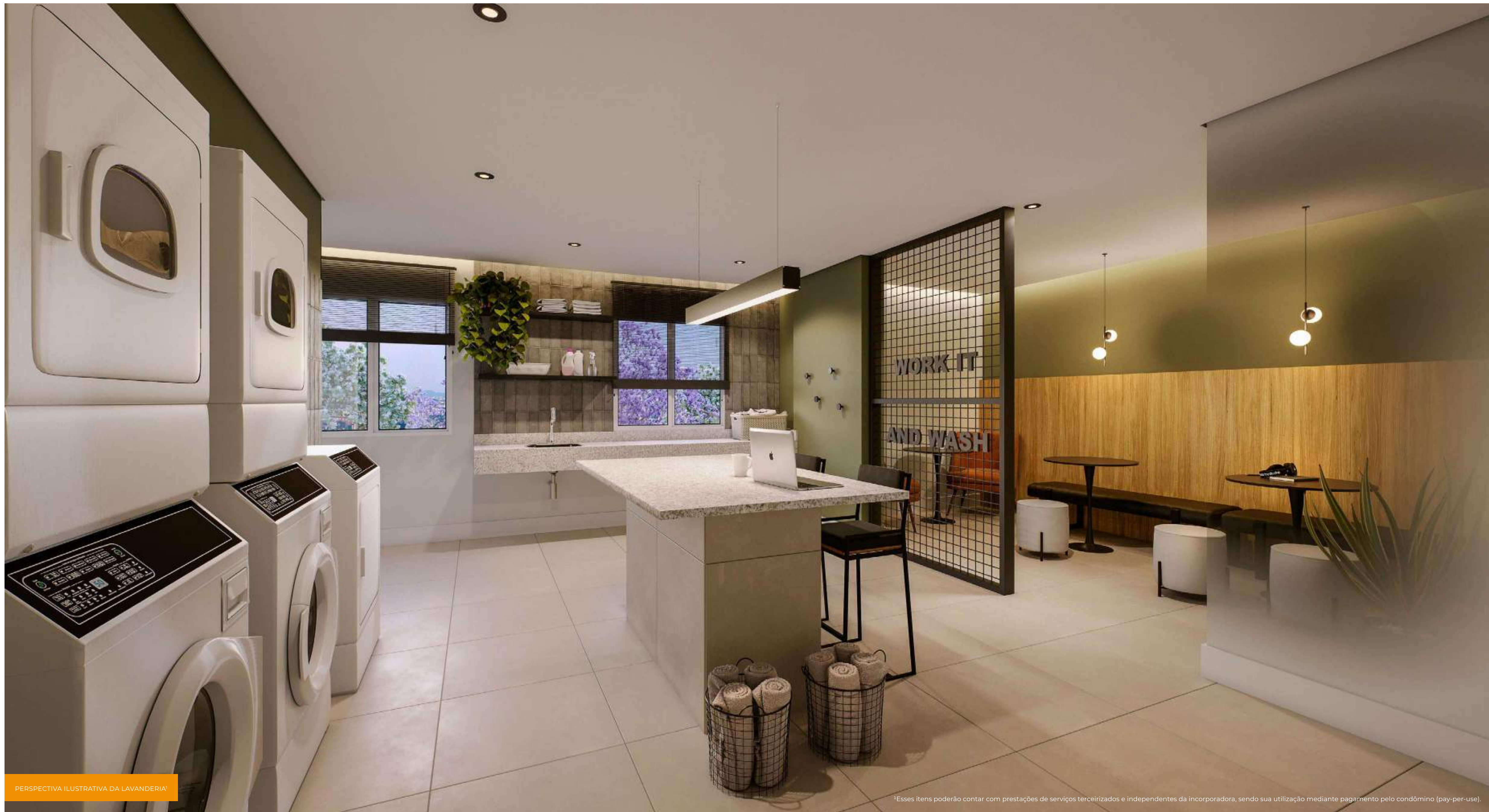
PERSPECTIVA ILUSTRATIVA DA LAVANDERIA*