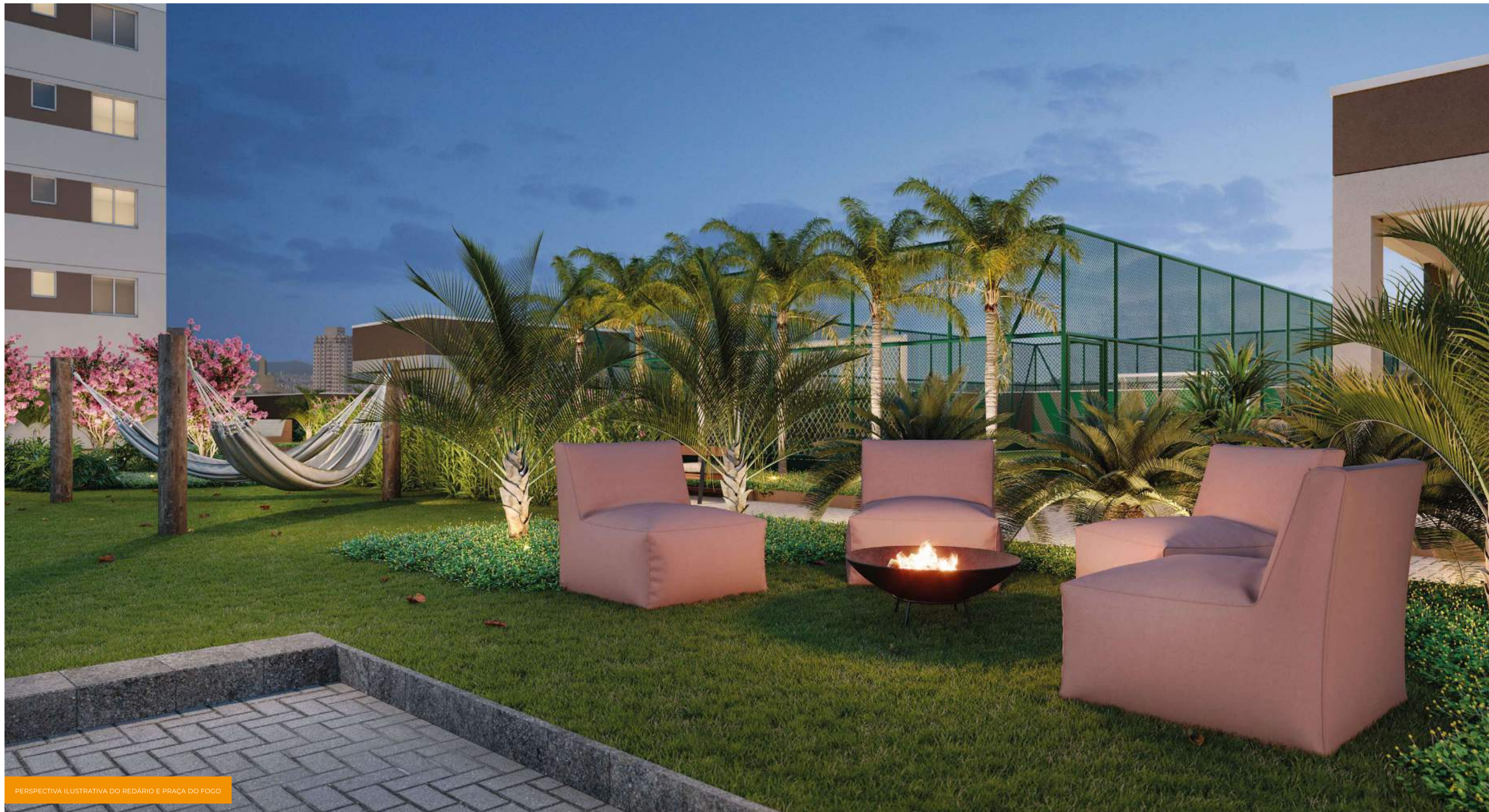
PERSPECTIVA ILUSTRATIVA DO REDÁRIO E PRAÇA DO FOGO