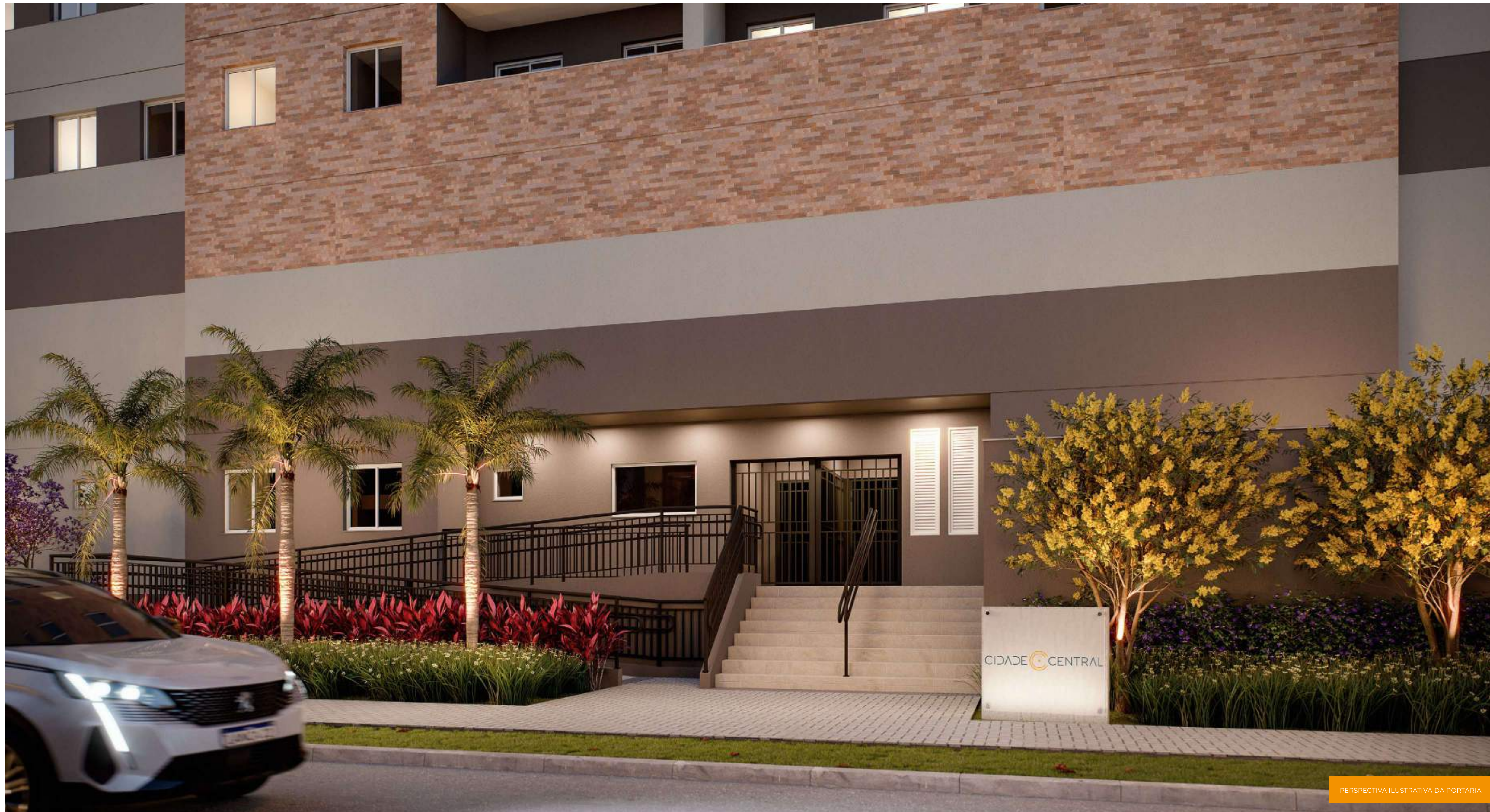
PERSPECTIVA ILUSTRATIVA DA PORTARIA