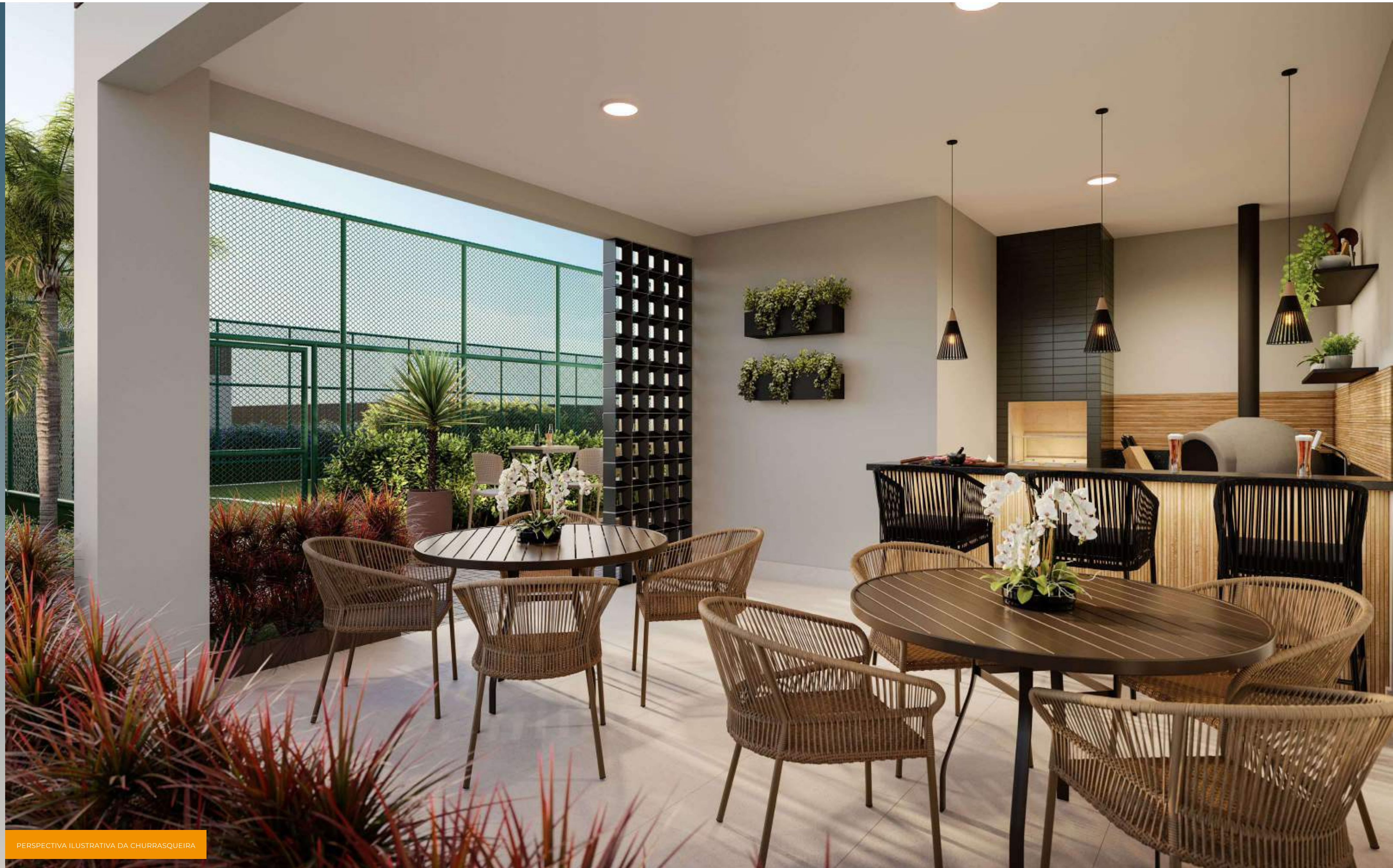
PERSPECTIVA ILUSTRATIVA DA CHURRASQUEIRA