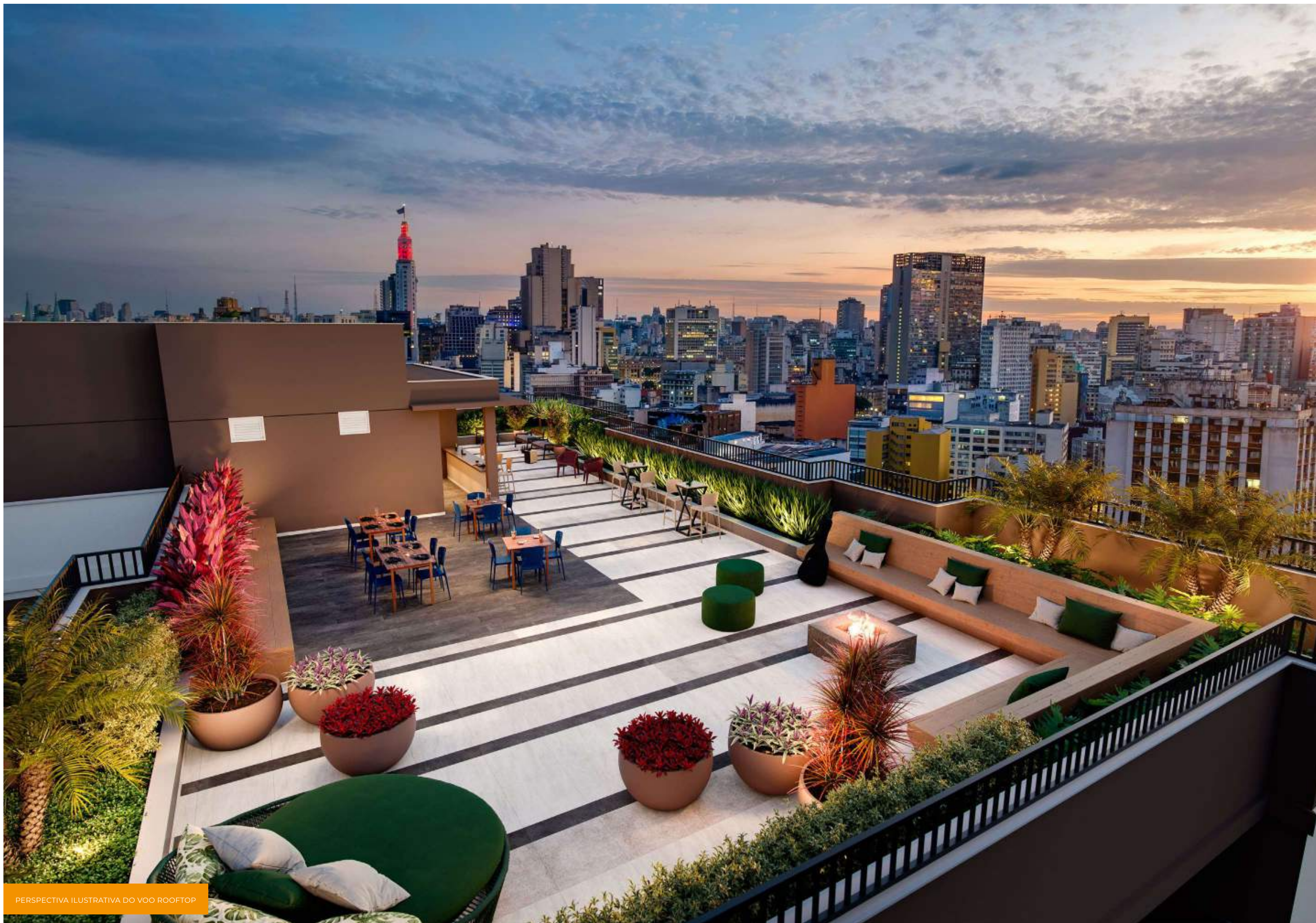
PERSPECTIVA ILUSTRATIVA DO VOO ROOFTOP

UMA VISTA CERCADA POR HISTÓRIA E MODERNIDADE