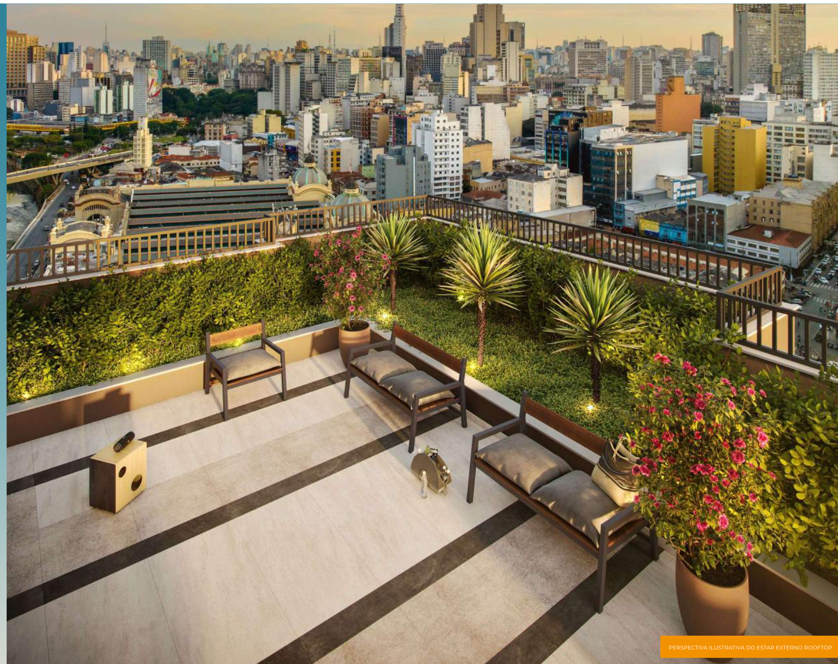
PERSPECTIVA ILUSTRATIVA DO ESTAR EXTERNO ROOFTOP