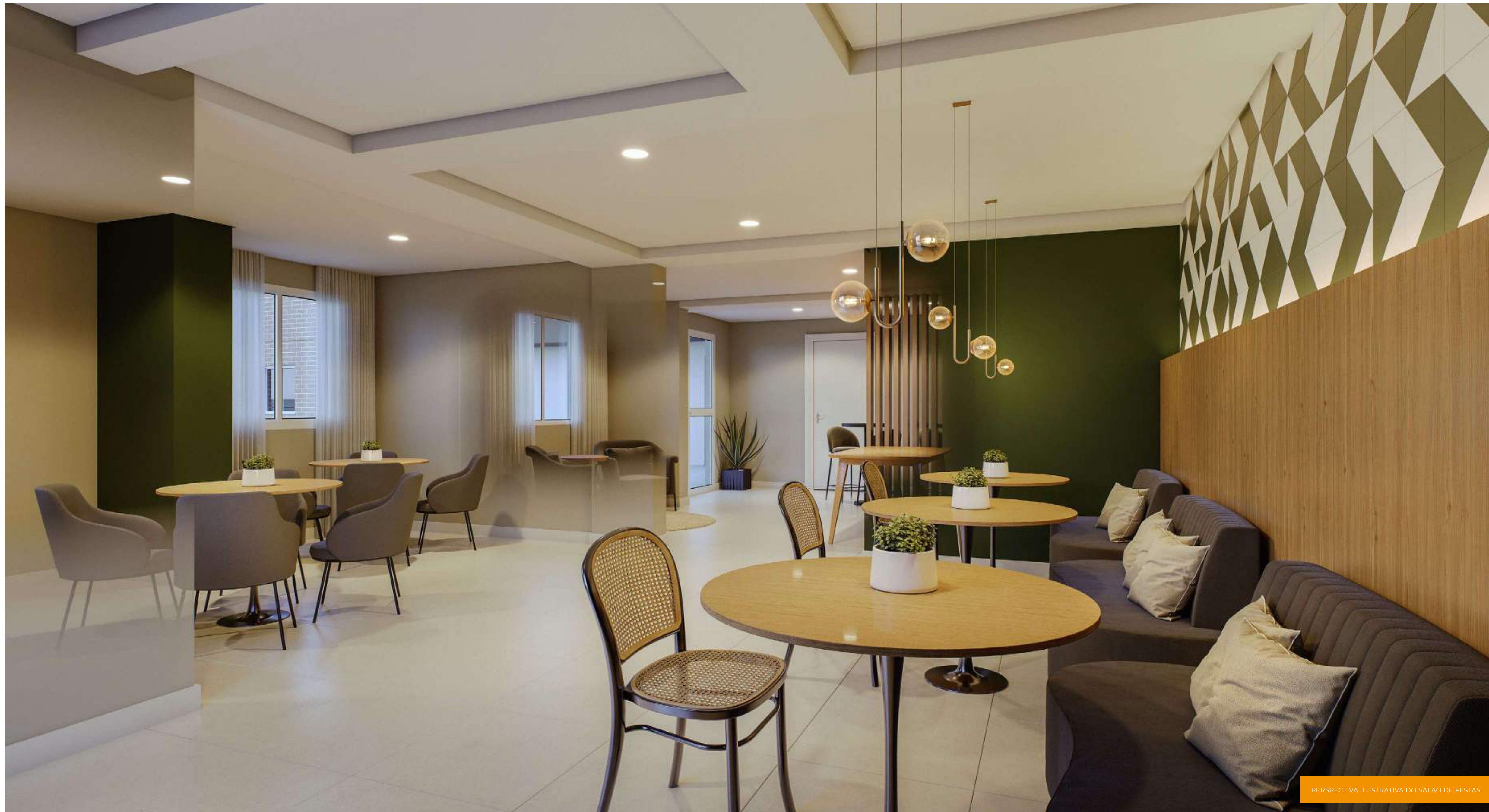
PERSPECTIVA ILUSTRATIVA DO SALÃO DE FESTAS