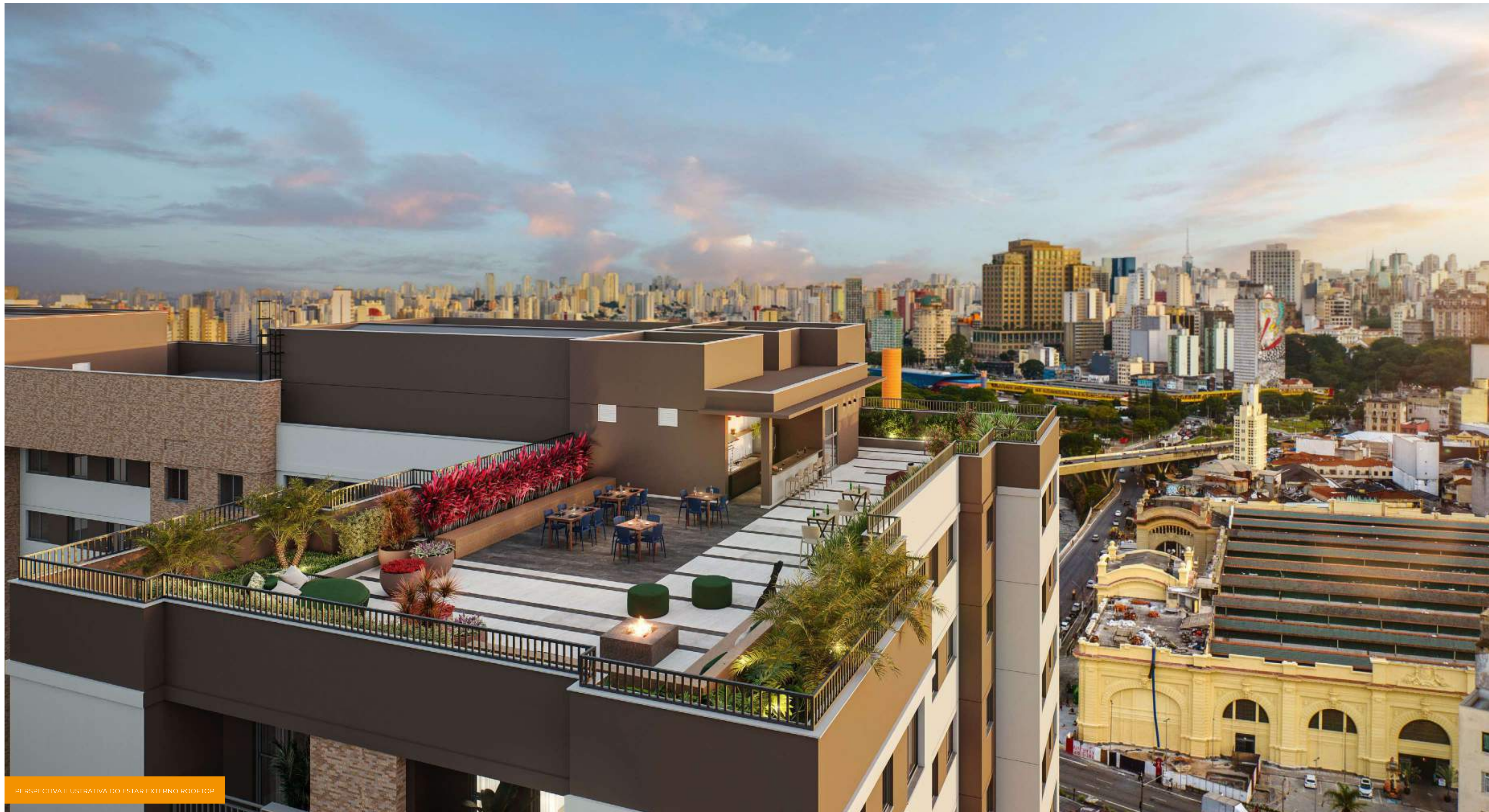
PERSPECTIVA ILUSTRATIVA DO ESTAR EXTERNO ROOFTOP