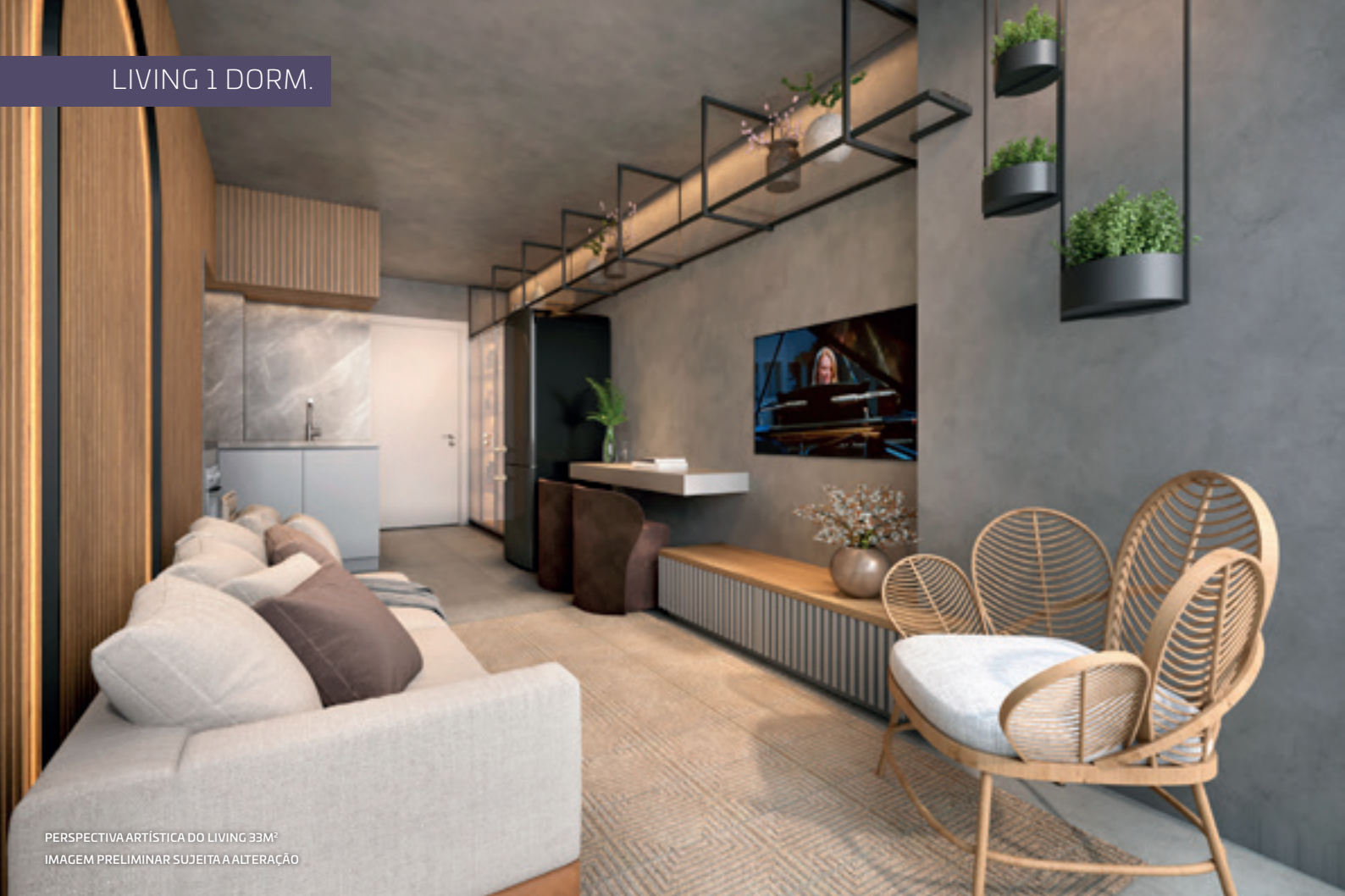
PERSPECTIVA ARTÍSTICA DO LIVING 33M 2 IMAGEM PRELIMINAR SUJEITA A ALTERAÇÃO