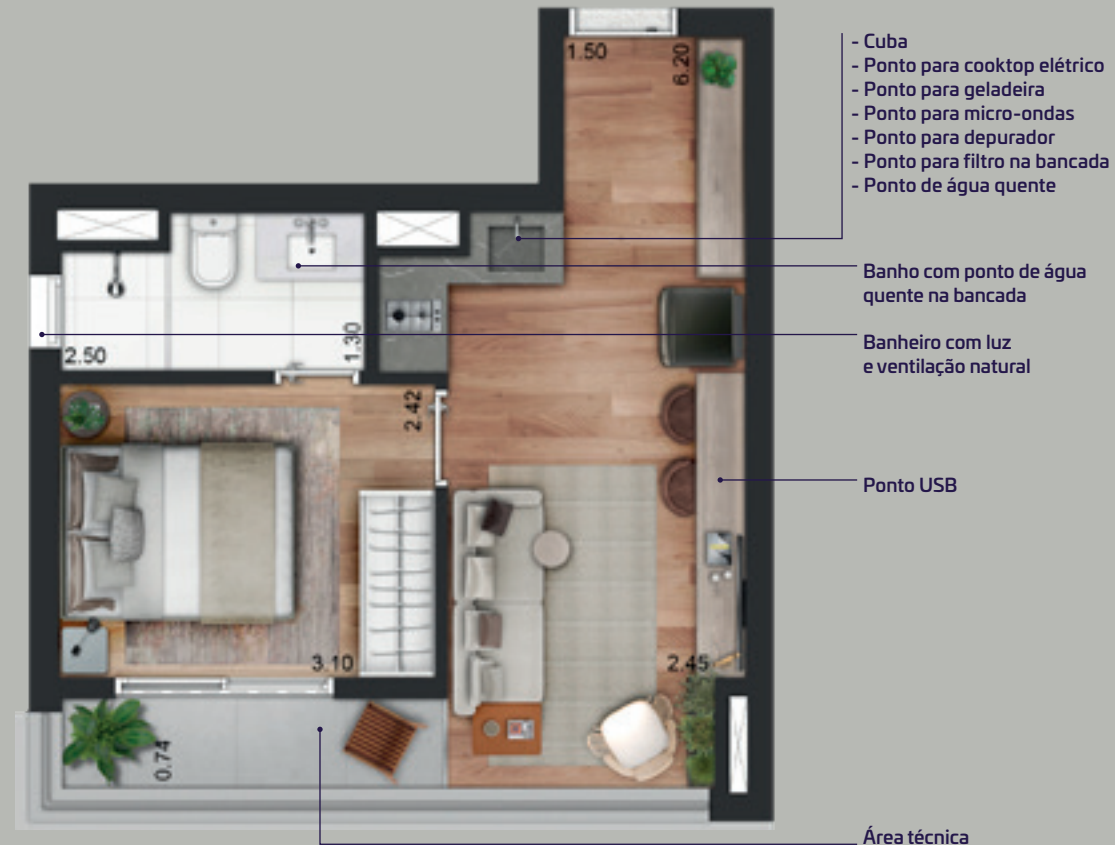
ILUSTRAÇÃO ARTÍSTICA DA PLANTA 1 DORM. IMAGEM PRELIMINAR SUJEITA A ALTERAÇÃO

Os móveis, equipamentos e utensílios utilizados nas perspectivas ilustradas são meras sugestões de decoração e não fazem parte do Contrato de Compra e Venda. Essas áreas serão entregues conforme Memorial Descritivo de Acabamentos e Plantas anexas ao contrato. O apartamento poderá sofrer pequenos ajustes decorrentes do desenvolvimento dos projetos executivos de estrutura, arquitetura e instalações. As medidas dos ambientes são de face a face das paredes com revestimentos.