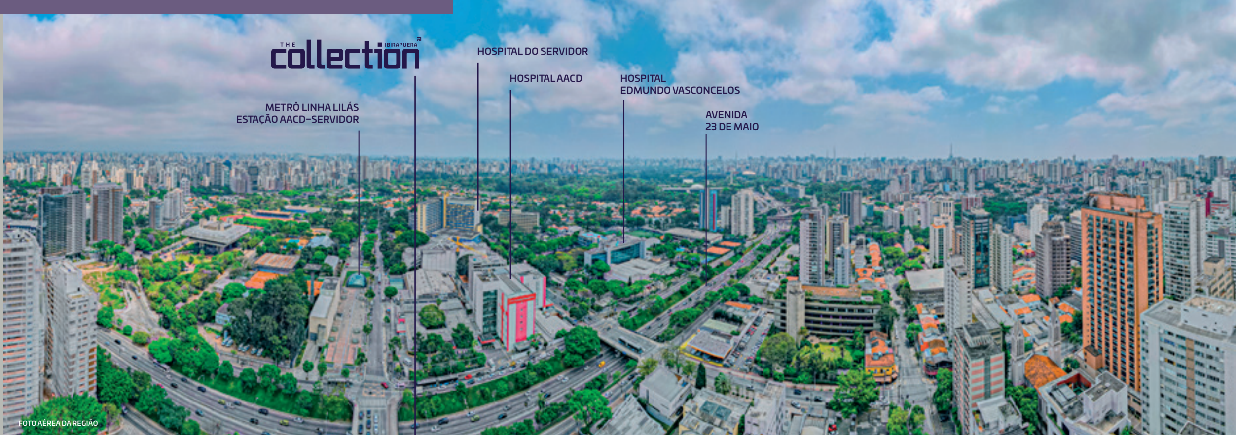
FOTO AÉREA DA REGIÃO

ACESSO FÁCIL ÀS PRINCIPAIS VIAS DE ACESSO