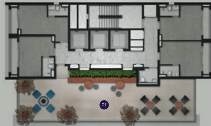
PERSPECTIVA ARTÍSTICA DA COBERTURA IMAGEM PRELIMINAR SUJEITA A ALTERAÇÃO