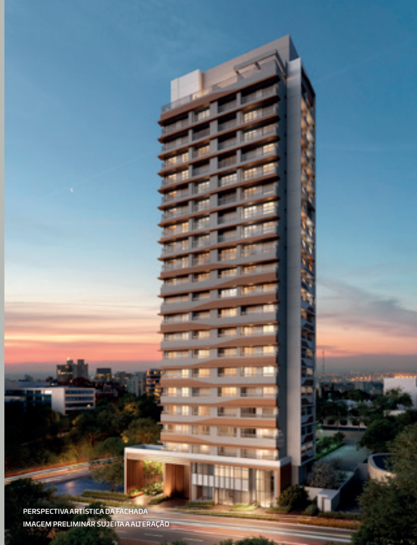
PERSPECTIVA ARTÍSTICA DA FACHADA IMAGEM PRELIMINAR SUJEITA A ALTERAÇÃO