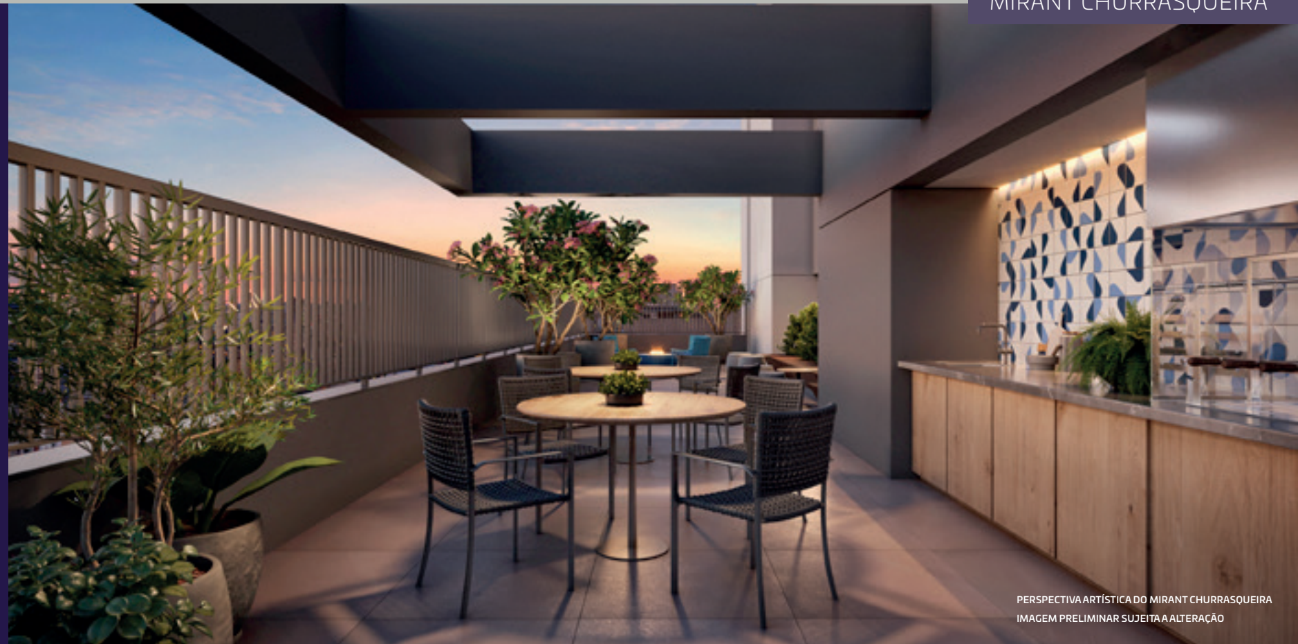
PERSPECTIVA ARTÍSTICA DO MIRANT CHURRASQUEIRA IMAGEM PRELIMINAR SUJEITA A ALTERAÇÃO