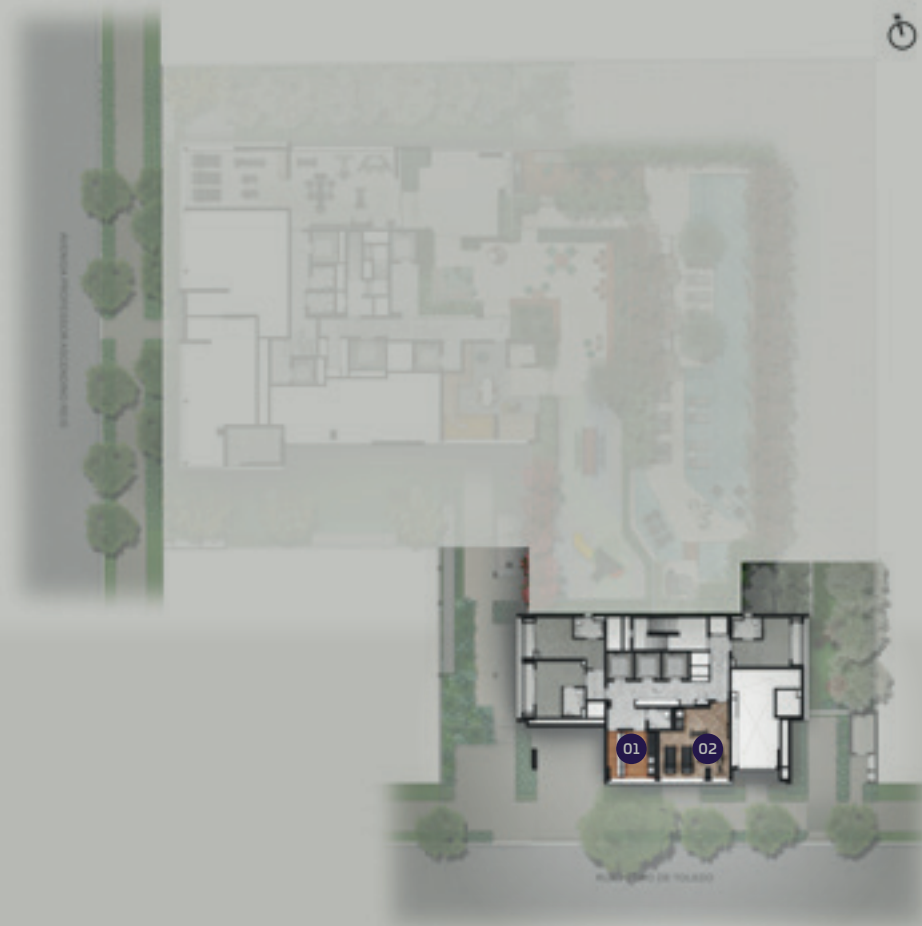
PERSPECTIVA ARTÍSTICA DO 1º PAVIMENTO IMAGEM PRELIMINAR SUJEITA A ALTERAÇÃO