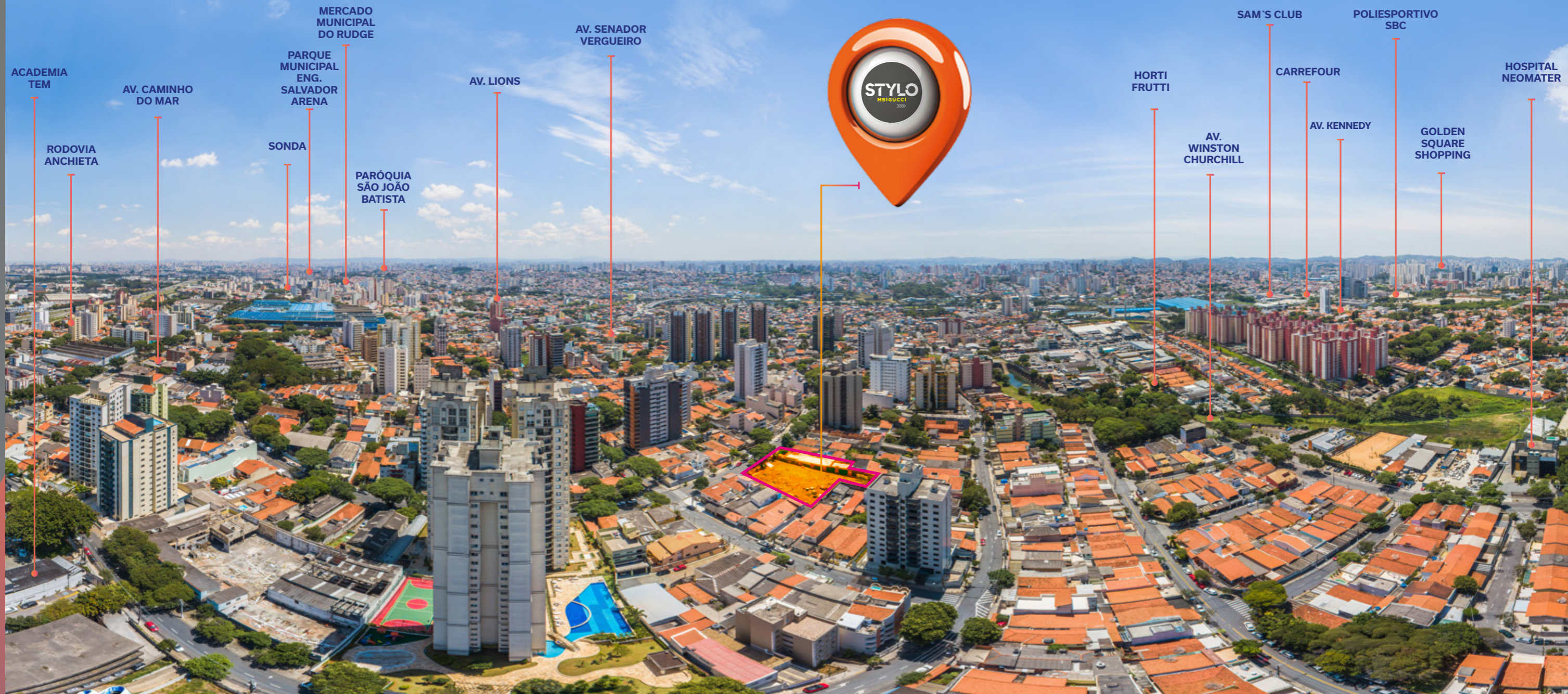
Foto aérea da região