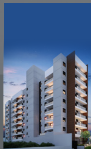
Vert MBigucci Aclimação - SP