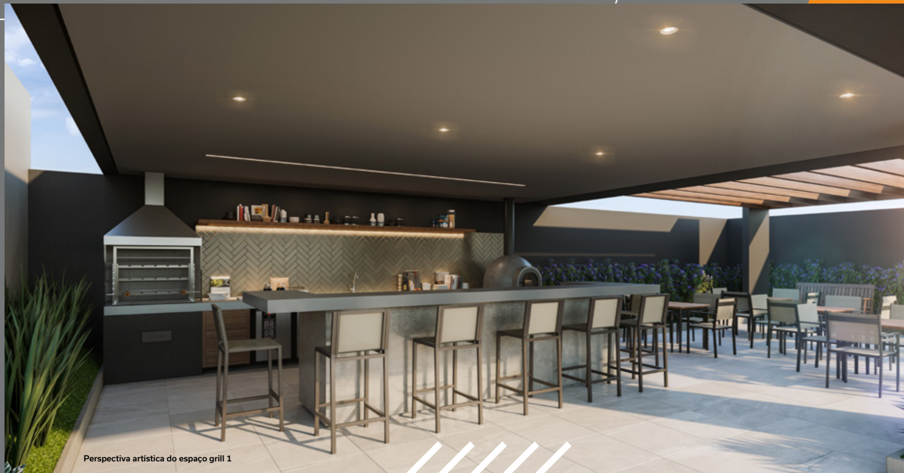
Perspectiva artística do espaço grill 1