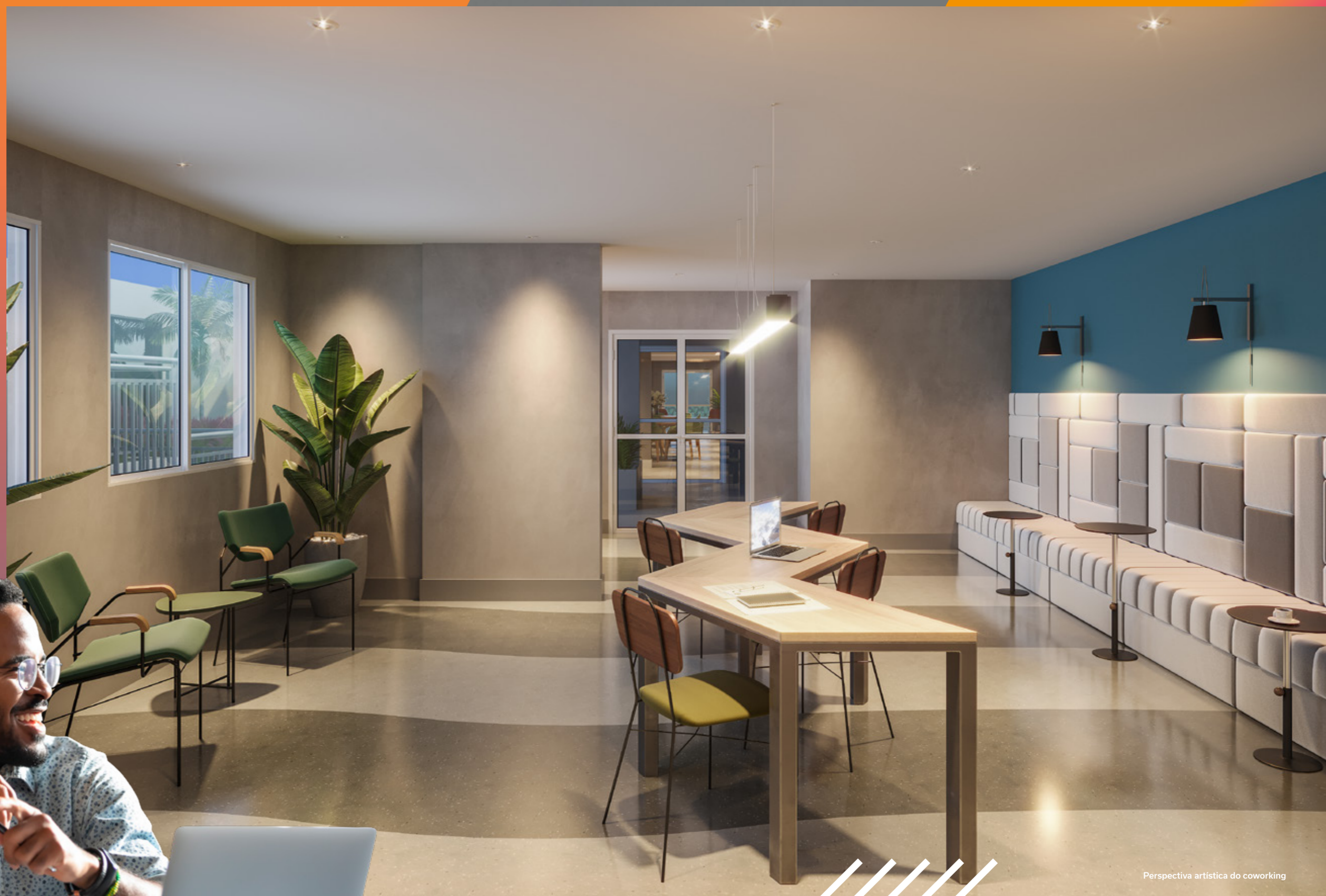
Perspectiva artística do coworking

Seu novo ponto de trabalho, equipado com ar-condicionado, tomadas USB e ponto para WI-FI. Tudo o que você precisa para progredir nos negócios.