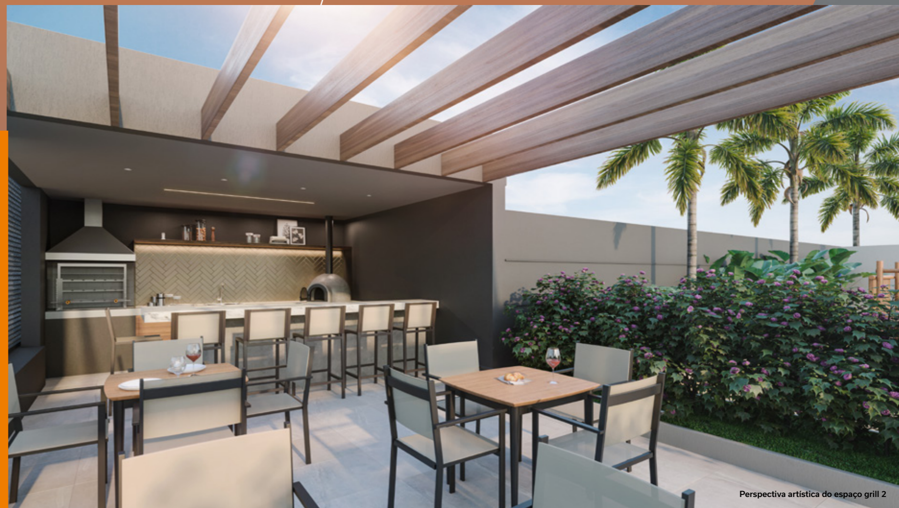
Perspectiva artística do espaço grill 2

O STYLO MBI GUCCI conta com 2 espaços grill, com forno de pizza, para seu churrasco ser completo. Para uma reunião mais íntima ou para comemorar com os amigos, nada melhor do que dois ambientes que proporcionam interação e facilidade, além de sofisticação e diversão.