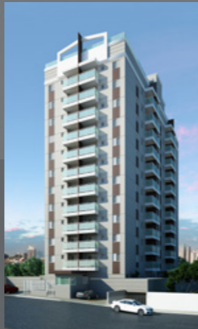
Unique MBigucci Rudge Ramos - SBC