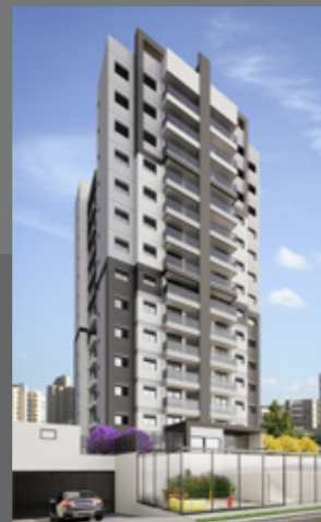
Alameda MBigucci Campestre - SA