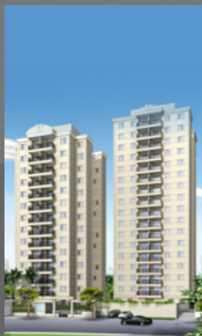
Essenza MBigucci Vila Gonçalves - SBC