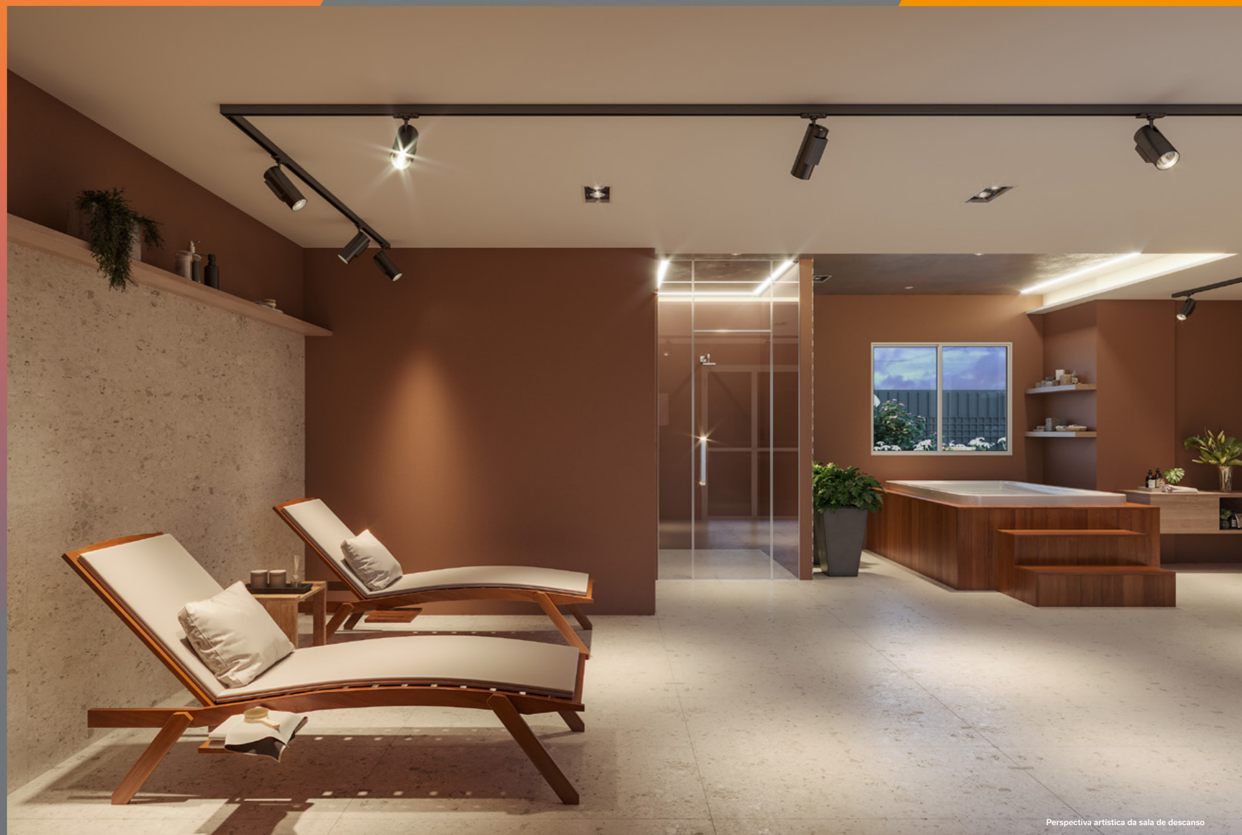
Perspectiva artística da sala de descanso