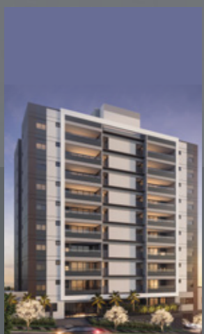
Imperium MBigucci Ipiranga - SP