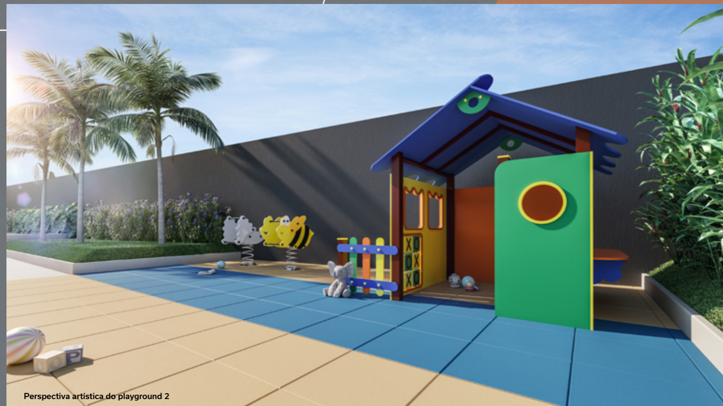
Perspectiva artística do playground 2