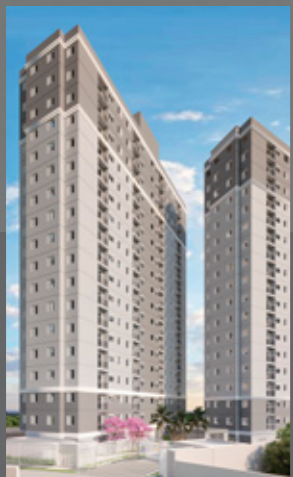
Easy São Vicente MBigucci Centro - SV

Competência empresarial, respeito ao cliente e mais de 1 milhão 225 mil m 2 área construída.