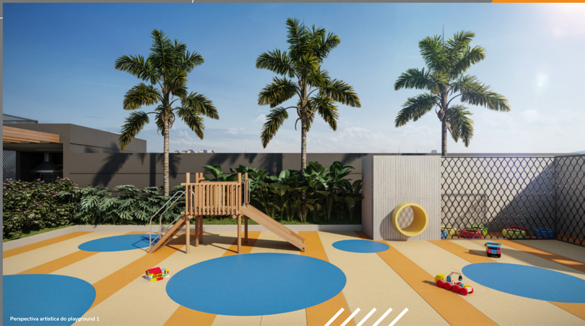
Perspectiva artística do playground 1