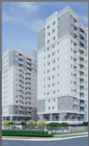
Beethoven MBigucci Santa Terezinha - SA