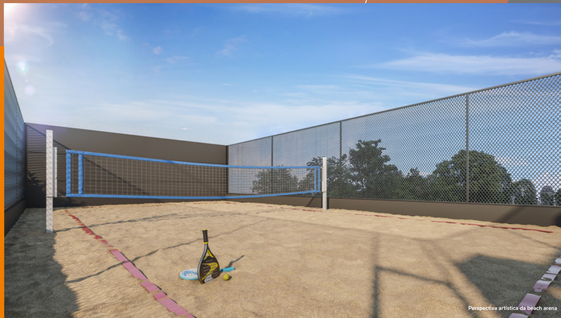
Perspectiva artística da beach arena

Todo tipo de lazer, à distância de um elevador. O Stylo MBigucci tem espaços completos para todas as fases. Aqui a diversão é garantida.