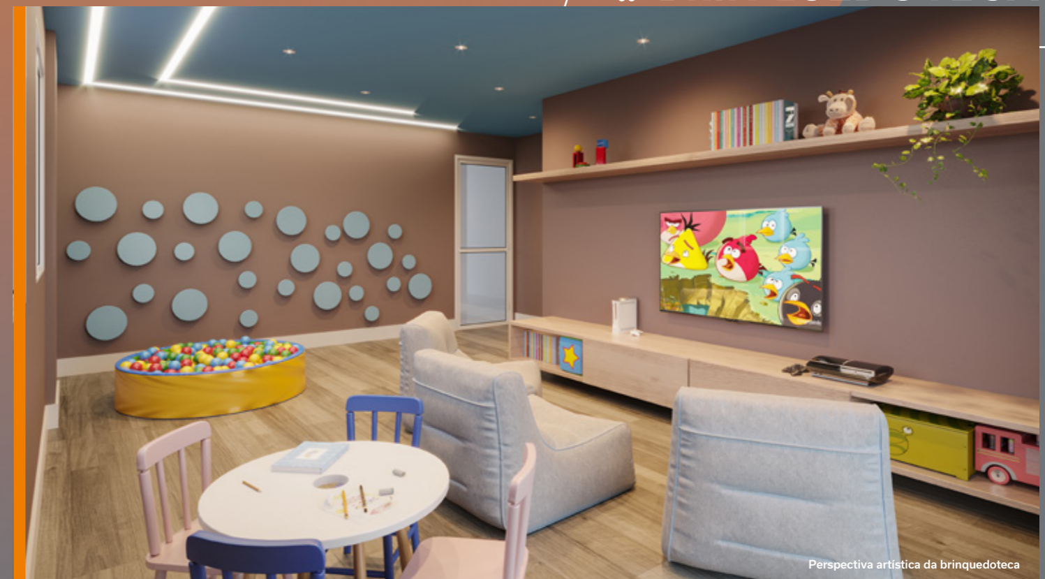
Perspectiva artística da brinquedoteca