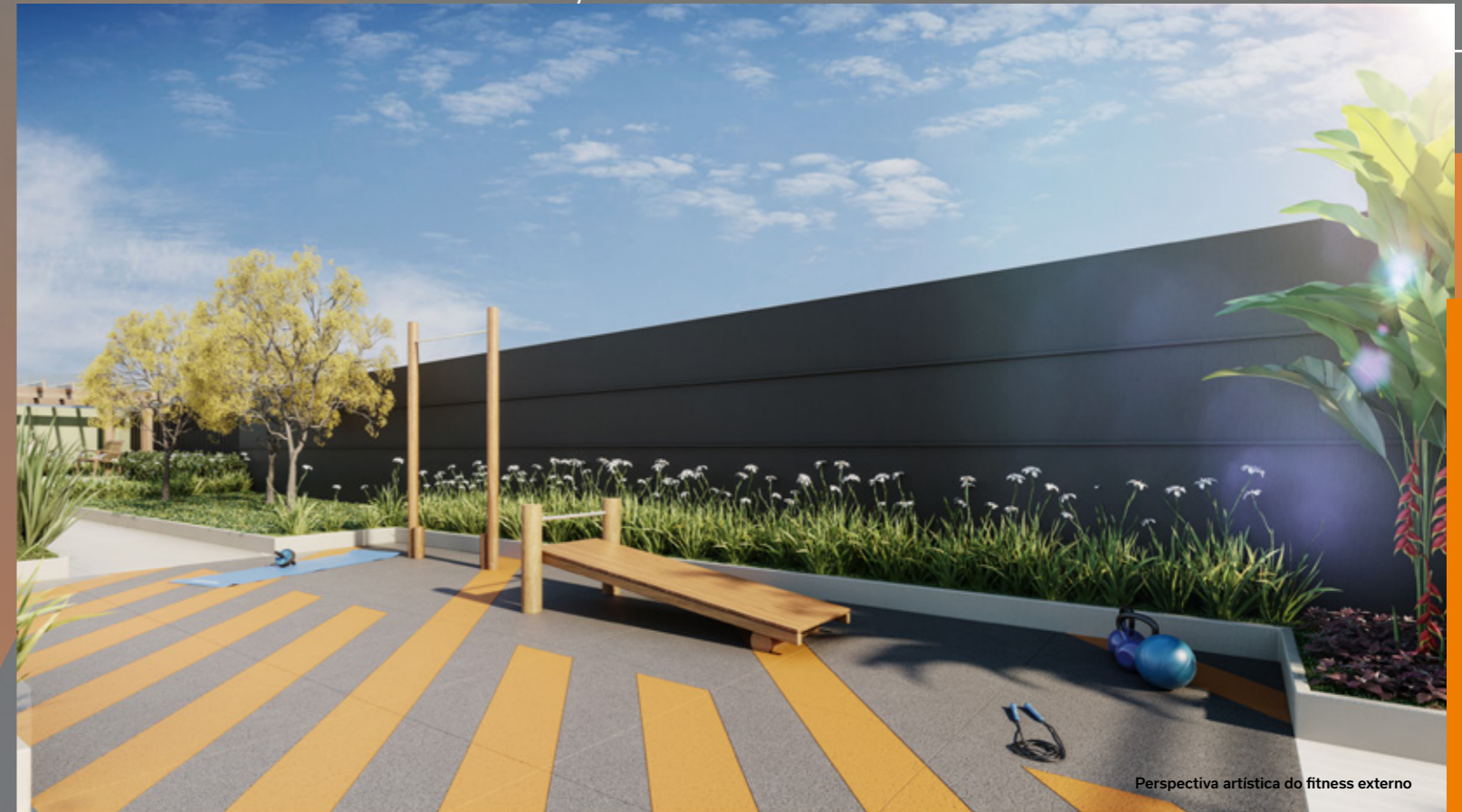
Perspectiva artística do fitness externo