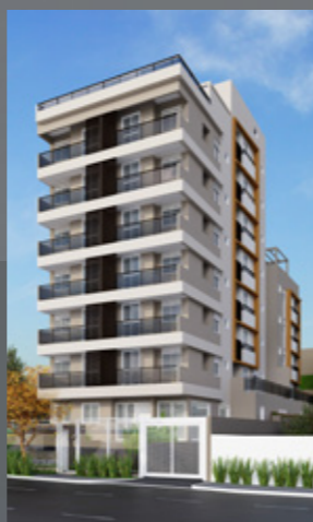
New Park MBigucci Aclimação - SP