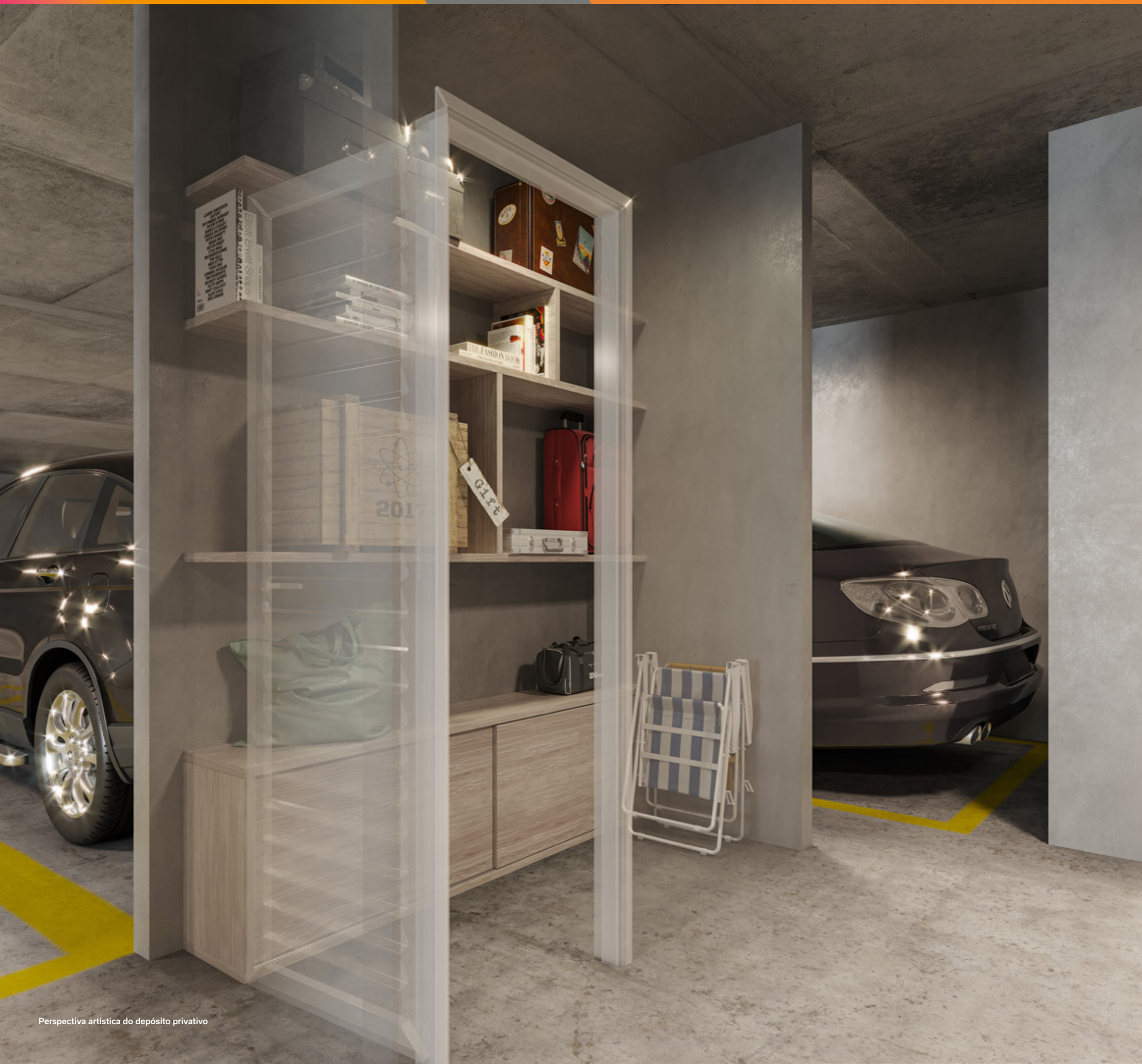
Perspectiva artística do depósito privativo