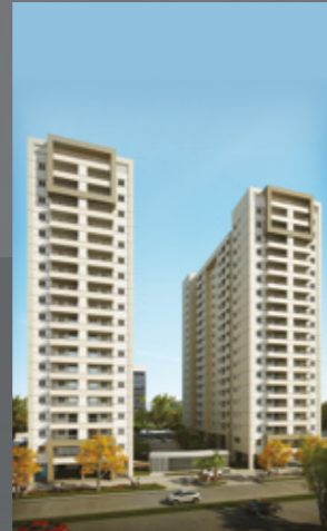
Marco Zero Prime e Premier Jd. do Mar - SBC