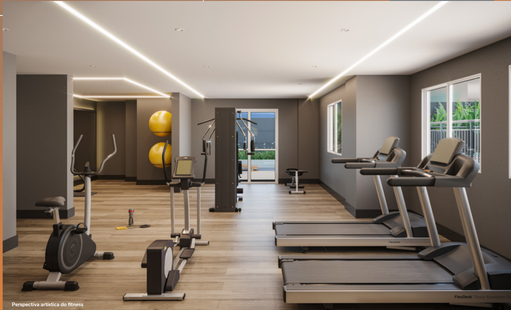
Perspectiva artística do fitness