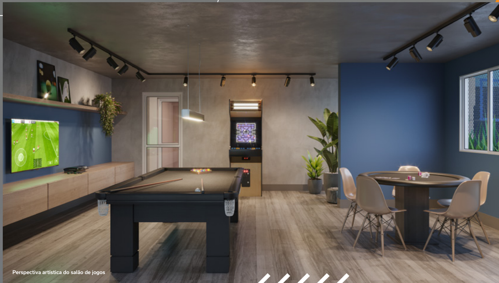
Perspectiva artística do salão de jogos