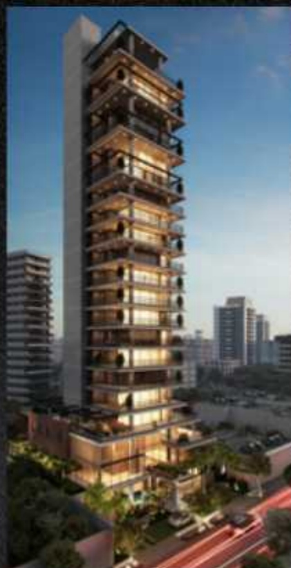
AGIA FARIA LIMA

Adquirir um imóvel da Arquiplan é retorno certo. E de qualidade de vida também.