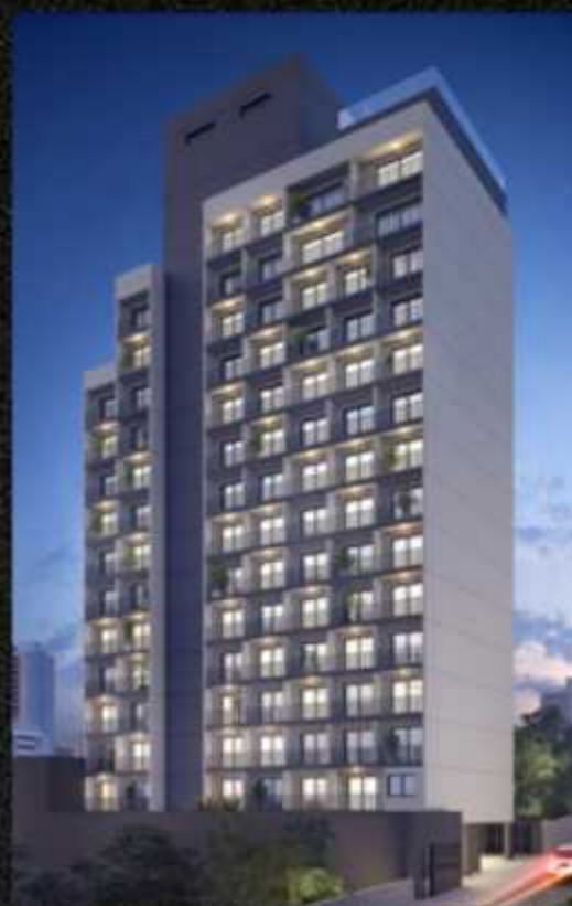
SNAP BELA VISTA