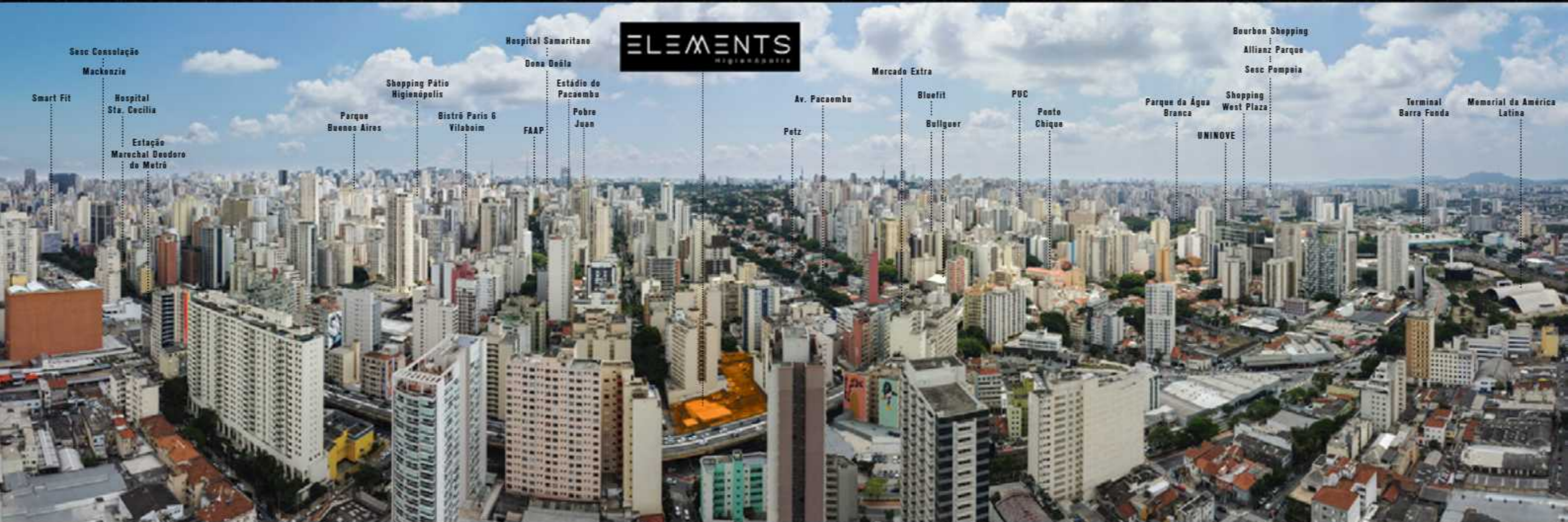
FOTO AÉREA DA REGIÃO