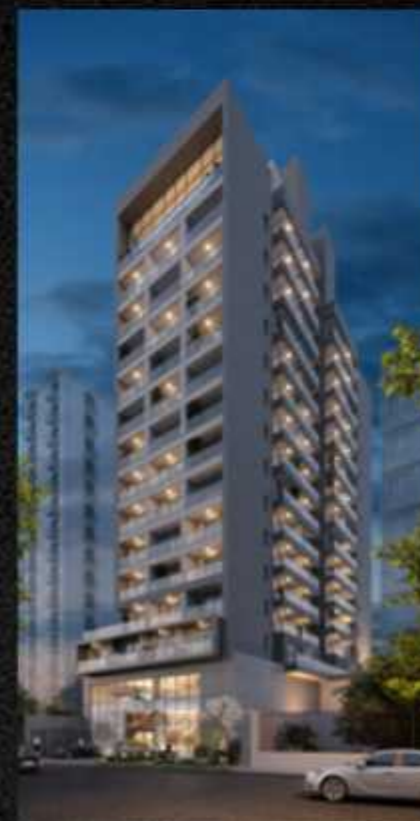
BELINT BELA CINTRA