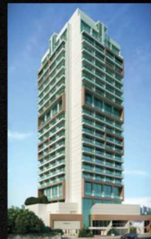
OFFICE DESIGN SANTANA