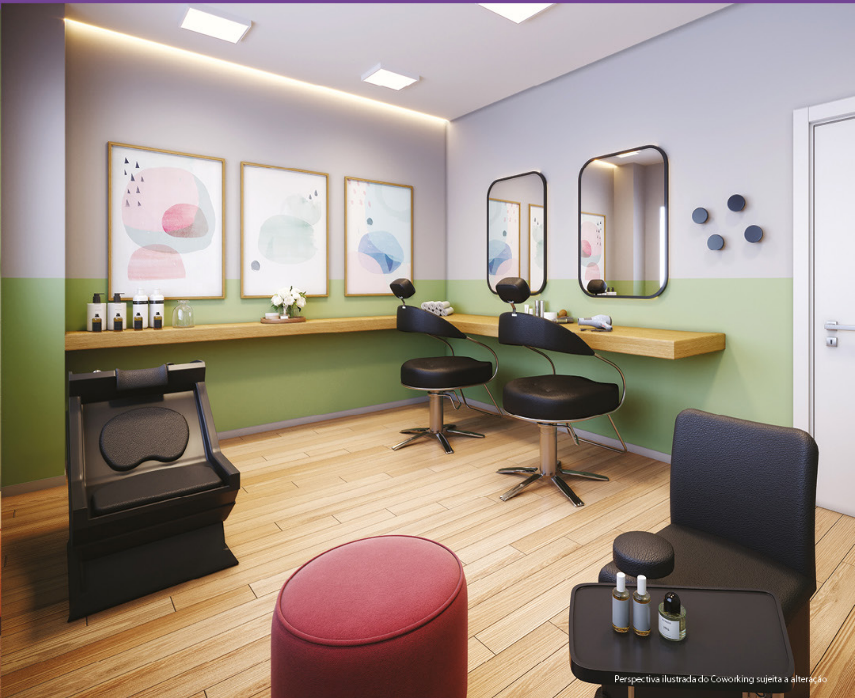
Perspectiva ilustrada do Coworking sujeita a alteração