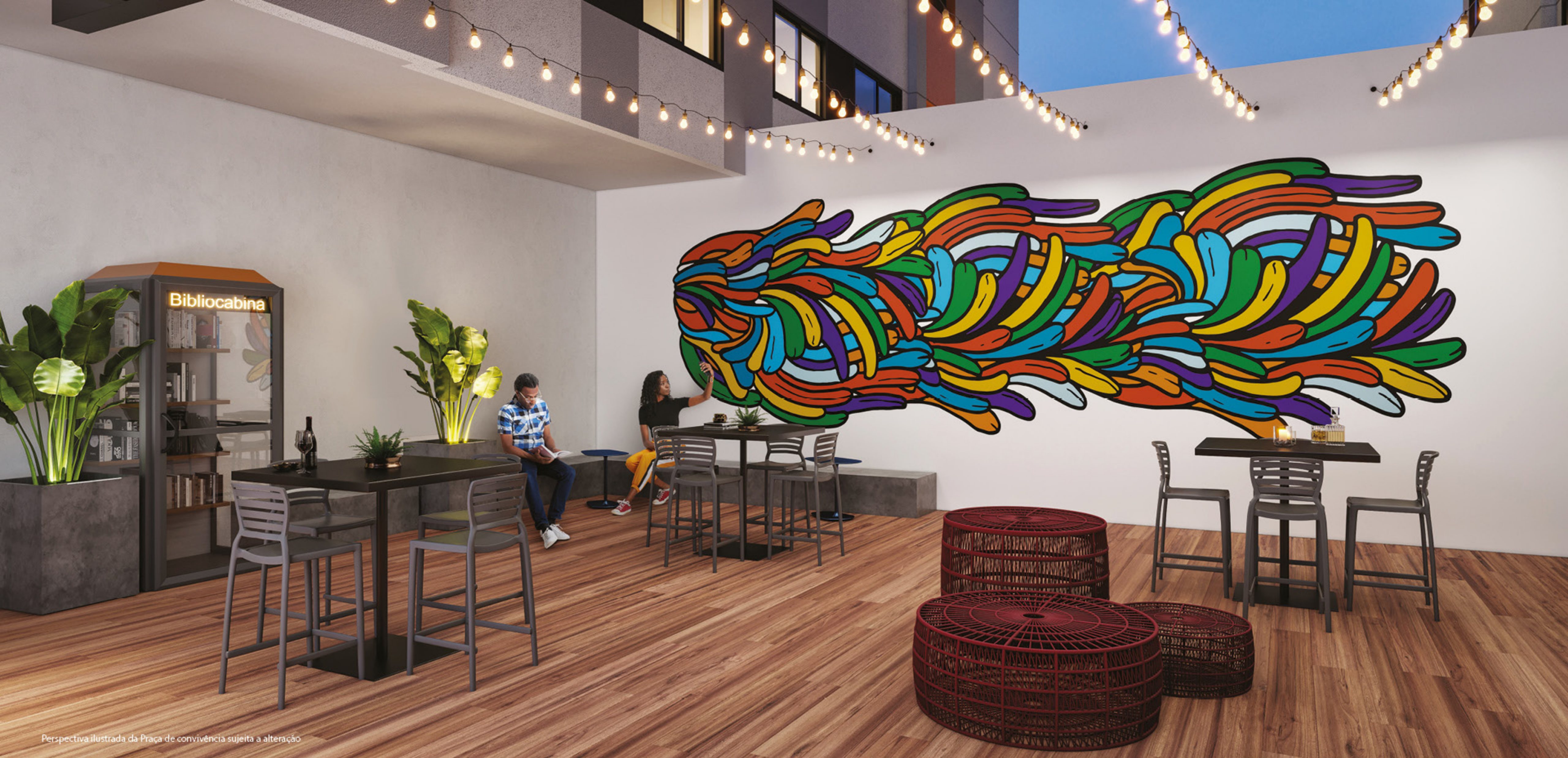
Perspectiva ilustrada da Praça de convivência sujeita a alteração