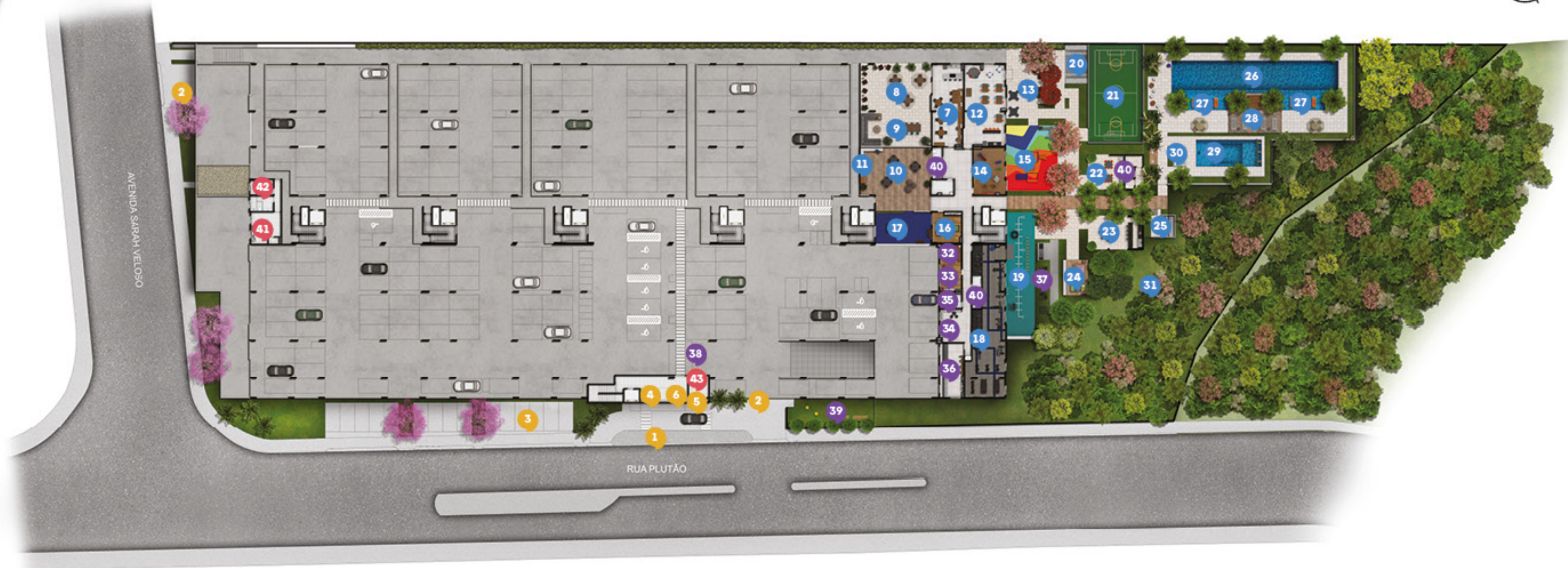
Imagem meramente ilustrativa da Implantação sujeita a alteração