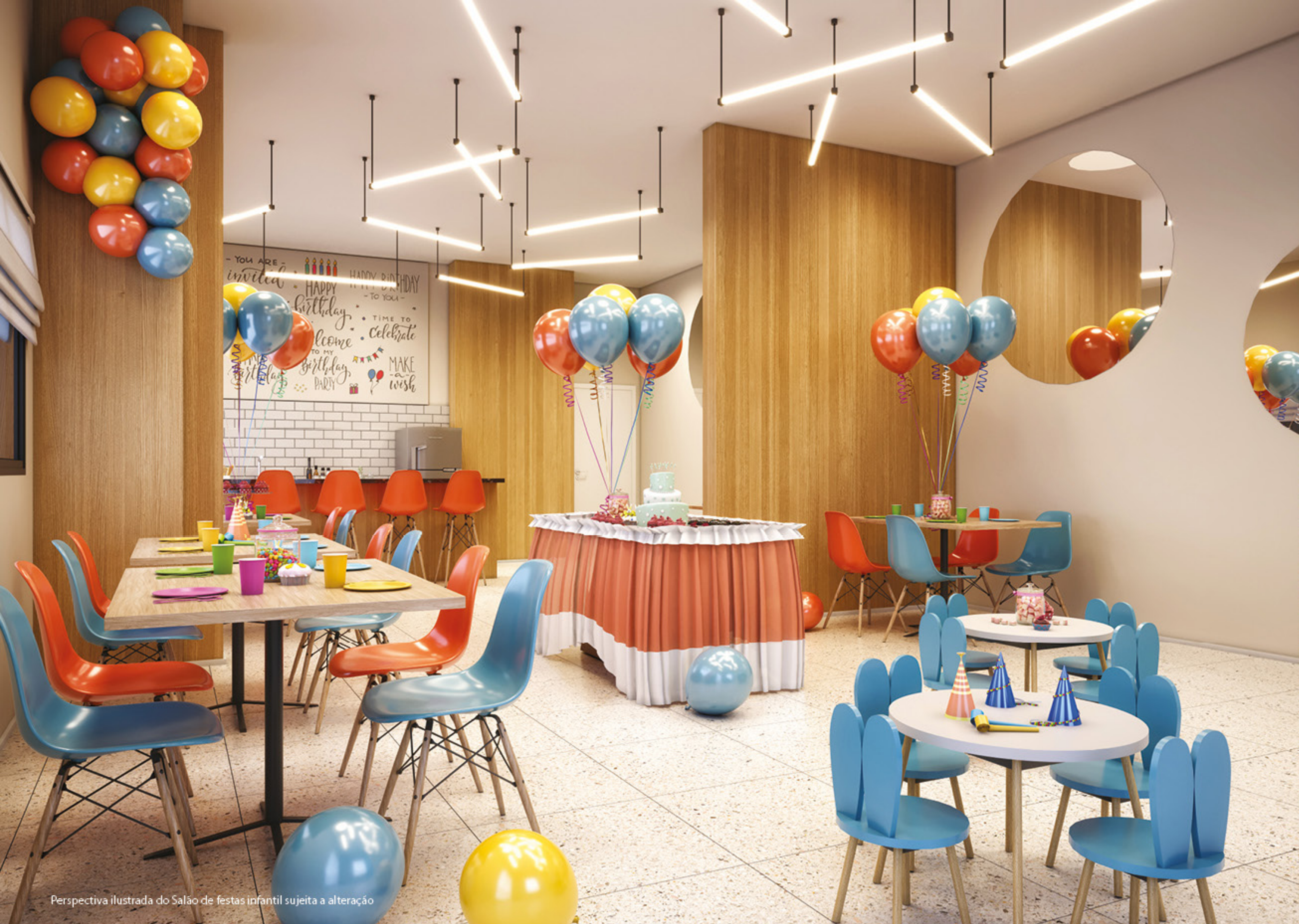
Perspectiva ilustrada do Salão de festas infantil sujeita a alteração

SALÃO DE FESTAS INFANTIL 1 Aqui toda a magia da festa acontece.