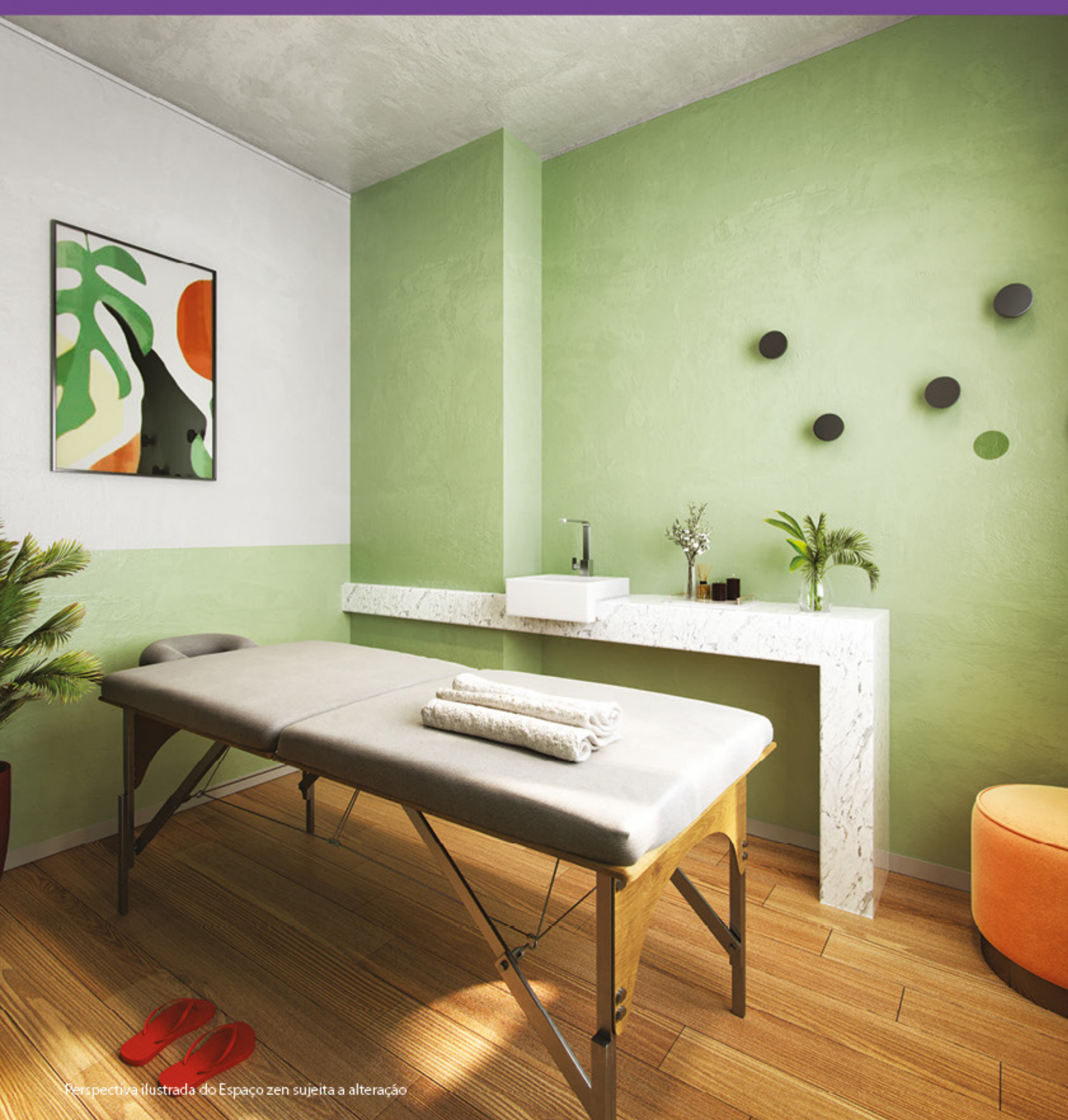
Perspectiva ilustrada do Espaço zen sujeita a alteração