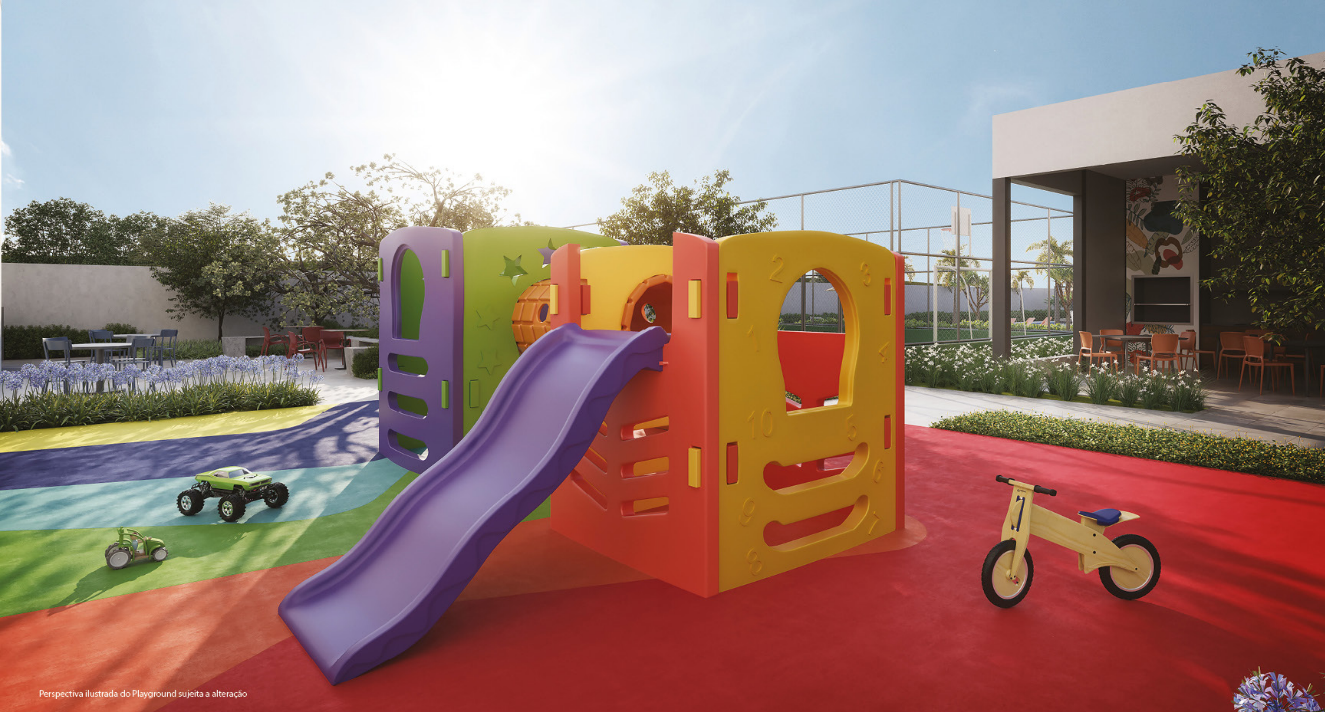
Perspectiva ilustrada do Playground sujeita a alteração