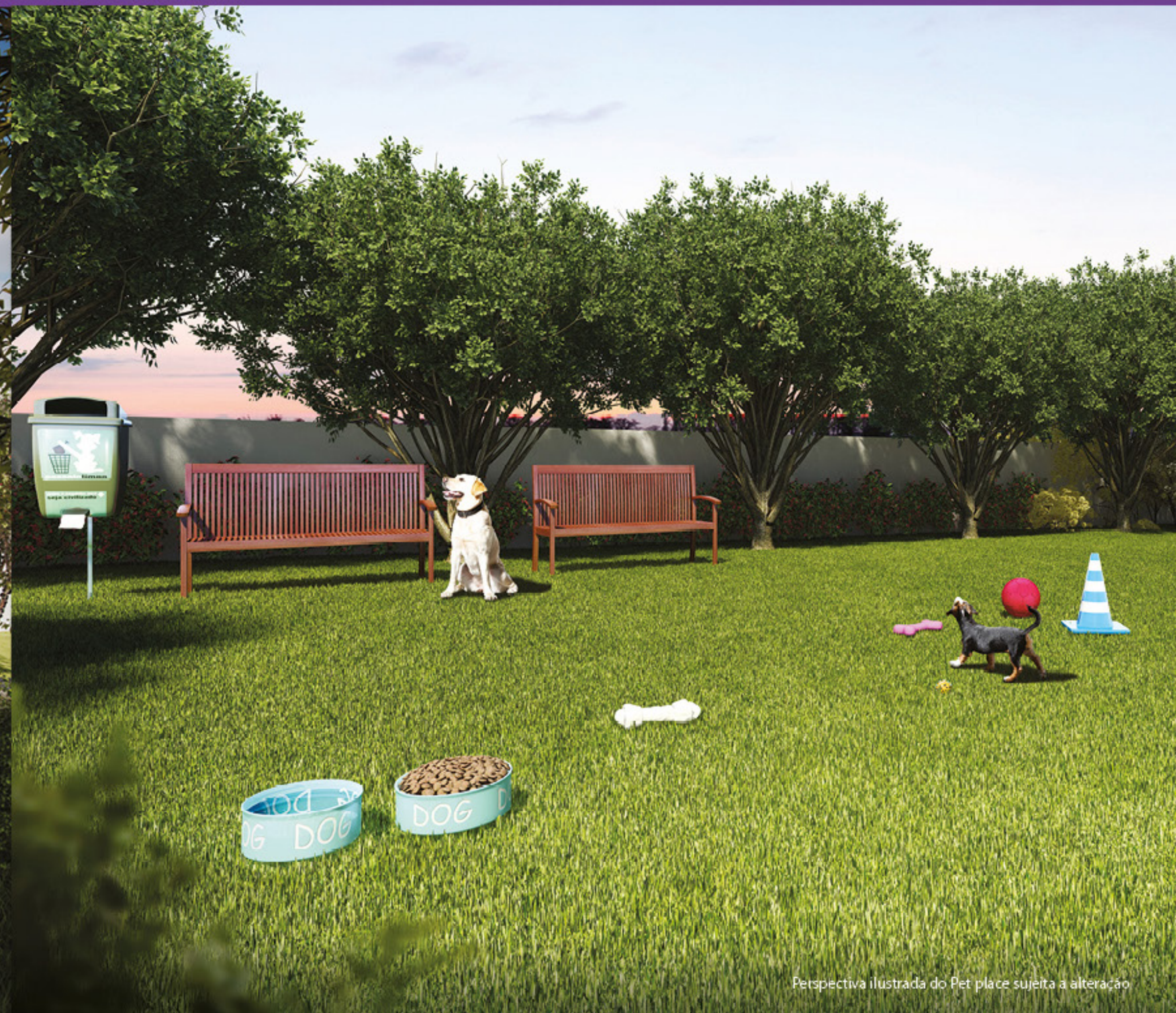
Perspectiva ilustrada do Pet place sujeita a alteração

Se alimentar com qualidade deixa a gente feliz.