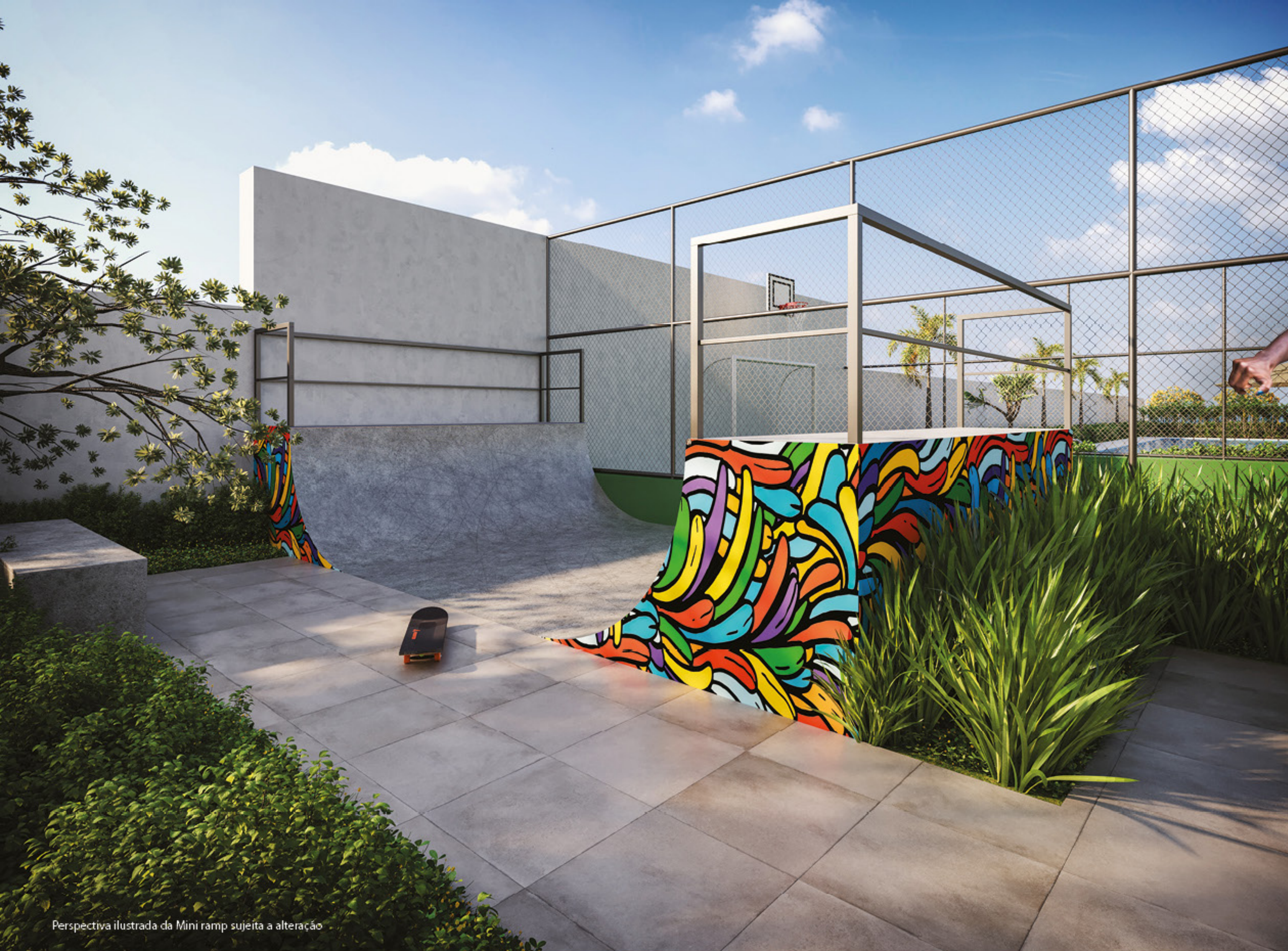
Perspectiva ilustrada da Mini ramp sujeita a alteração