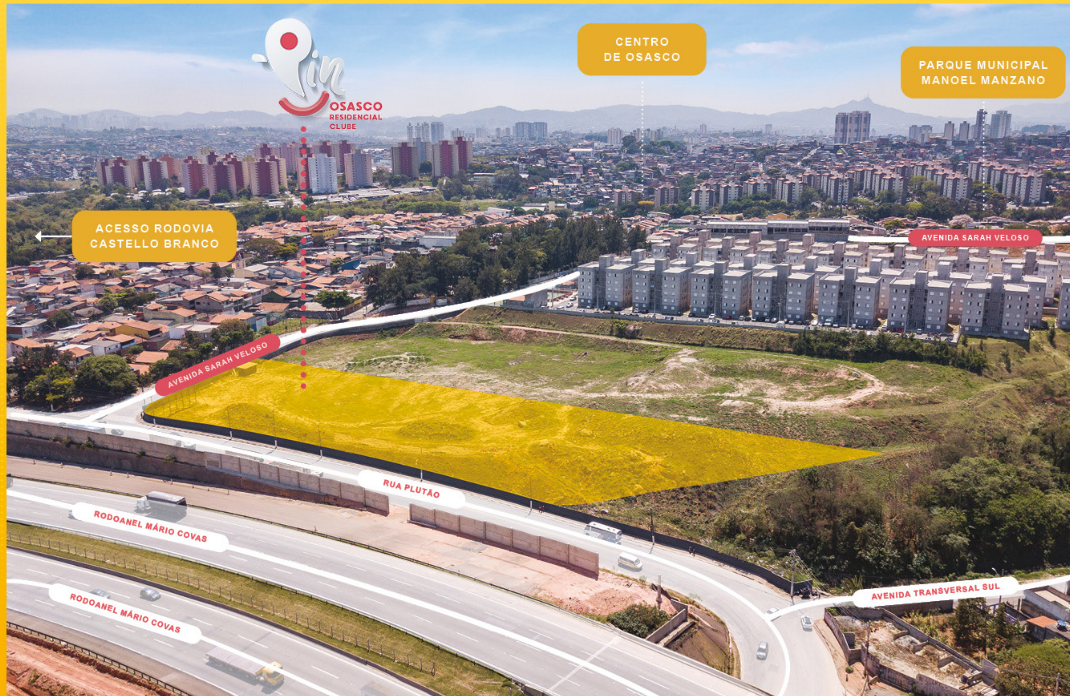
Foto aérea ilustrada da região