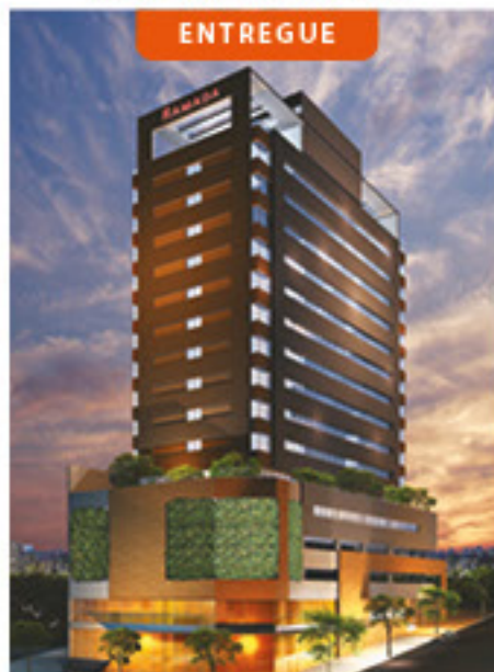
Hotel Ramada Encore

Osasco/SP 150 salas e 150 suítes 1 torre