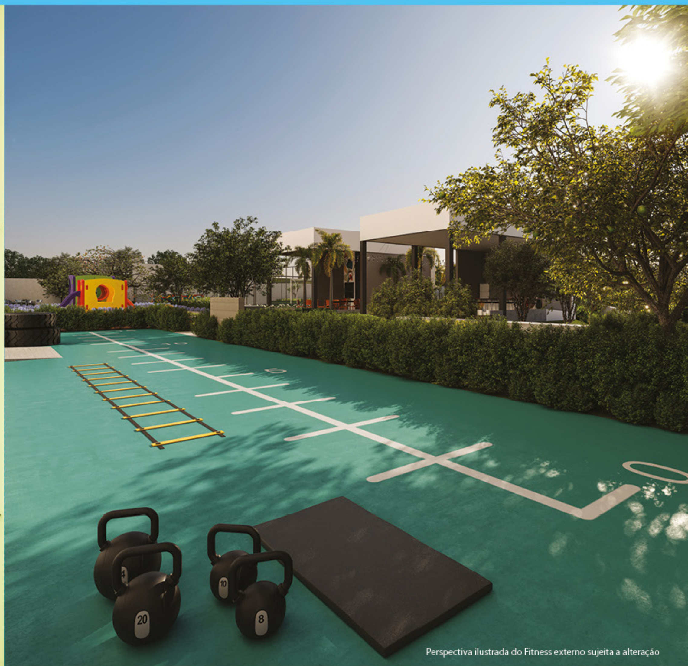
Perspectiva ilustrada do Fitness externo sujeita a alteração