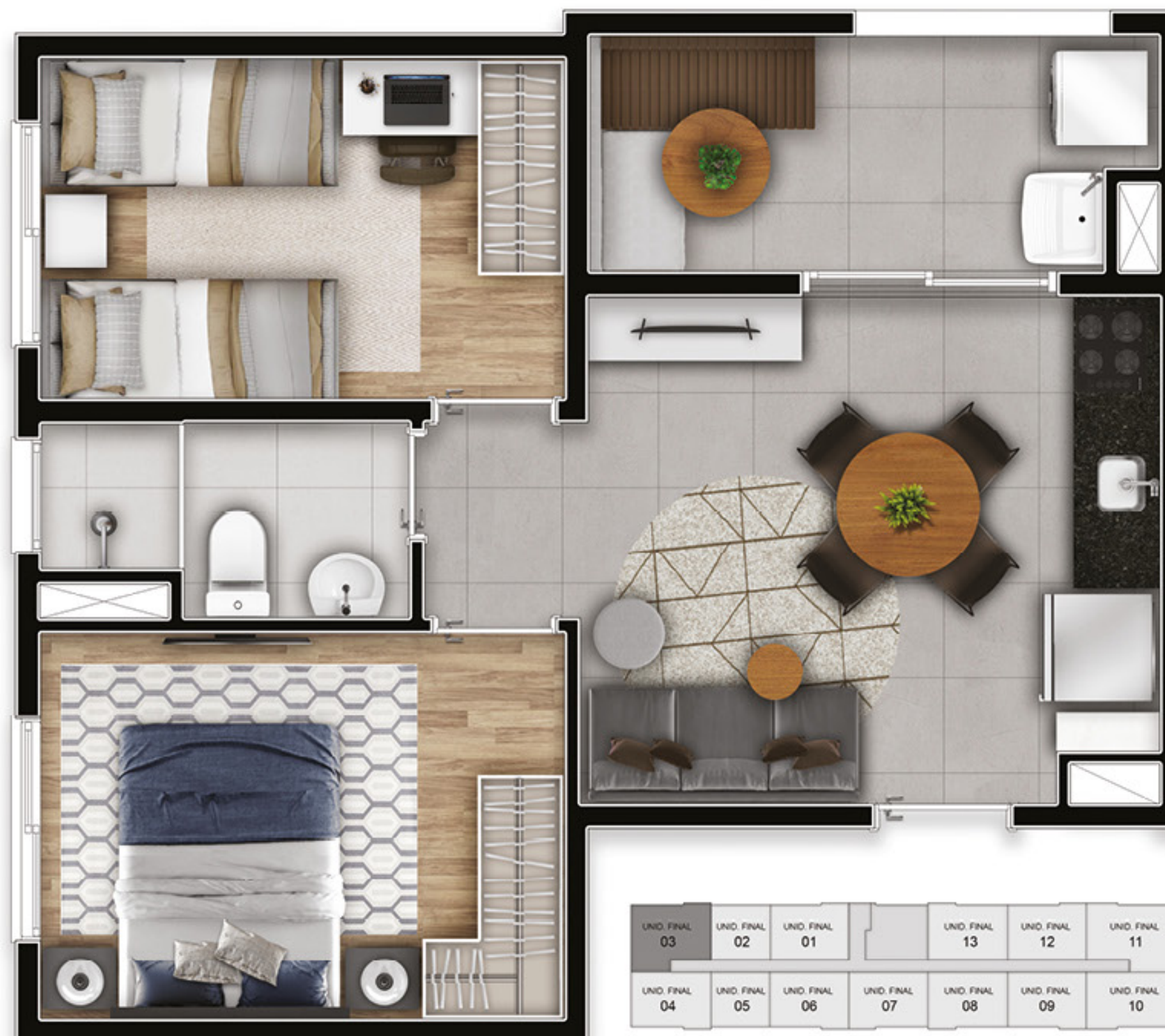
Ilustração da planta de 2 dormitórios decorada. Móveis, objetos de decoração e utensílios são meramente ilustrativos e não integram o memorial descritivo. Material de uso interno sujeito a alteração.