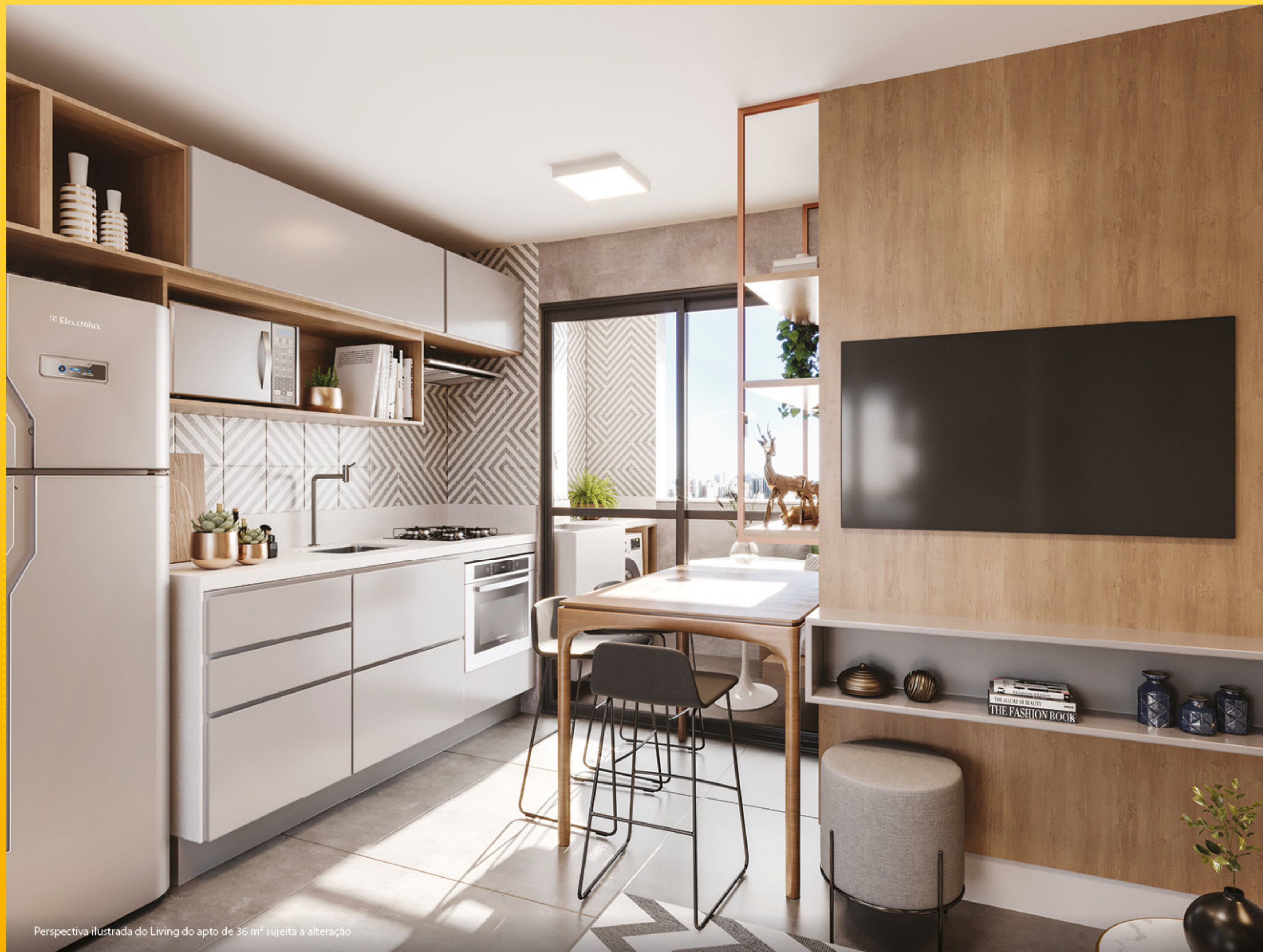
Perspectiva ilustrada do Living do apto de 36 m 2 sujeita a alteração