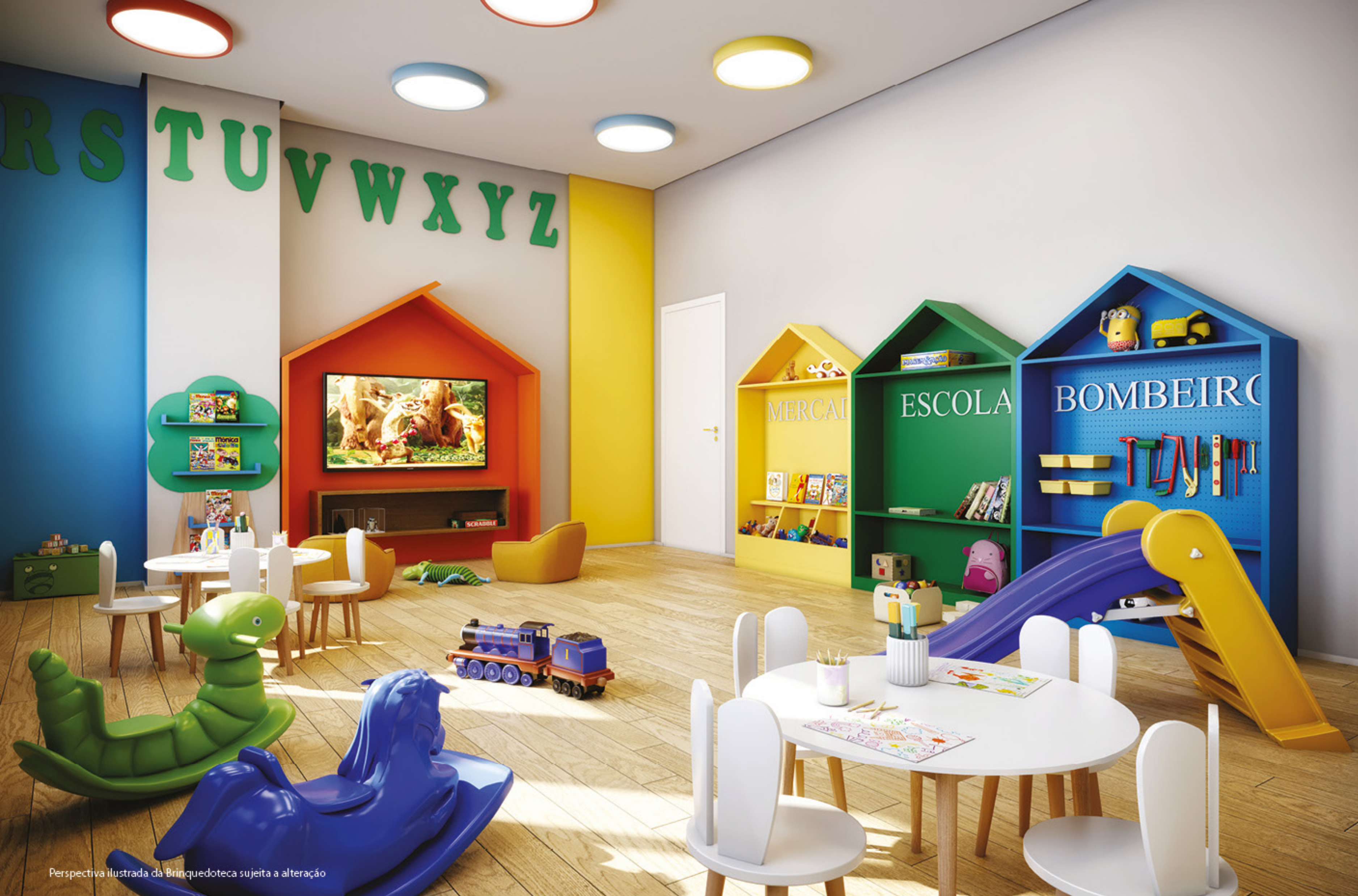
Perspectiva ilustrada da Brinquedoteca sujeita a alteração