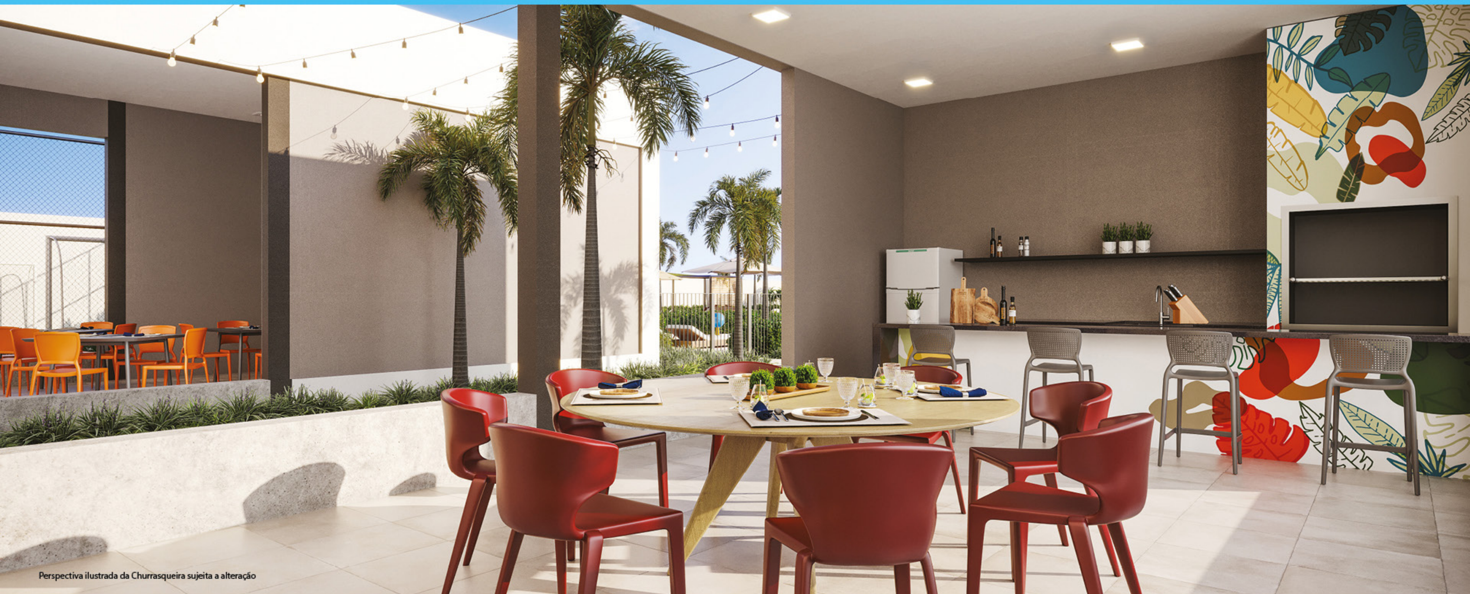
Perspectiva ilustrada da Churrasqueira sujeita a alteração