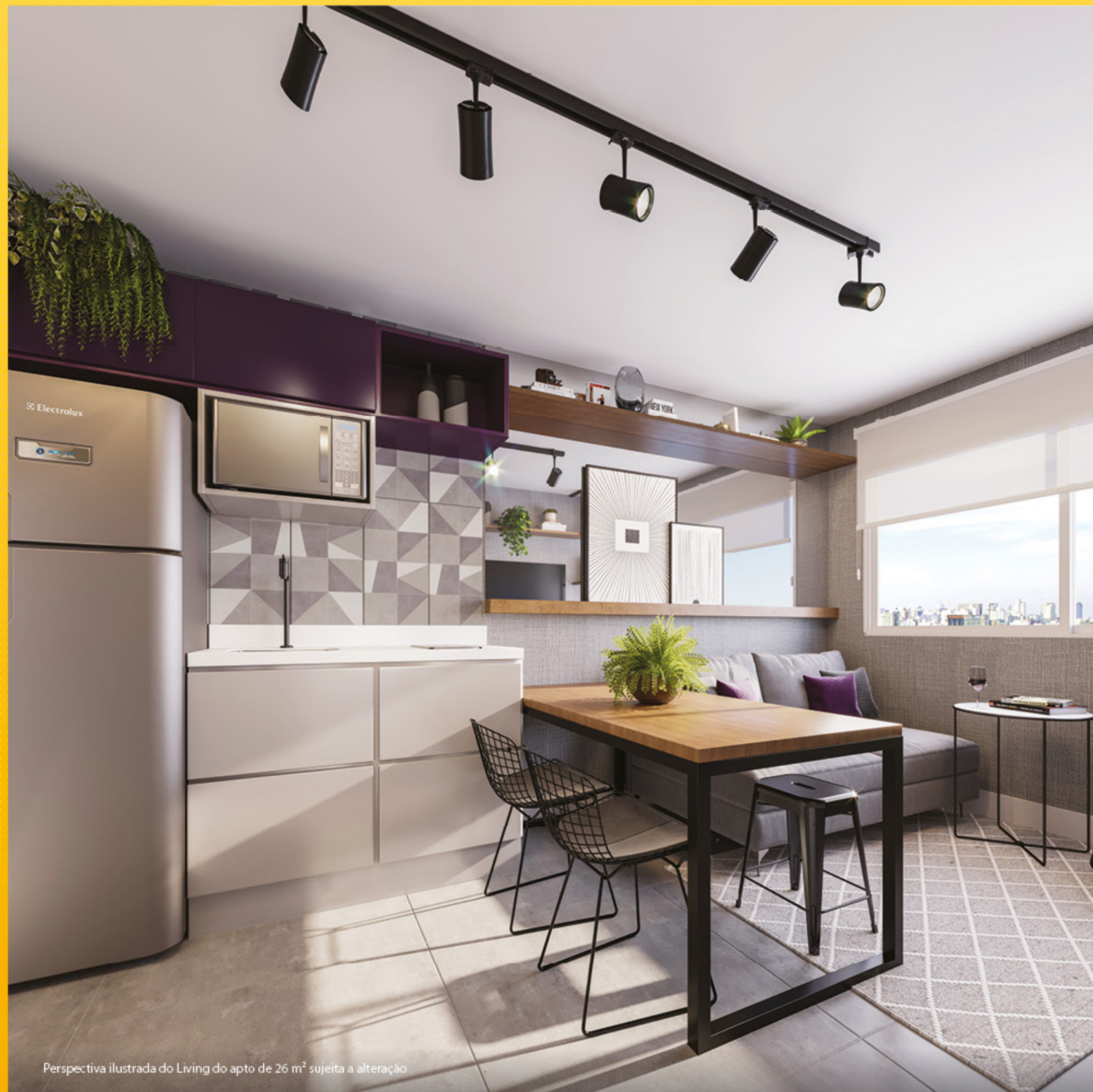
Perspectiva ilustrada do Living do apto de 26 m 2 sujeita a alteração