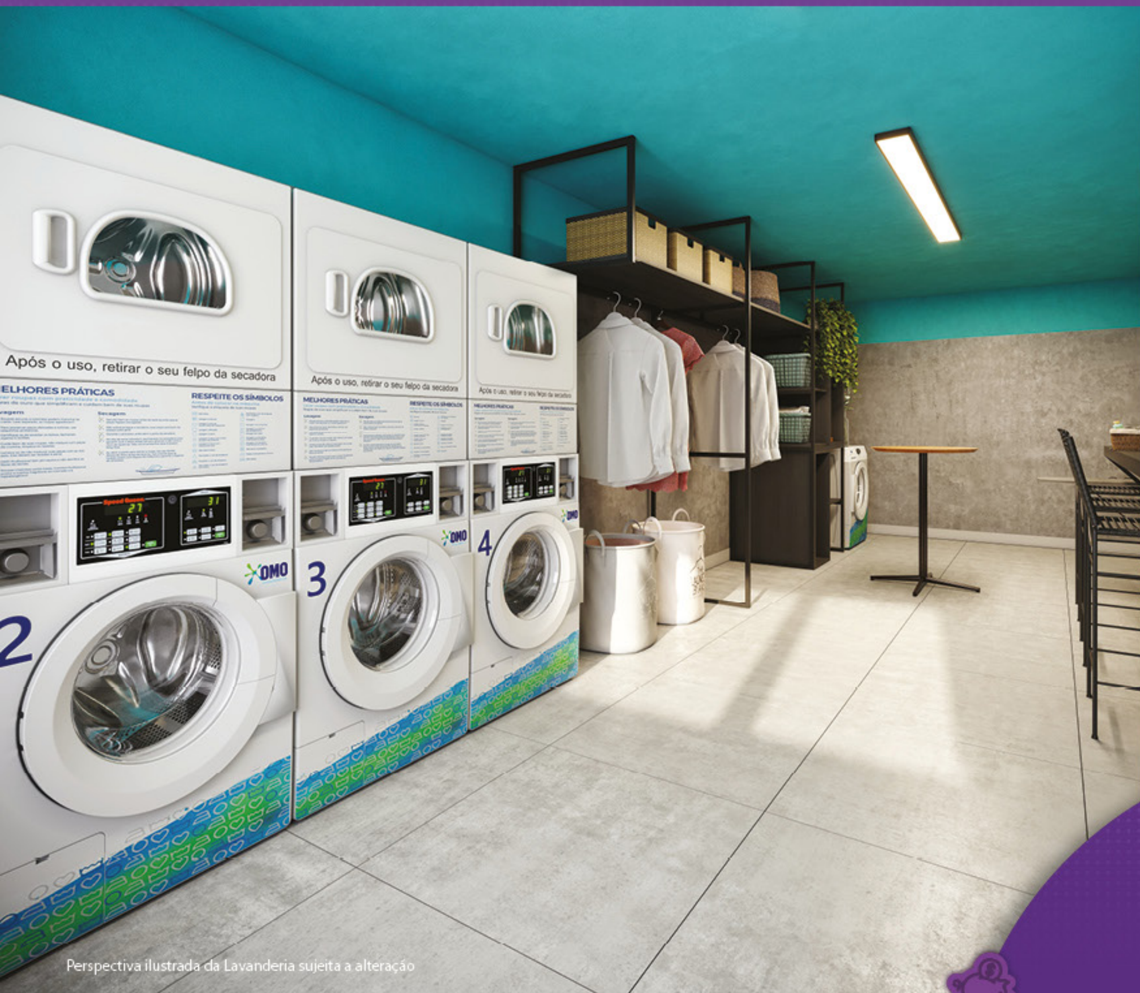
Perspectiva ilustrada da Lavanderia sujeita a alteração