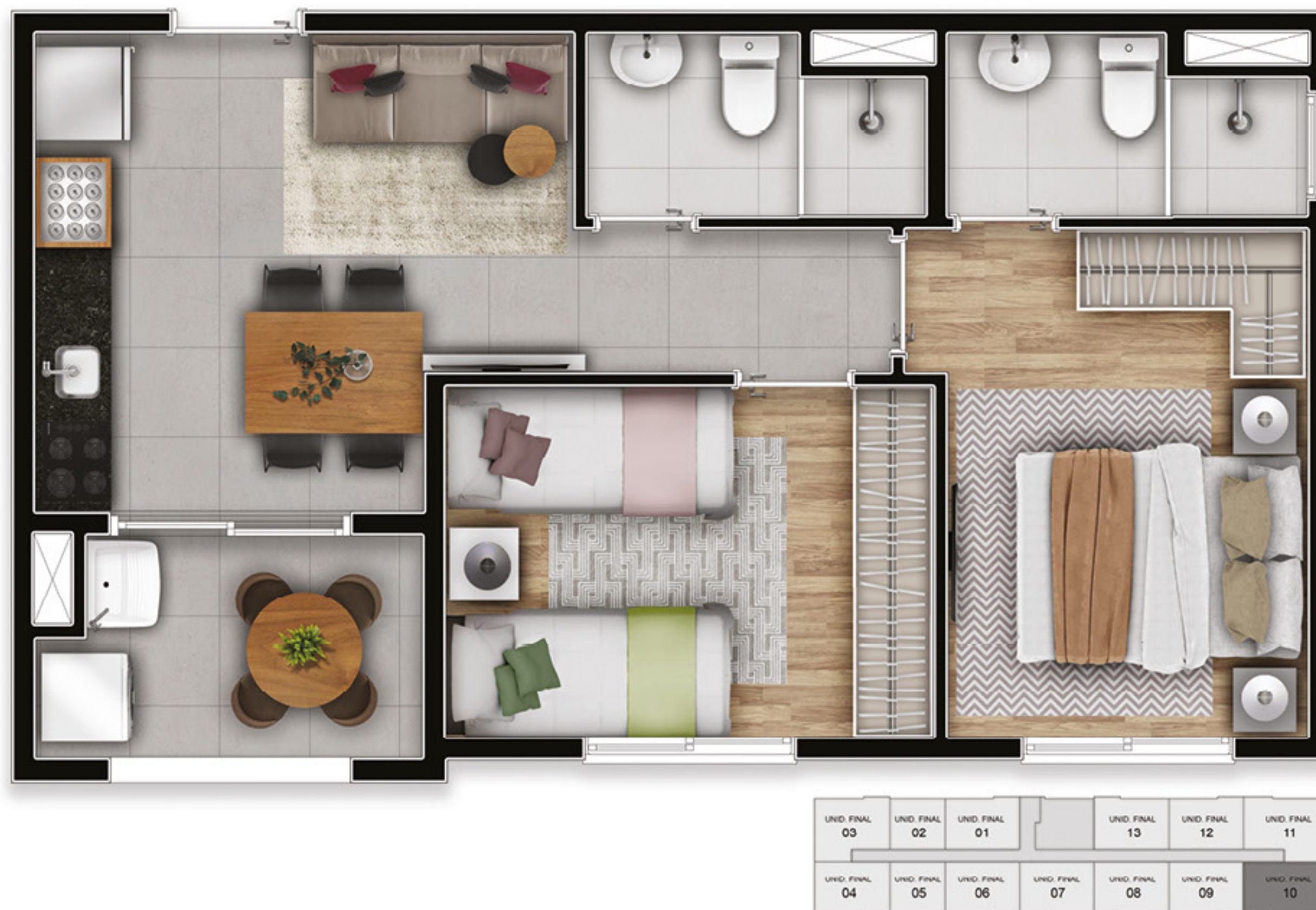
Ilustração da planta de 2 dormitórios decorada. Móveis, objetos de decoração e utensílios são meramente ilustrativos e não integram o memorial descritivo. Material de uso interno sujeito a alteração.