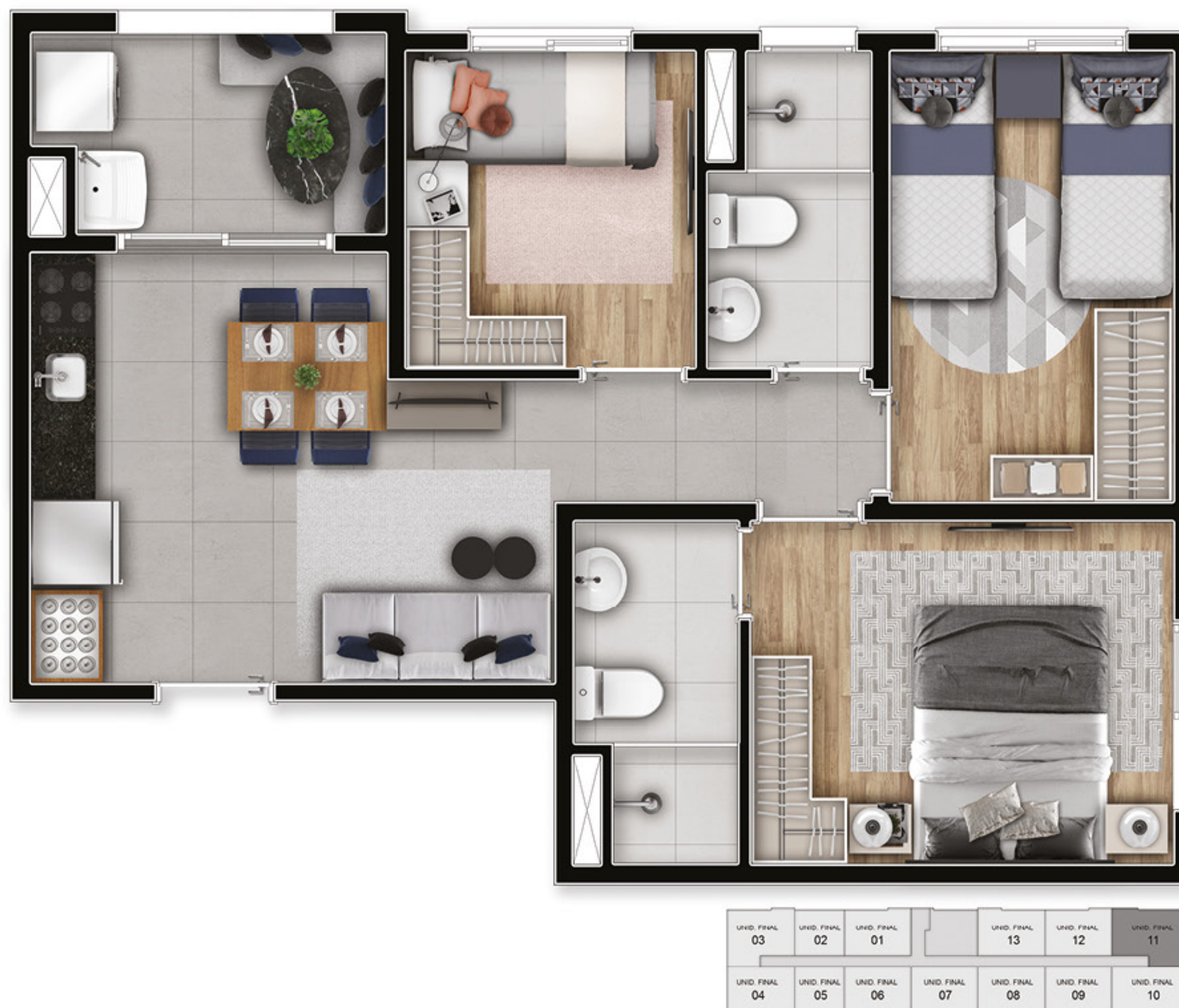
Ilustração da planta decorada. Móveis, objetos de decoração e utensílios são meramente ilustrativos e não integram o memorial descritivo. Material de uso interno sujeito a alteração.