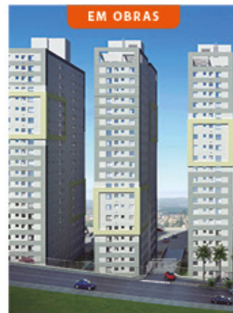
Villa Nova Fazendinha