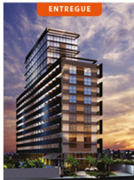
Complexo Empresarial Osasco

Osasco/SP 150 salas e 150 suítes 1 torre