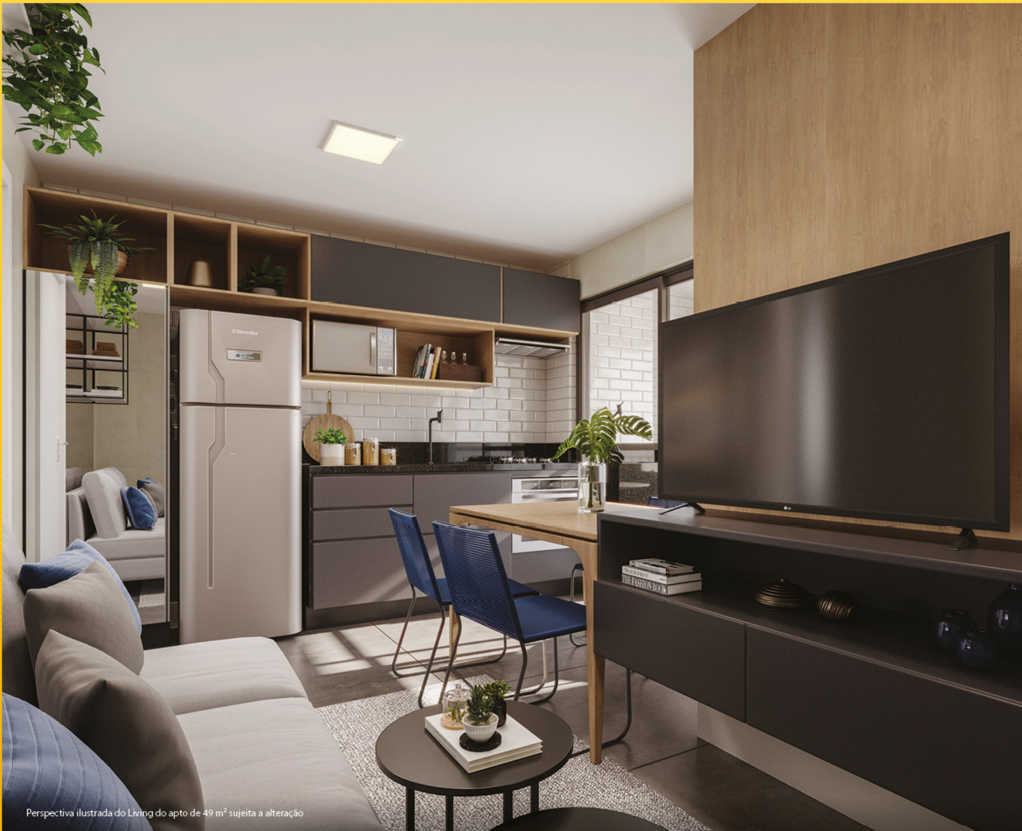
Perspectiva ilustrada do Living do apto de 49 m 2 sujeita a alteração