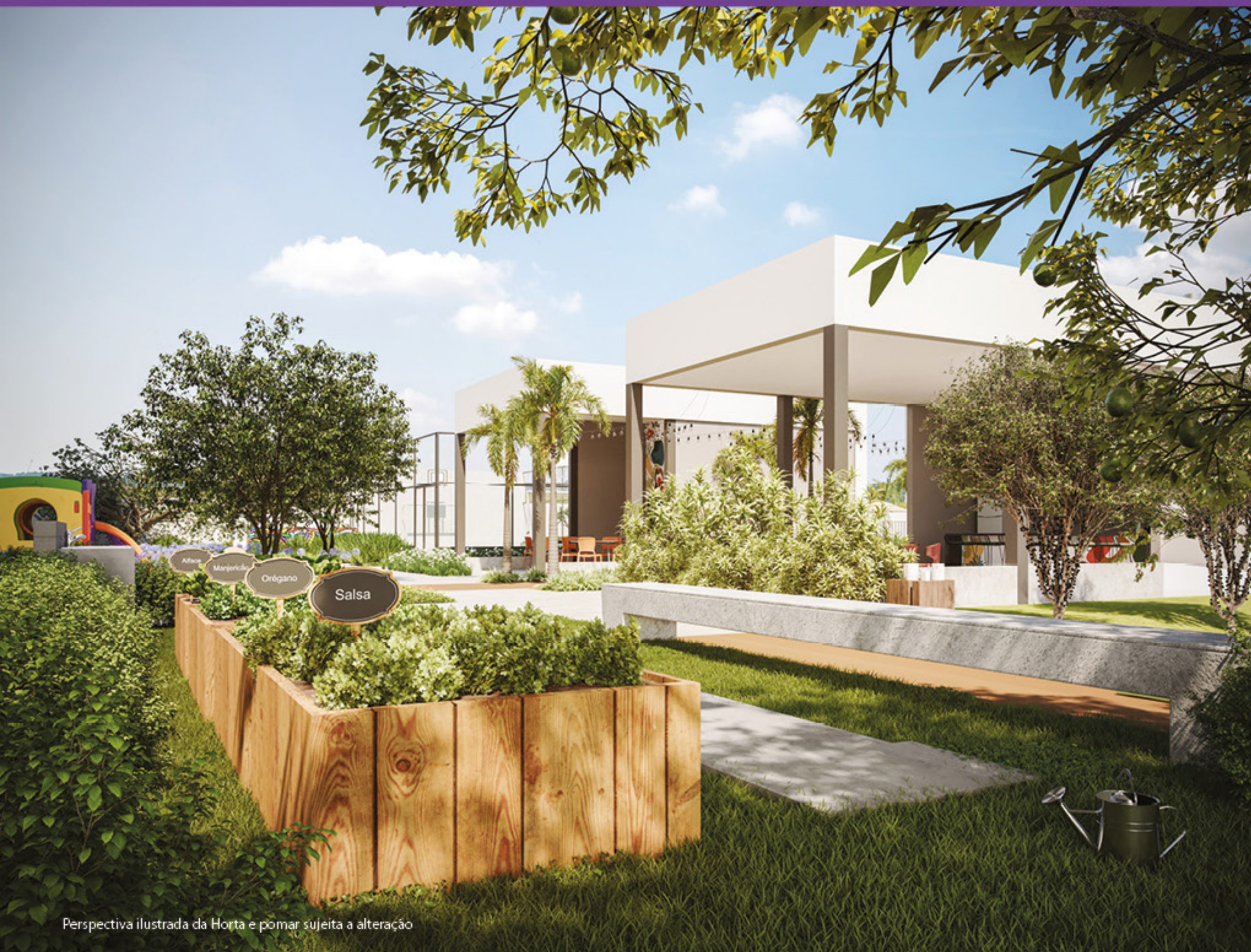
Perspectiva ilustrada da Horta e pomar sujeita a alteração