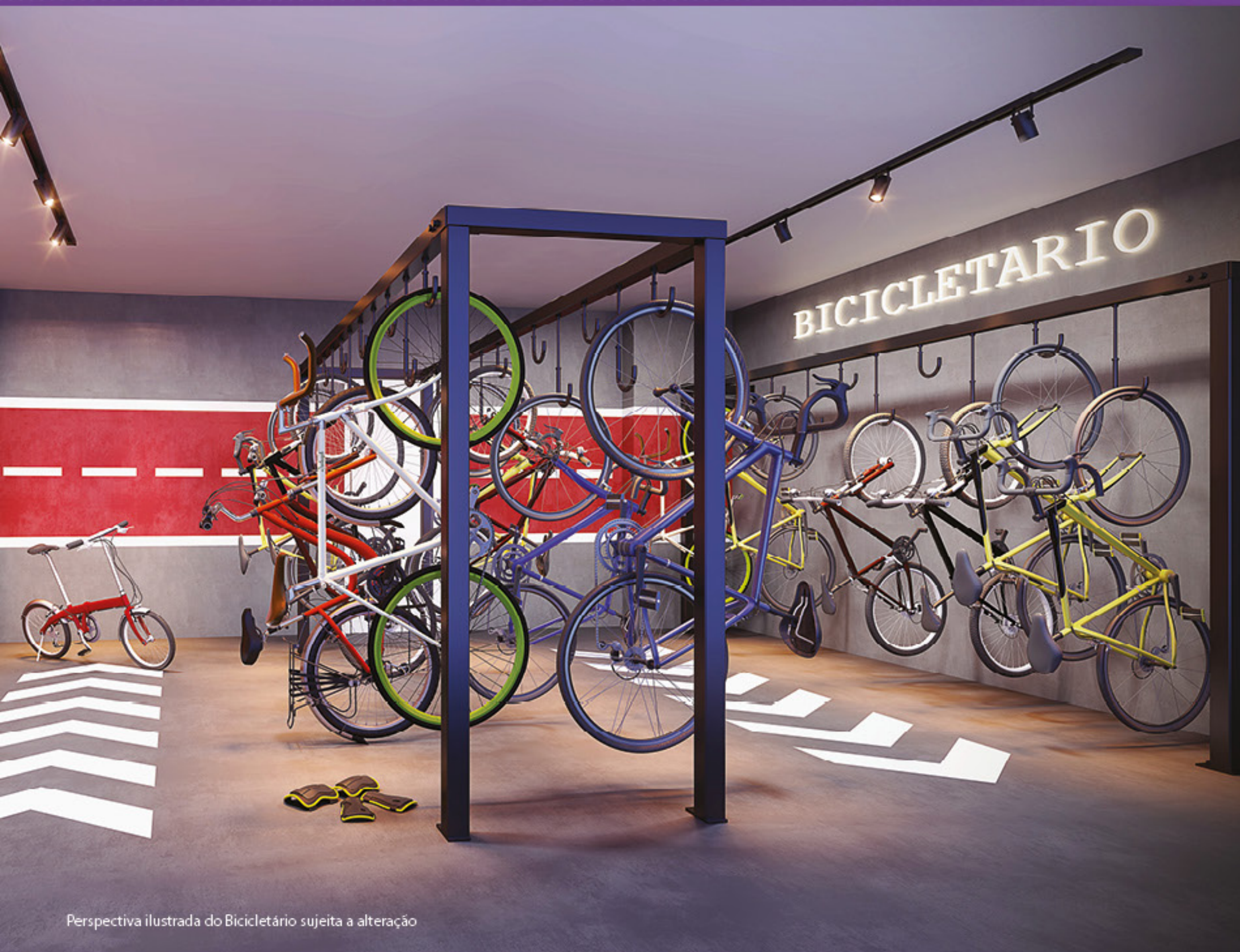
Perspectiva ilustrada do Bicicletário sujeita a alteração