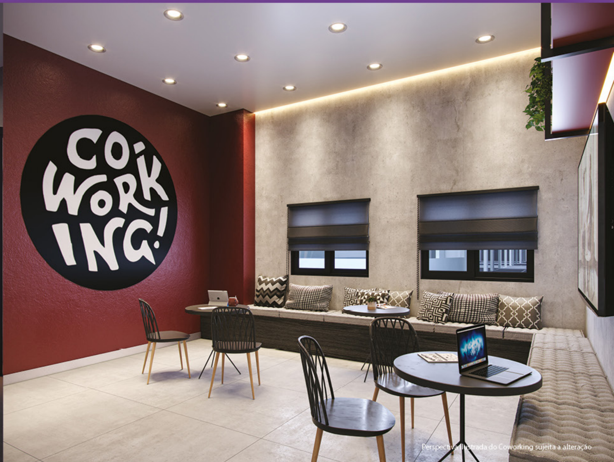
Perspectiva ilustrada do Coworking sujeita a alteração