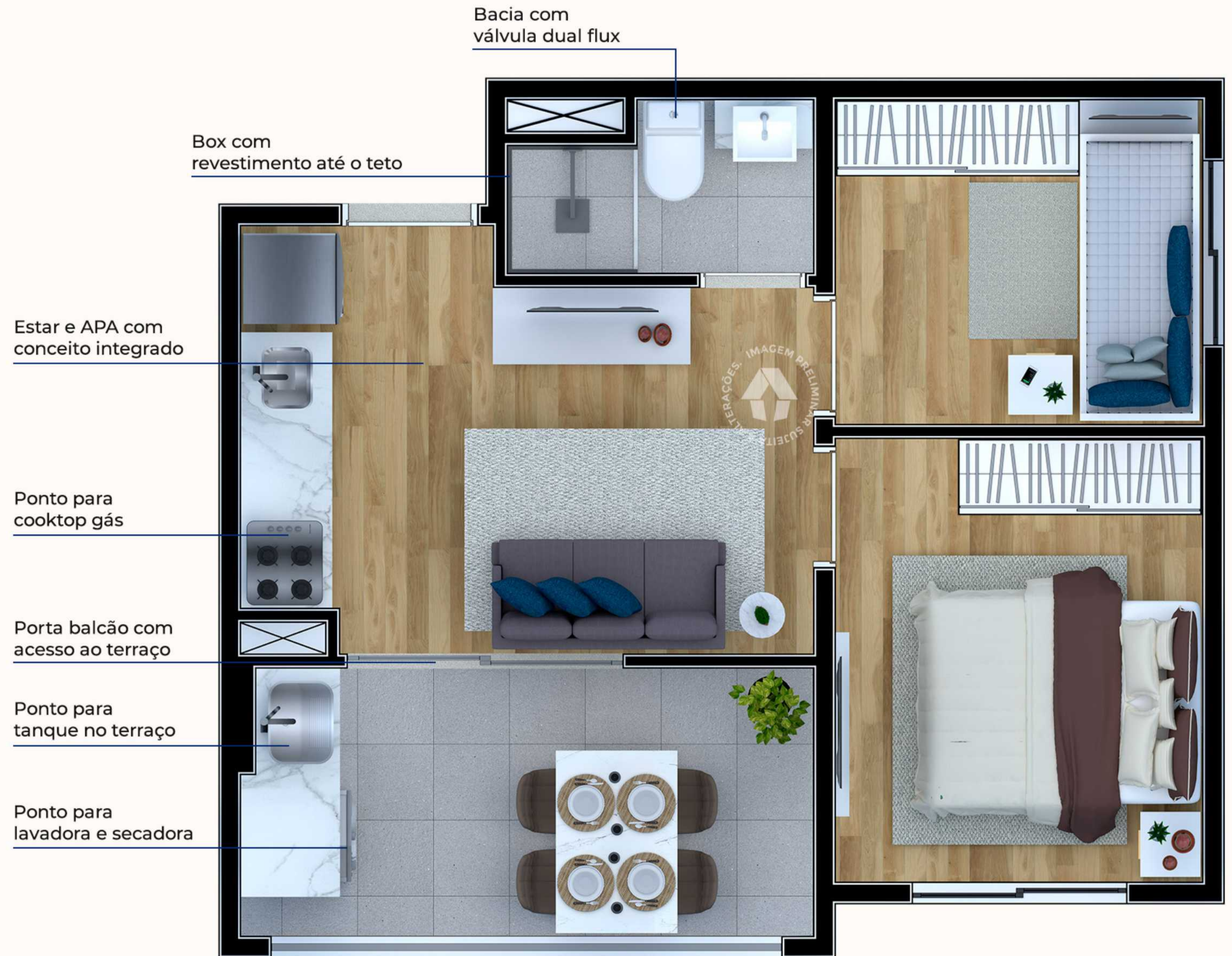
Ilustração artística da planta com sugestão de decoração. Os móveis, utensílios, adornos e equipamentos não fazem parte do contrato de venda e compra. Acabamentos e revestimentos serão entregues conforme memorial descritivo específico. Esta planta poderá sofrer variações decorrentes do atendimento de postura de órgãos públicos e concessionárias.