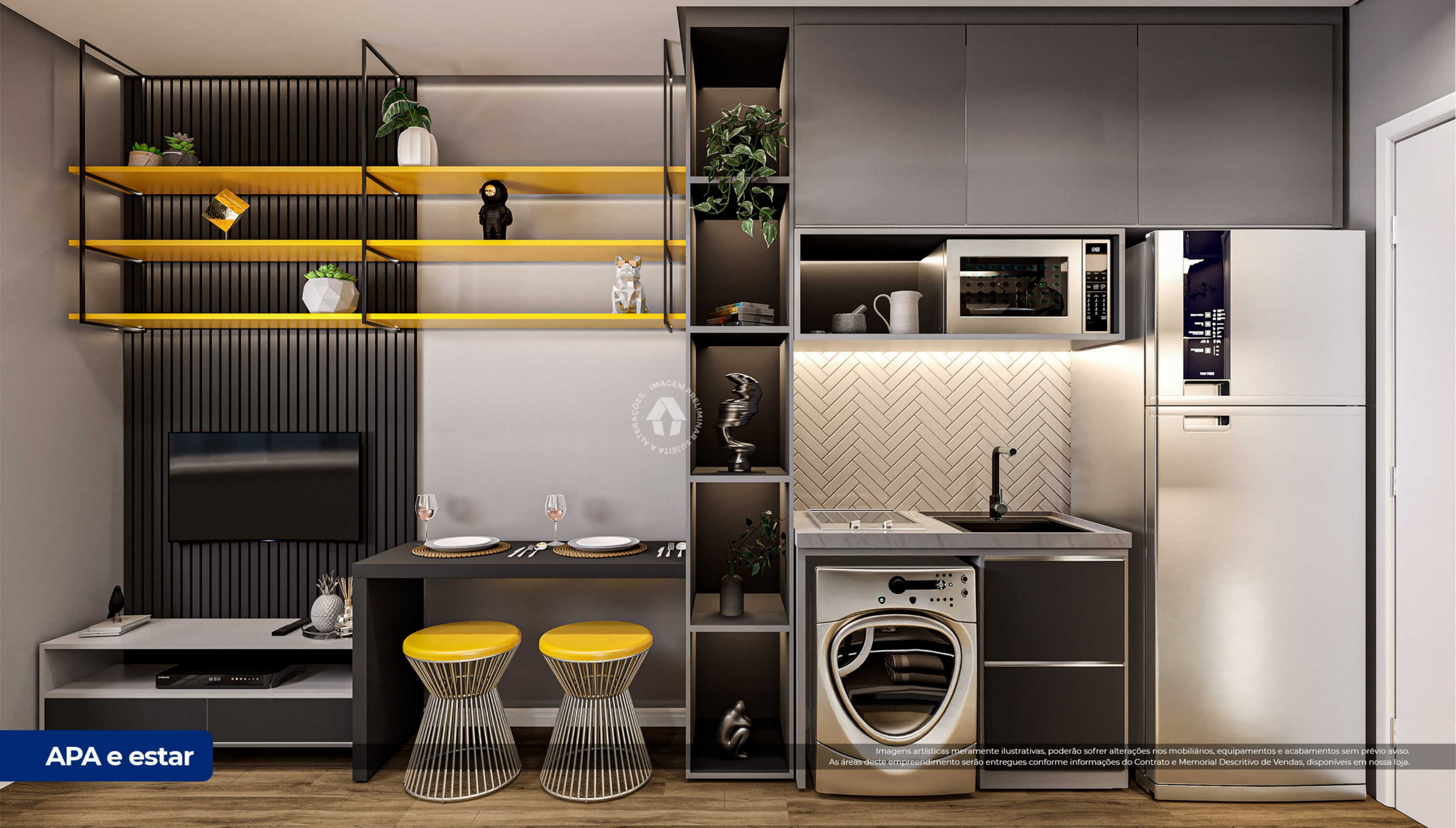
IMAGEM PRELIMINAR ALTERAÇÕES