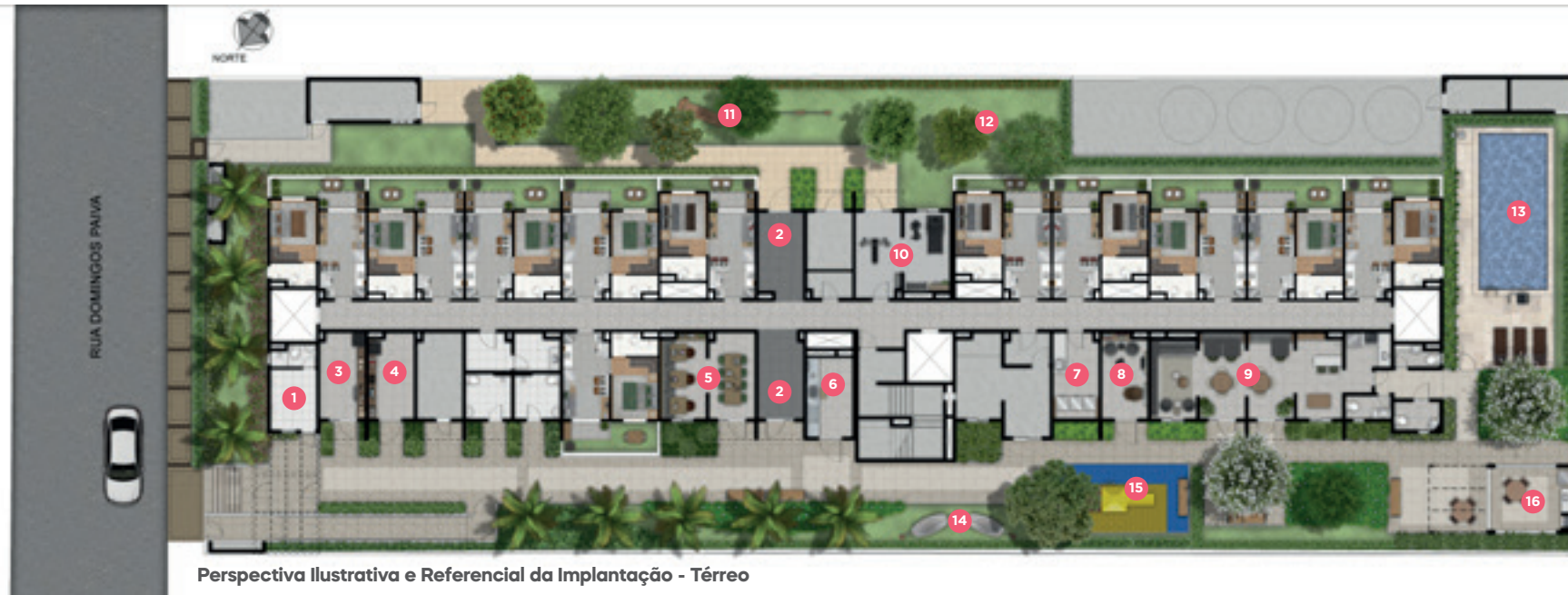
Perspectiva Ilustrativa e Referencial da Implantação - Térreo