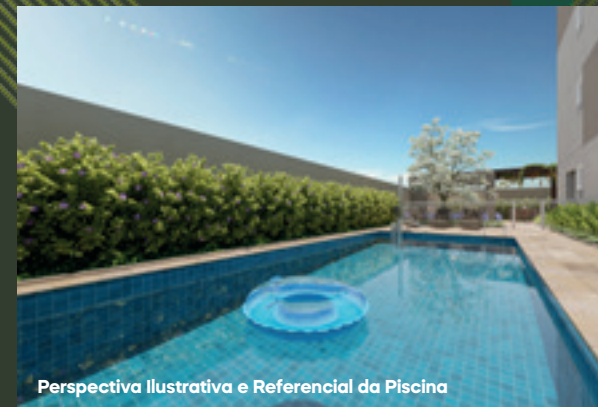
Perspectiva Ilustrativa e Referencial da Piscina