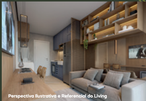
Perspectiva Ilustrativa e Referencial do Living