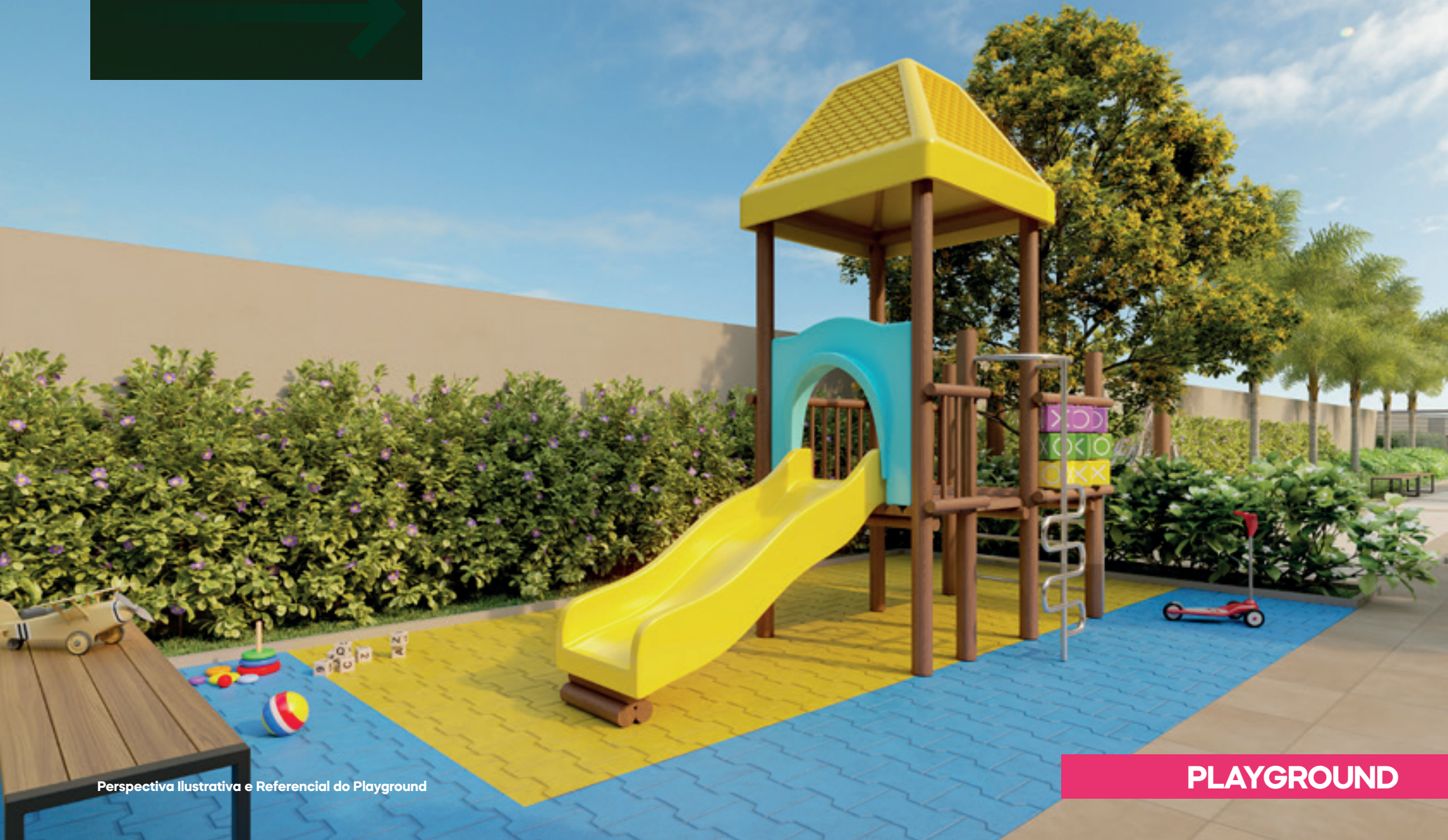
Perspectiva Ilustrativa e Referencial do Playground