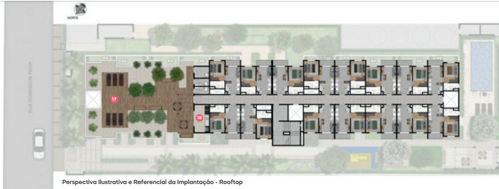
Perspectiva Ilustrativa e Referencial da Implantação - Rooftop