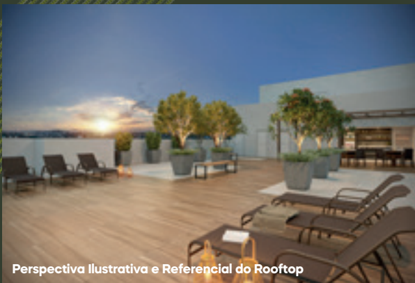
Perspectiva Ilustrativa e Referencial do Rooftop

A Plano&Plano é uma construtora com 25 anos de tradição e atuação em mais de 15 cidades pelo Brasil. Já possui também uma presença consolidada na região, com outros dois empreendimentos, que também estão contribuindo para a transformação do Brás.