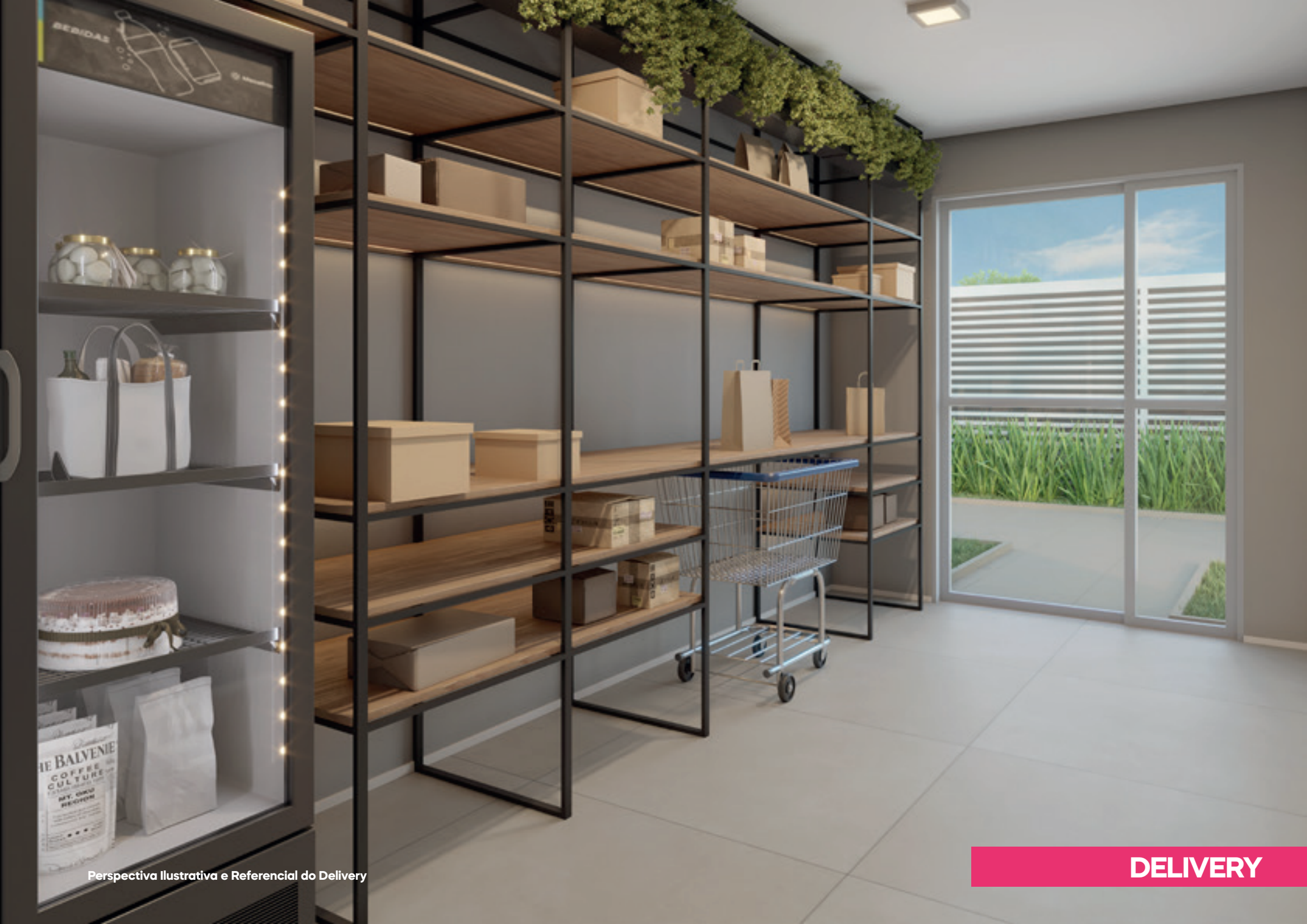
Perspectiva Ilustrativa e Referencial do Delivery