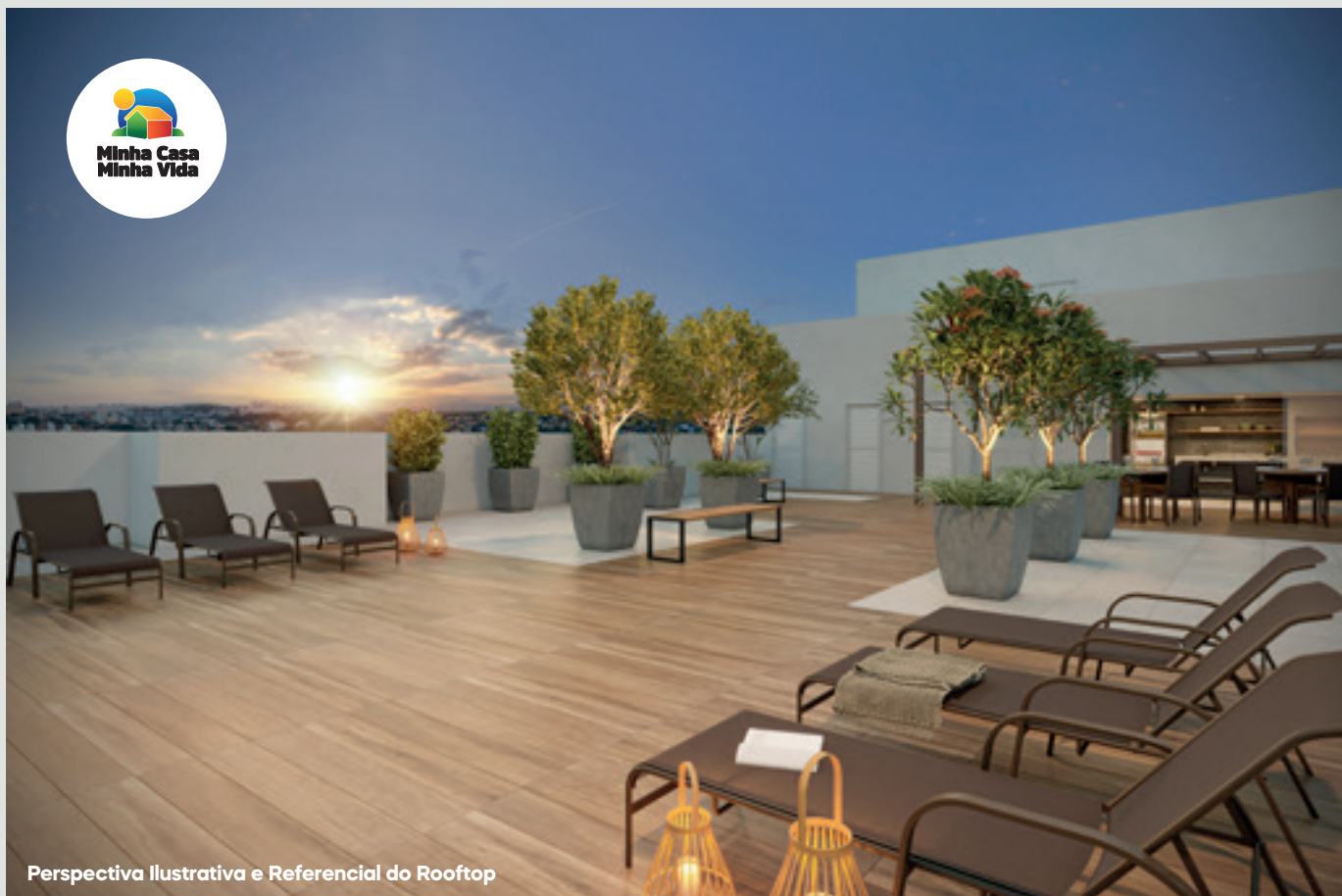
Perspectiva Ilustrativa e Referencial do Rooftop

*A área é uma sugestão de uso e depende de contratação do serviço/infraestrutura/decoração pelo condomínio.