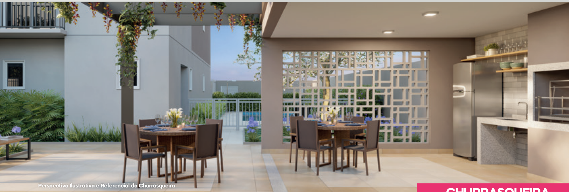
Perspectiva Ilustrativa e Referencial da Churrasqueira