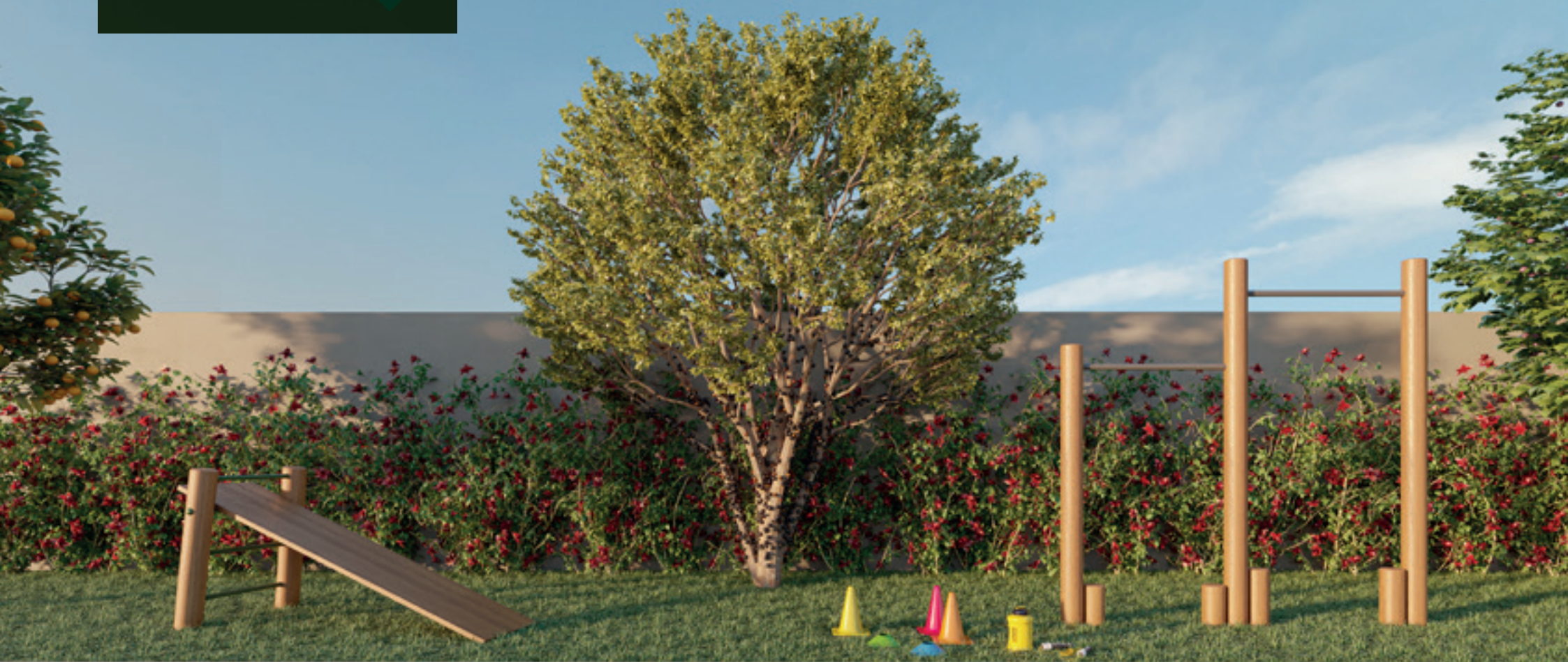
Perspectiva Ilustrativa e Referencial do Fitness Externo