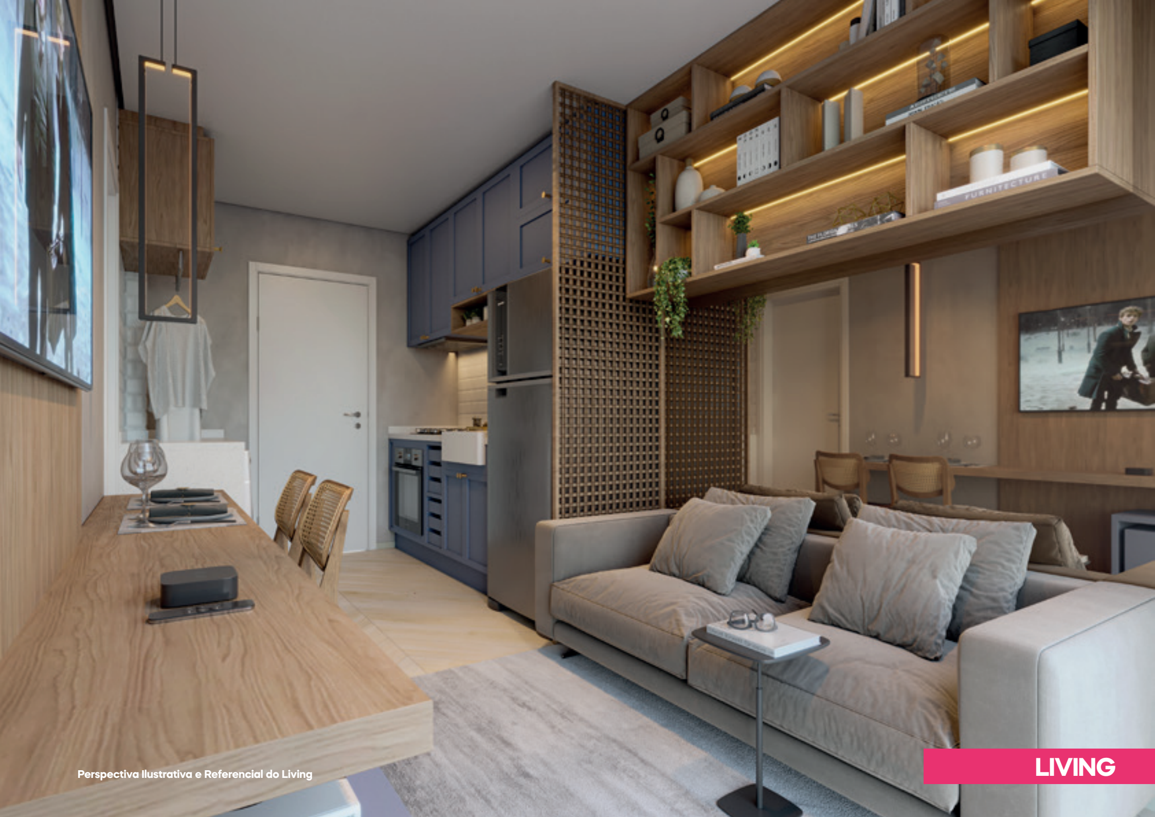
Perspectiva Ilustrativa e Referencial do Living