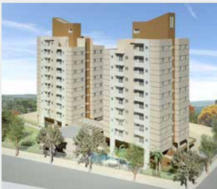
Residencial Aldeia Timaria

Temos como missão construir uma relação de confiança com nossos colaboradores, fornecedores, parceiros e clientes, buscando a melhor forma de obter satisfação, por meio do respeito, integridade, comprometimento e ética.