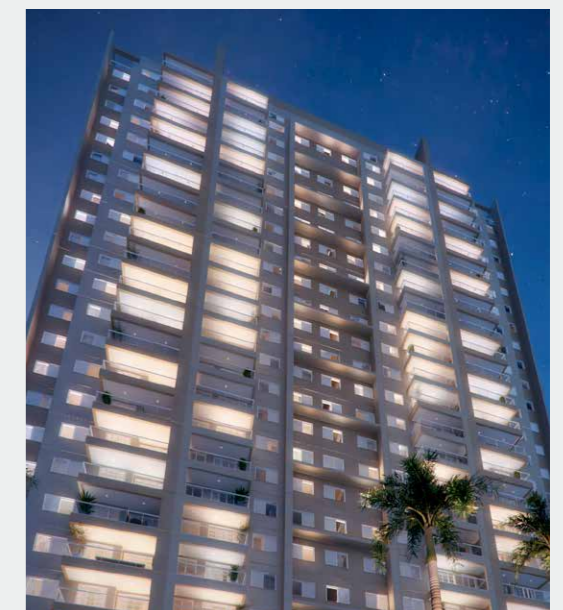
Double HomeClub & Mall

Entregue em outubro de 2012 160 Unidades comerciais