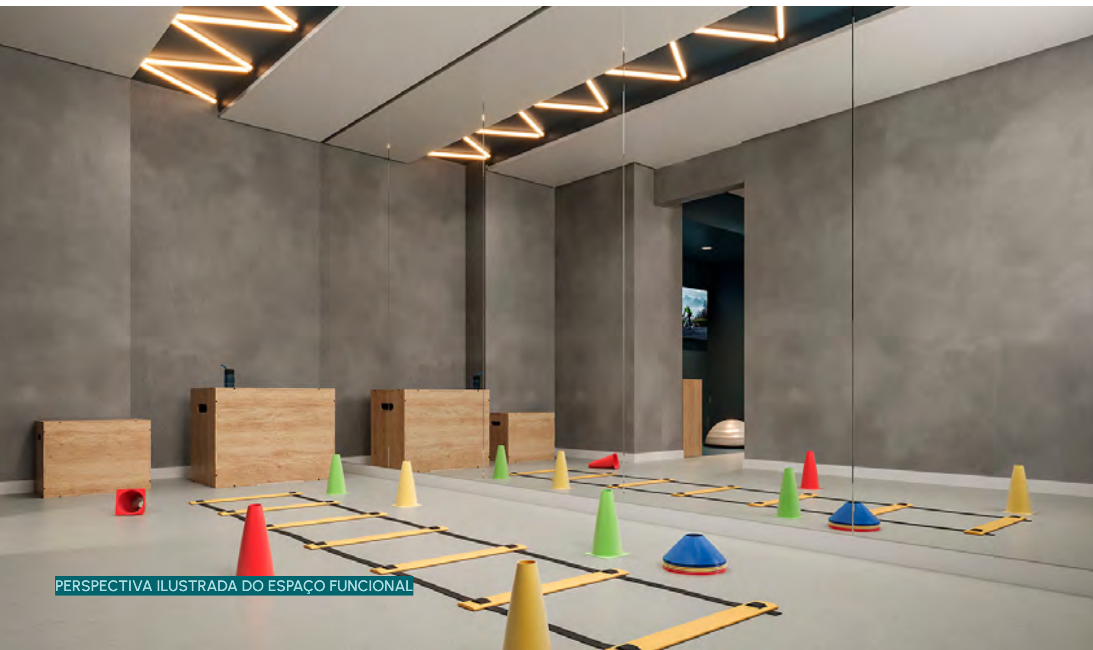
PERSPECTIVA ILUSTRADA DO ESPAÇO FUNCIONAL