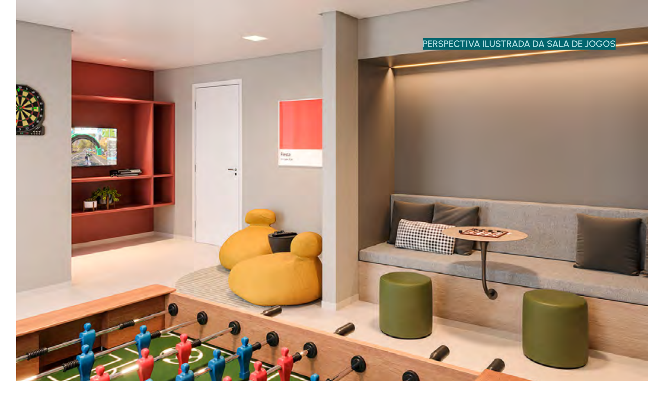
PERSPECTIVA ILUSTRADA DA SALA DE JOGOS