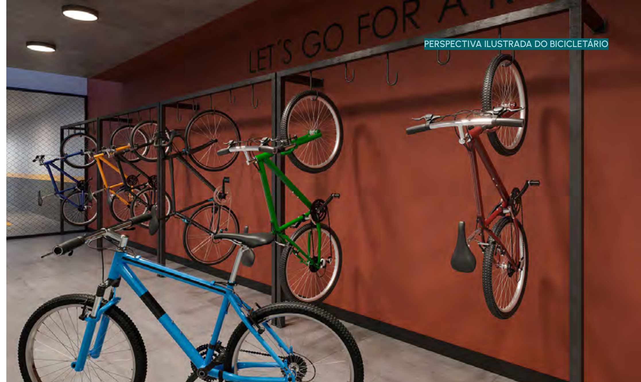
PERSPECTIVA ILUSTRADA DO BICICLETÁRIO

VIVER BEM É TER TUDO O QUE VOCÊ PRECISA EM UM SÓ LUGAR