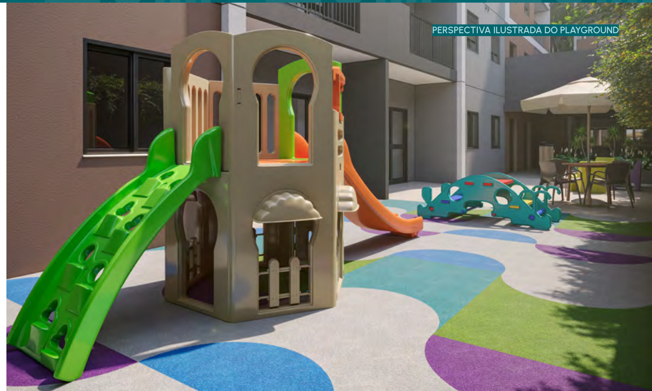
PERSPECTIVA ILUSTRADA DO PLAYGROUND

VIVER BEM É TER ESPAÇOS PARA AS CRIANÇAS PODEREM CRESCER, SE DESENVOLVENDO, E QUE POSSAM RECEBER SEUS AMIGOS.