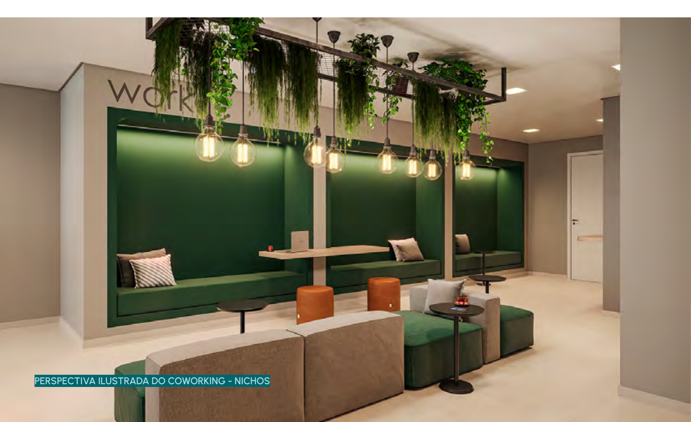
PERSPECTIVA ILUSTRADA DO COWORKING - NICHOS