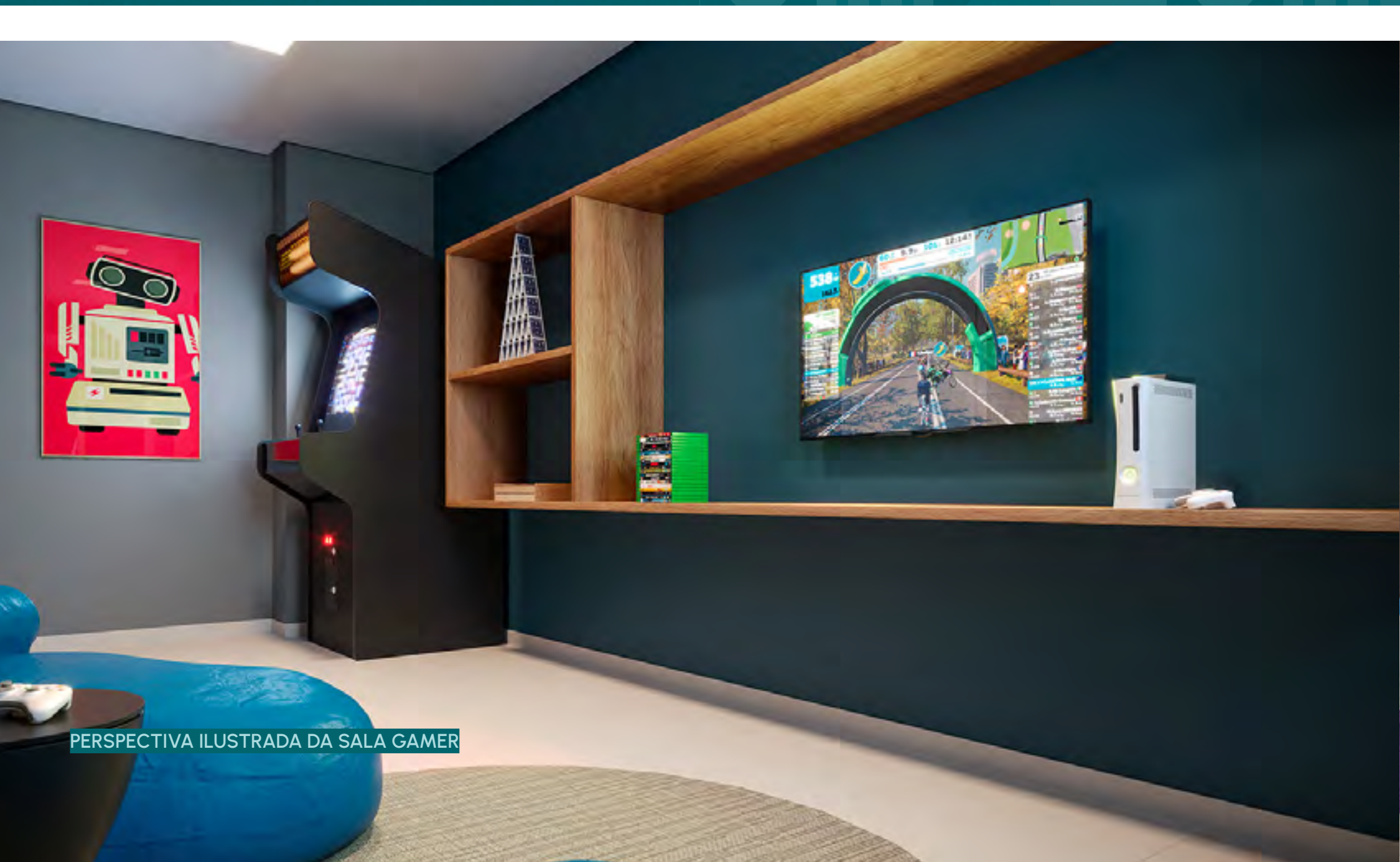
PERSPECTIVA ILUSTRADA DA SALA GAMER