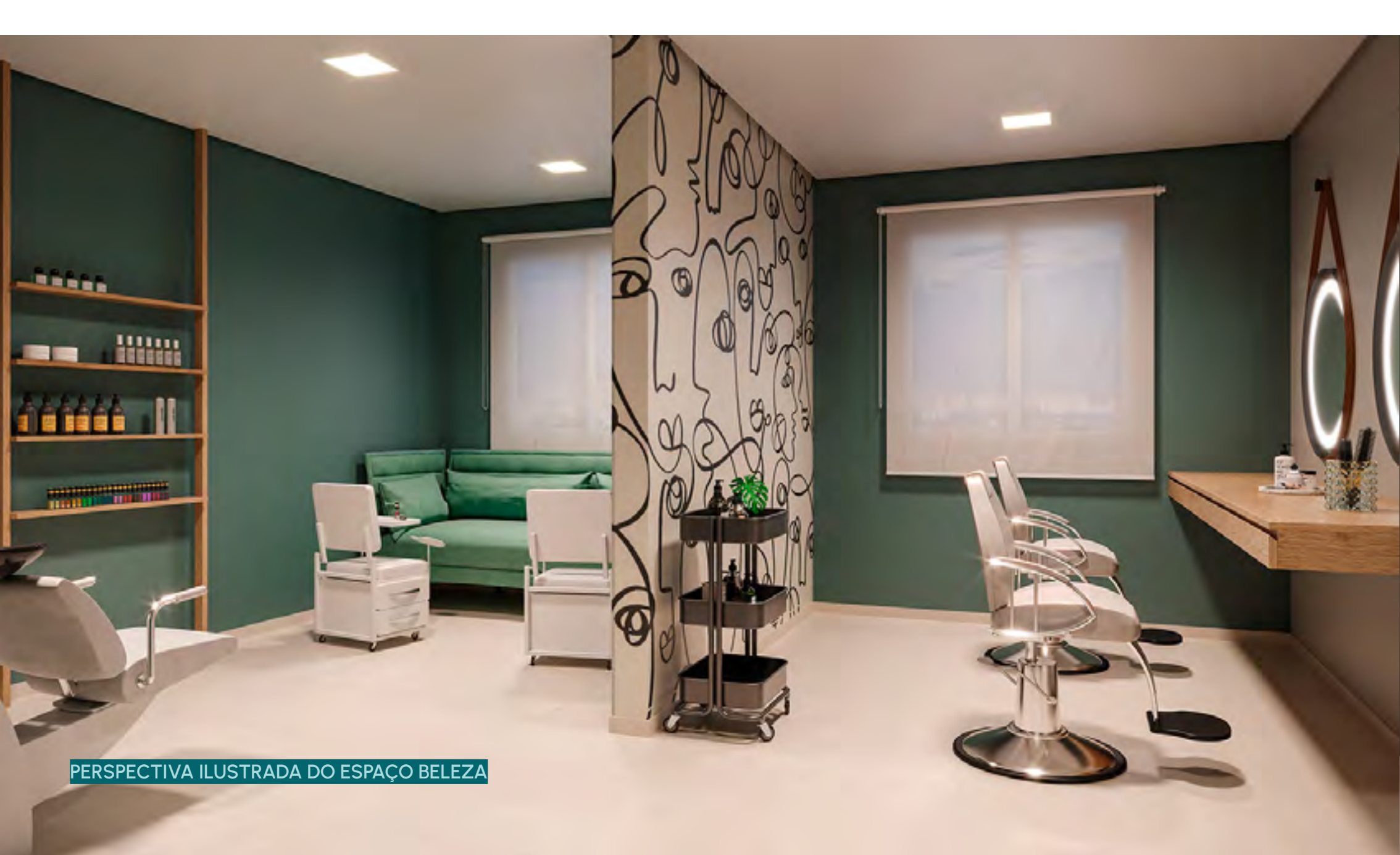
PERSPECTIVA ILUSTRADA DO ESPAÇO BELEZA