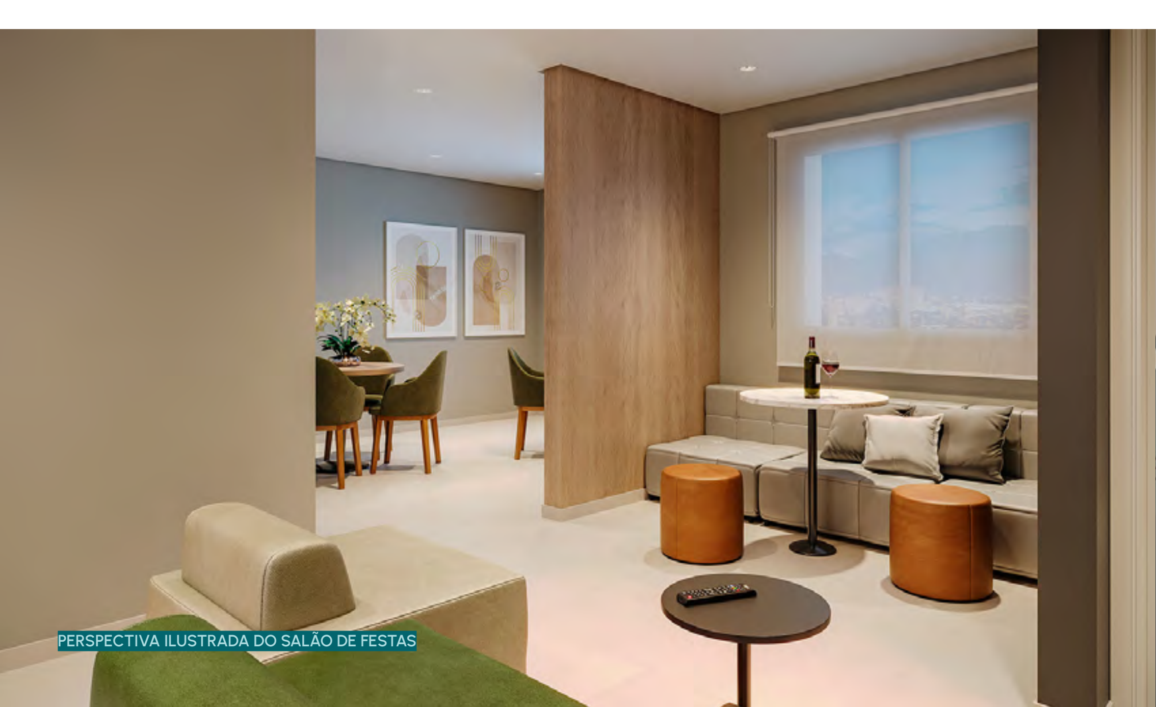
PERSPECTIVA ILUSTRADA DO SALÃO DE FESTAS