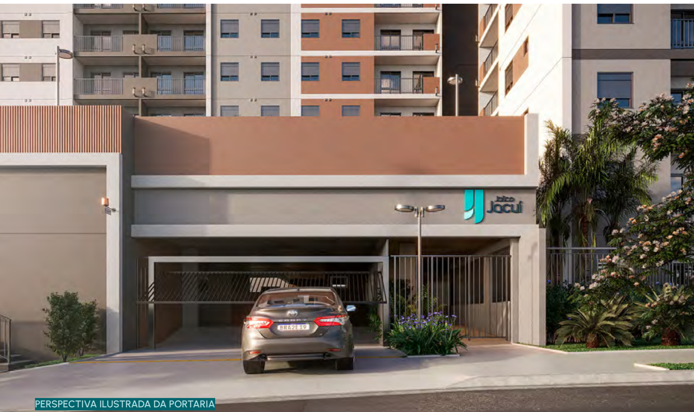
PERSPECTIVA ILUSTRADA DA PORTARIA