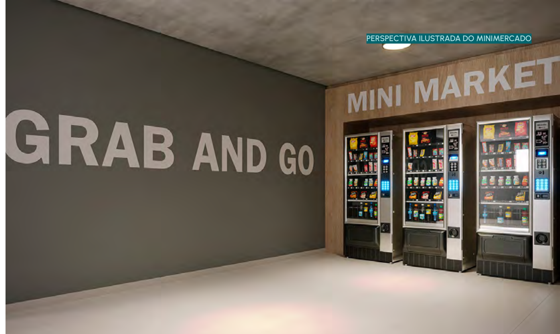
PERSPECTIVA ILUSTRADA DO MINIMERCADO