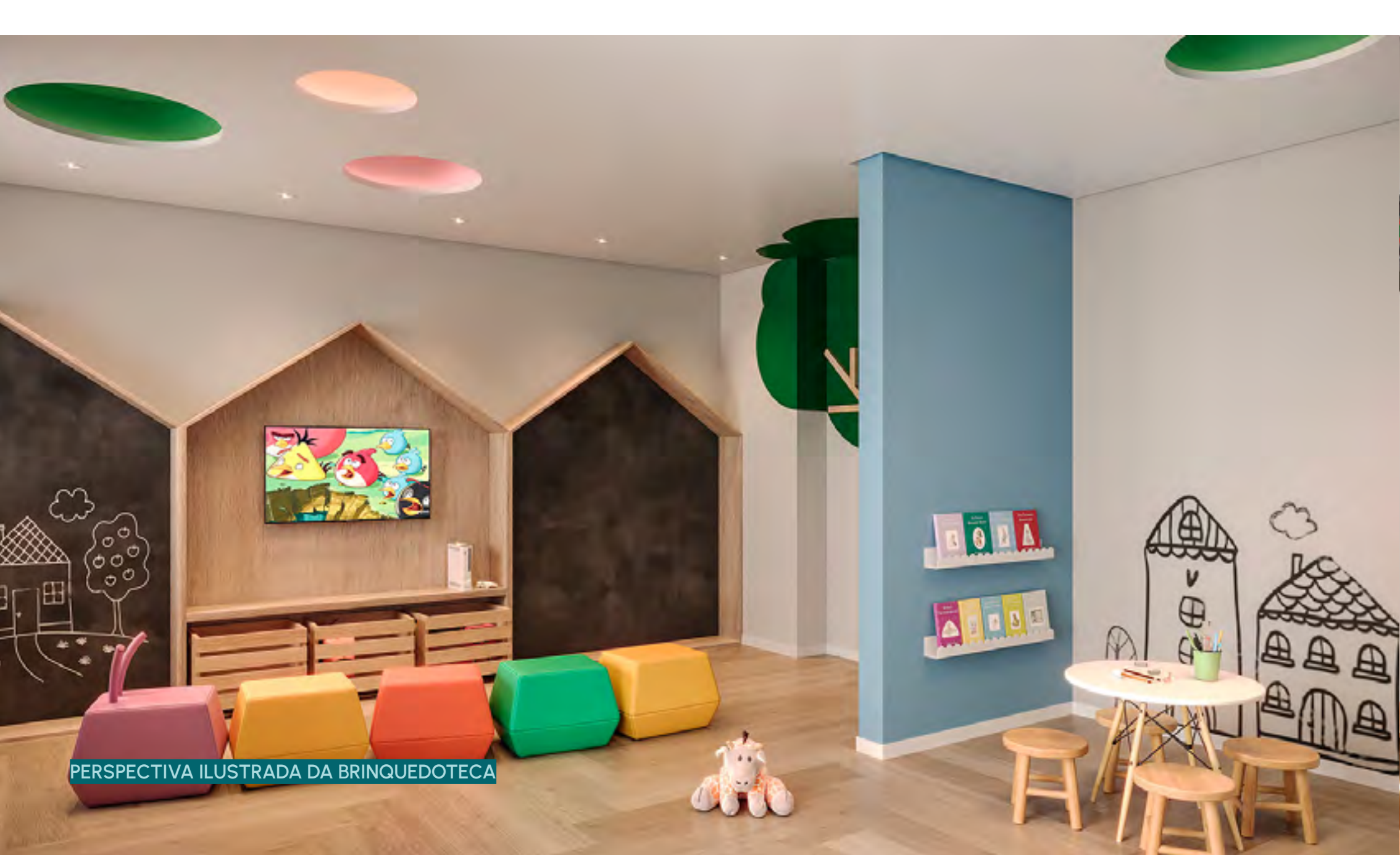
PERSPECTIVA ILUSTRADA DA BRINQUEDOTECA