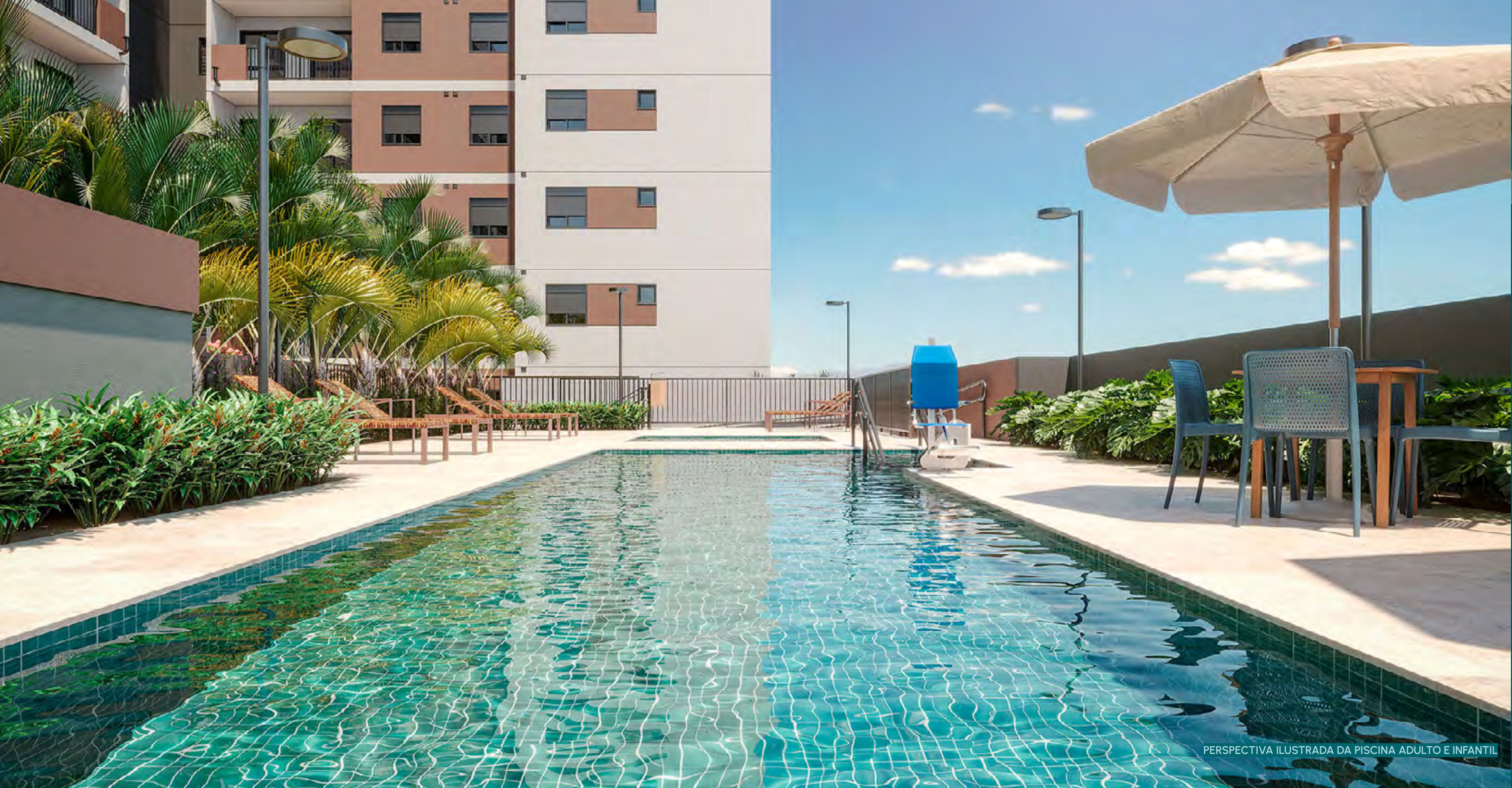
PERSPECTIVA ILUSTRADA DA PISCINA ADULTO E INFANTIL