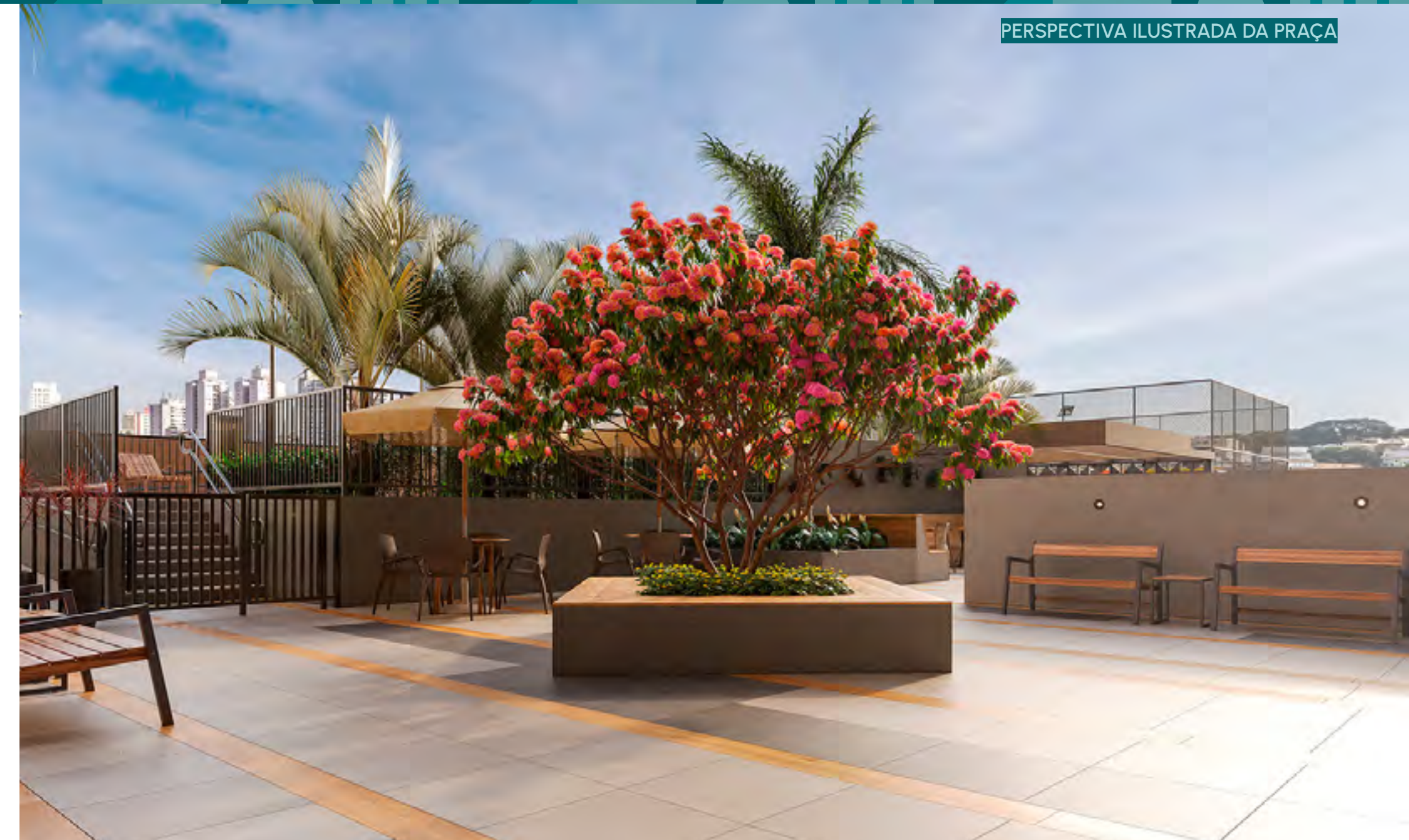
PERSPECTIVA ILUSTRADA DA PRAÇA

VIVER BEM É TER UMA PORTARIA ARROJADA, QUE IMPRESSIONA JÁ NA ENTRADA.