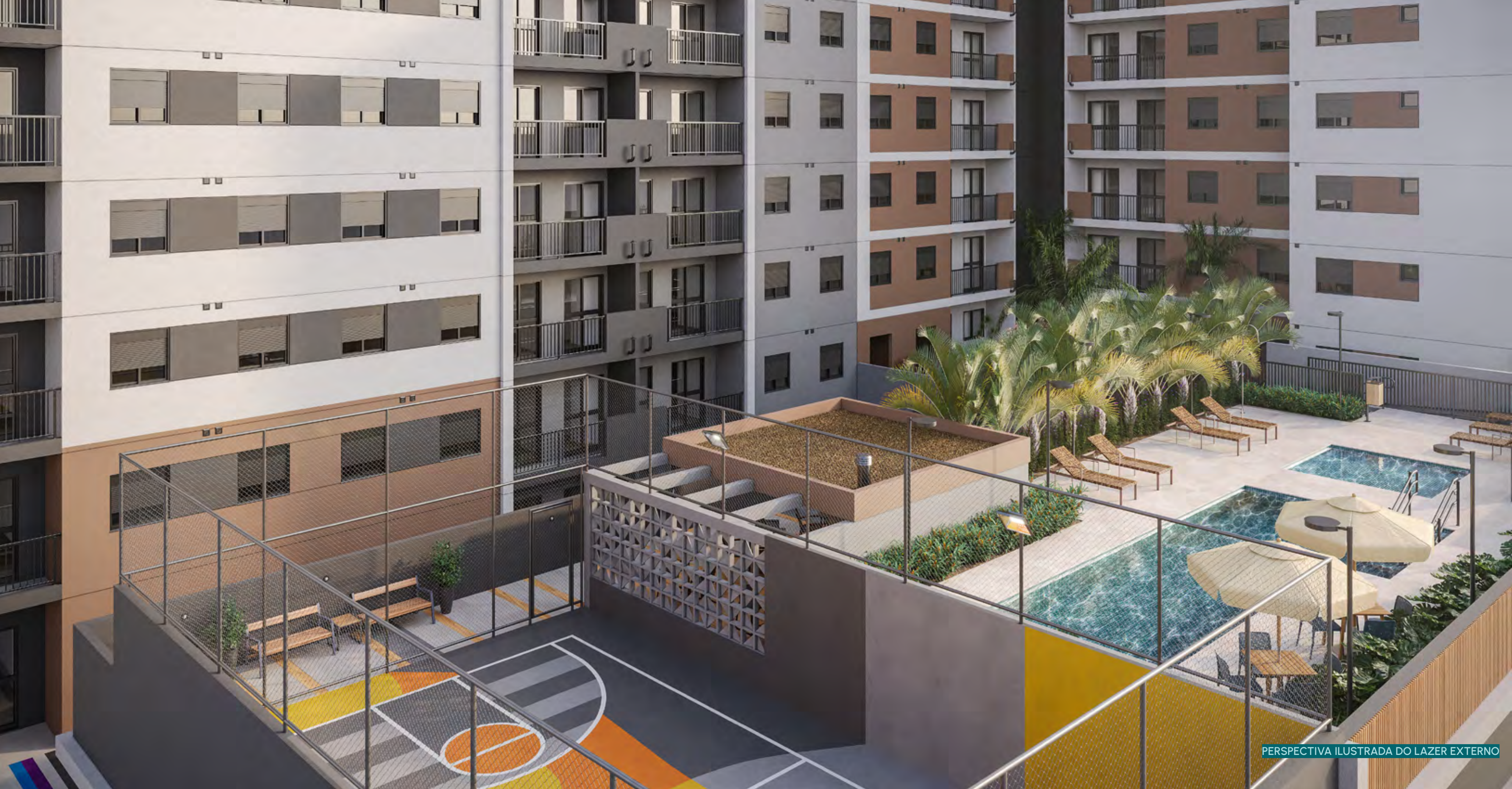
PERSPECTIVA ILUSTRADA DO LAZER EXTERNO