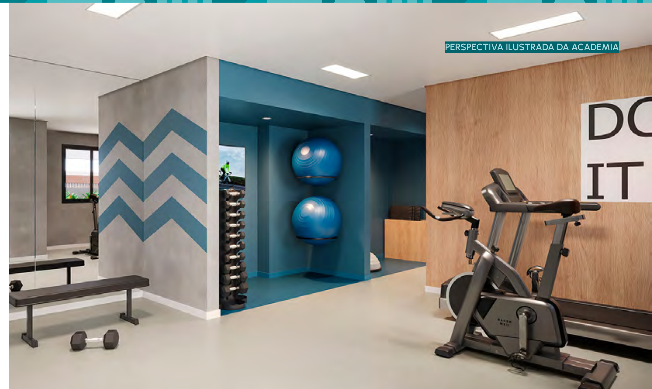
PERSPECTIVA ILUSTRADA DA ACADEMIA

VIVER BEM É PODER CUIDAR DA SAÚDE, TER SEGURANÇA E CONFORTO, TODOS OS DIAS