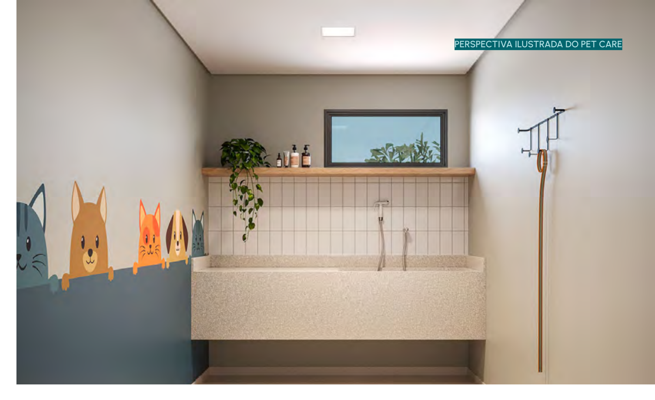
PERSPECTIVA ILUSTRADA DO PET CARE

VIVER BEM É TER ESPAÇOS PARA MOMENTOS DE ALEGRIA COM A FAMÍLIA E AMIGOS.