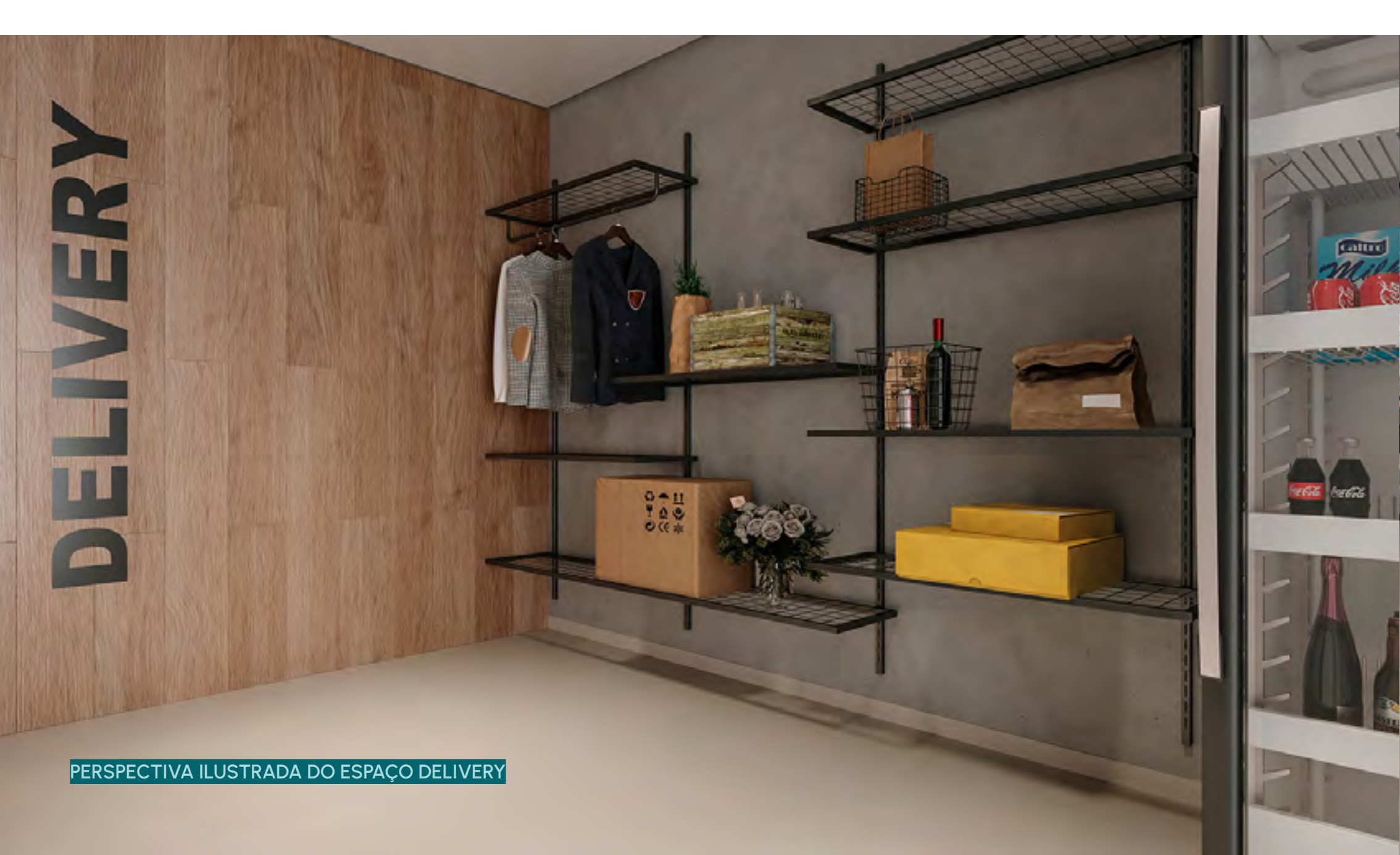
PERSPECTIVA ILUSTRADA DO ESPAÇO DELIVERY