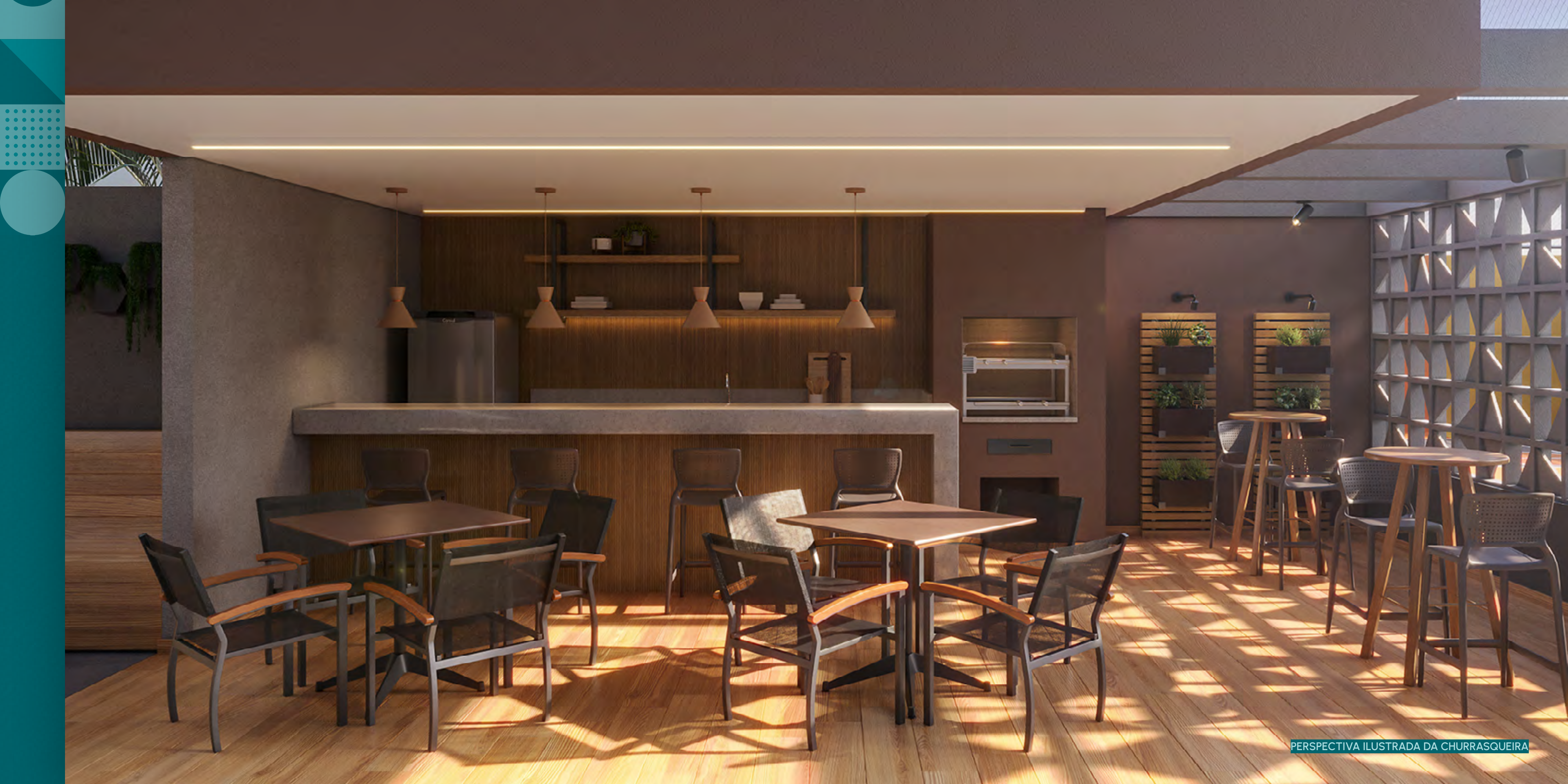
PERSPECTIVA ILUSTRADA DA CHURRASQUEIRA