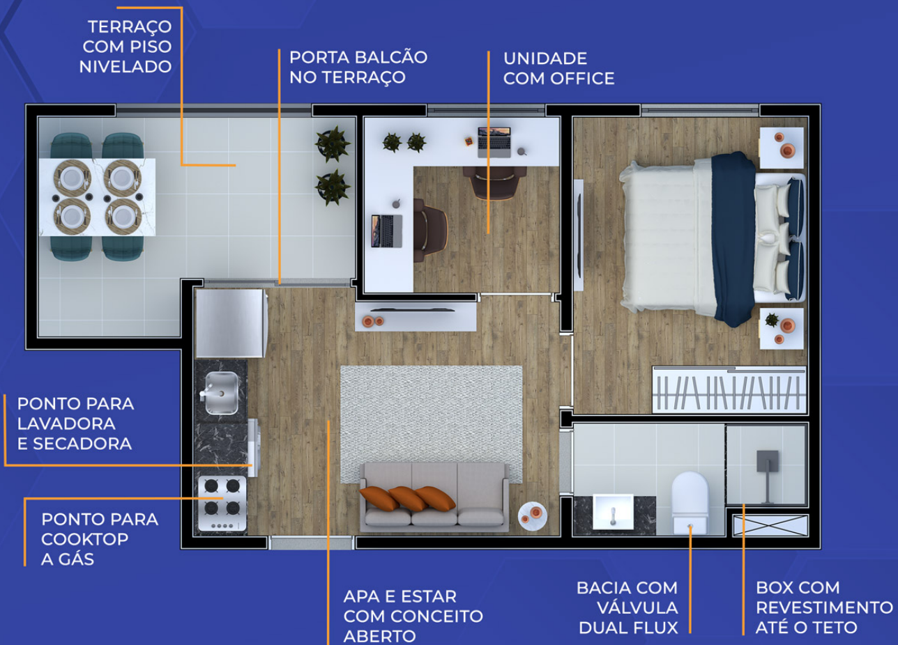
Ilustração artística da planta com sugestão de decoração. Os móveis, utensílios, adornos e equipamentos não fazem parte do contrato de venda e compra. Acabamentos e revestimentos serão entregues conforme memorial descritivo específico. Esta planta poderá sofrer variações decorrentes do atendimento de postura de órgãos públicos e concessionárias.