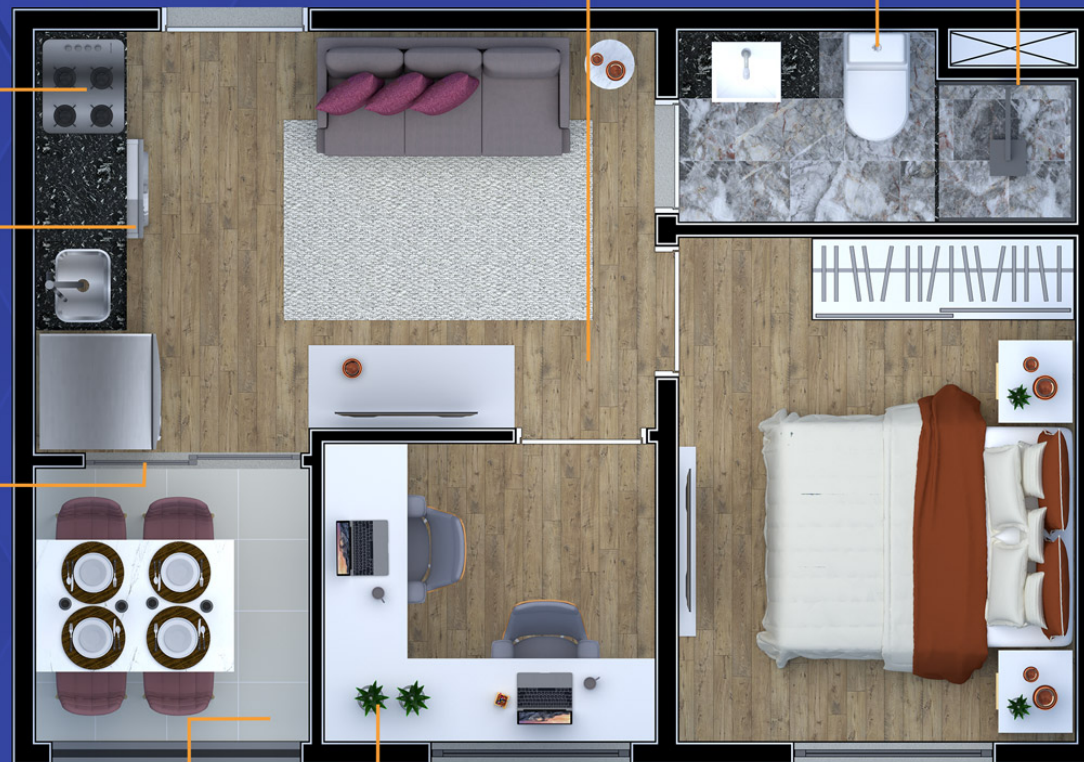
Ilustração artística da planta com sugestão de decoração. Os móveis, utensílios, adornos e equipamentos não fazem parte do contrato de venda e compra. Acabamentos e revestimentos serão entregues conforme memorial descritivo específico. Esta planta poderá sofrer variações decorrentes do atendimento de postura de órgãos públicos e concessionárias.