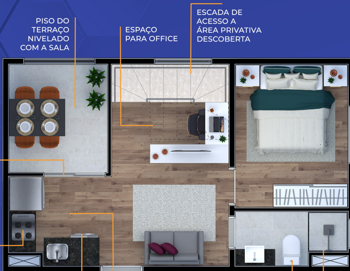
Ilustração artística da planta com sugestão de decoração. Os móveis, utensílios, adornos e equipamentos não fazem parte do contrato de venda e compra. Acabamentos e revestimentos serão entregues conforme memorial descritivo específico. Esta planta poderá sofrer variações decorrentes do atendimento de postura de órgãos públicos e concessionárias.