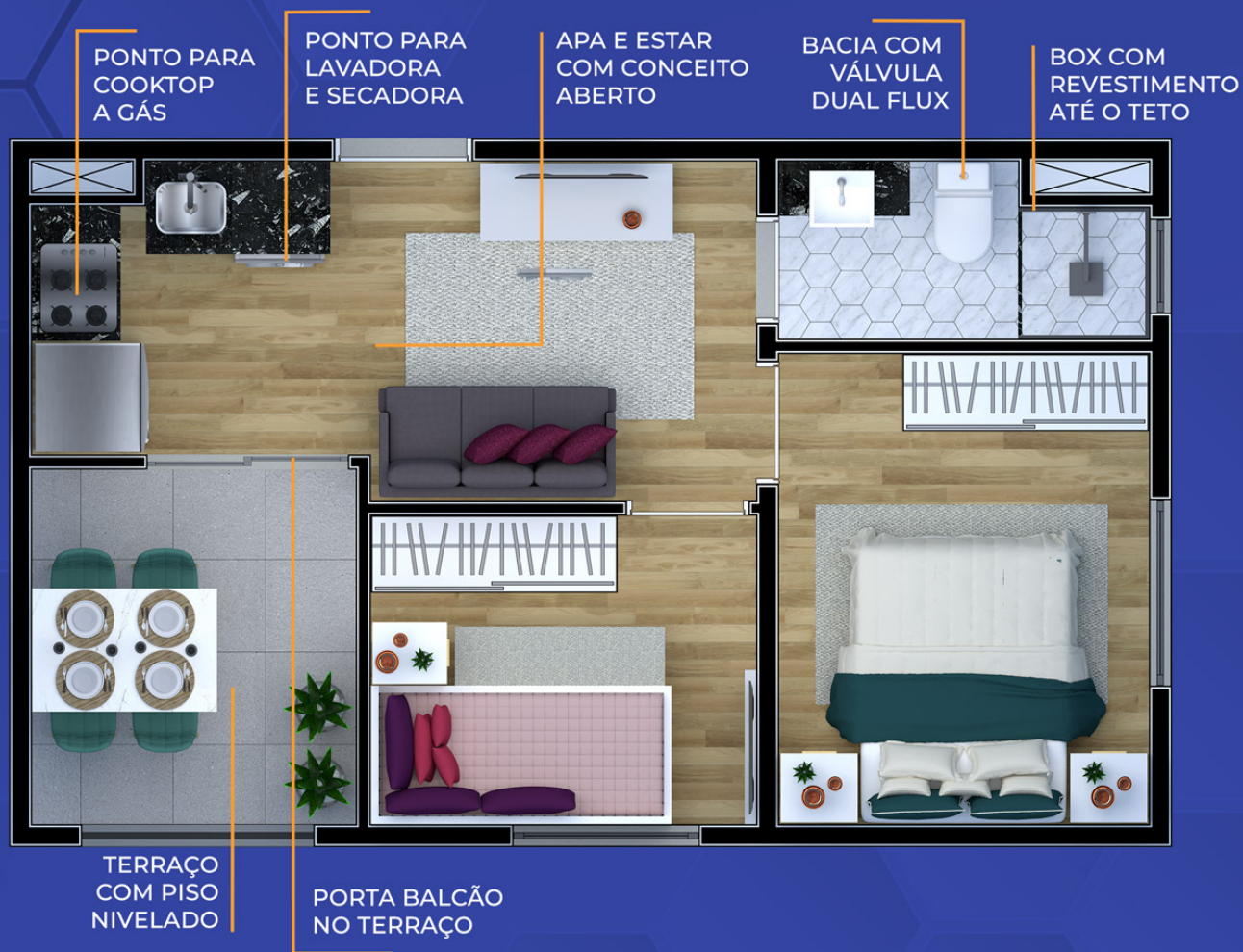
Ilustração artística da planta com sugestão de decoração. Os móveis, utensílios, adornos e equipamentos não fazem parte do contrato de venda e compra. Acabamentos e revestimentos serão entregues conforme memorial descritivo específico. Esta planta poderá sofrer variações decorrentes do atendimento de postura de órgãos públicos e concessionárias.