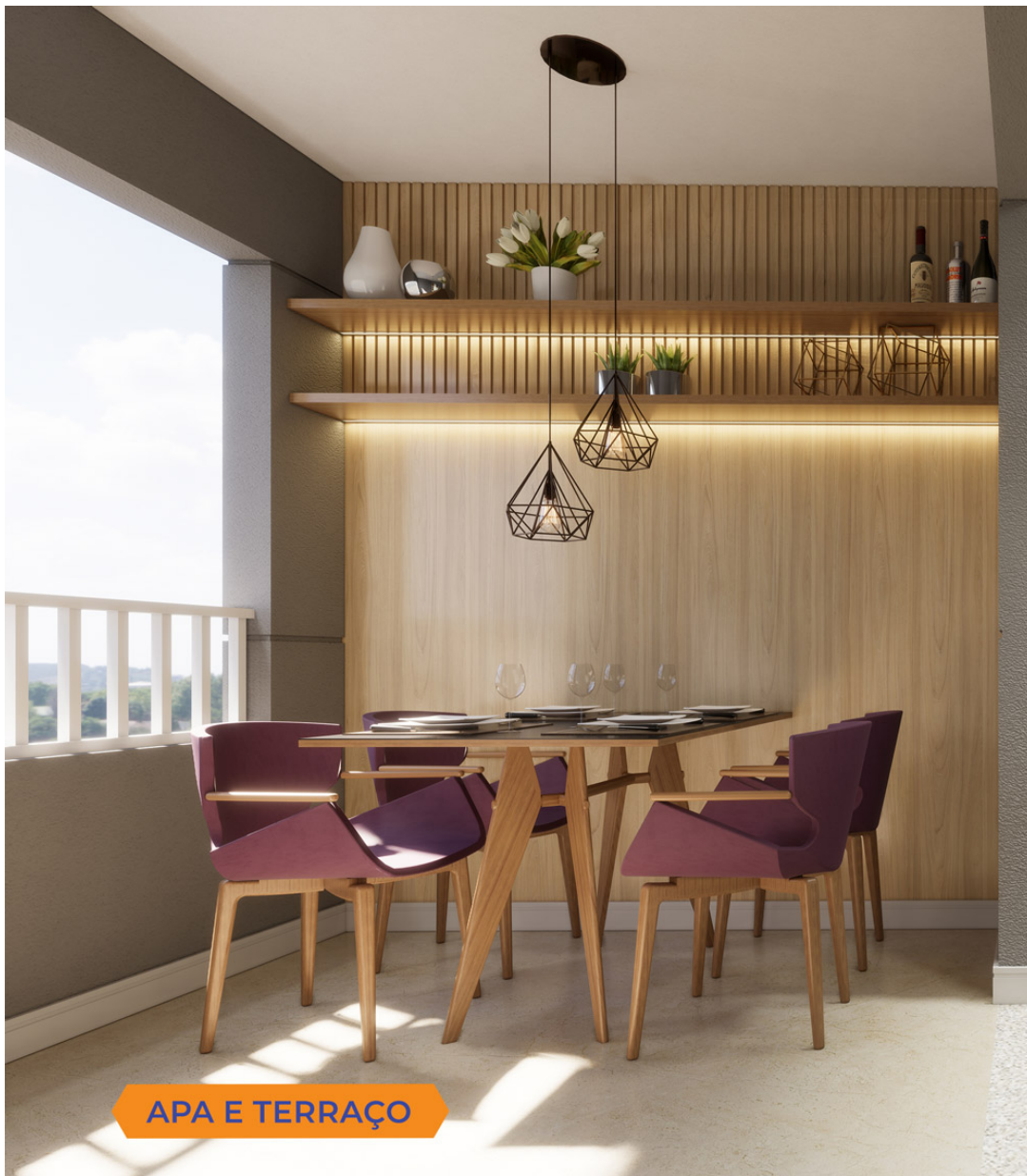
APA E TERRAÇO