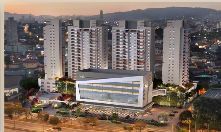
Patteo São Paulo – São Paulo