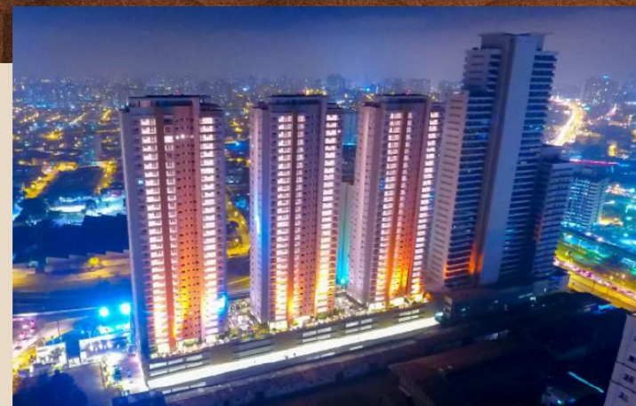
MOVEMENT CITY & LIFE