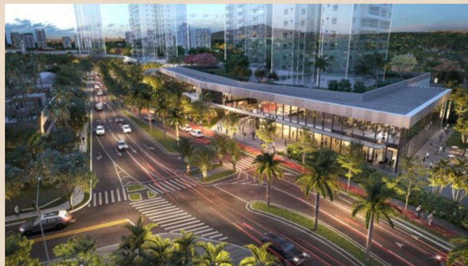
ComVem Elo - São Paulo - SP