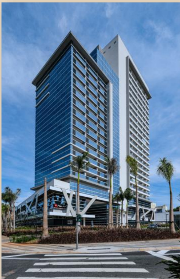
Patteo Bosque Maia - Guarulhos