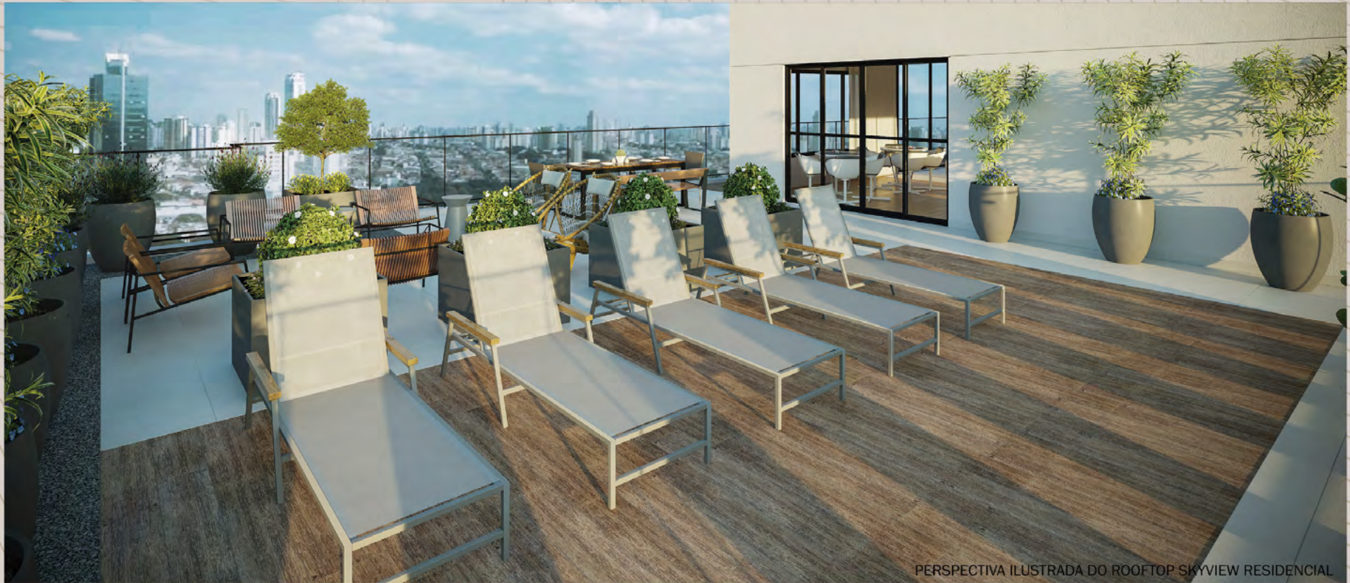
PERSPECTIVA ILUSTRADA DO ROOFTOP SKYVIEW RESIDENCIAL