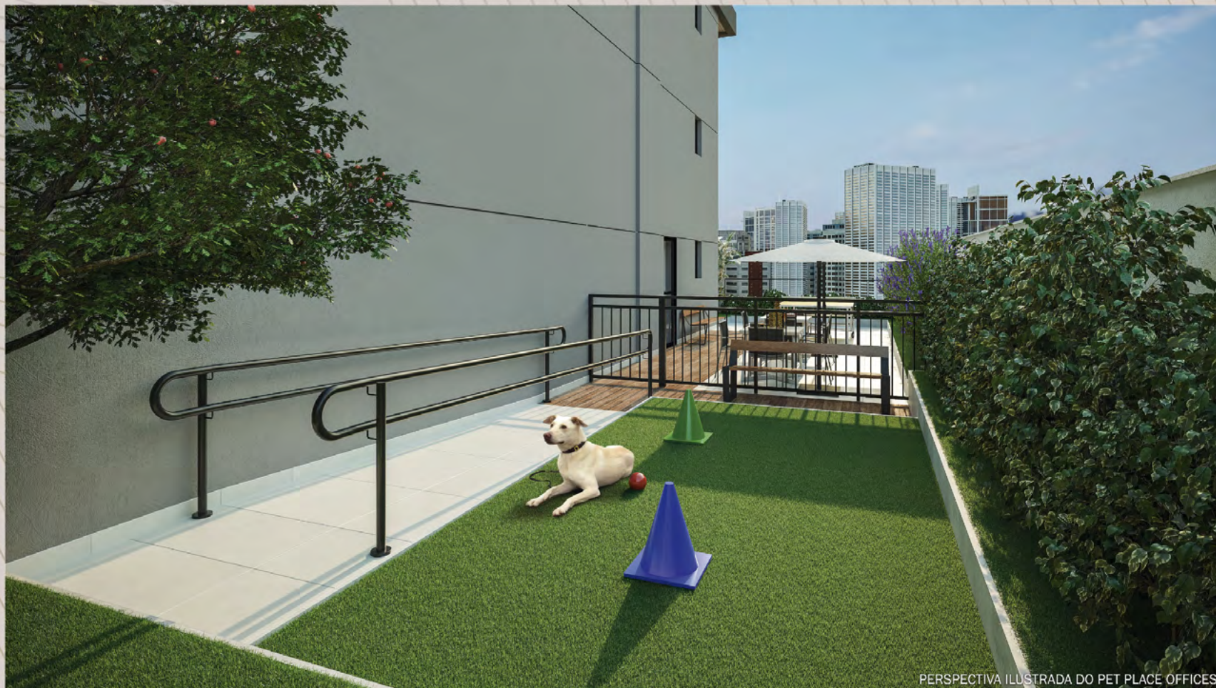
PERSPECTIVA ILUSTRADA DO PET PLACE OFFICES

Ilustração artística com sugestão de decoração. Móveis, utensílios e objetos de decoração são meramente ilustrativos e não fazem parte do contrato de compra e venda. Os acabamentos serão entregues conforme memorial descritivo do empreendimento