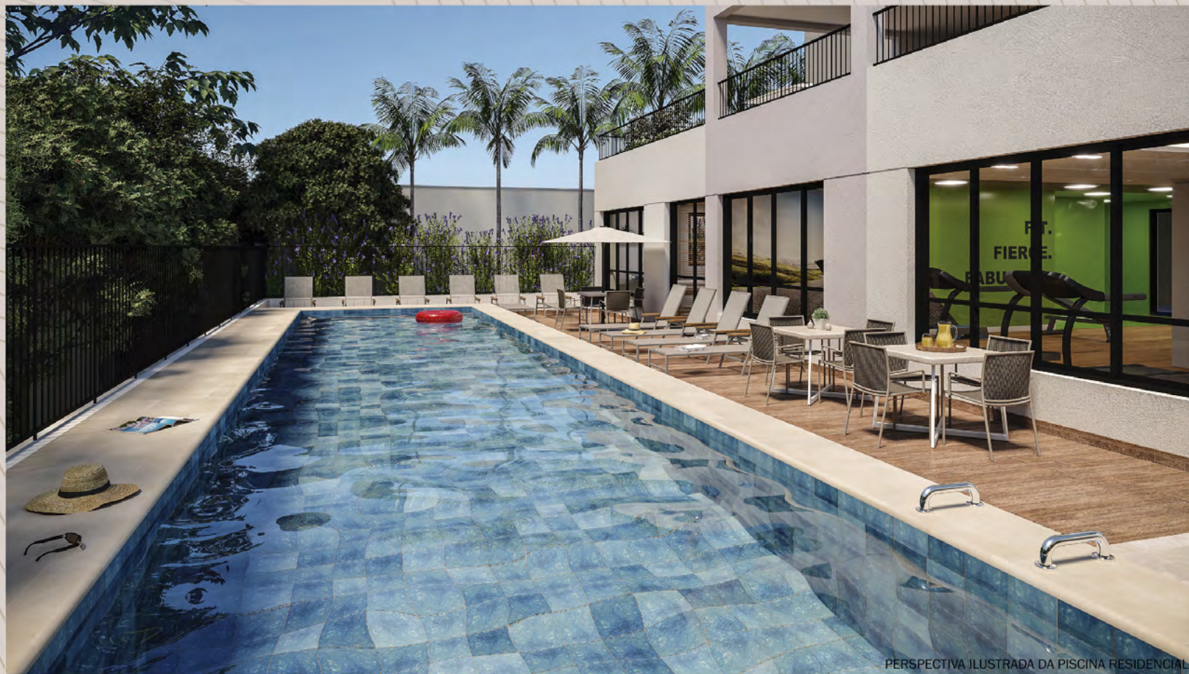
PERSPECTIVA ILUSTRADA DA PISCINA RESIDENCIAL