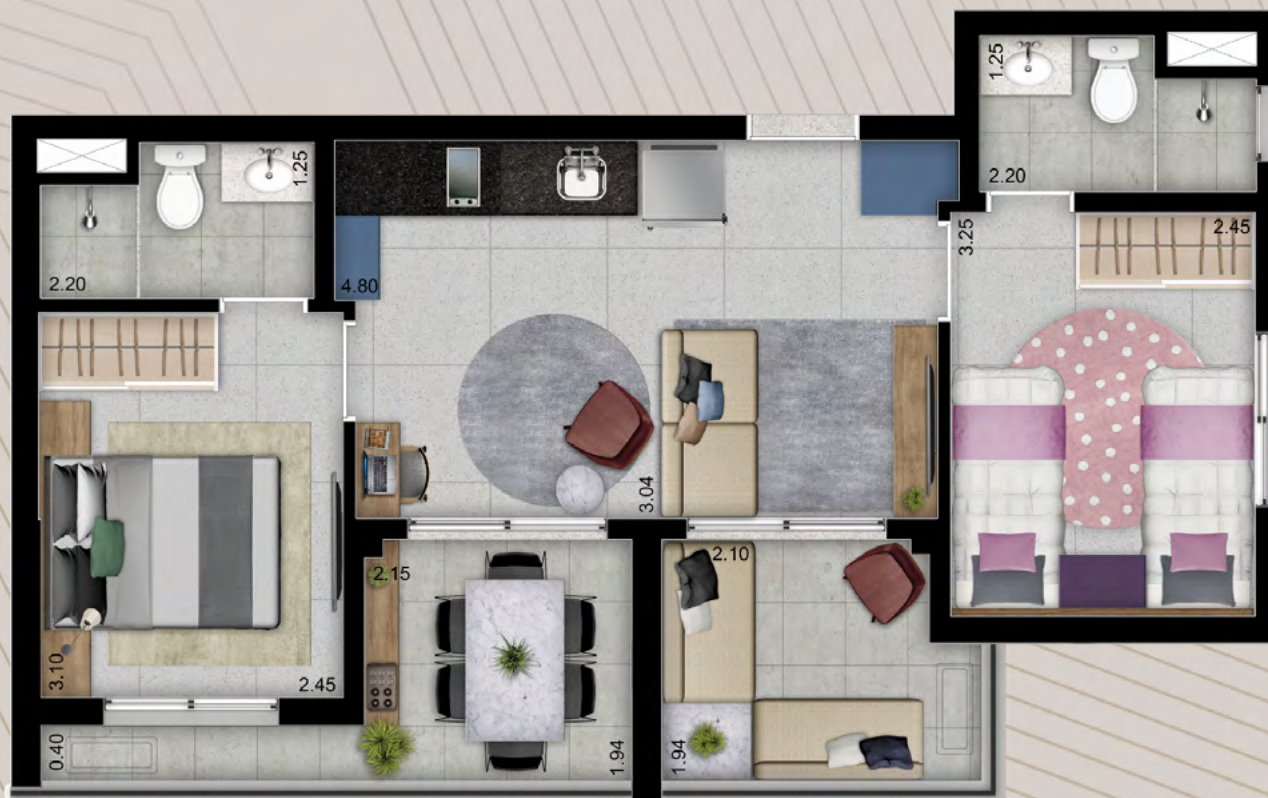
PLANTA 2 SUÍTES - JUNÇÃO STUDIO FINAL 01 E 02