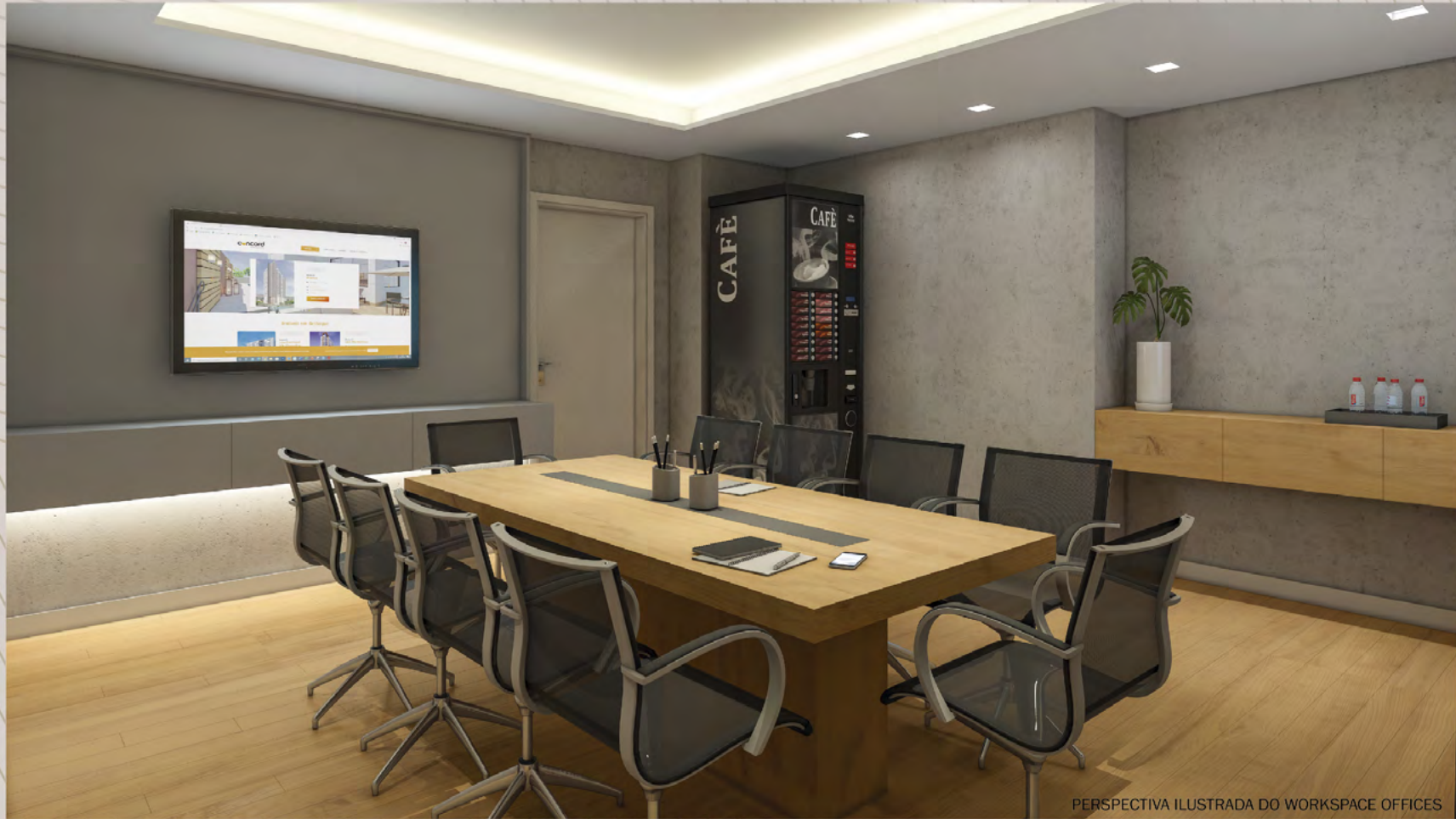
PERSPECTIVA ILUSTRADA DO WORKSPACE OFFICES