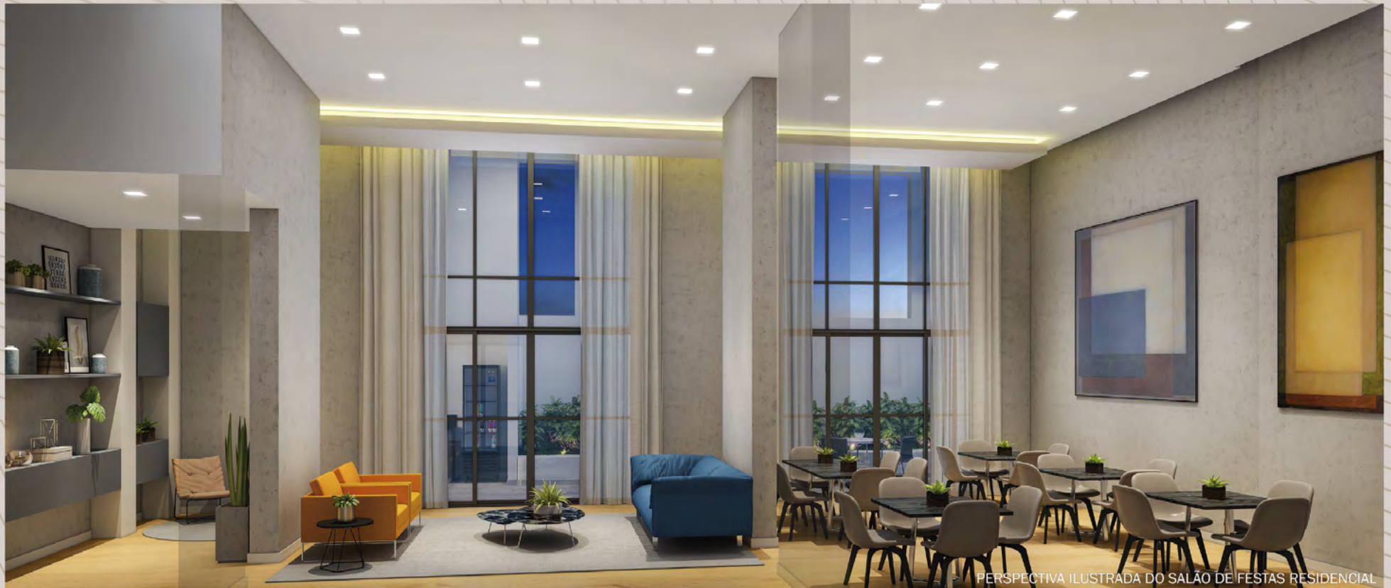
PERSPECTIVA ILUSTRADA DO SALÃO DE FESTAS RESIDENCIAL