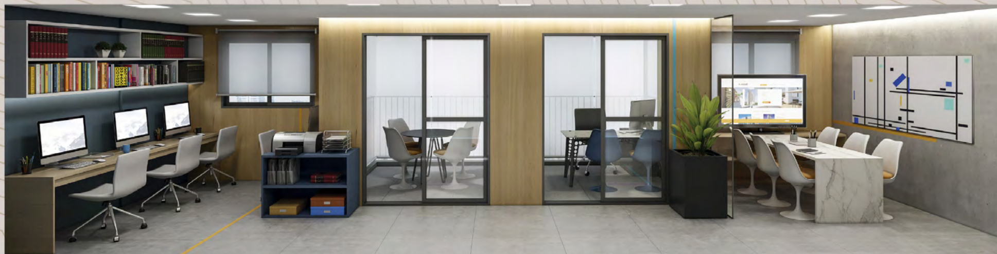
Ilustração artística com sugestão de decoração. Móveis, utensílios e objetos de decoração são meramente ilustrativos e não fazem parte do contrato de compra e venda. Os acabamentos serão entregues conforme memorial descritivo do empreendimento