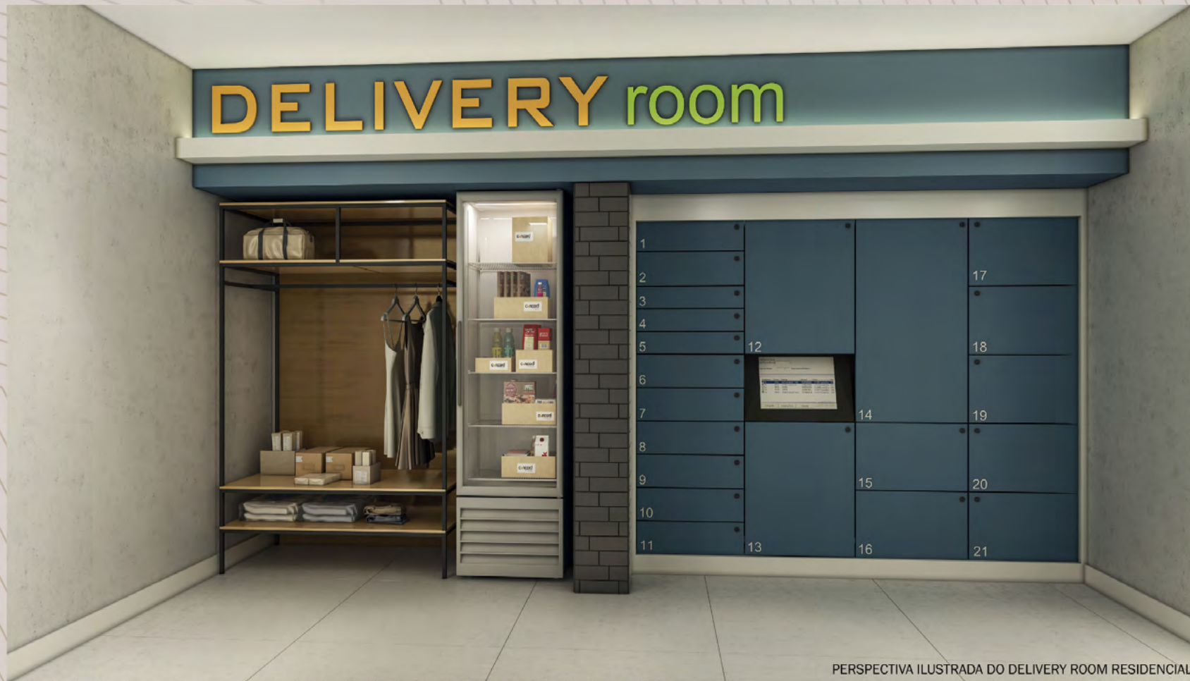
PERSPECTIVA ILUSTRADA DO DELIVERY ROOM RESIDENCIAL