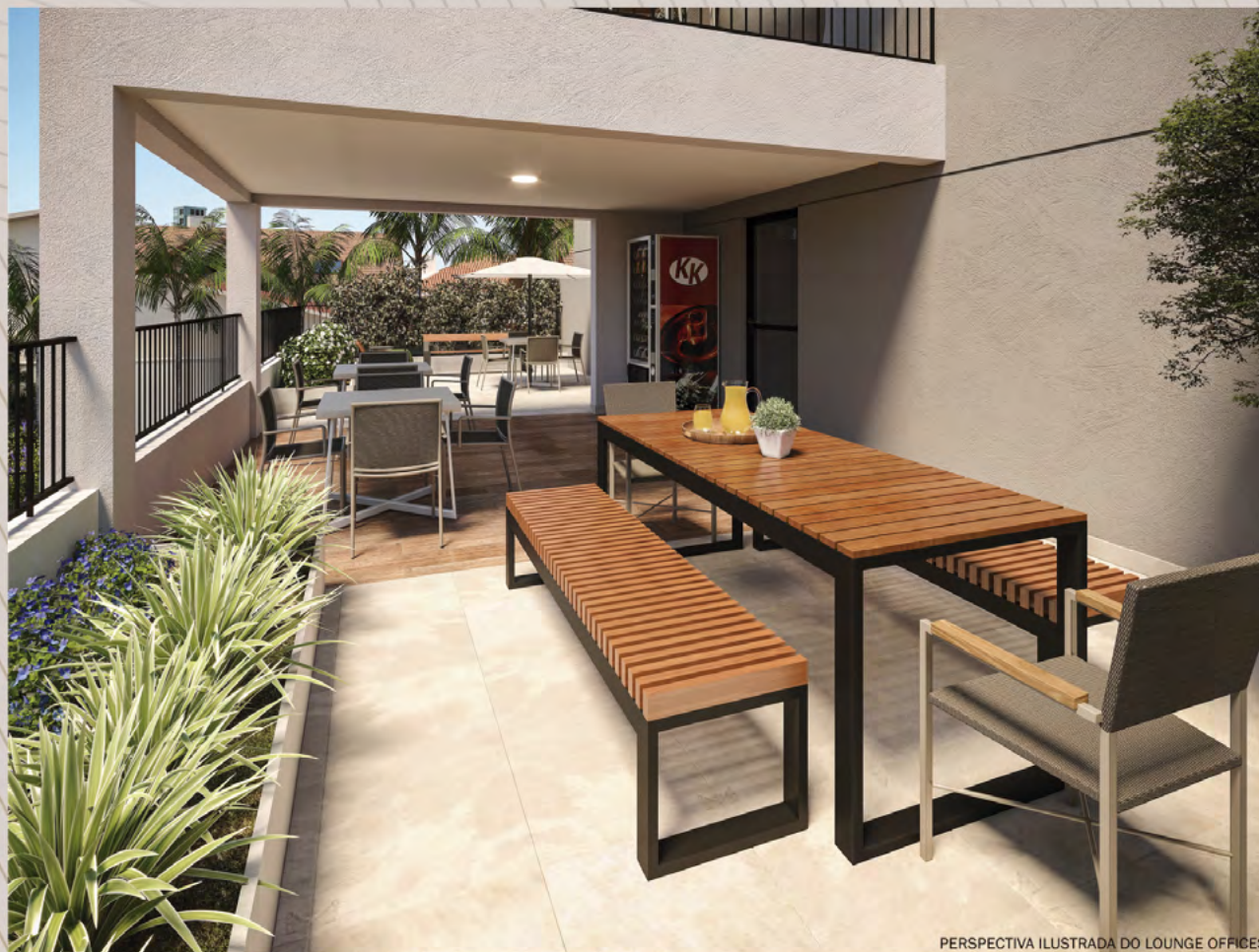
PERSPECTIVA ILUSTRADA DO LOUNGE OFFICES

Ilustração artística com sugestão de decoração. Móveis, utensílios e objetos de decoração são meramente ilustrativos e não fazem parte do contrato de compra e venda. Os acabamentos serão entregues conforme memorial descritivo do empreendimento