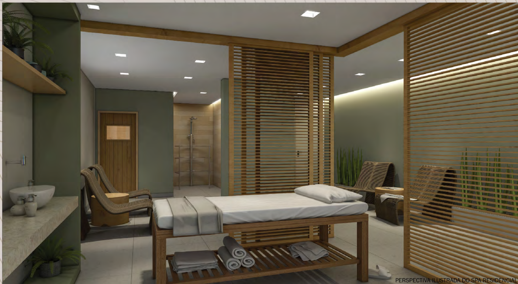
PERSPECTIVA ILUSTRADA DO SPA RESIDENCIAL

Ilustração artística com sugestão de decoração. Móveis, utensílios e objetos de decoração são meramente ilustrativos e não fazem parte do contrato de compra e venda. Os acabamentos serão entregues conforme memorial descritivo do empreendimento