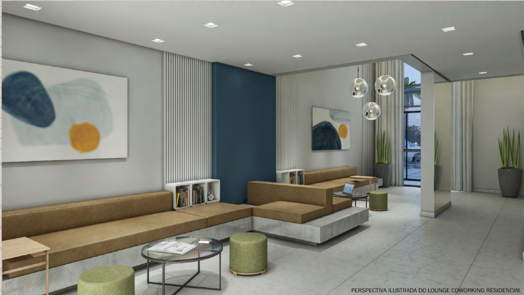
PERSPECTIVA ILUSTRADA DO LOUNGE COWORKING RESIDENCIAL