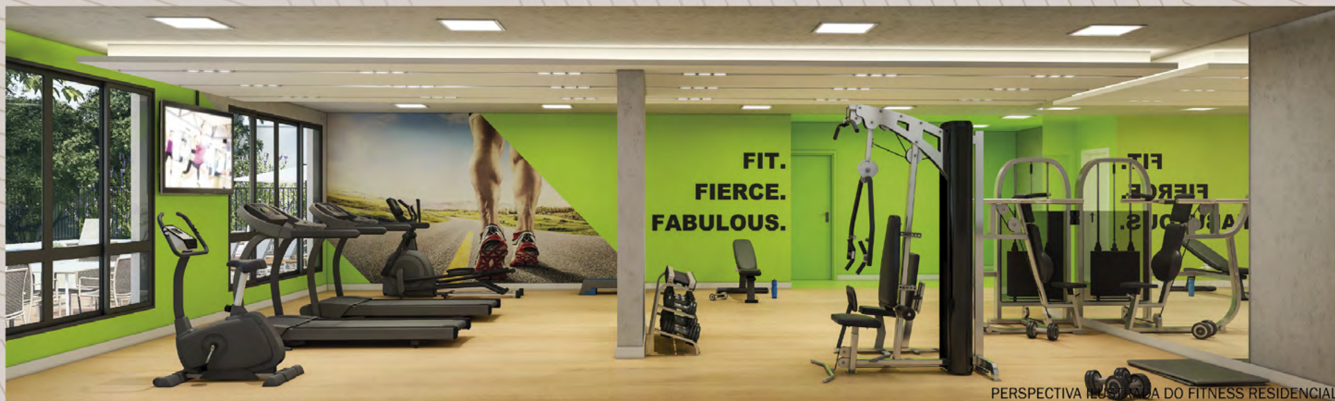
PERSPECTIVA ILUSTRADA DO FITNESS RESIDENCIAL