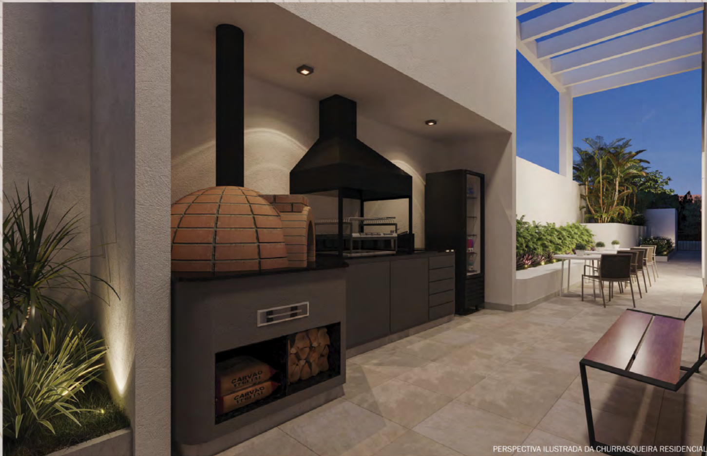
PERSPECTIVA ILUSTRADA DA CHURRASQUEIRA RESIDENCIAL