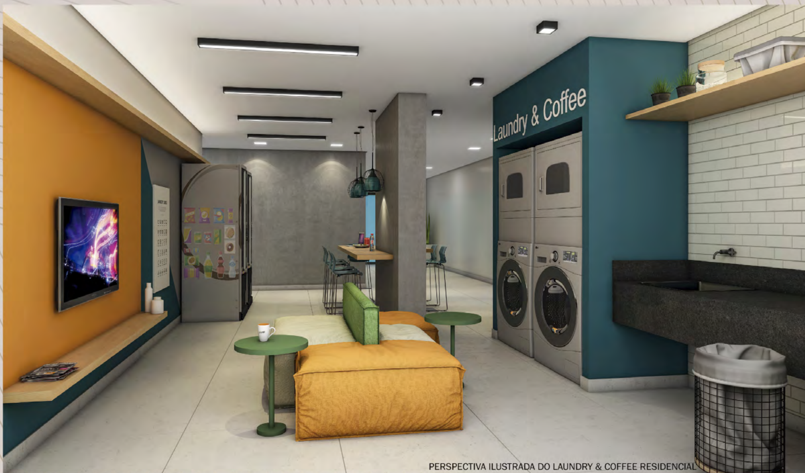
PERSPECTIVA ILUSTRADA DO LAUNDRY & COFFE RESIDENCIAL