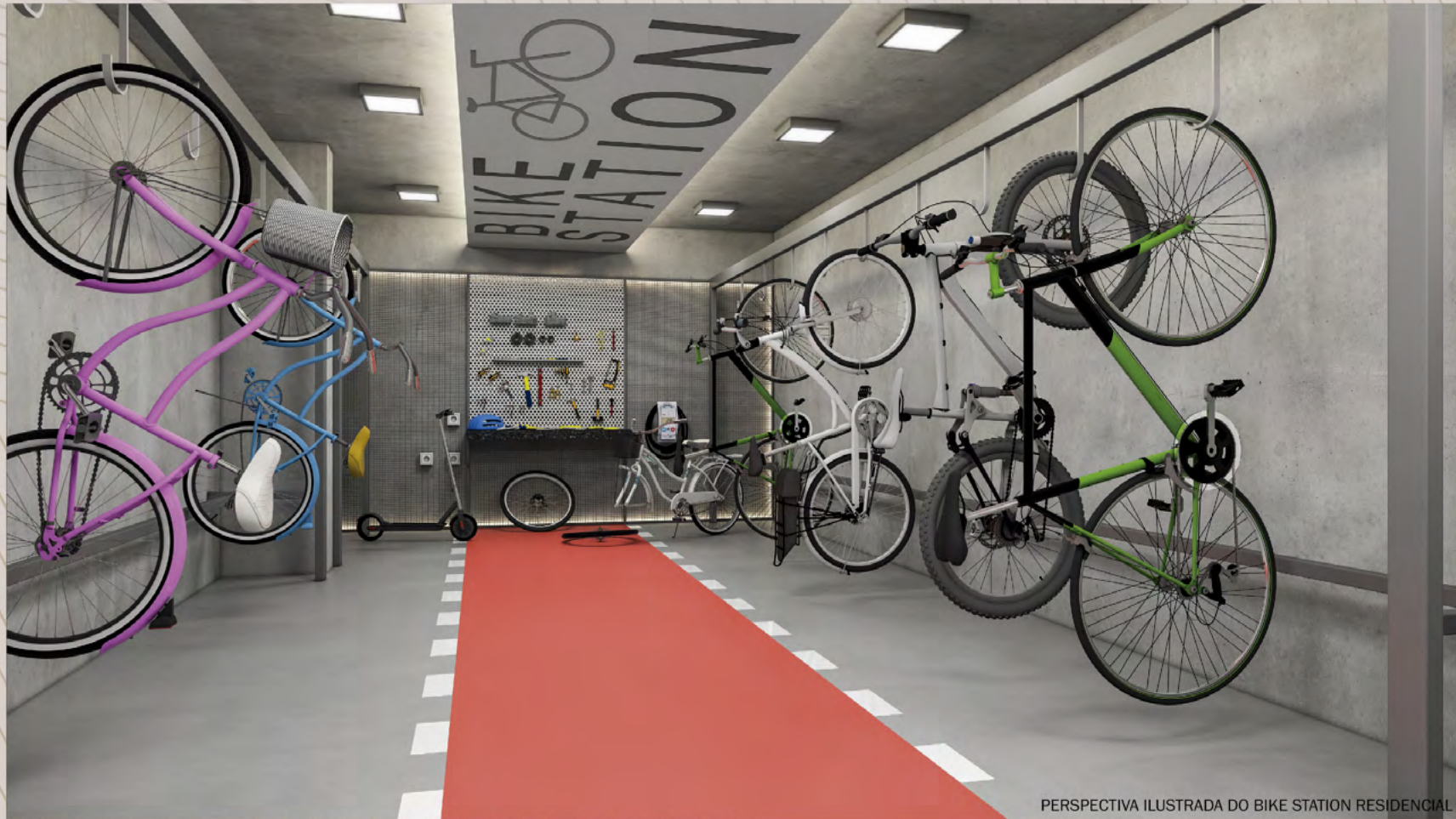
PERSPECTIVA ILUSTRADA DO BIKE STATION RESIDENCIAL

Ilustração artística com sugestão de decoração. Móveis, utensílios e objetos de decoração são meramente ilustrativos e não fazem parte do contrato de compra e venda. Os acabamentos serão entregues conforme memorial descritivo do empreendimento