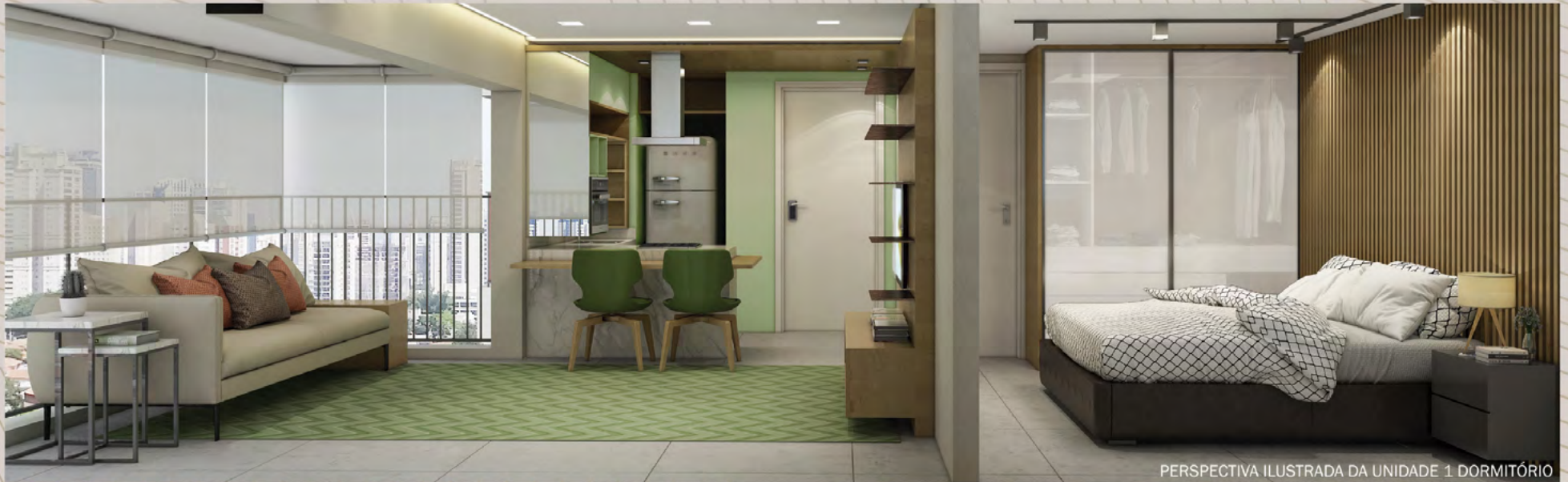
PERSPECTIVA ILUSTRADA DA UNIDADE 1 DORMITÓRIO