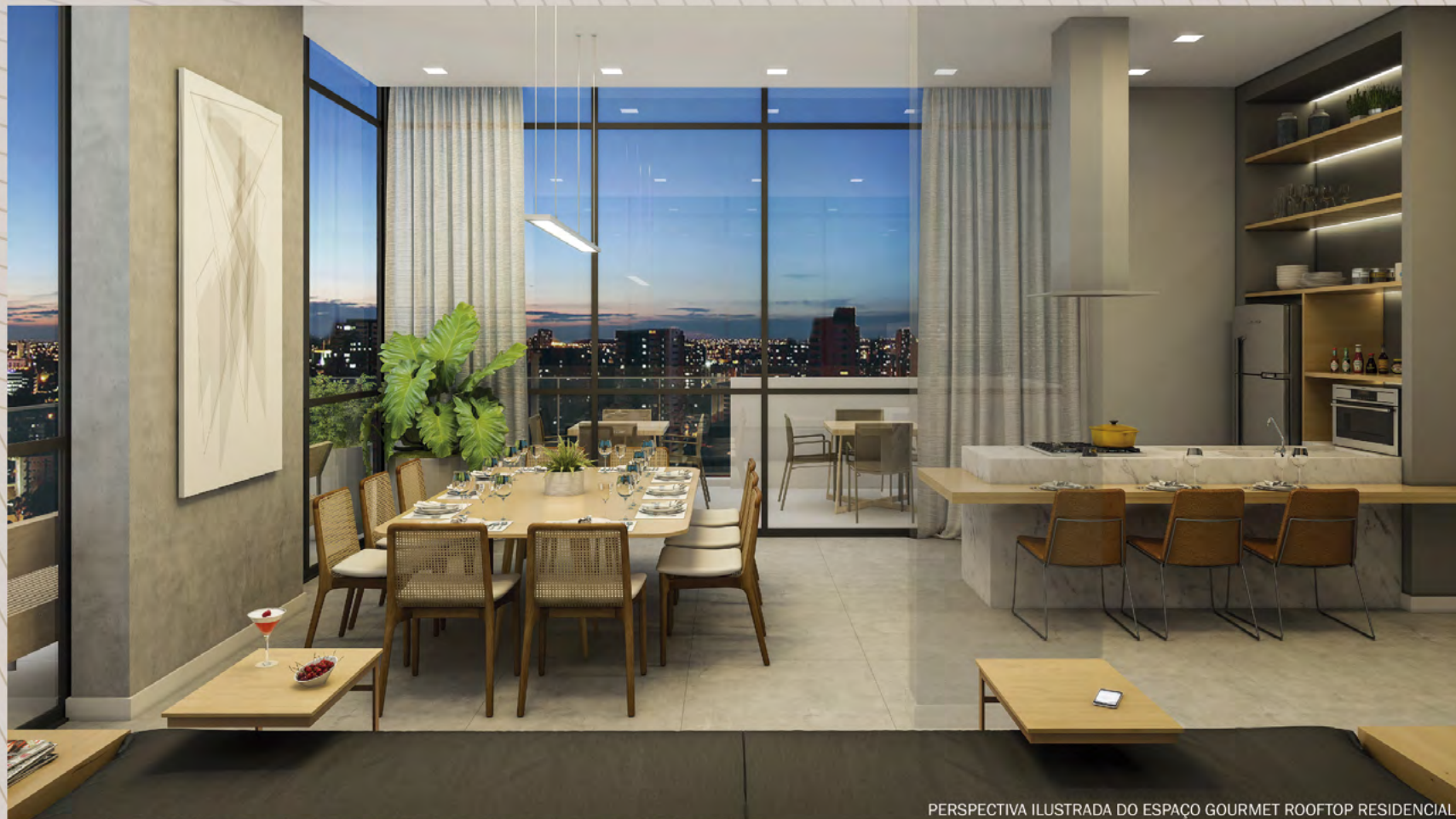
PERSPECTIVA ILUSTRADA DO ESPAÇO GOURMET ROOFTOP RESIDENCIAL