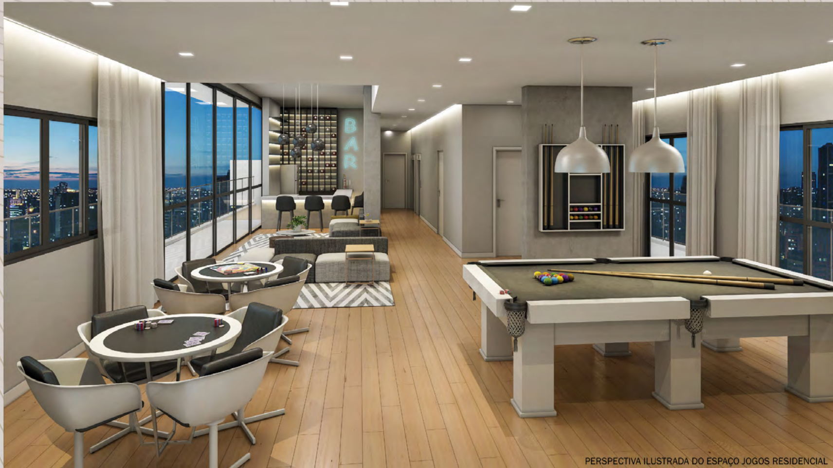
PERSPECTIVA ILUSTRADA DO ESPAÇO JOGOS RESIDENCIAL