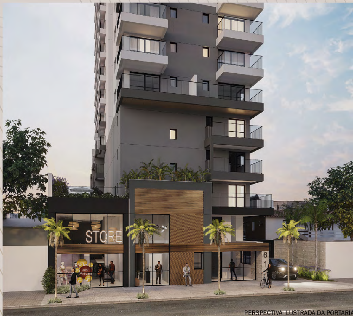
PERSPECTIVA ILUSTRADA DA PORTARIA