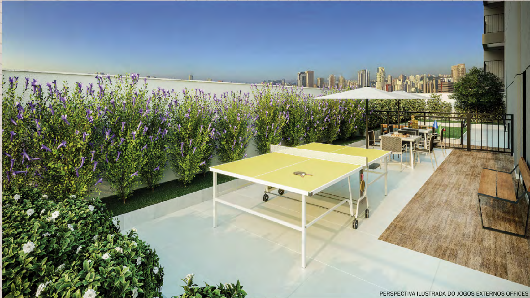
PERSPECTIVA ILUSTRADA DO JOGOS EXTERNOS OFFICES

Ilustração artística com sugestão de decoração. Móveis, utensílios e objetos de decoração são meramente ilustrativos e não fazem parte do contrato de compra e venda. Os acabamentos serão entregues conforme memorial descritivo do empreendimento