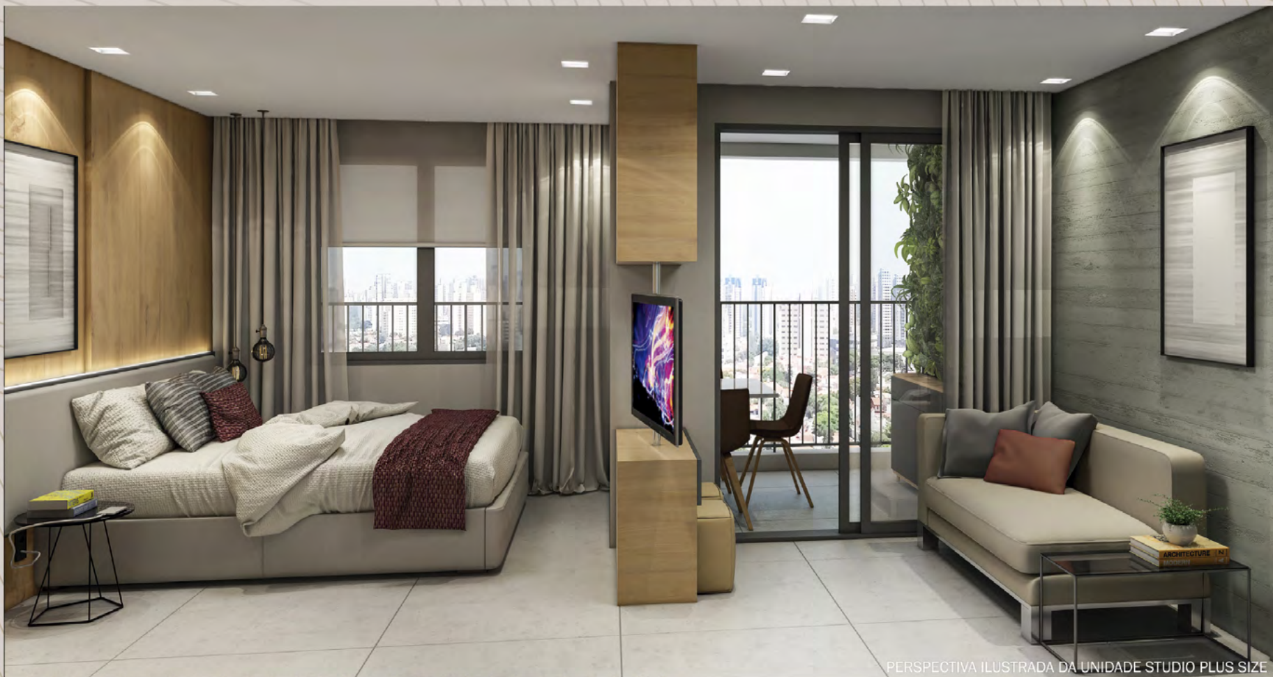
PERSPECTIVA ILUSTRADA DA UNIDADE STUDIO PLUS SIZE

Ilustração artística com sugestão de decoração. Móveis, utensílios e objetos de decoração são meramente ilustrativos e não fazem parte do contrato de compra e venda. Os acabamentos serão entregues conforme memorial descritivo do empreendimento.