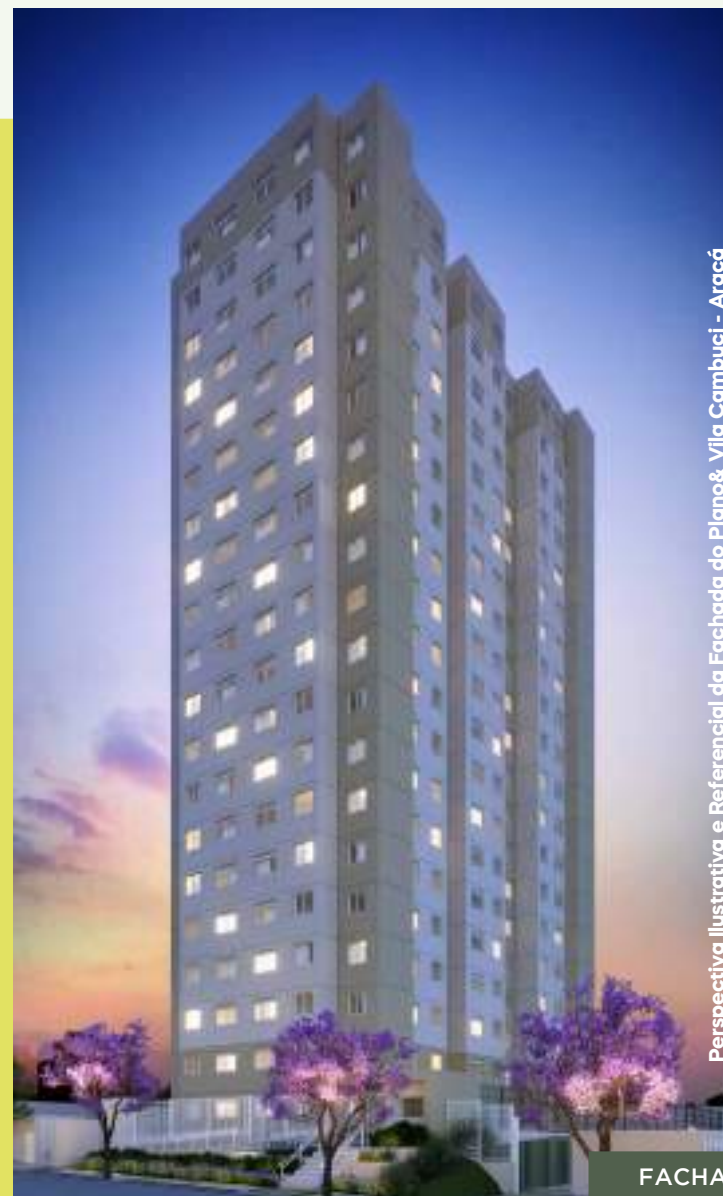
Perspectiva Ilustrativa e Referencial da Fachada do Plano& Vila Cambuci - Araçá

LAZER: Churrasqueira, Bicicletário, Playground, Salão de Festas, Brinquedoteca, Fitness