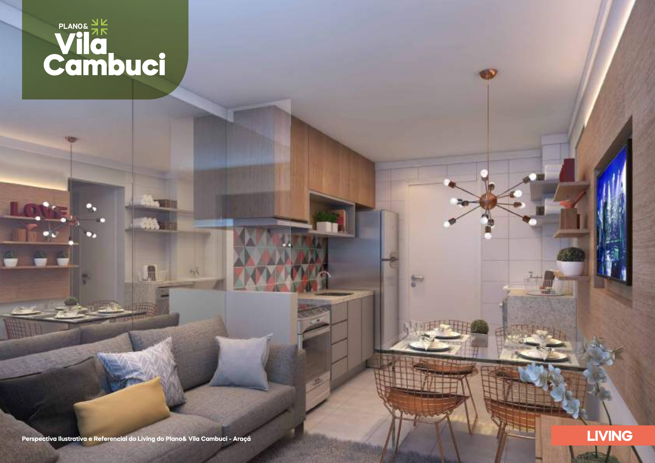
Perspectiva Ilustrativa e Referencial do Living do Plano& Vila Cambuci - Araçá