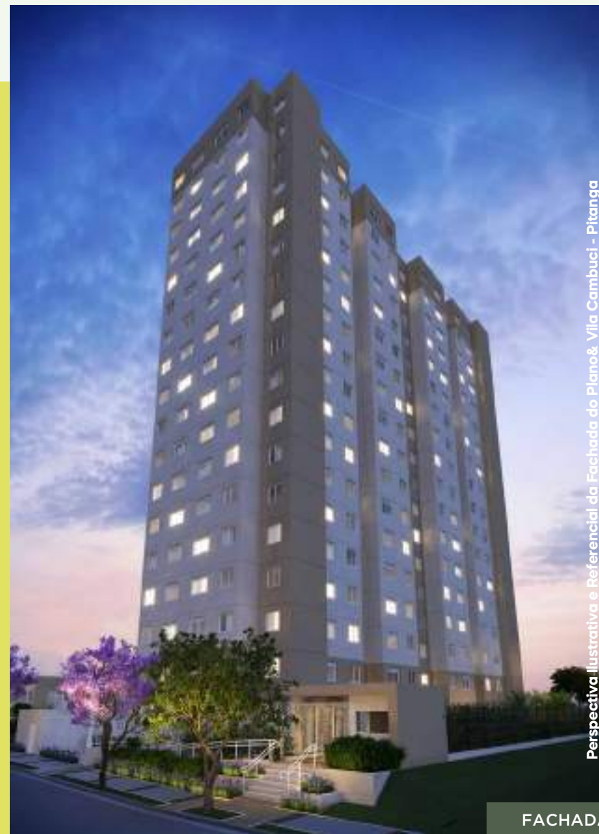
Perspectiva Ilustrativa e Referencial da Fachada do Plano& Vila Cambuci - Pitanga

LAZER: Bicicletário, Playground, Churrasqueira, Salão de Festas, Fitness, Brinquedoteca, Pet Care