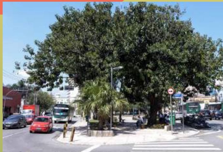
LARGO DO CAMBUCI