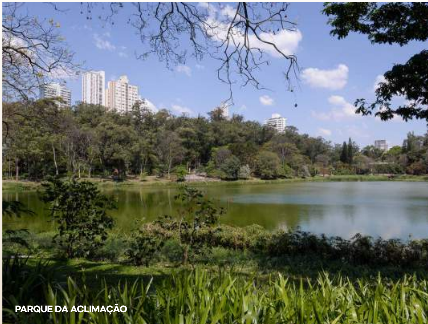
PARQUE DA ACLIMAÇÃO