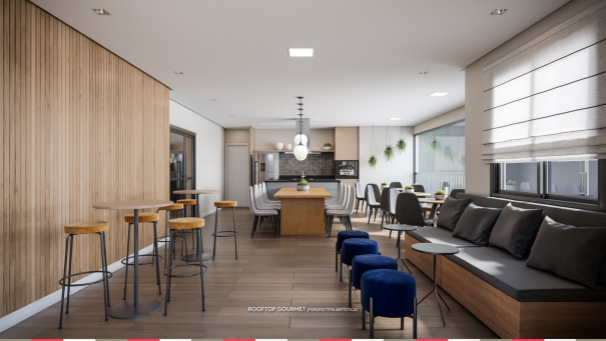
ROOFTOP GOURMET (PERSPECTIVA ARQUITECTA)