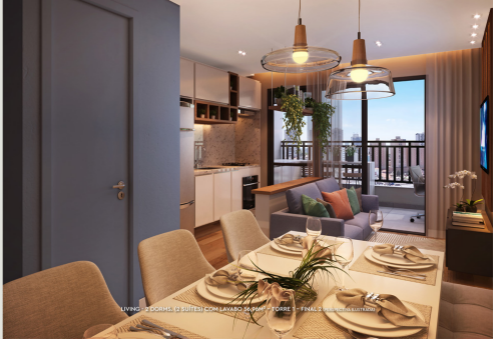
LIVING - 2 DORMS. (2 SUITES) COM LAVABO 54,99M 2 - TORRE 1 - FINAL 2 (AVANÇADA EXTERIOR)