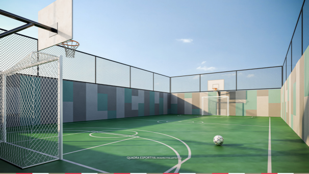
QUADRA ESPORTIVA (PERSPECTIVA ARTÍSTICA)