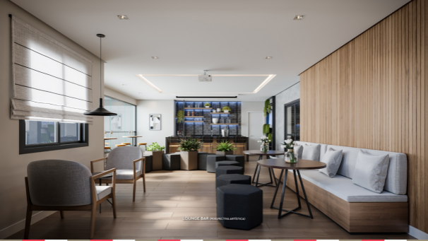
LOUNGE BAR (PERSPECTIVA ARTIFICIAL)