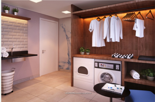
LAVANDERÍA (PERSPECTIVA ARTÍSTICA)