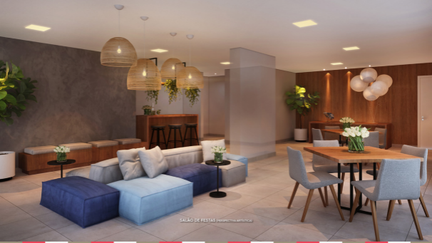
SALÃO DE FESTAS (PERSPECTIVA INTERNA)