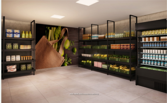
MINI MERCADO (PUNTO DE VENTA)