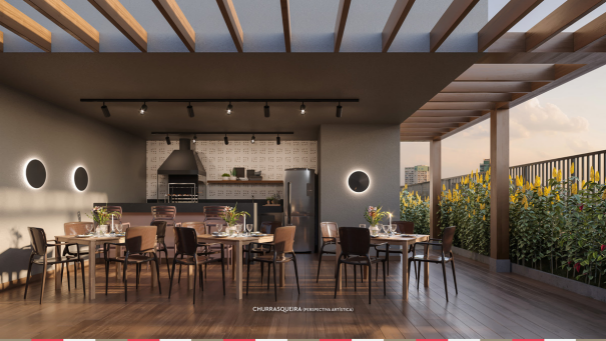
CHURRASQUEIRA (PERSPECTIVA ARTÍSTICA)