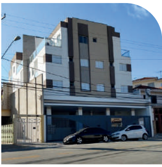
Residencial Chagú Vila Formosa Entregue em 2019