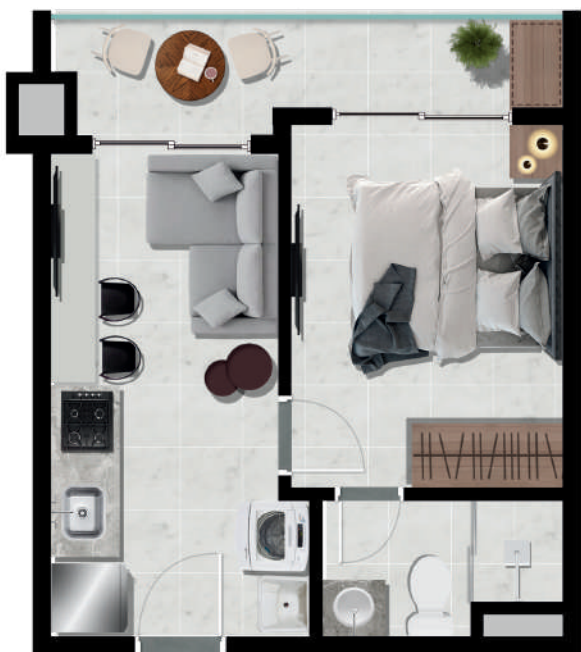
Unidade 1 dorm - 25m 2 varanda 40 unidades 6° ao 15° pavimento Finais - 05 a 08