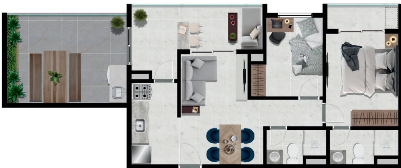
Unidade 2 dorms Garden - 63m 2 suíte, varanda, terraço e vaga de garagem 5° pavimento (planta única) Final - 03