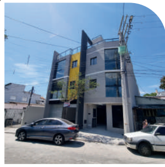
Residencial V. das Belezas Vila Ernesto Entregue em 2022