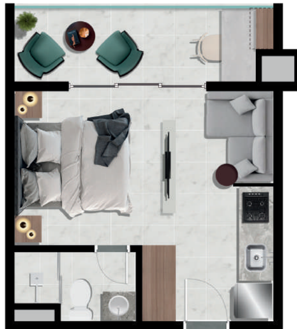
Studio – 25m 2 varanda 08 unidades 3º pavimento Finais – 01 a 08