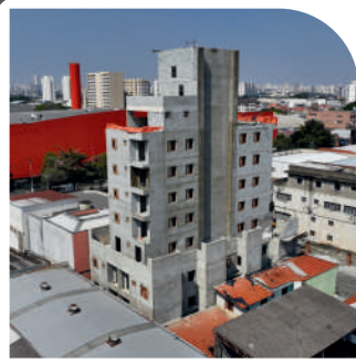
Residencial CAF 165 Vila Guilherme Em construção