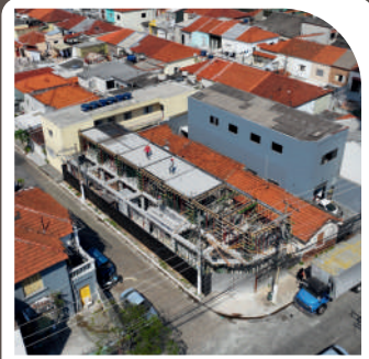
Comercial Serra da Bocaina Em construção