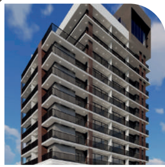
Residencial A. de Barros Tatuapé Em projeto