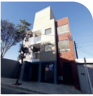
Residencial Ponte Pensa Parada Inglesa Entregue em 2022