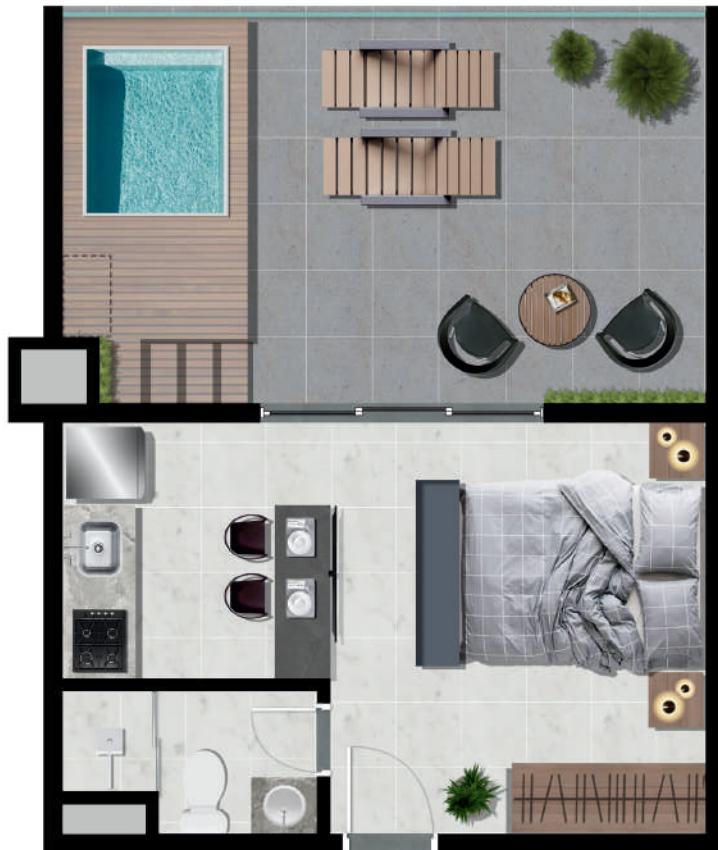
Studio Garden – 39m 2 terraço externo Unidade única 2º pavimento Final – 11