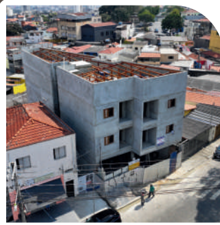
Residencial Dalila Vila Euthalia Em construção