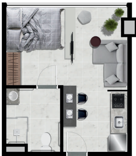
Unidade 1 dorm - 25m 2 adaptada PNE 4 unidades 5° pavimento Finais - 05 a 08