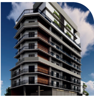
Residencial Mossamedes Tatuapé Em construção