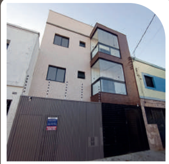
Residencial João Batista Mooca Entregue em 2022