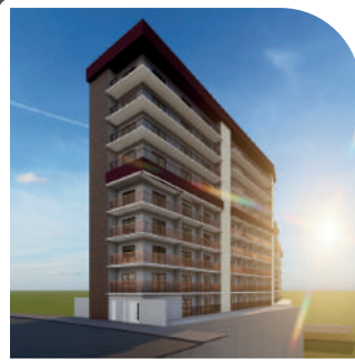
Residencial Cotching Anália Franco Em projeto