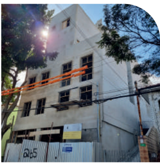
Residencial Cinque Terre Tatuapé Em construção