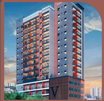
Residencial Verse Anália Franco Pré-Lançamento