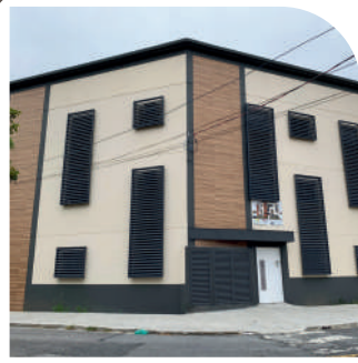
Residencial São Bento Vila Guilhermina Entregue em 2019