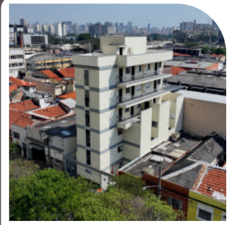
Residencial Villius Mooca Entregue em 2023