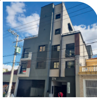
Residencial Viseu Vila Formosa Entregue em 2023