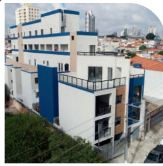
Residencial V. Formoso Chácara Sto. Antônio Entregue em 2021