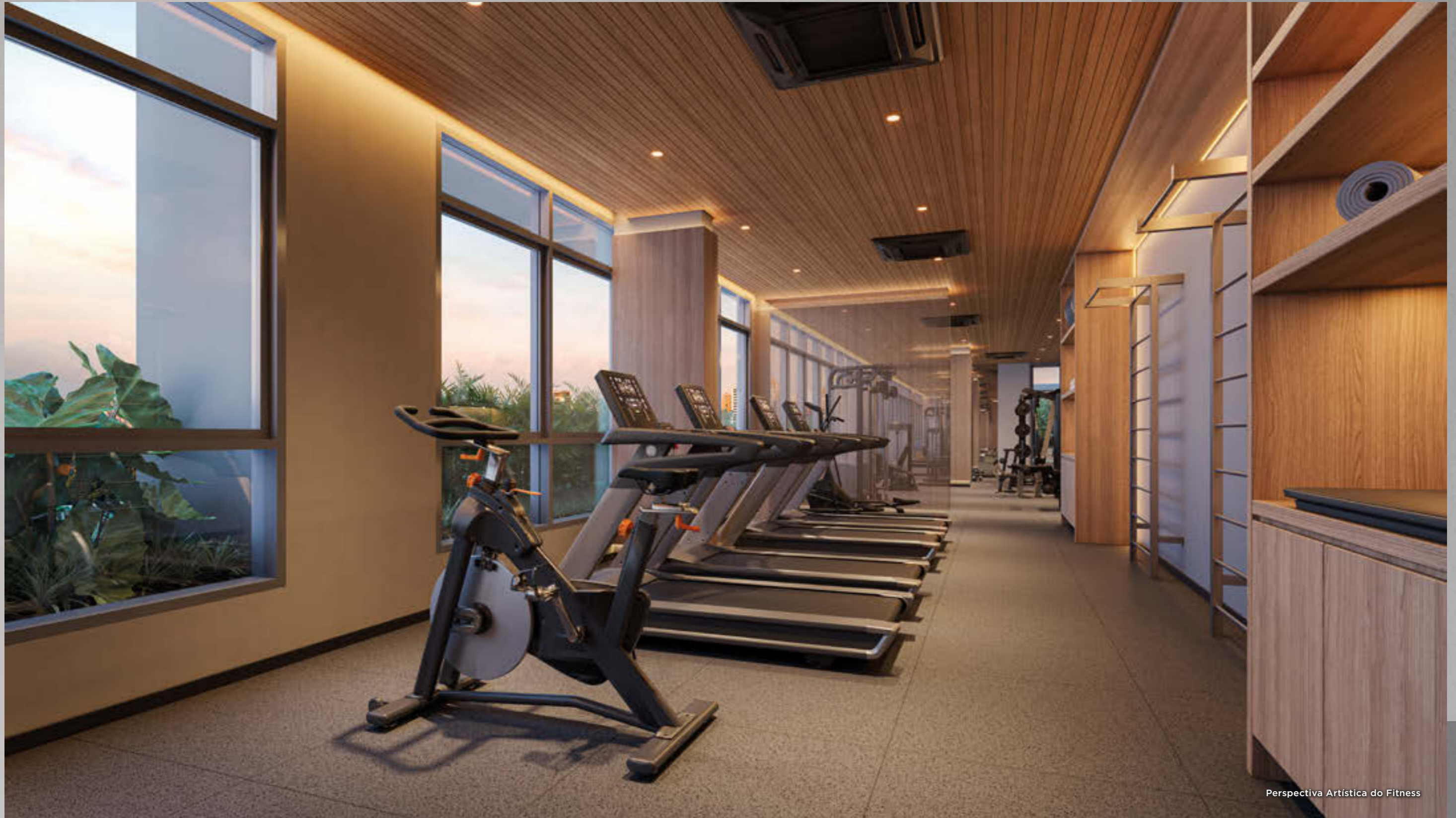
Perspectiva Artística do Fitness