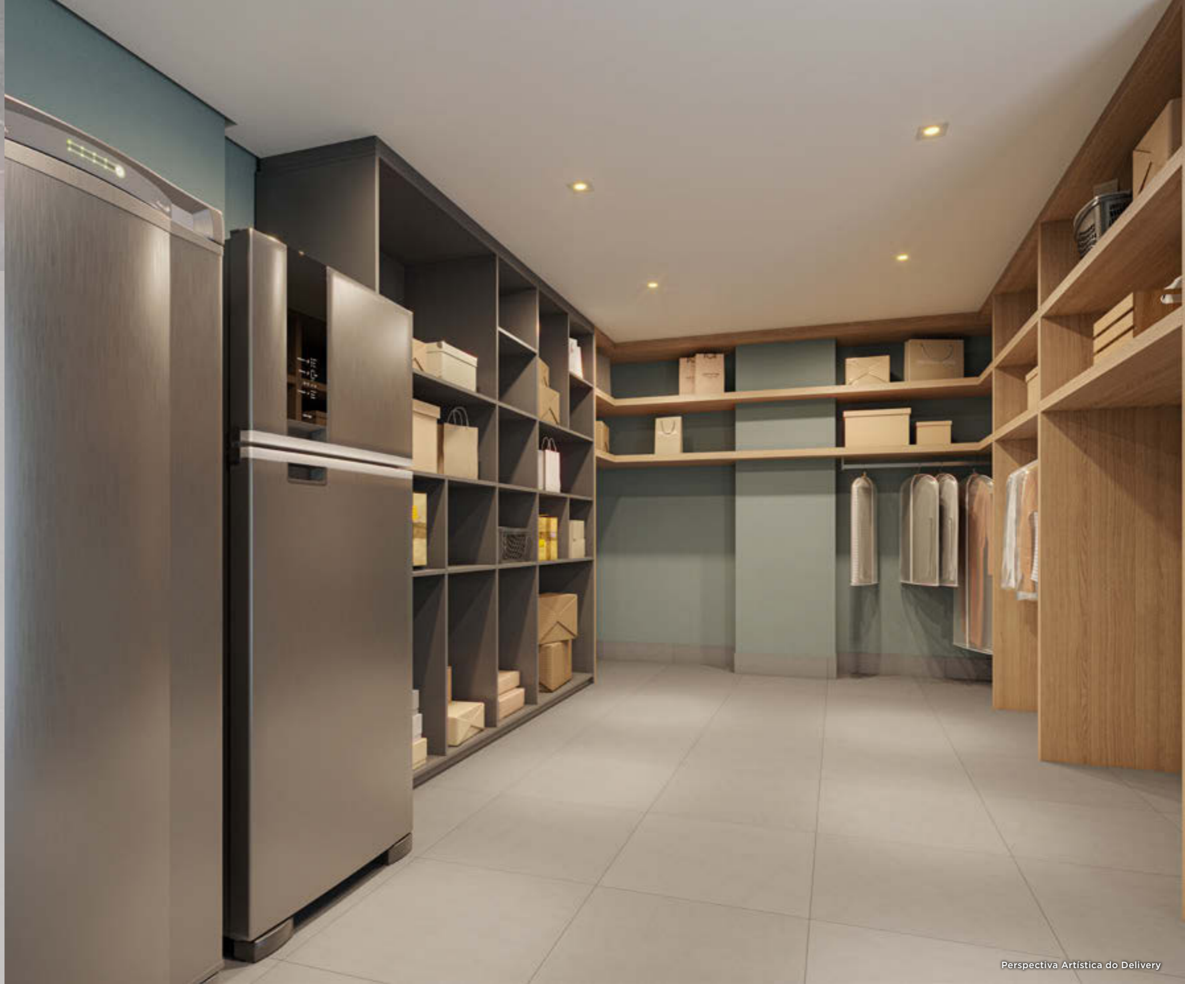
Perspectiva Artística do Delivery