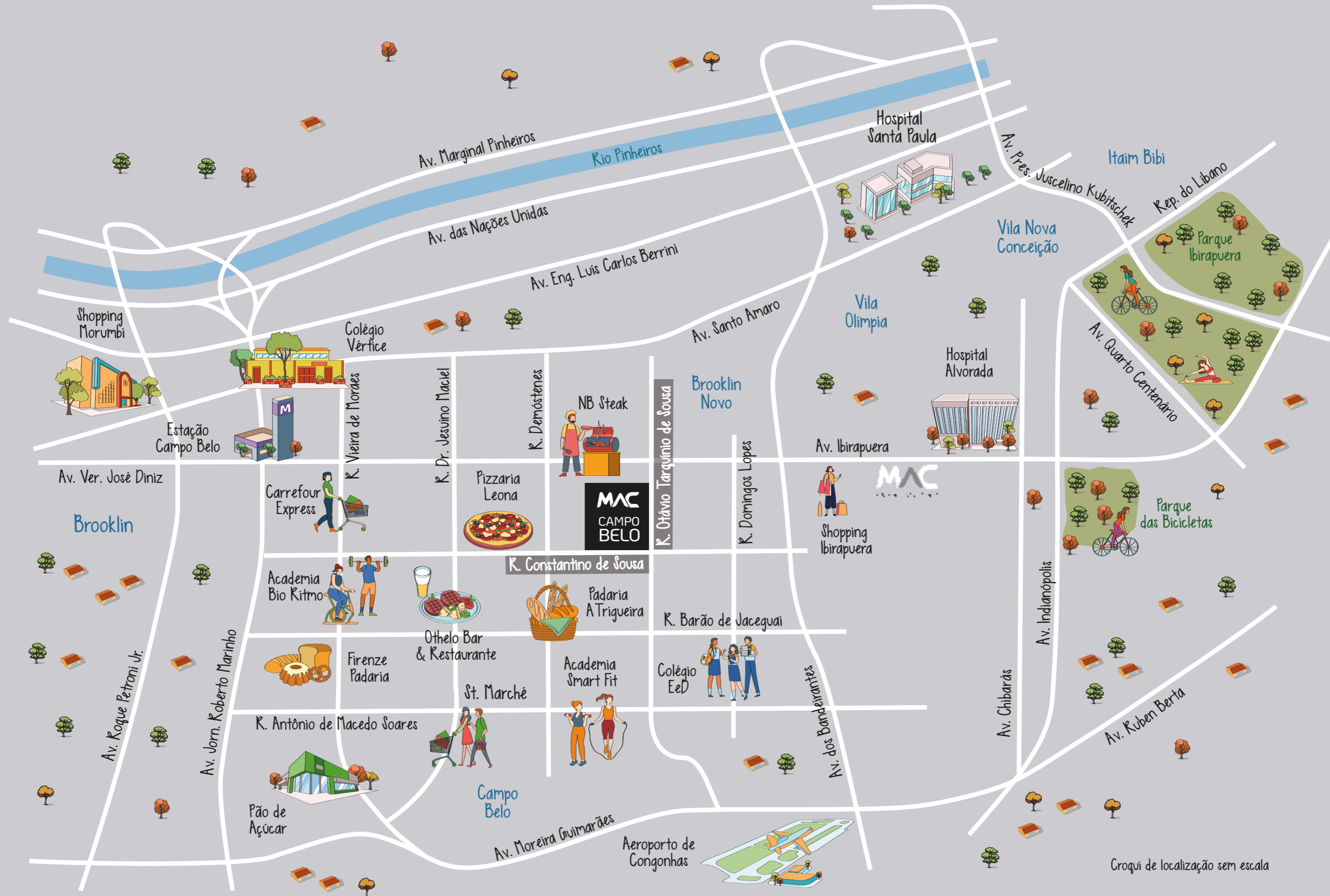
Croqui de localização sem escala