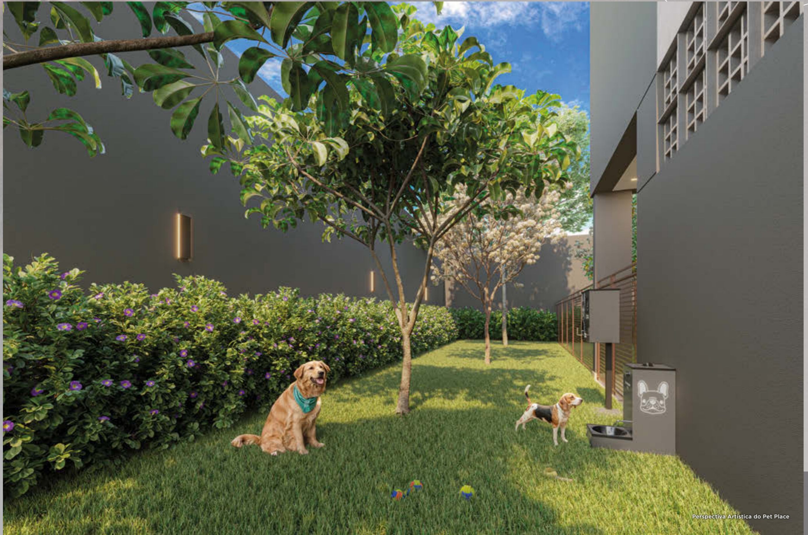
Perspectiva Artística do Pet Place