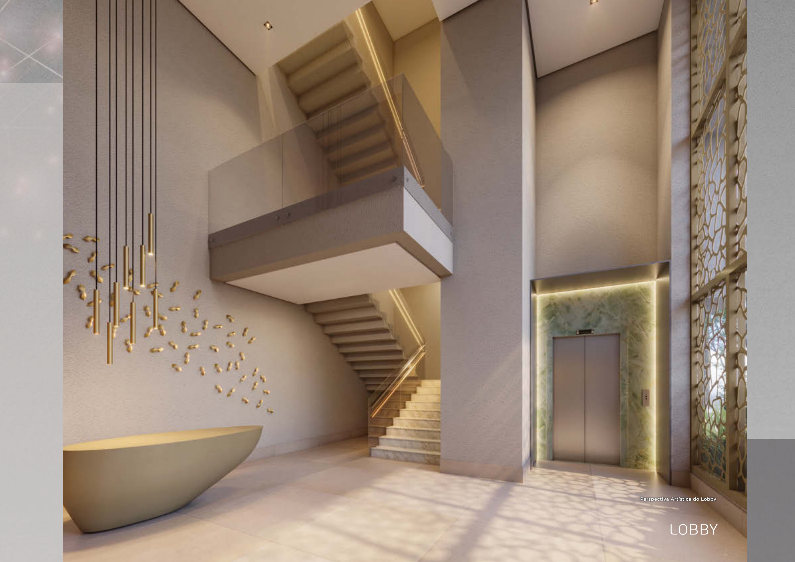
Perspectiva Artística do Lobby