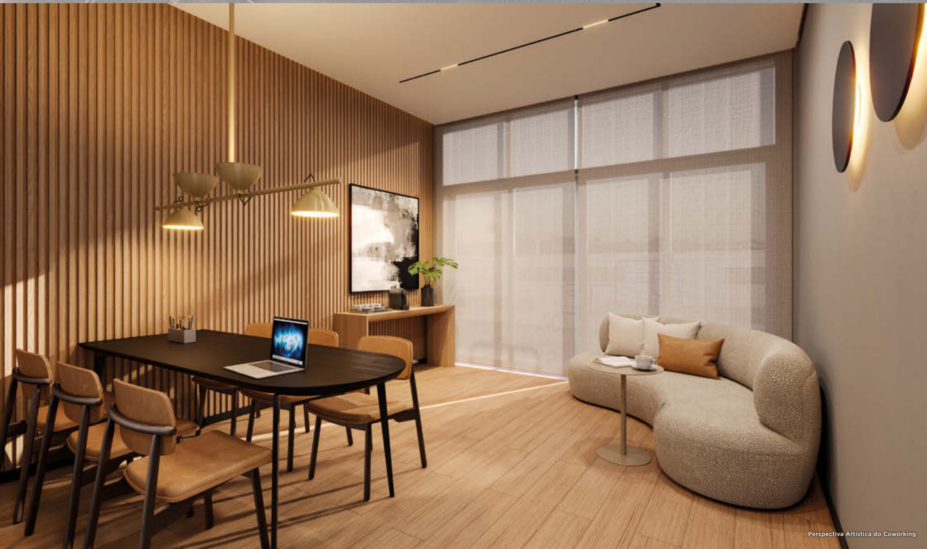
Perspectiva Artística do Coworking