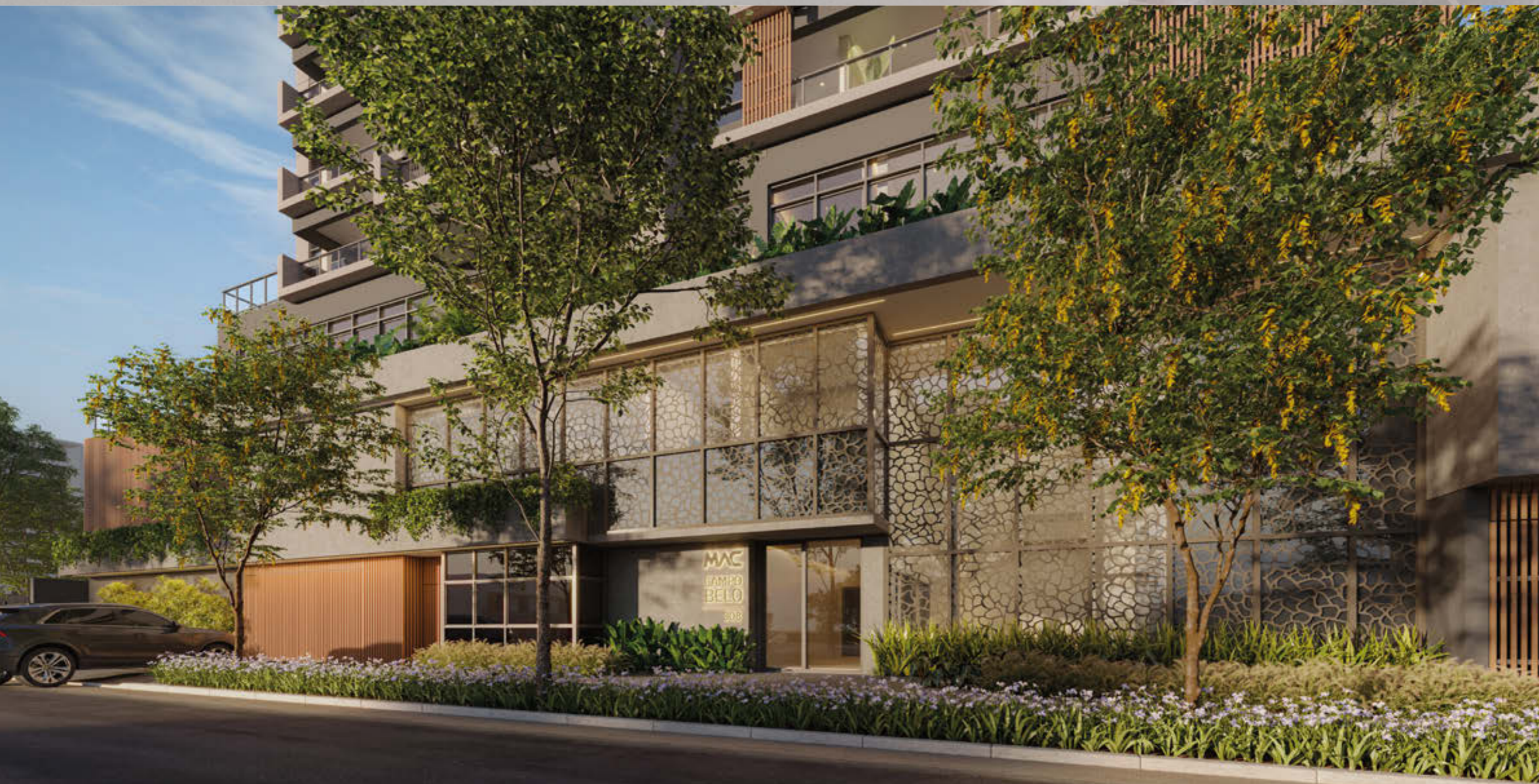
Perspectiva Artística da Portaria