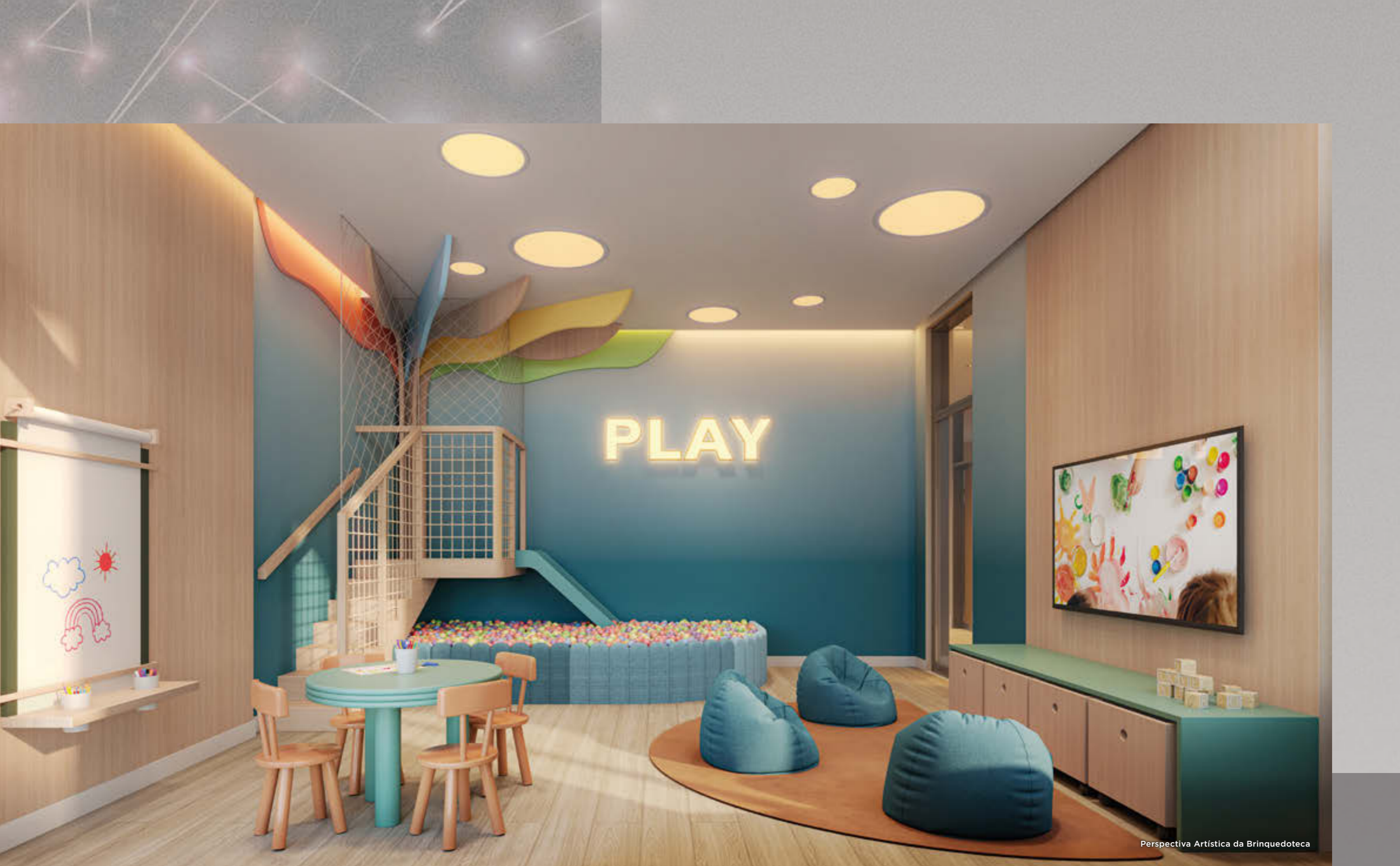
Perspectiva Artística da Brinquedoteca