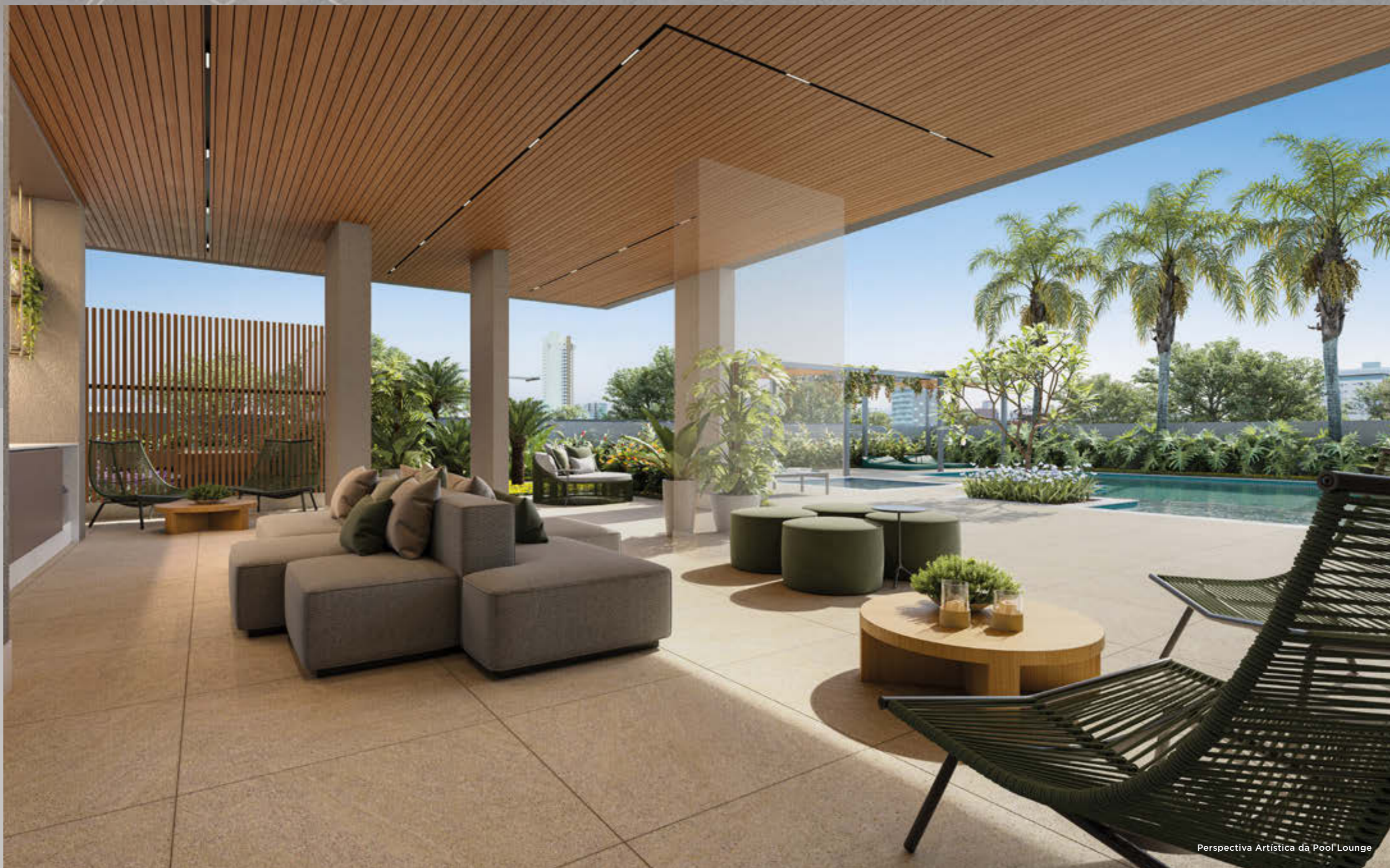
Perspectiva Artística da Pool Lounge