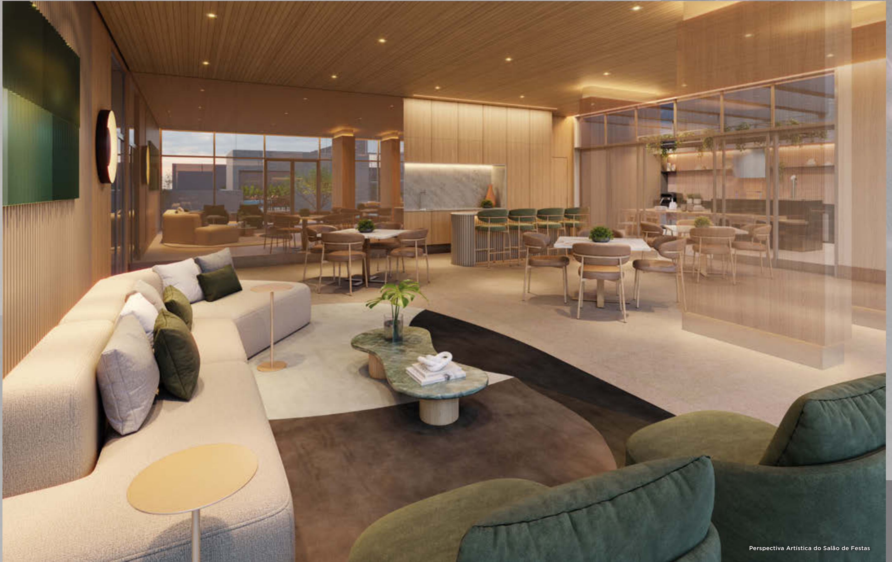
Perspectiva Artística do Salão de Festas