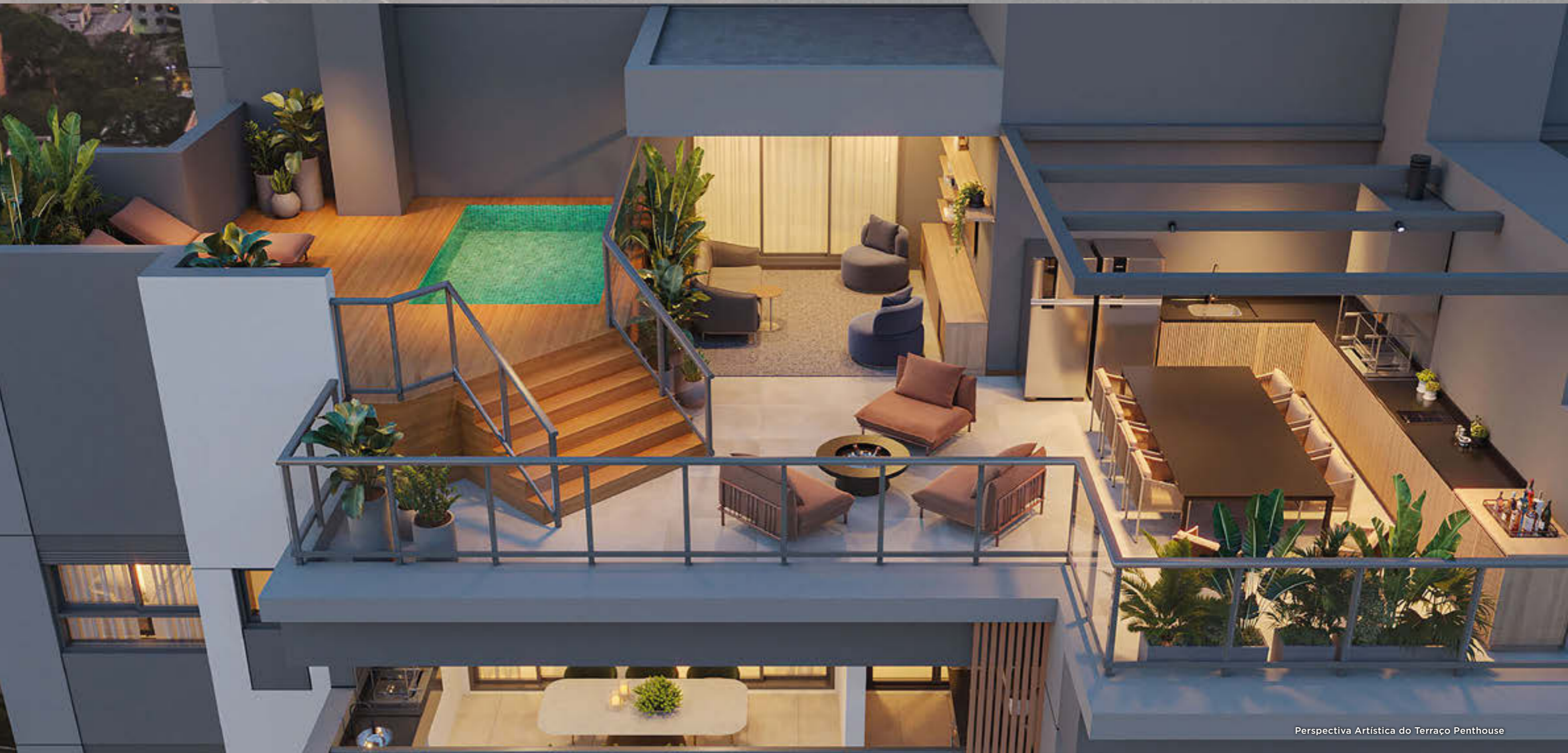
Perspectiva Artística do Terraço Penthouse