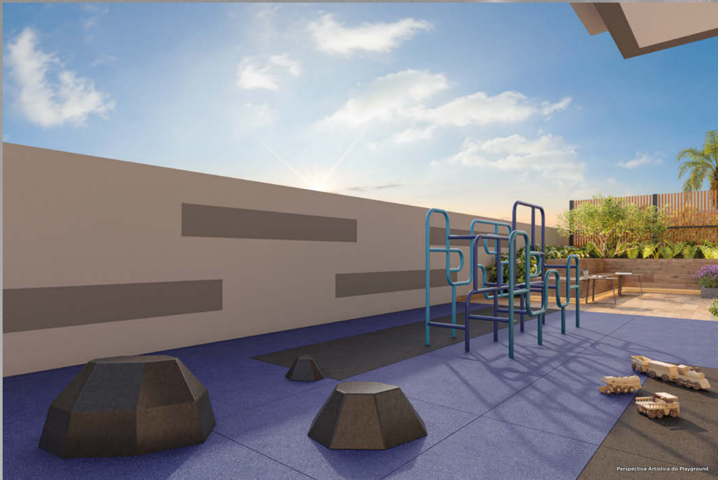
Perspectiva Artística do Playground