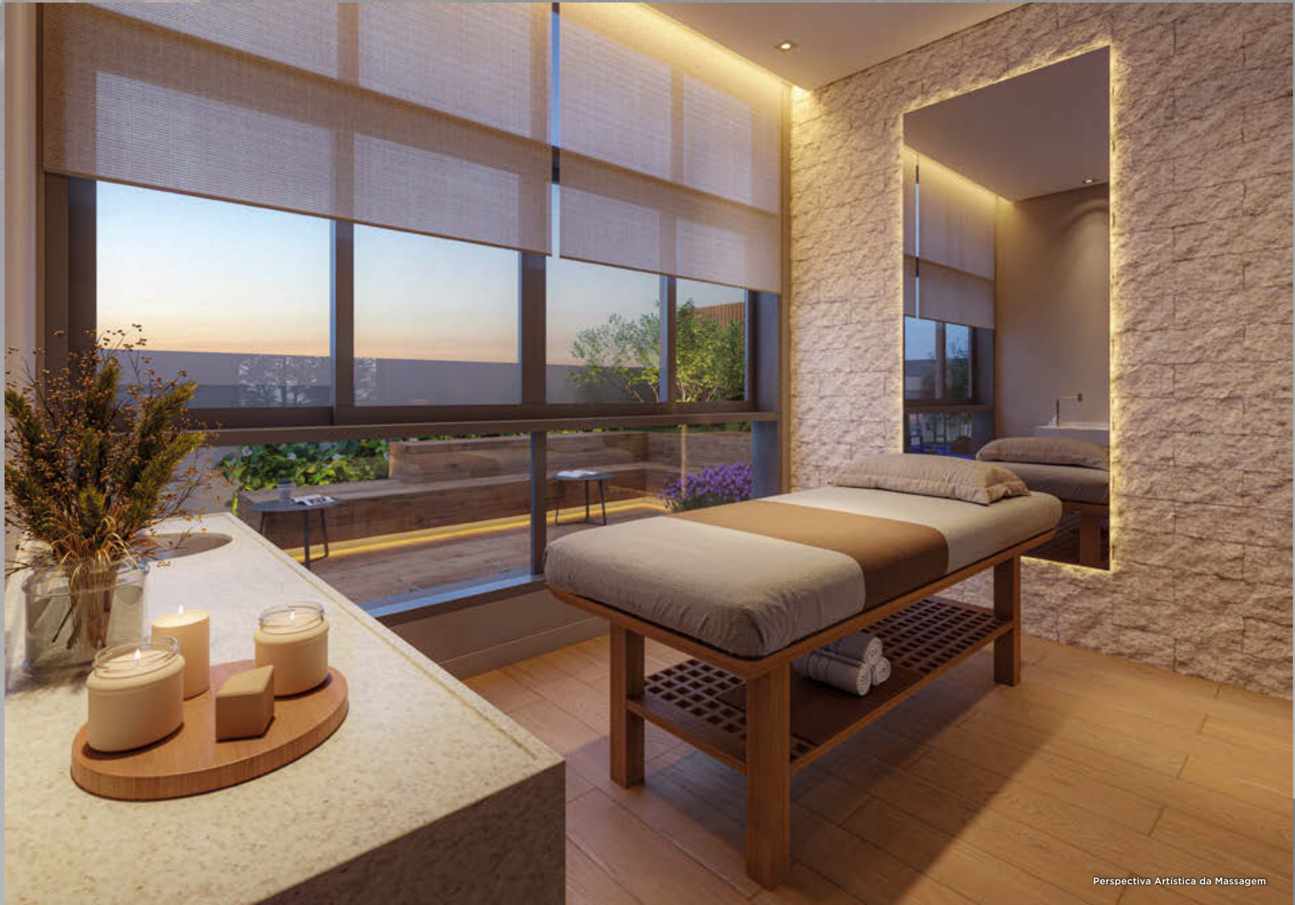
Perspectiva Artística da Massagem