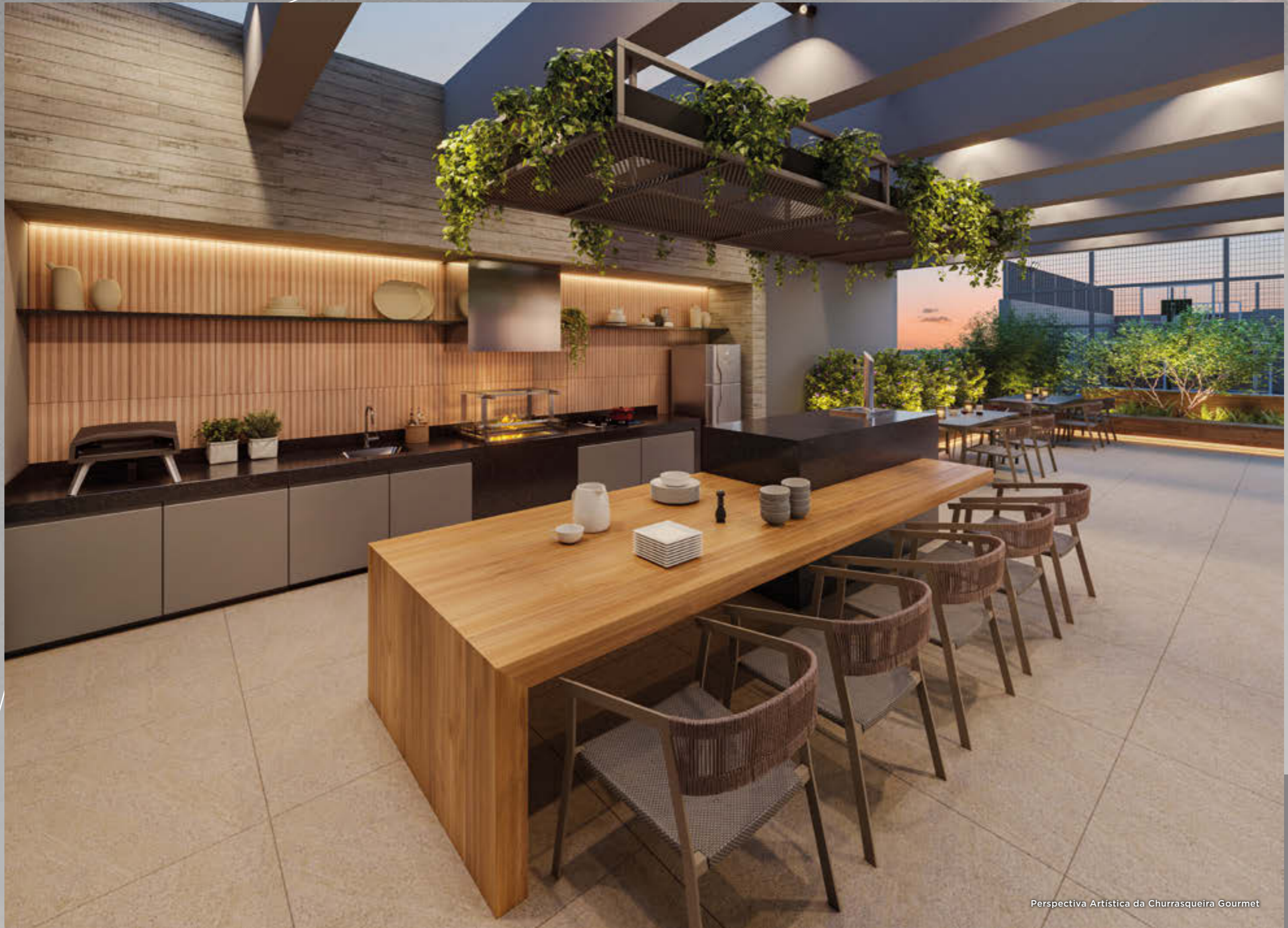
Perspectiva Artística da Churrascaria Gourmet