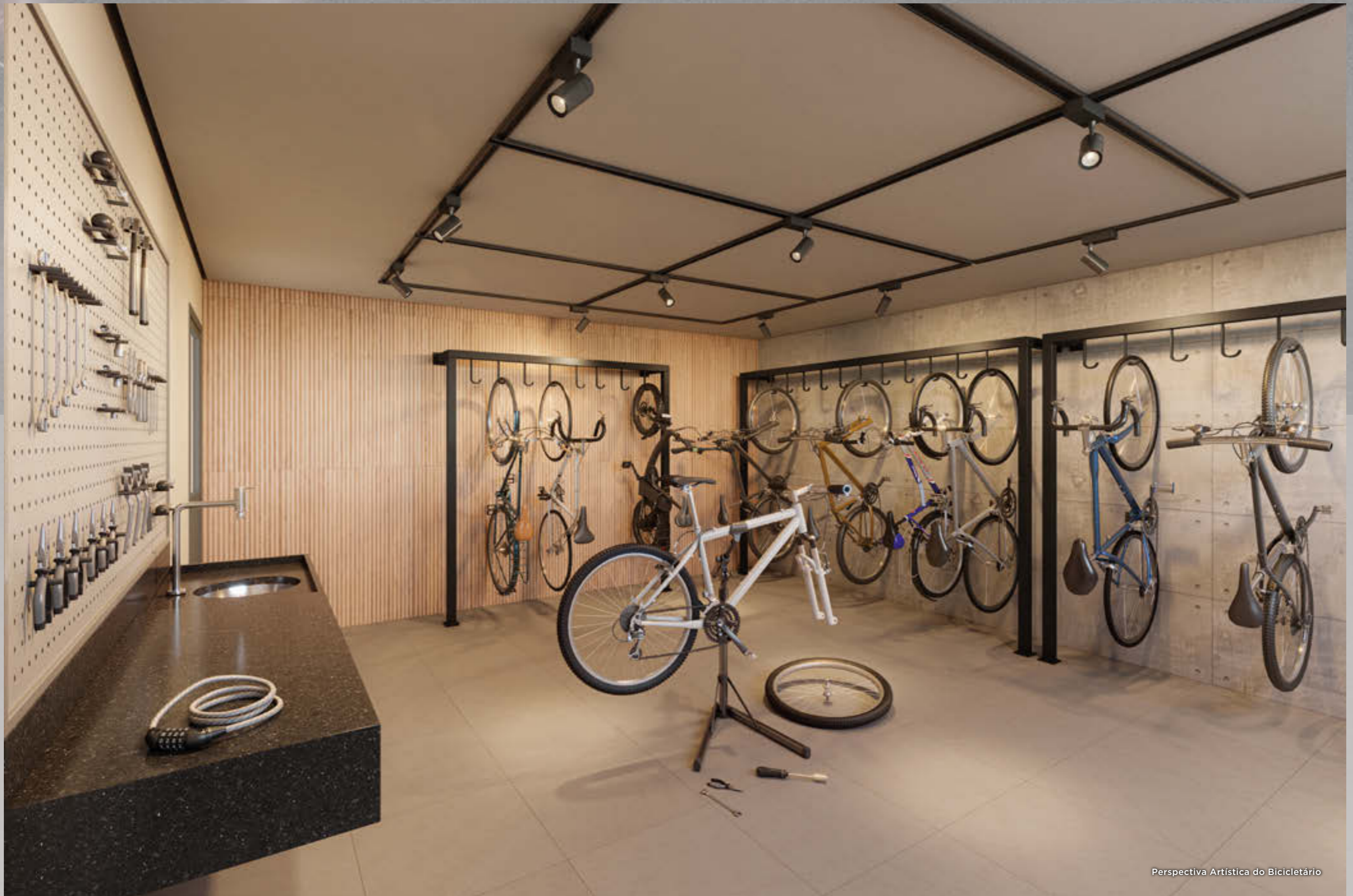
Perspectiva Artística do Bicicletário