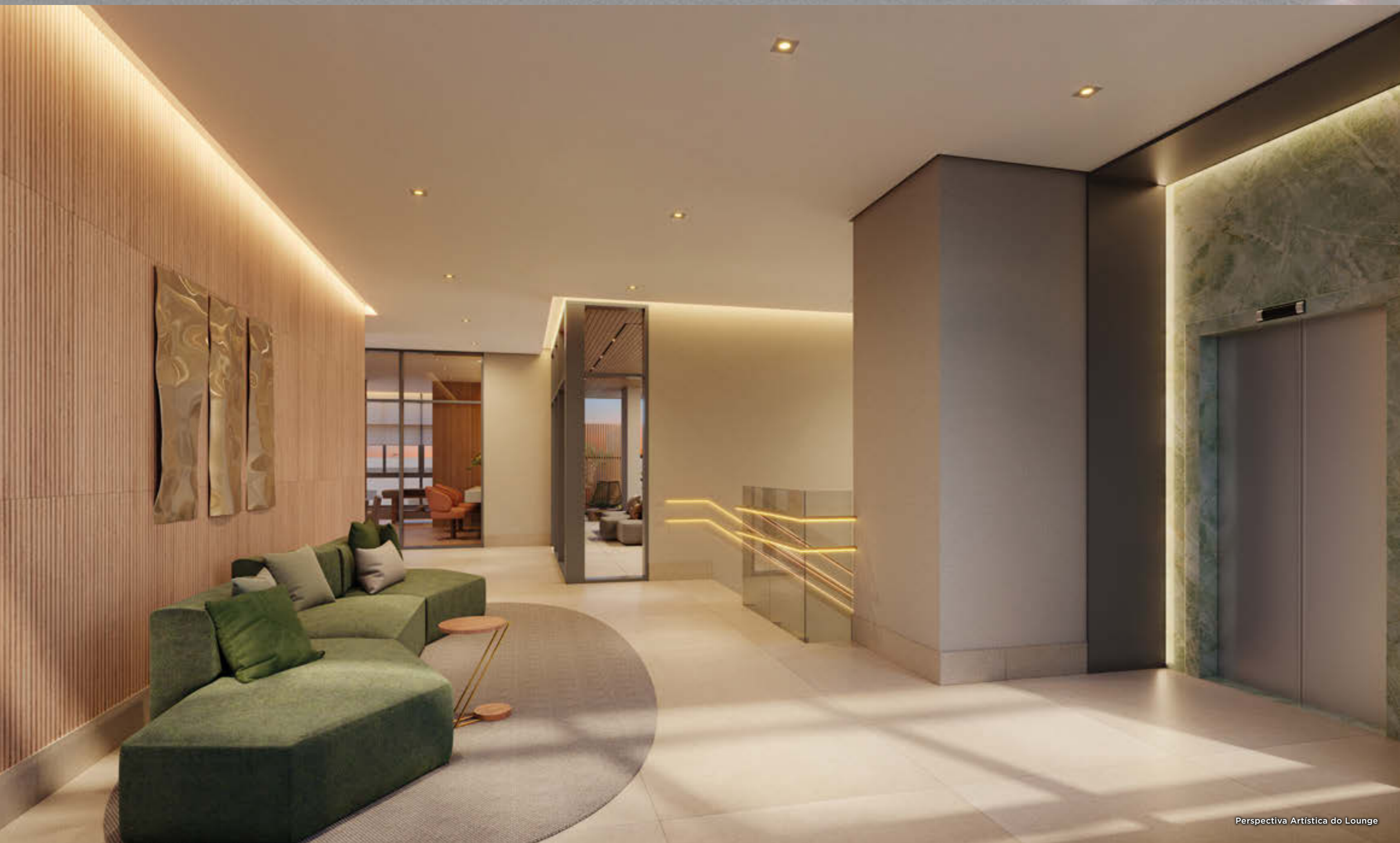
Perspectiva Artística do Lounge