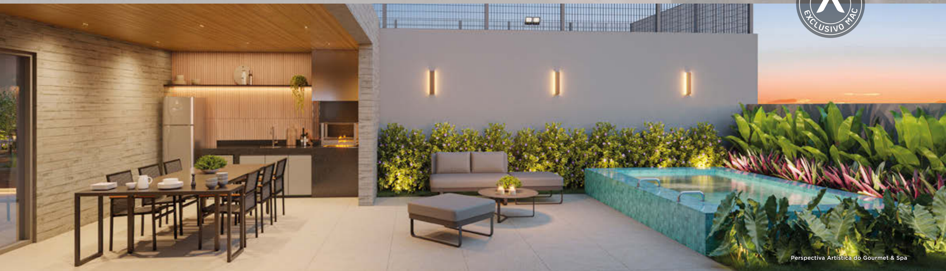
Perspectiva Artística do Gourmet & Spa