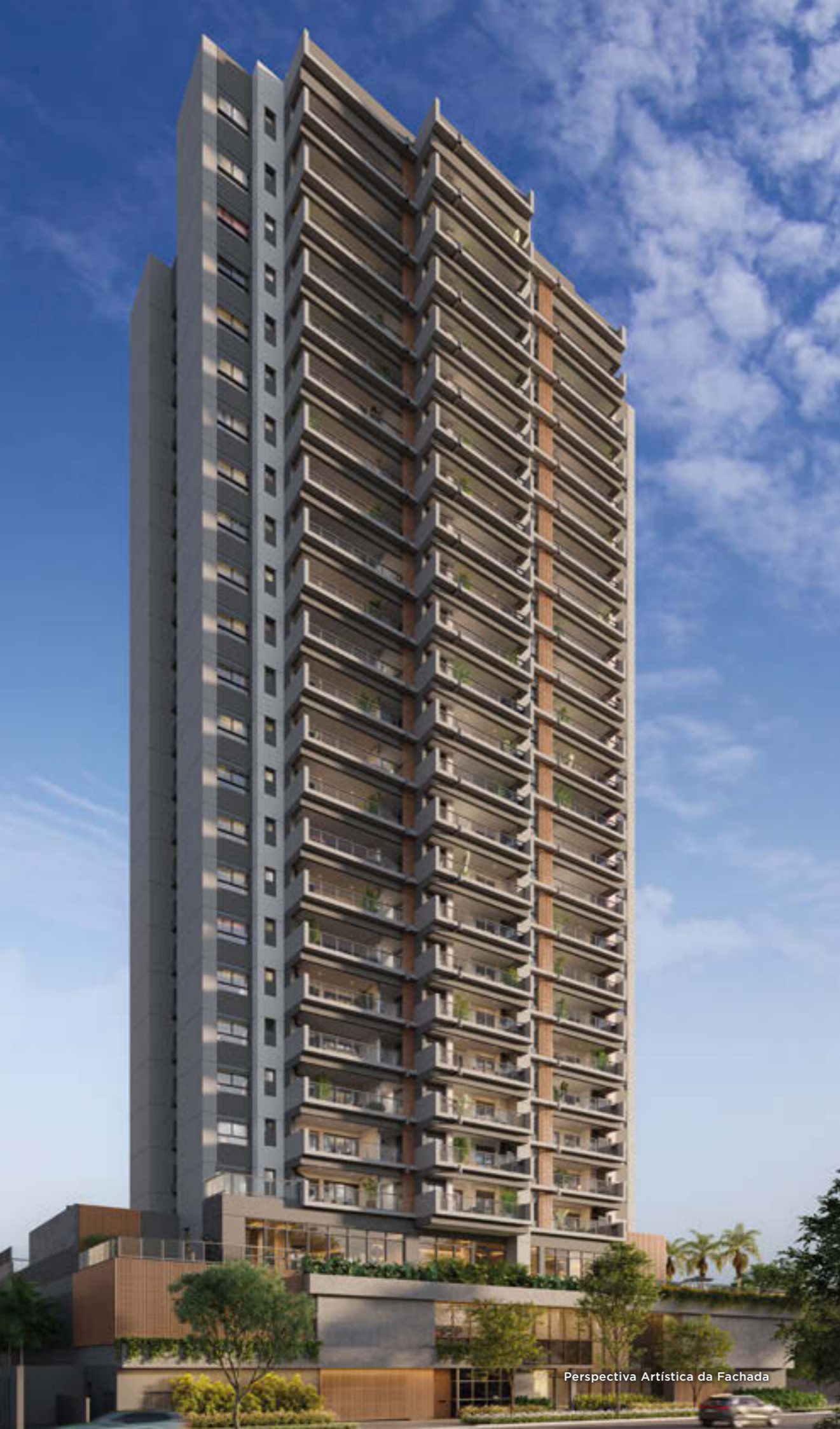
Perspectiva Artística da Fachada