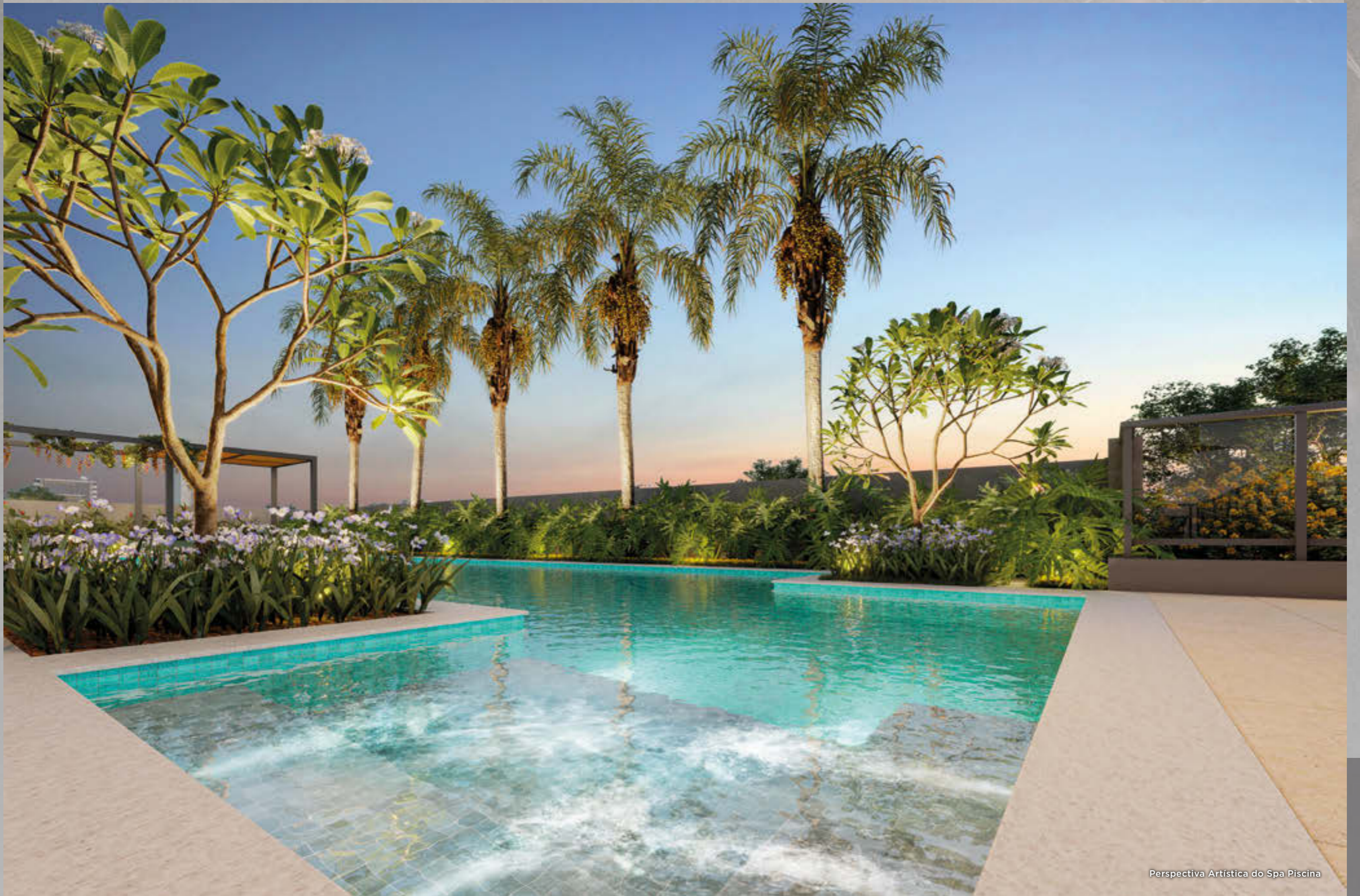
Perspectiva Artística do Spa Piscina