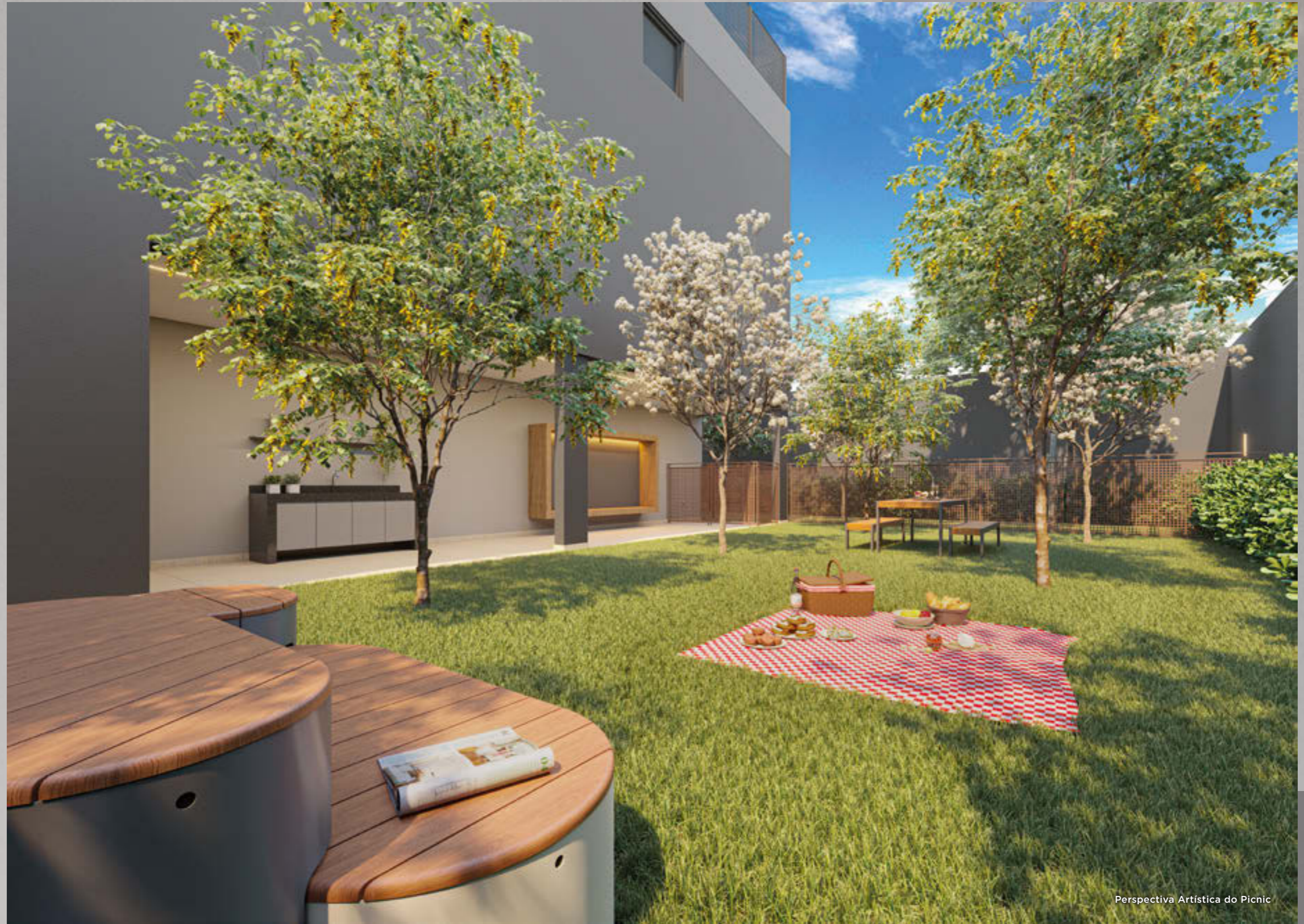
Perspectiva Artística do Picnic