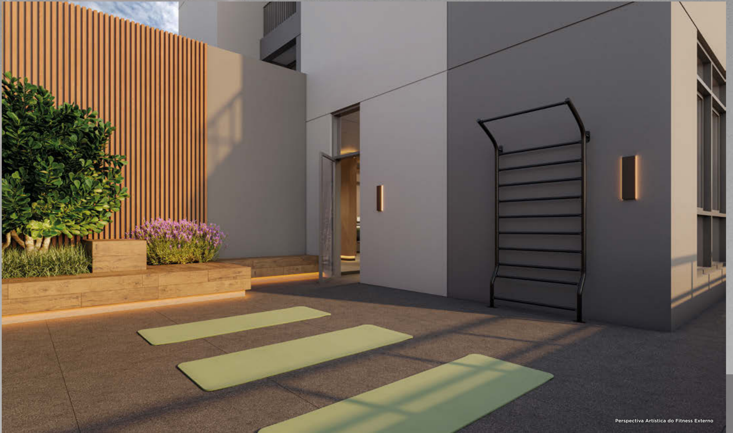
Perspectiva Artística do Fitness Externo