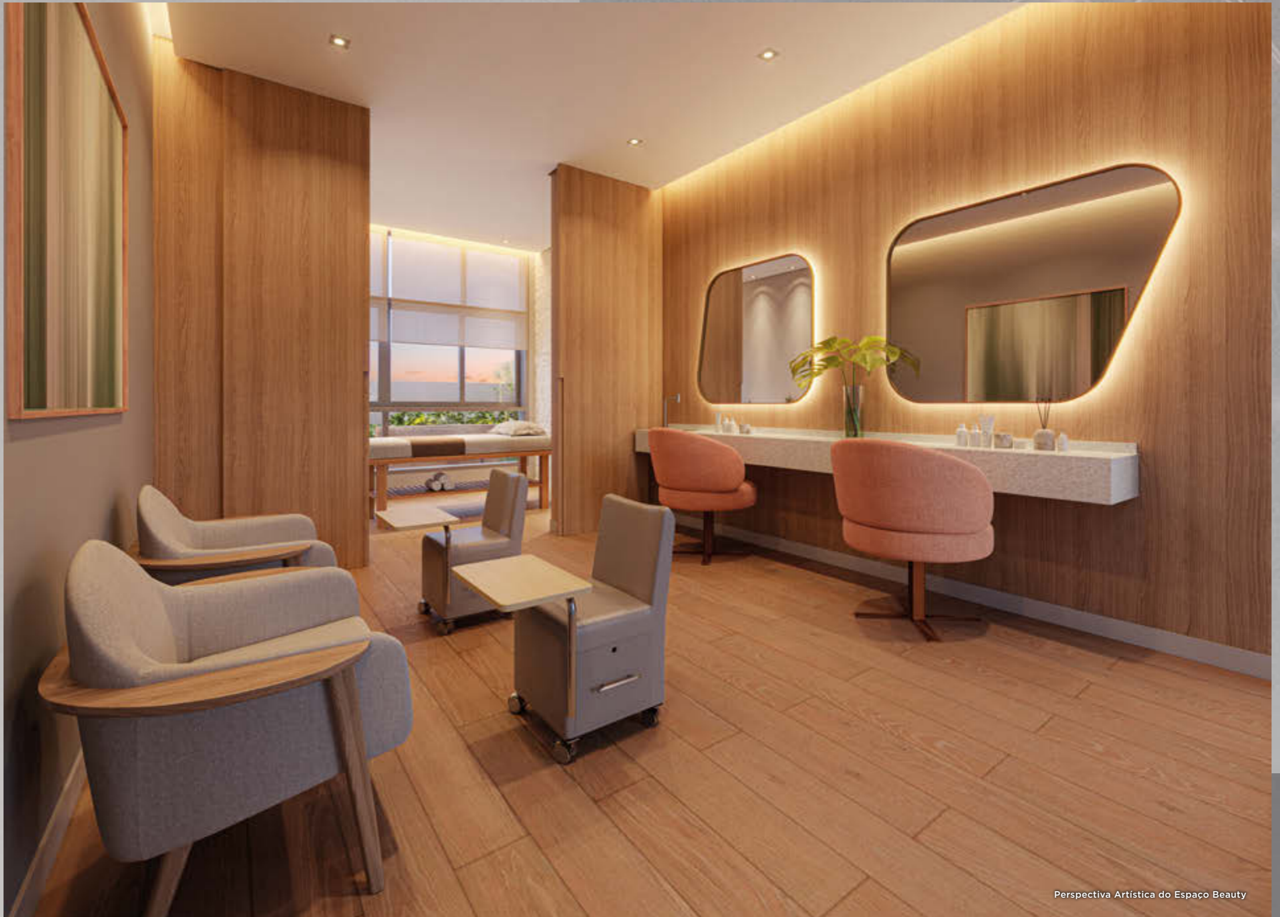
Perspectiva Artística do Espaço Beauty