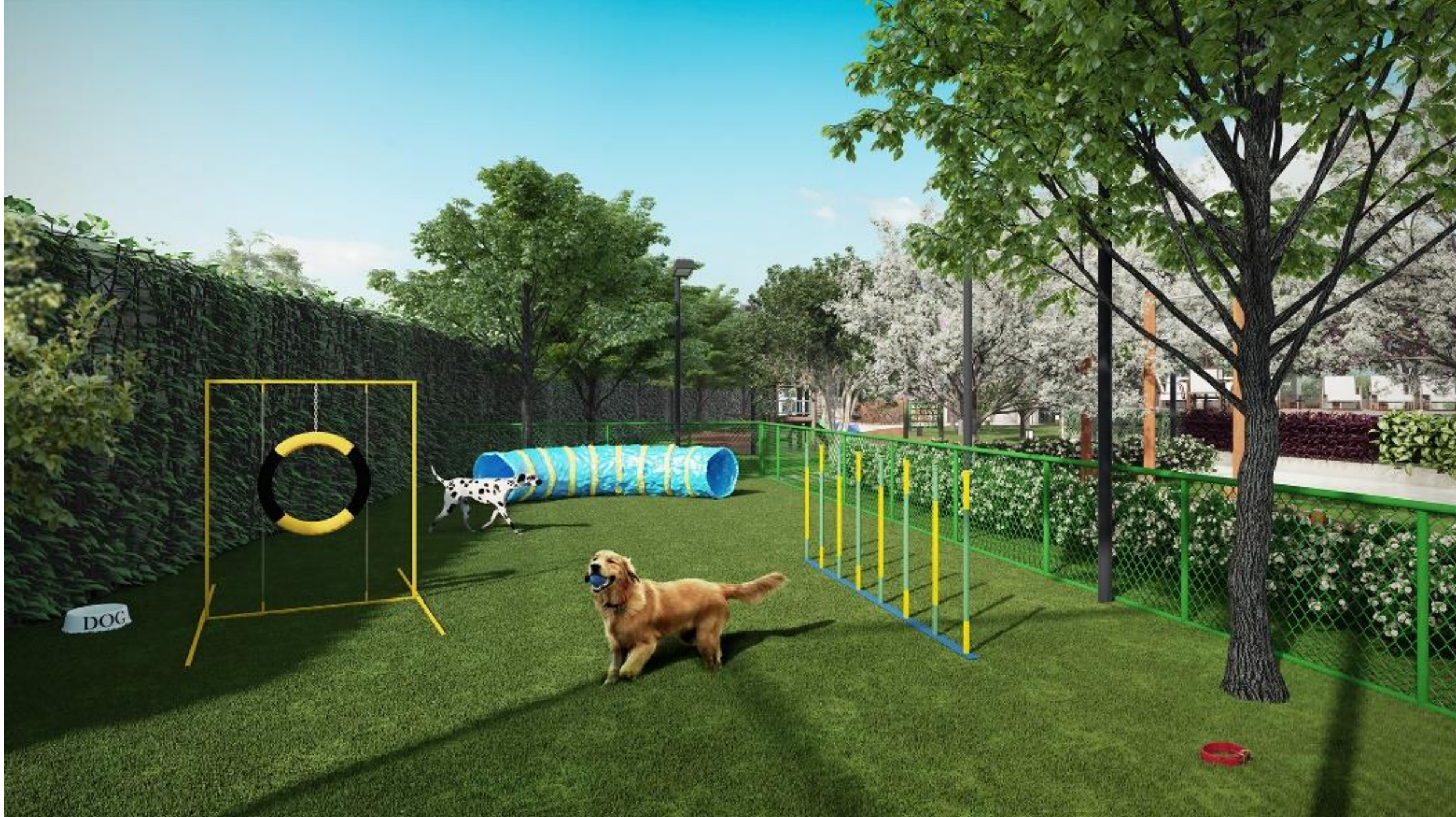
ÁREA PARA AGILITY DE CÃES