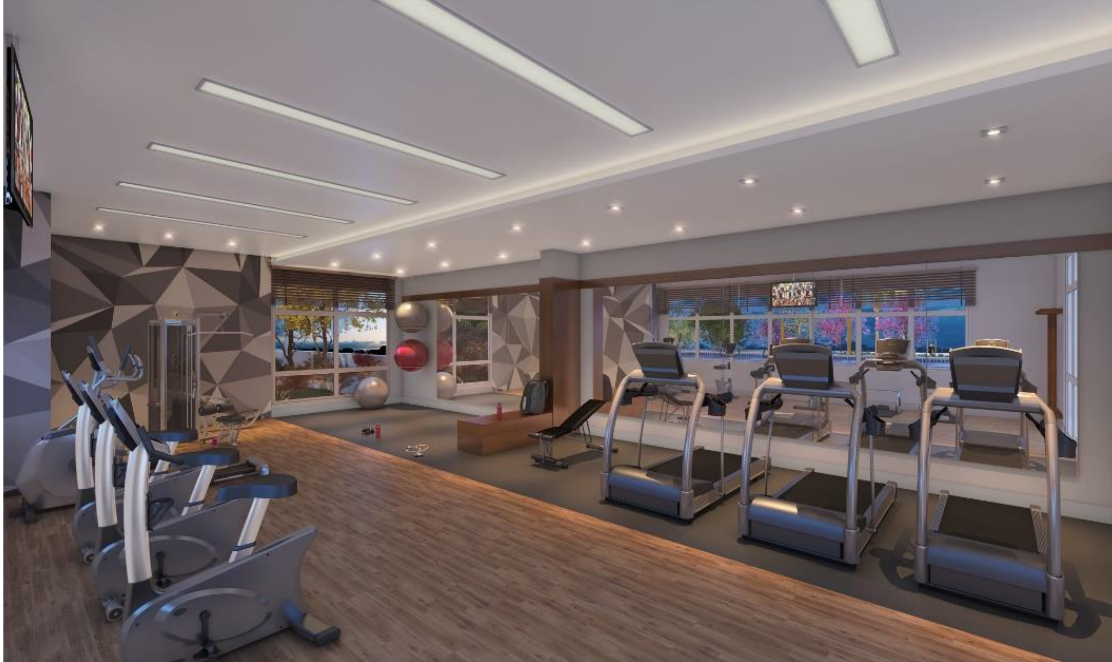
FITNESS COM INFRAESTRUTURA PARA WI-FI E AR CONDICIONADO