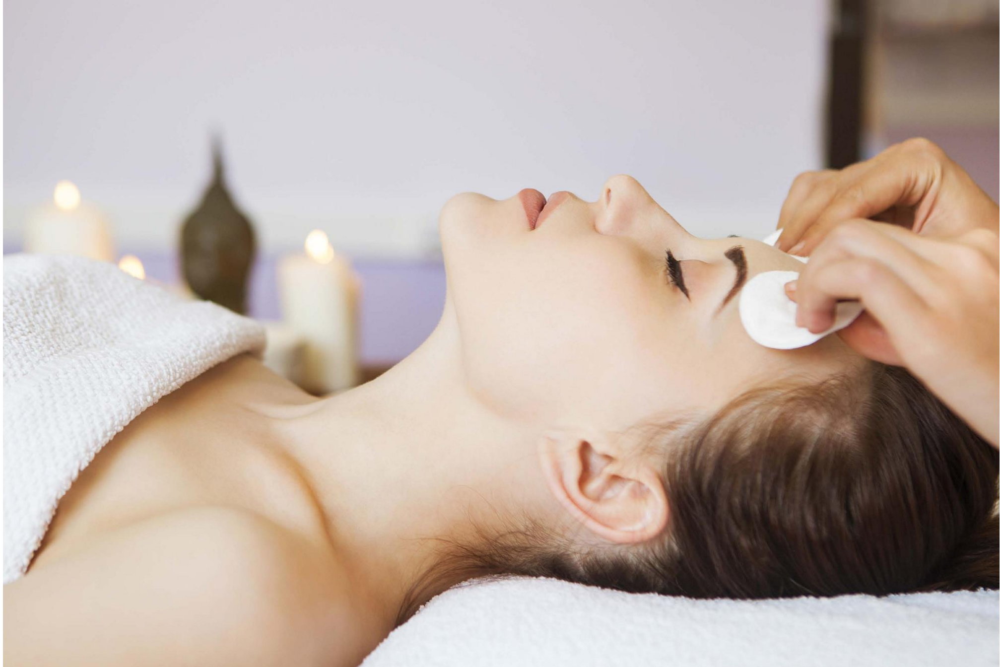
ESPAÇO BEAUTY COM SALA DE MASSAGEM