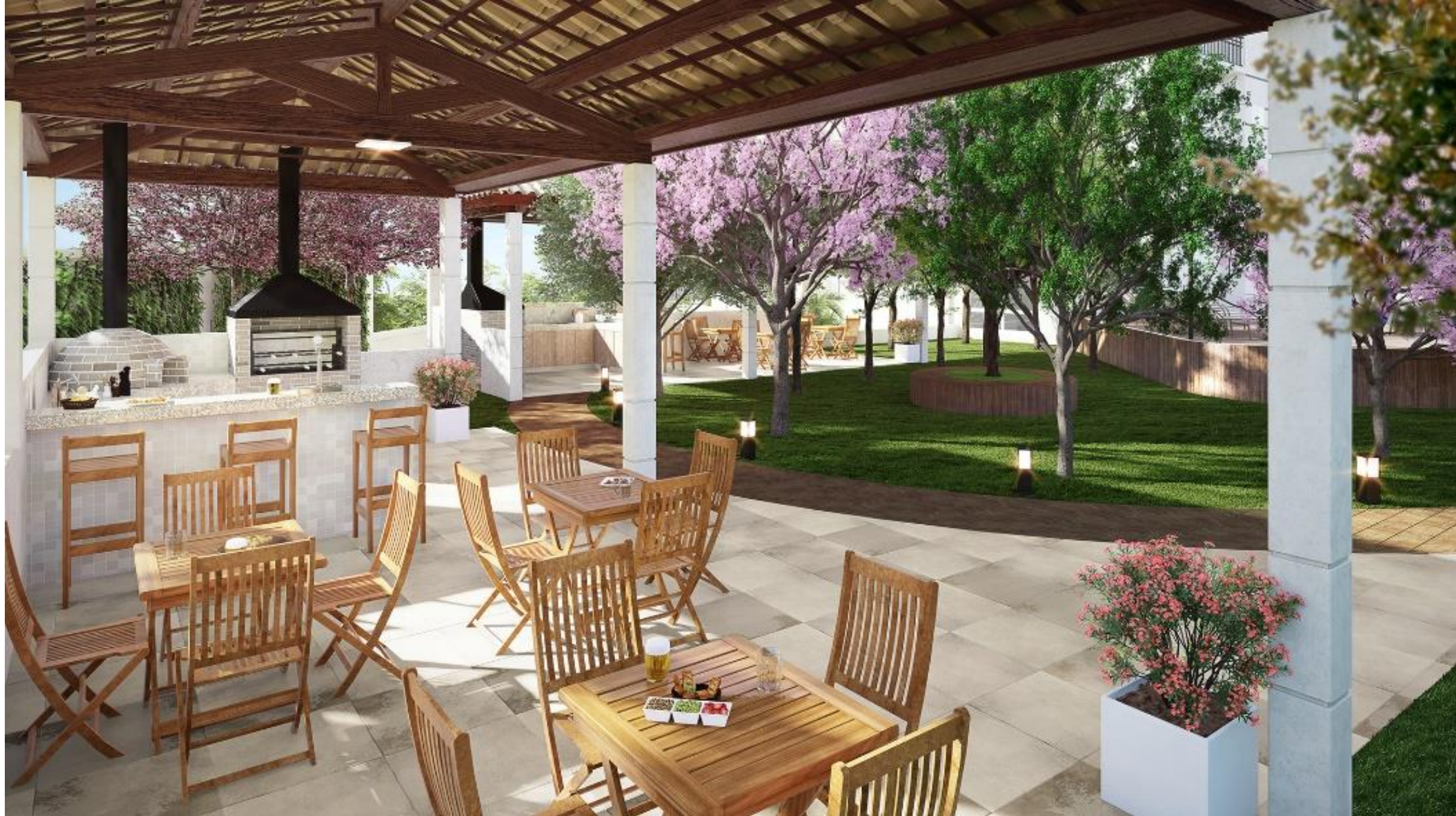
02 ESPAÇOS OPEN GOURMET INDEPENDENTES COM CHURRASQUEIRA E FORNO DE PIZZA