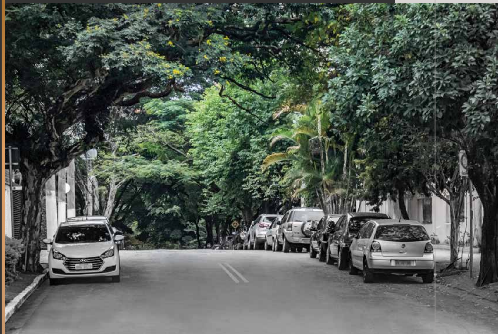
FOTO DA RUA DO EMPREENDIMENTO

Um lugar cercado de restaurantes sofisticados, alto padrão arquitetônico e marcas de luxo, um cenário completo e invejável que se revela em meio a alamedas tranquilas e charmosas.