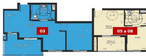
* Apto PcD - Finais 5, 6, 7 e 8 - 1º e 2º pavimento e final 3 - 1º pavimento