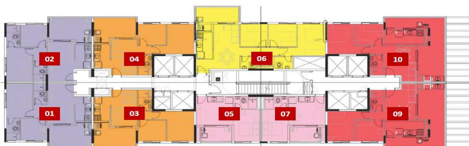
* 26º pavimento