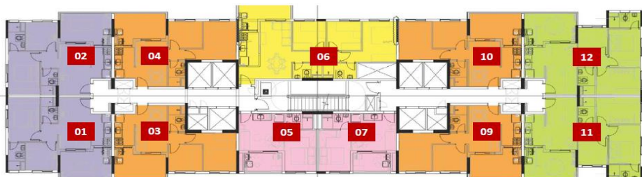
* 19º ao 24º pavimentos