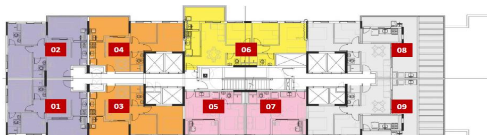
* 25º pavimento