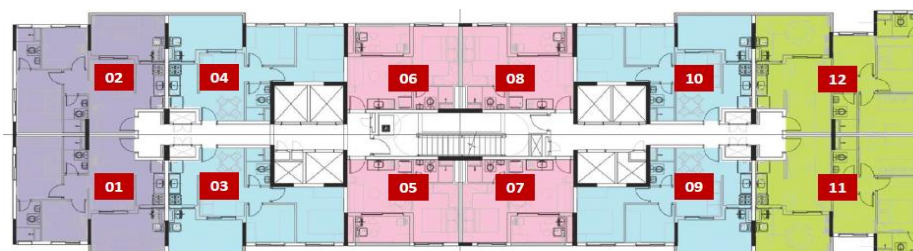
* 3º ao 18º pavimentos