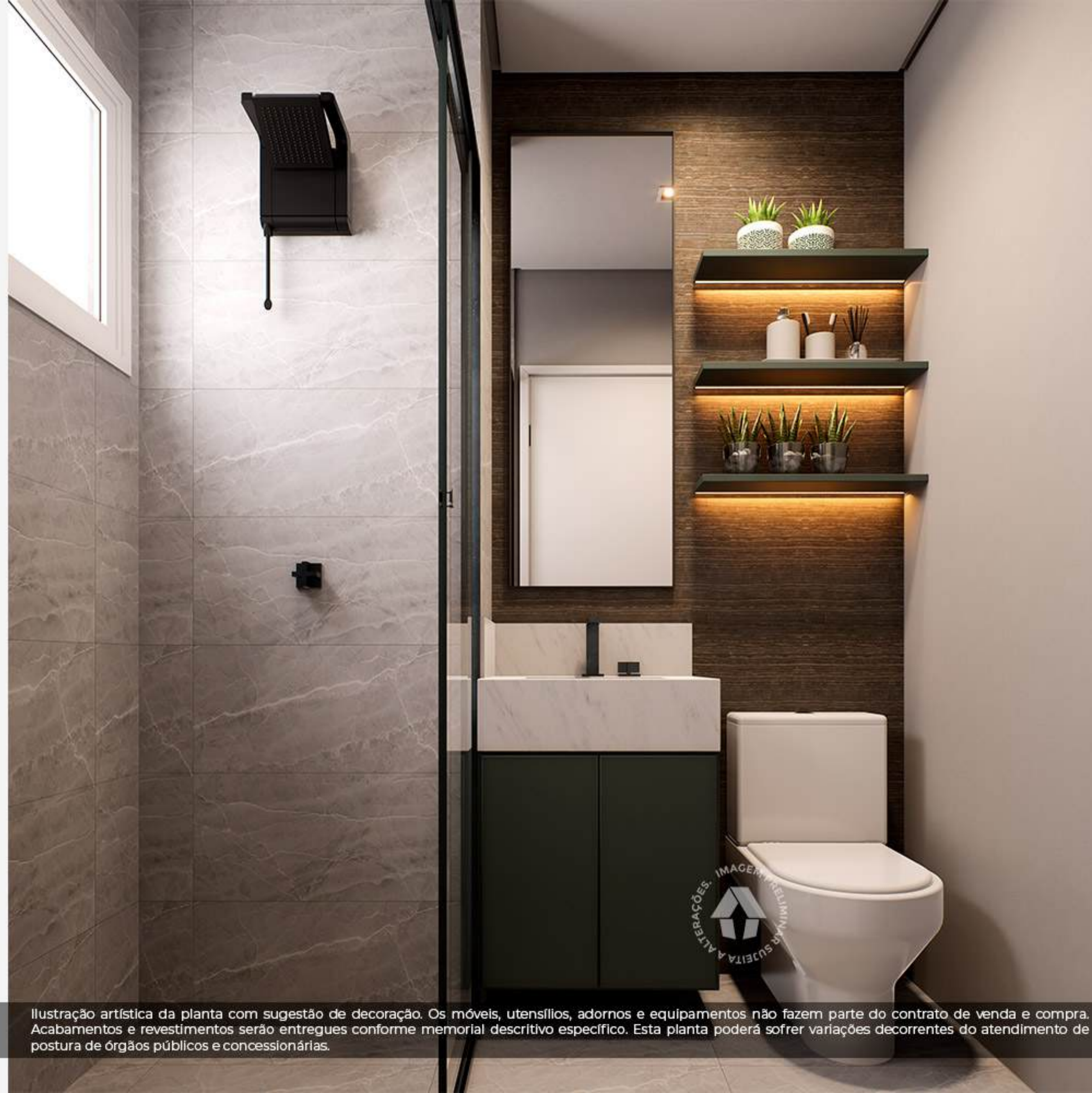
Ilustração artística da planta com sugestão de decoração. Os móveis, utensílios, adornos e equipamentos não fazem parte do contrato de venda e compra. Acabamentos e revestimentos serão entregues conforme memorial descritivo específico. Esta planta poderá sofrer variações decorrentes do atendimento de postura de órgãos públicos e concessionárias.