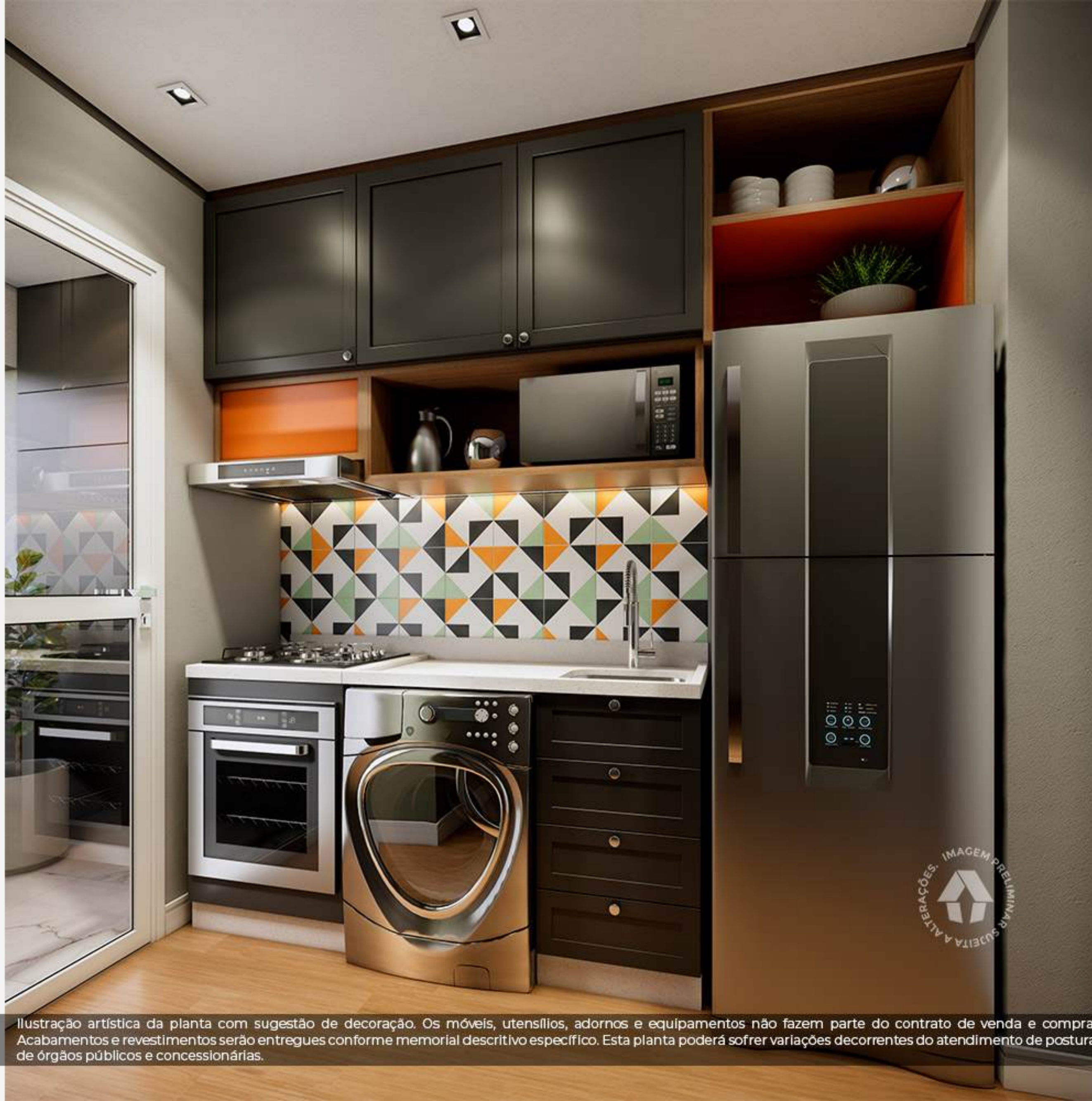
Ilustração artística da planta com sugestão de decoração. Os móveis, utensílios, adornos e equipamentos não fazem parte do contrato de venda e compra. Acabamentos e revestimentos serão entregues conforme memorial descritivo específico. Esta planta poderá sofrer variações decorrentes do atendimento de postura de órgãos públicos e concessionárias.