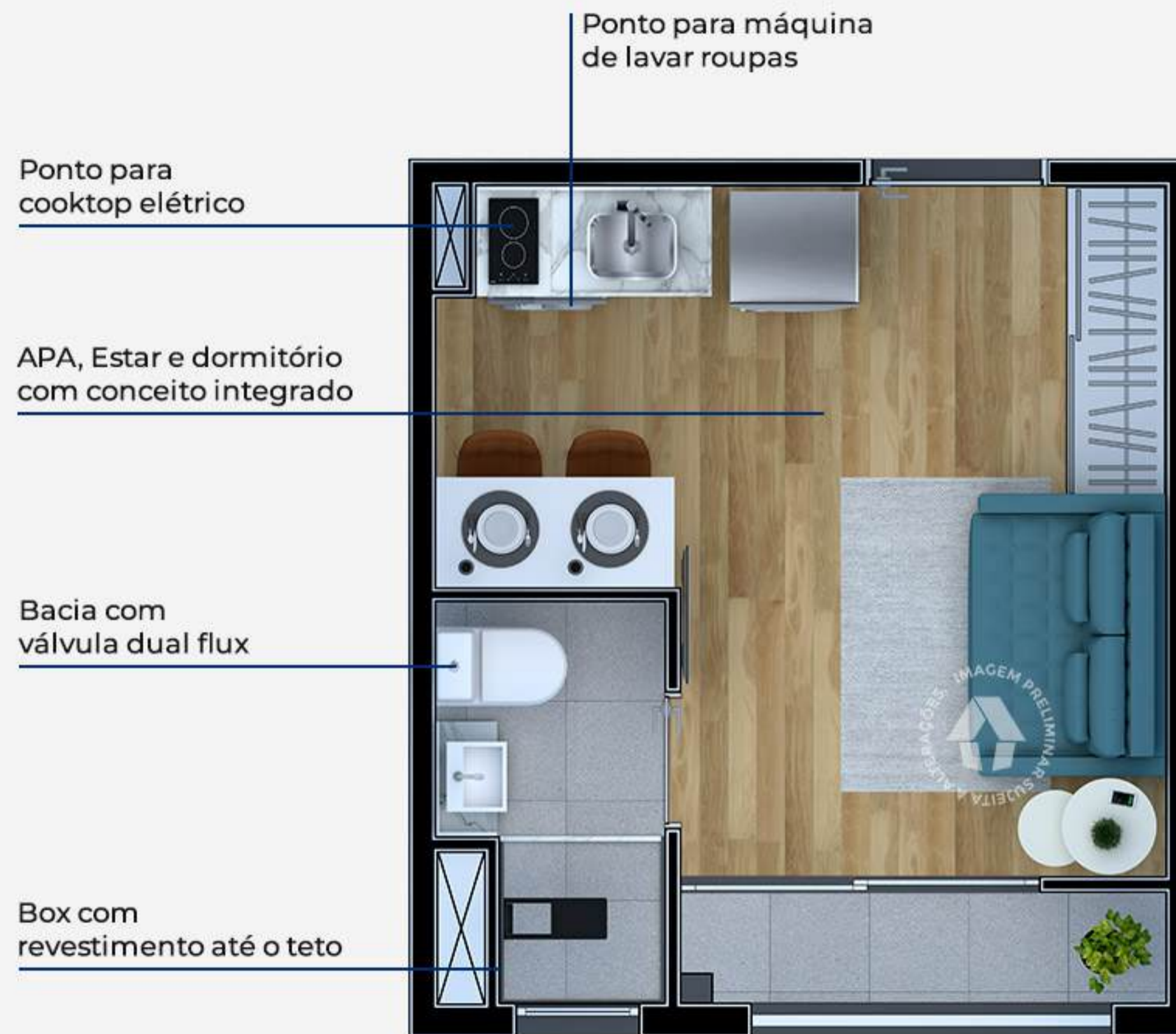
Ilustração artística da planta com sugestão de decoração. Os móveis, utensílios, adornos e equipamentos não fazem parte do contrato de venda e compra. Acabamentos e revestimentos serão entregues conforme memorial descritivo específico. Esta planta poderá sofrer variações decorrentes do atendimento de postura de órgãos públicos e concessionárias.