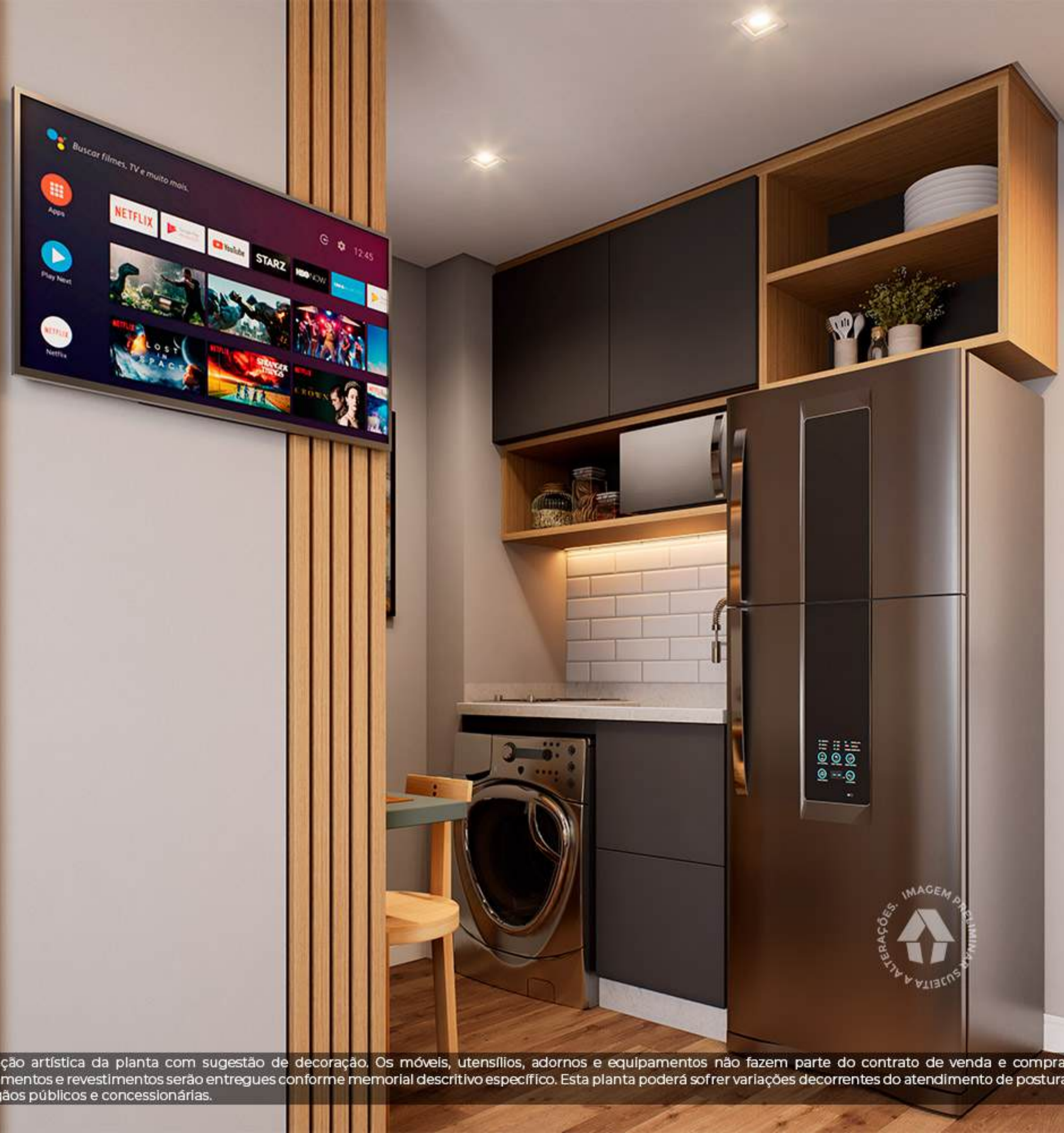
Ilustração artística da planta com sugestão de decoração. Os móveis, utensílios, adornos e equipamentos não fazem parte do contrato de venda e compra. Acabamentos e revestimentos serão entregues conforme memorial descritivo específico. Esta planta poderá sofrer variações decorrentes do atendimento de postura de órgãos públicos e concessionárias.