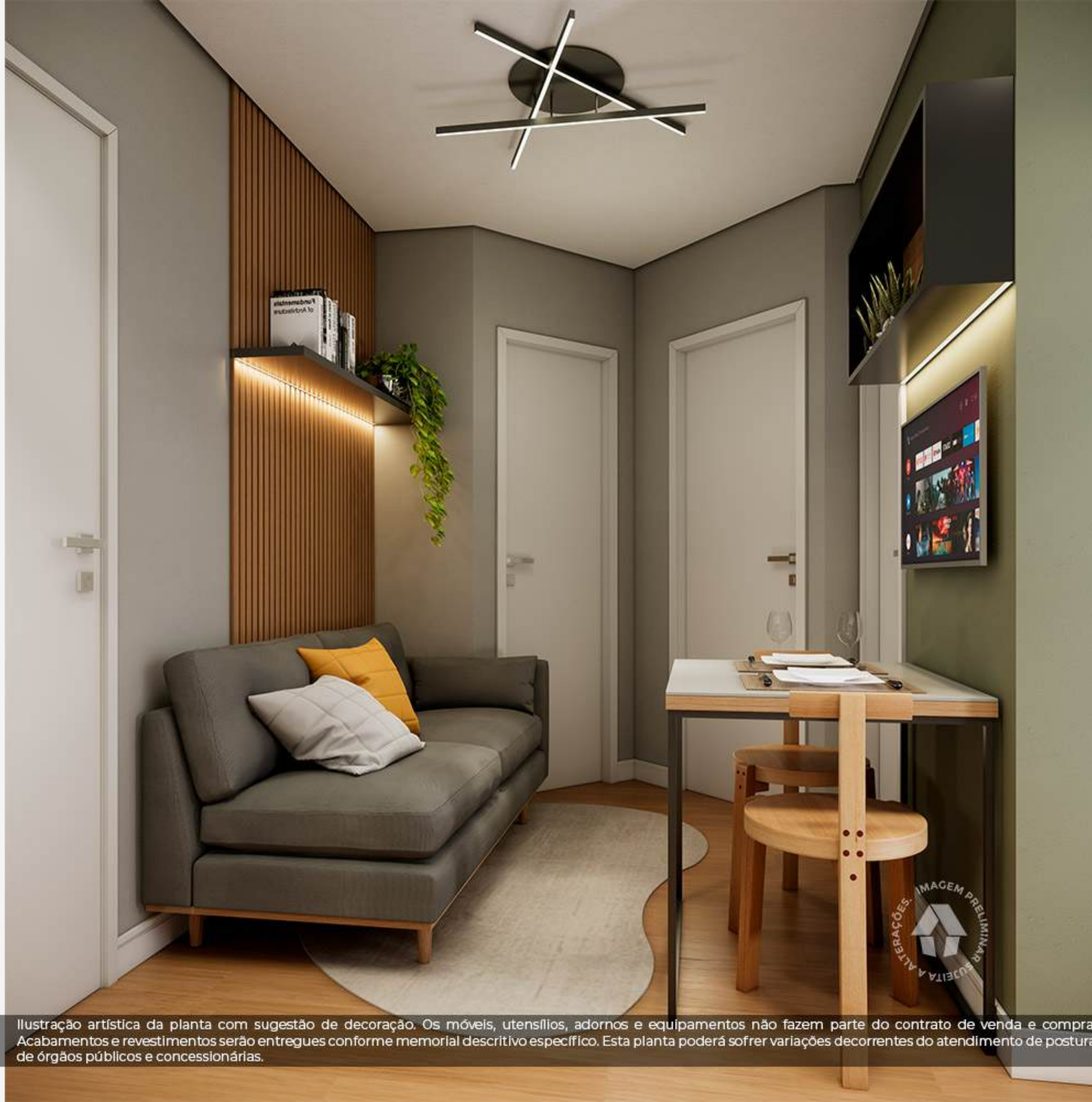
Ilustração artística da planta com sugestão de decoração. Os móveis, utensílios, adornos e equipamentos não fazem parte do contrato de venda e compra. Acabamentos e revestimentos serão entregues conforme memorial descritivo específico. Esta planta poderá sofrer variações decorrentes do atendimento de postura de órgãos públicos e concessionárias.